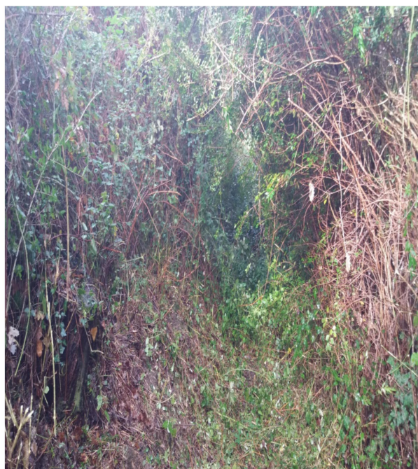
Int. 3.1.2 Pista MASCALCIA - Foto 1