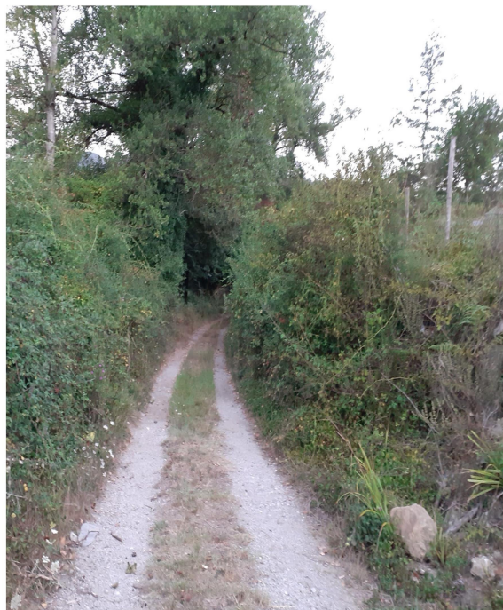
Int. 1.1.4 Fascia / COCCOVELLO - Foto 1