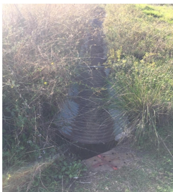
Int. 6.1.3 Canaletta FILOTO - Foto 1