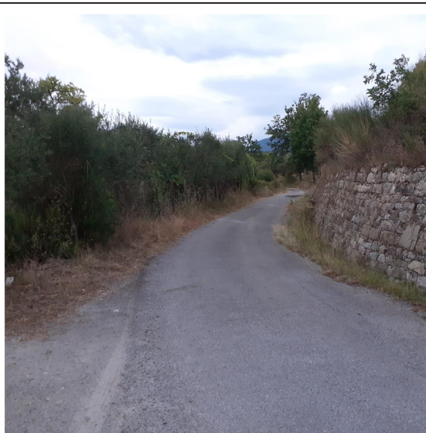
Int. 4.1.11 – Fosso ARADONICA Foto 1