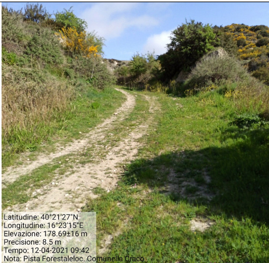
Int.3.1.2 Loc. Comunella Manutenzione pista forestale