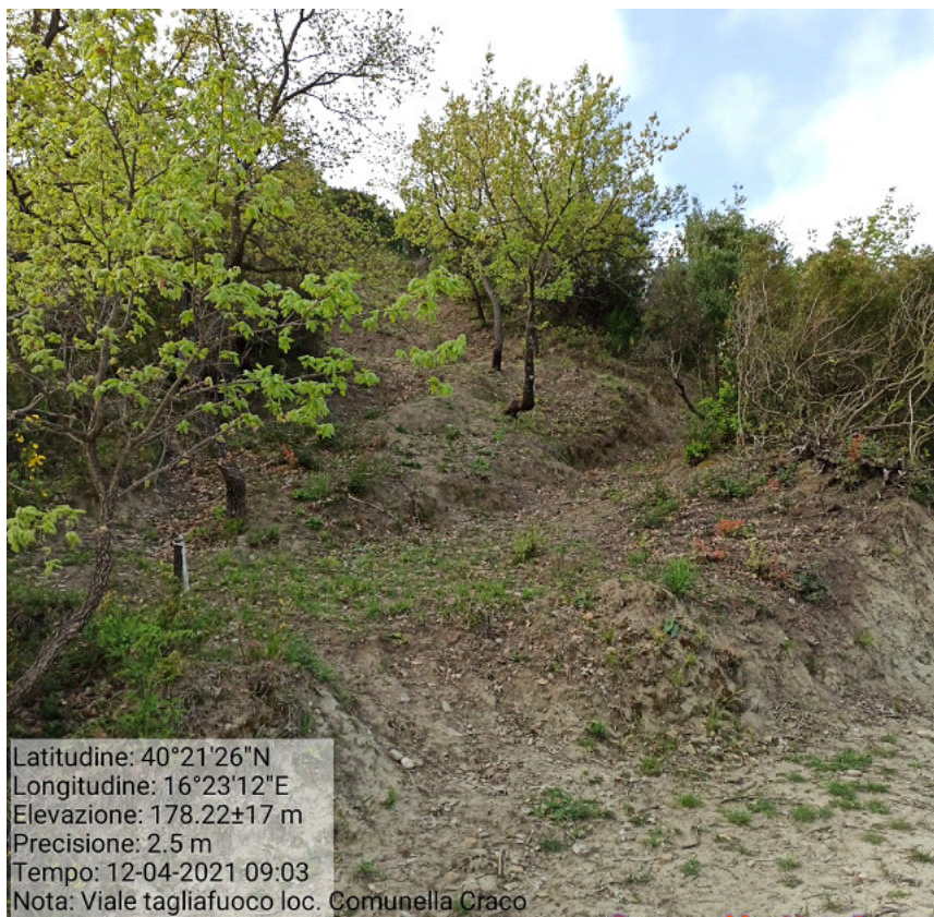
Int.1.1.2 Loc. Comunella fg.35 p.lla 3 Manutenzione viale tagliafuoco