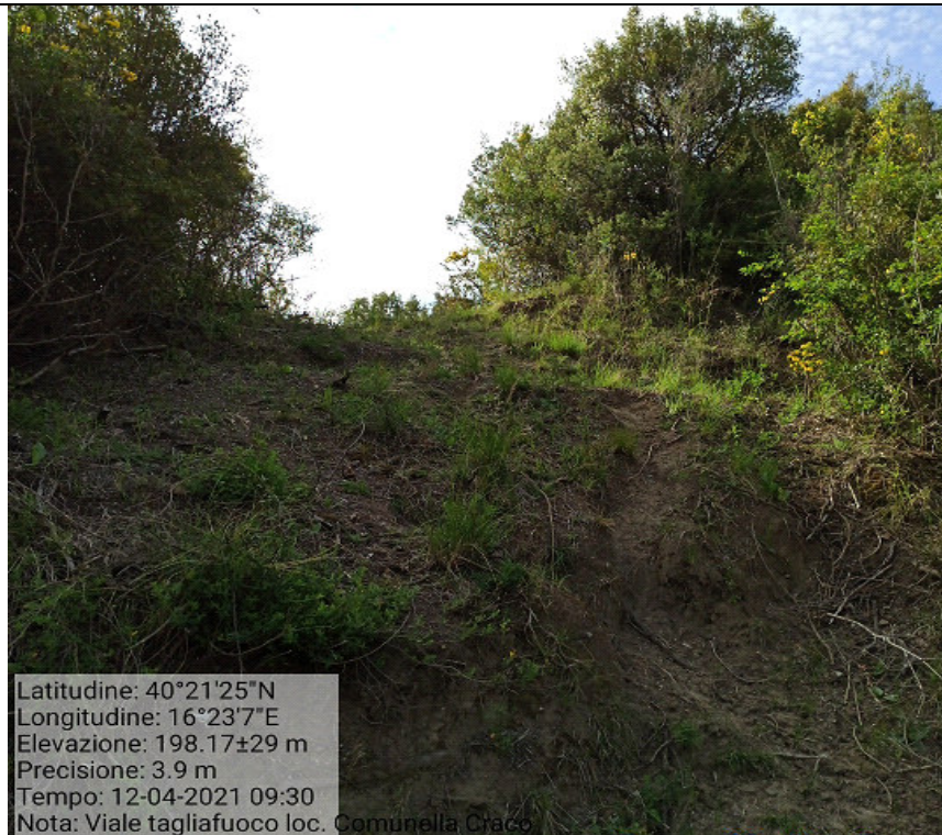
Int.1.1.1 Loc. Comunella fg.35 p.lla 3 Manutenzione viale tagliafuoco