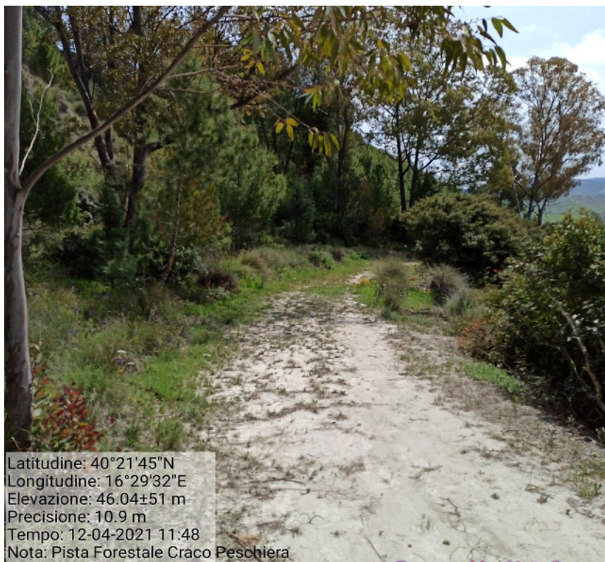
Int.3.1.1 Loc. Craco Peschiera Manutenzione pista forestale