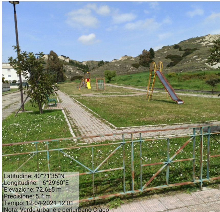
Int.2.1.1 Craco Peschiera Manutenzione verde urbano e periurbano