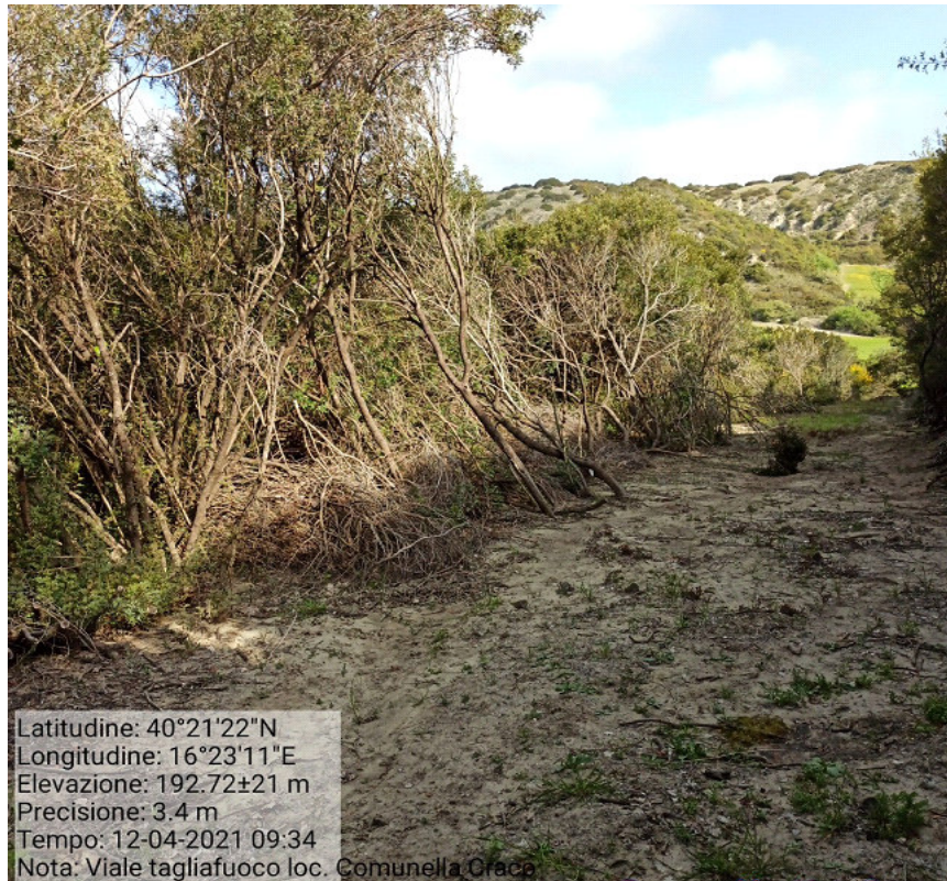
Int.1.1.3 Loc. Comunella fg.35 p.IIa 3 Manutenzione viale tagliafuoco