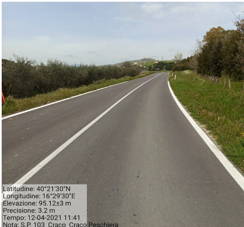
Int.5.1.1 S.P. 103 Craco Peschiera –Craco Manutenzione della viabilità