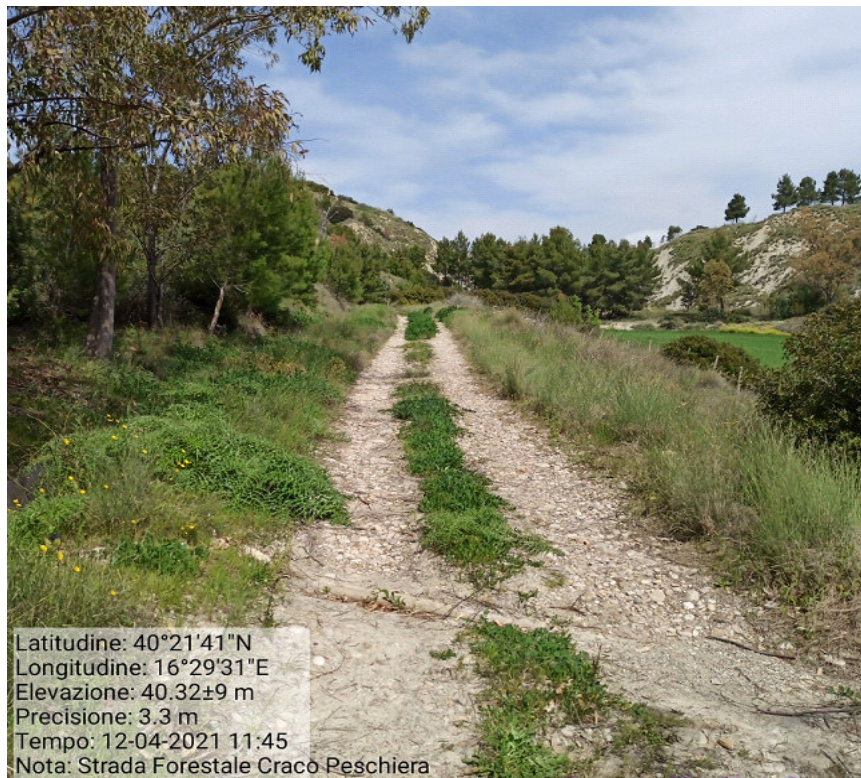
Int.3.2.1 Loc. Craco Peschiera Manutenzione strada forestale