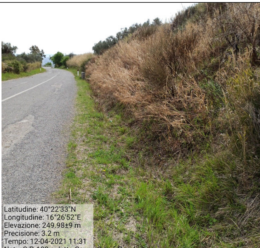
Int.5.2.1 S.P. 103 Craco Peschiera –Craco Manutenzione e pulizia cunette