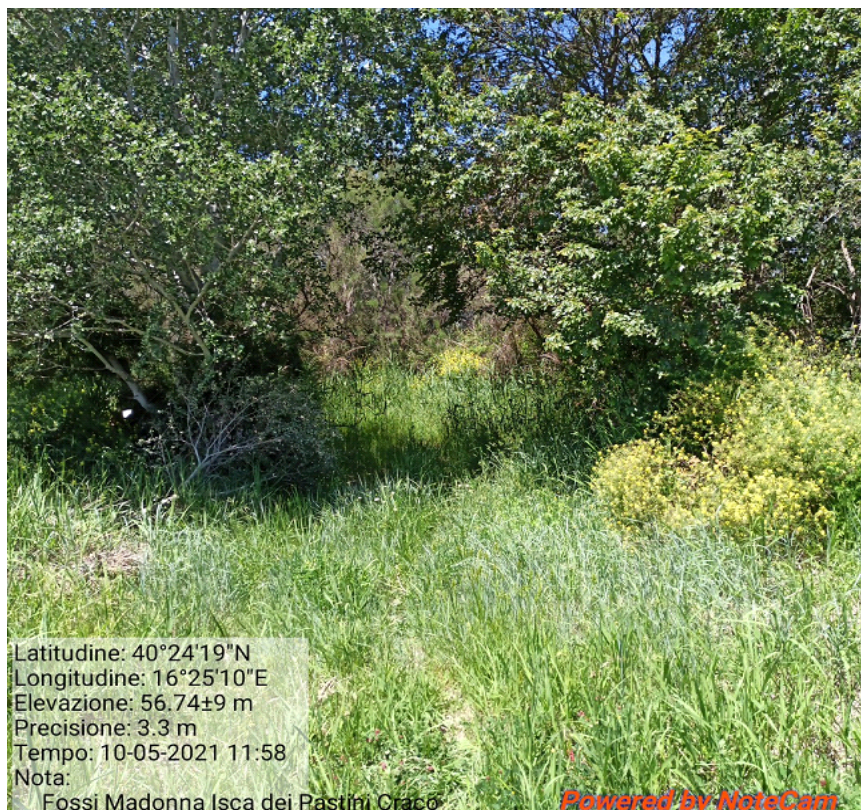
Int.4.1.3 Loc. Isca dei Pastini Fosso Madonna Manutenzione aste fluviali