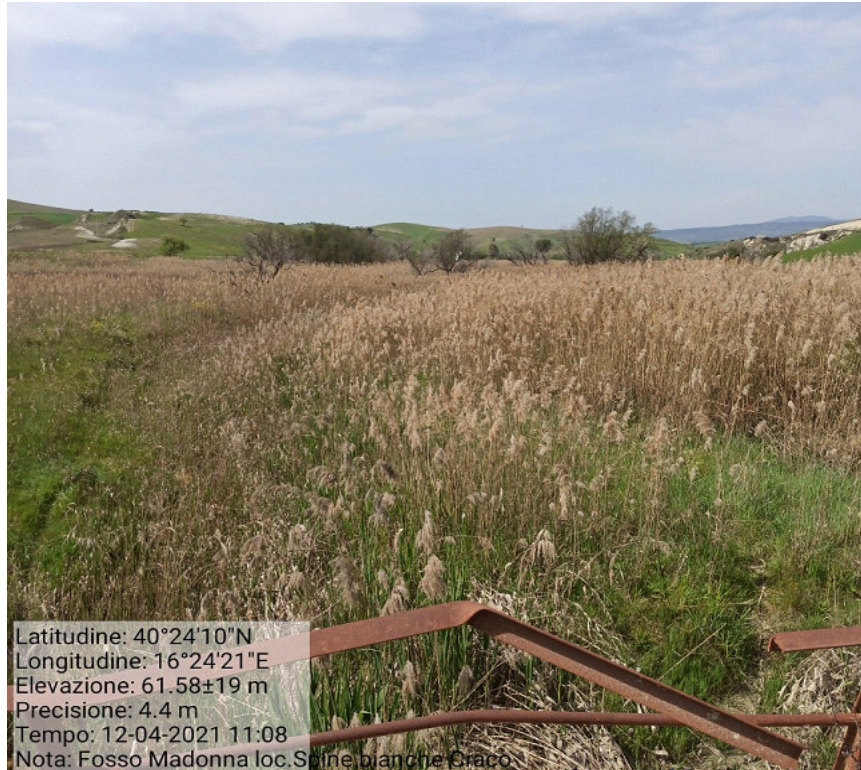
Int.4.1.2 Loc. Spine Bianche Fosso Madonna Manutenzione aste fluviali