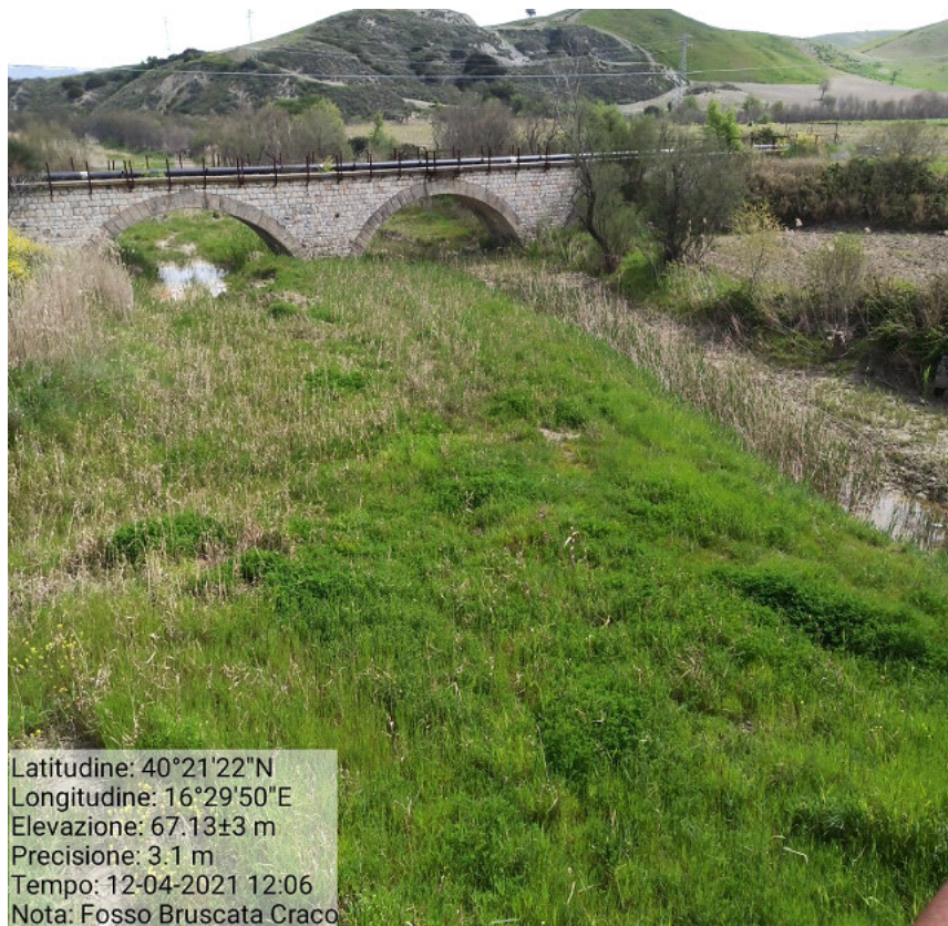
Int.4.1.1 Loc. Fosso Bruscata Manutenzione aste fluviali