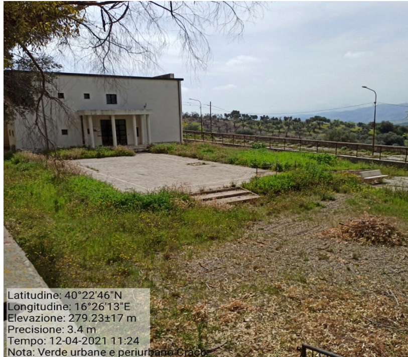
Int.2.1.1 Craco Paese Vecchio Manutenzione verde urbano e periurbano