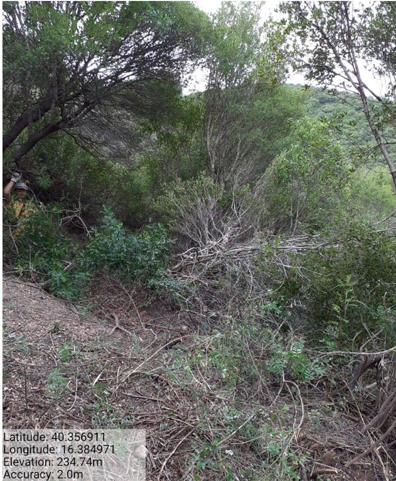
Int.7.1.1 Loc. Comunella fg. 35 p.lla 3 Miglioramento forestale decespugliamento