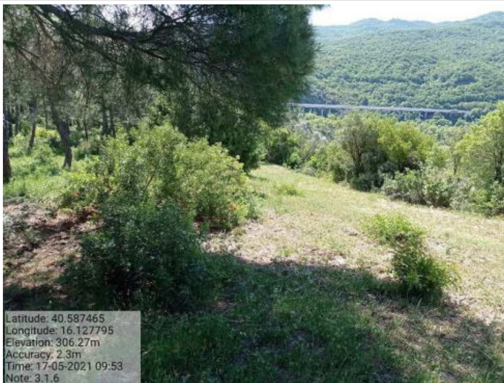
Int. 3.1.6 Tricarico Fg.77 Part. Strade - Pista di Collegamento For mantenera - Zona Malcanale