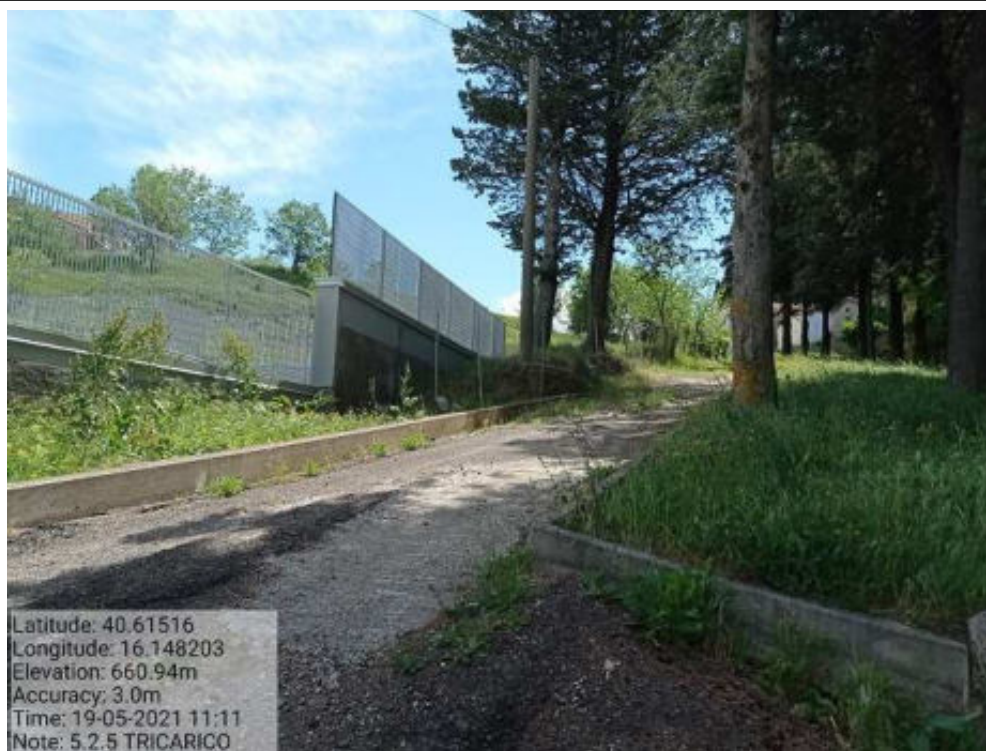
Int. 5.2.5 Tricarico Fg.64 Strada Comunale Malcanale