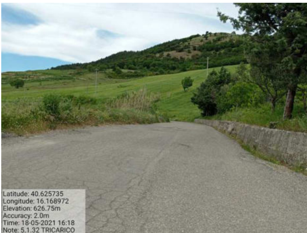
Int.5.1.32 Tricarico Fg. 55-56-37-38-48-15 Strada Comunale Caccia nella Nebbia - Foto 67