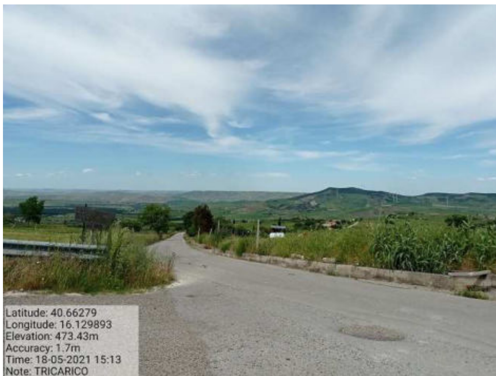
Int.3.1.9 Tricarico Fg. 11 Tratturo Comunale Cugno dei Greci - Strada Comunale S. Marco - Foto 29