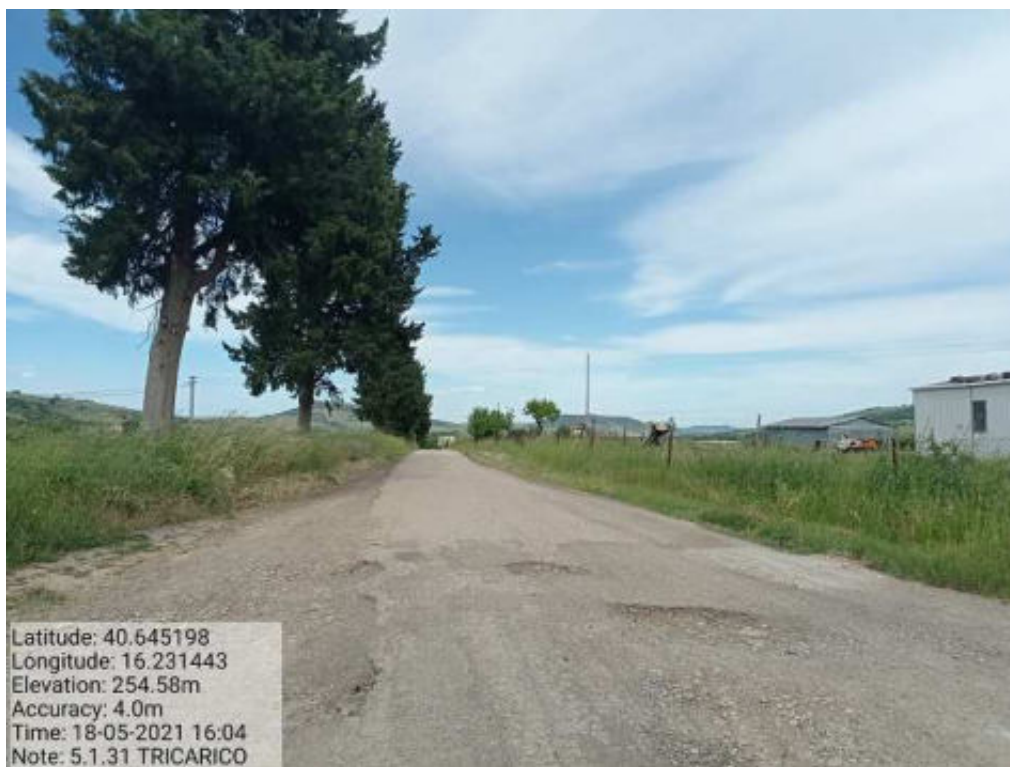
Int. 5.1.31 Tricarico Fg. 41-26 Strada Comunale Piani Sottani - Foto 66