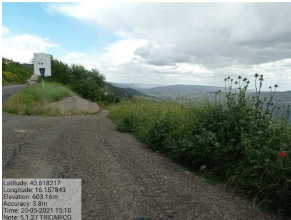
Int. 5.1.27 Tricarico Fg . 66 Strada Comunale Caprina Foto 62