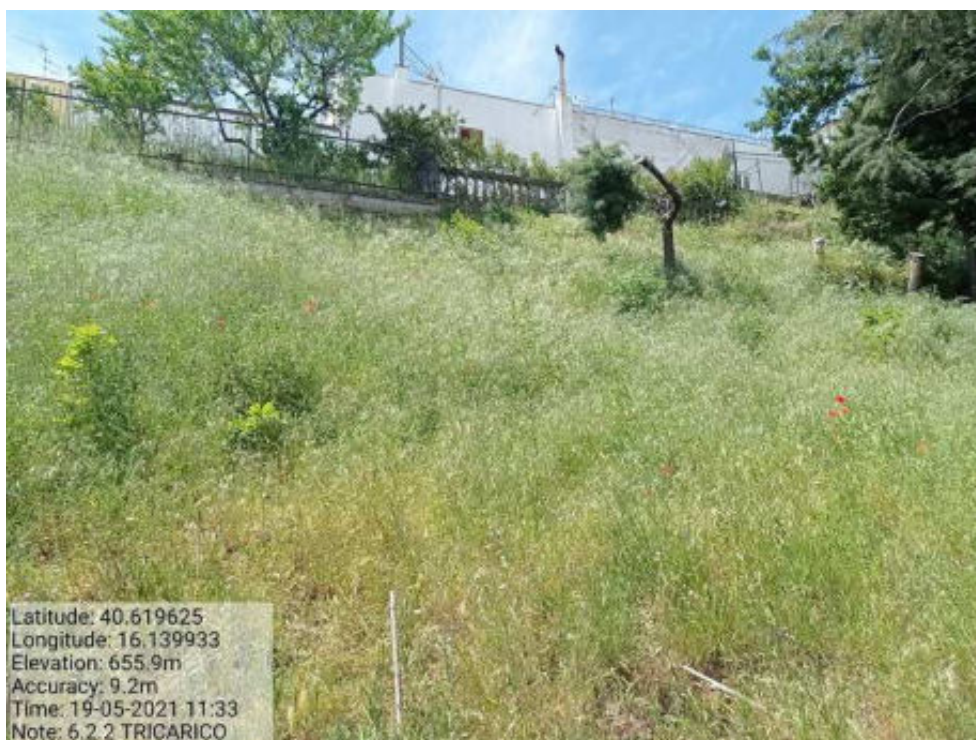
Int. 6.2.2 Tricarico Fg.60 Part.300 - 1103 Via Don Pancrazio Toscano - Foto 77