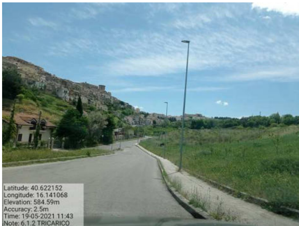
Int. 6.1.2 Tricarico Fg.60 part.869-320- 347-348 Zona Campo Sportivo Nuovo - Foto 75