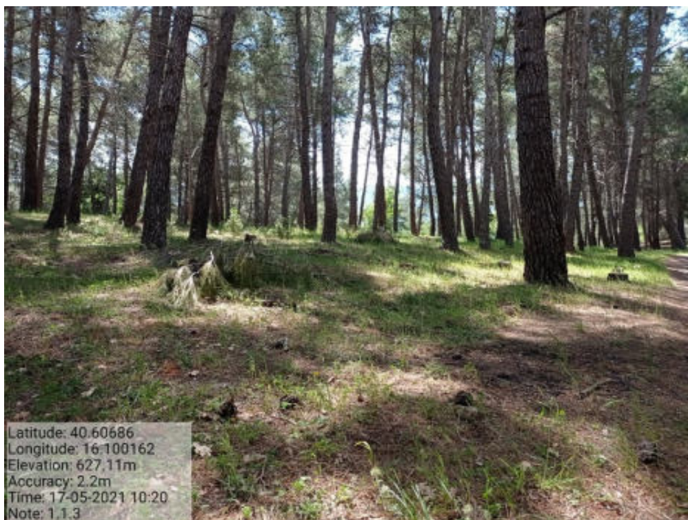
Intervento 1.1.3 - Tricarico Fg.62 part.125- 139-70 Loc. Mantenera Malcanale - Capanna vendetta