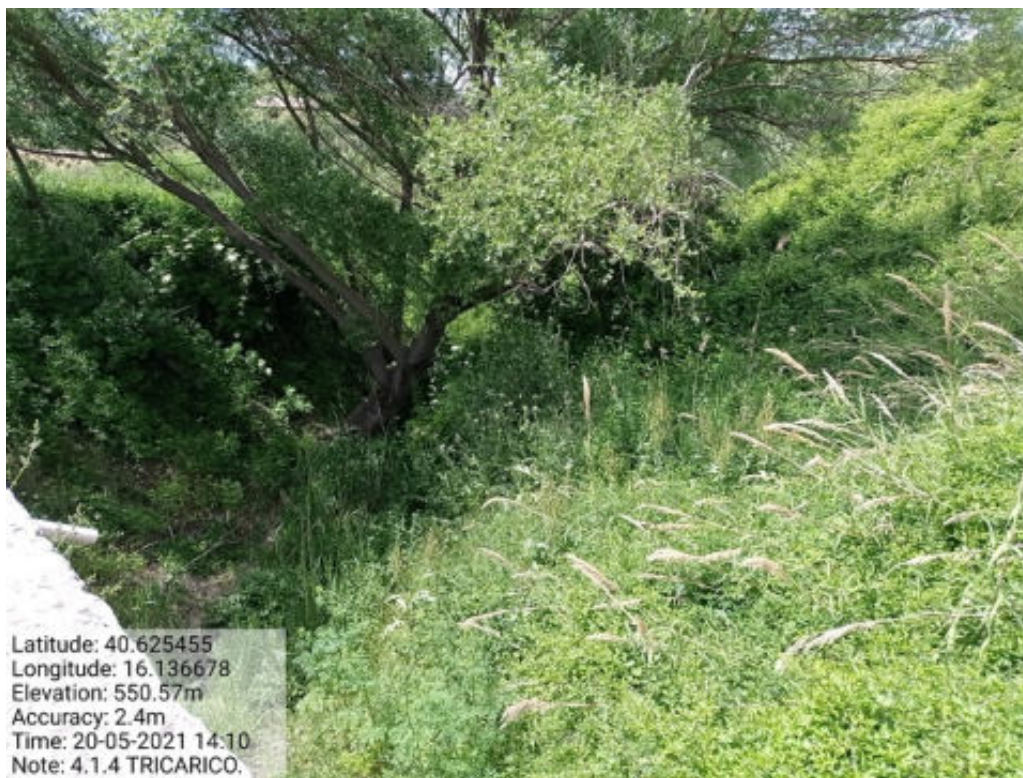
Int. 4.1.4 Tricarico Fg.47 Part.Acque TORRENTE CACARONE TRATTO 3