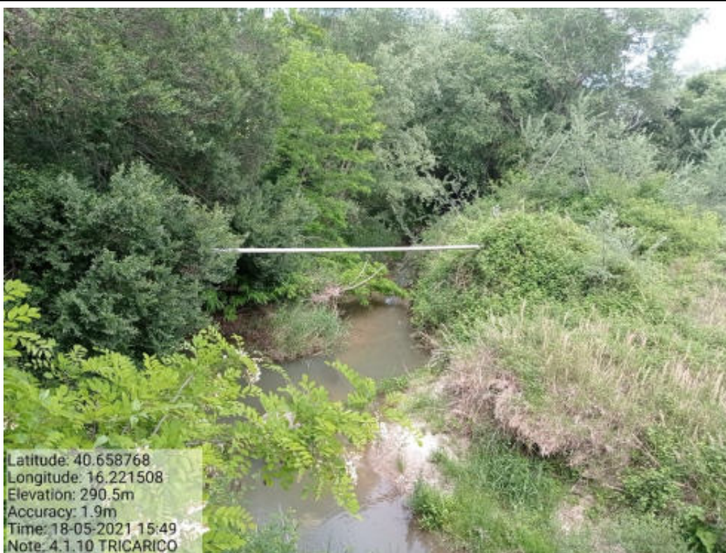
Int. 4.1.10 Tricarico Fg.61 Part.Acque e 204 TORRENTE BILIOSO Foto 40