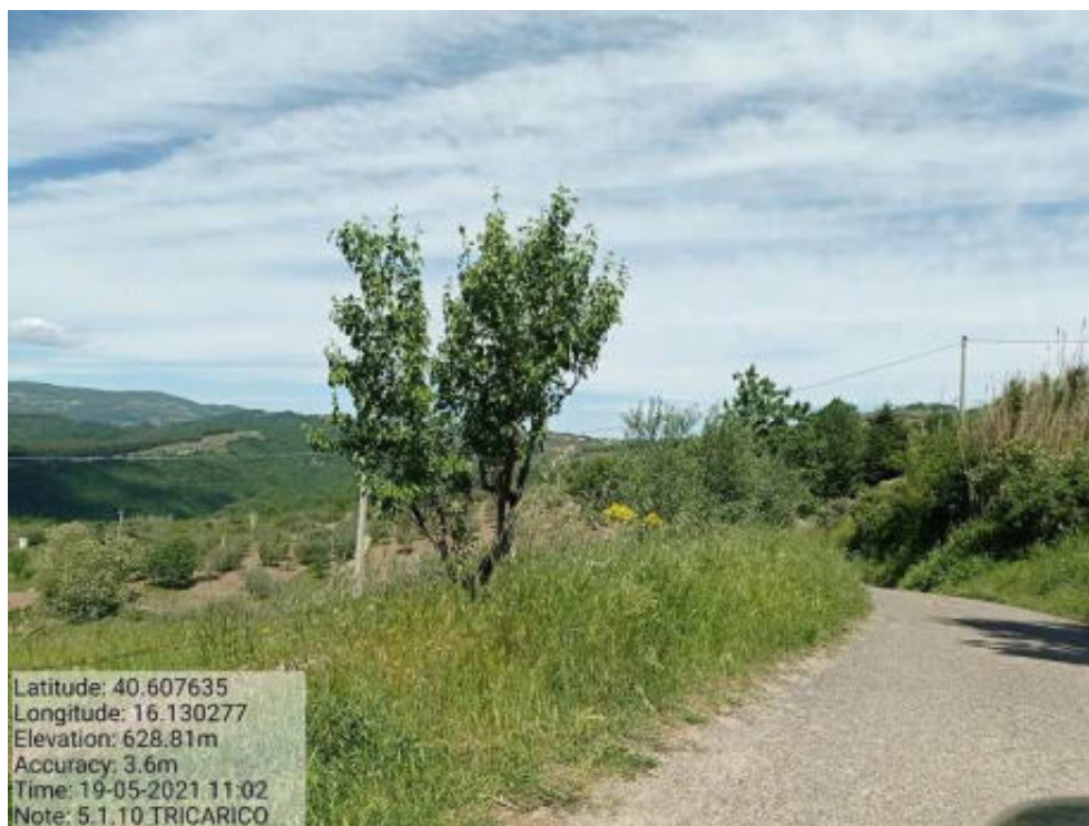
Int. 5.1.10 Tricarico Fg.54 Strada Comunale Malcanale 7 Foto 50