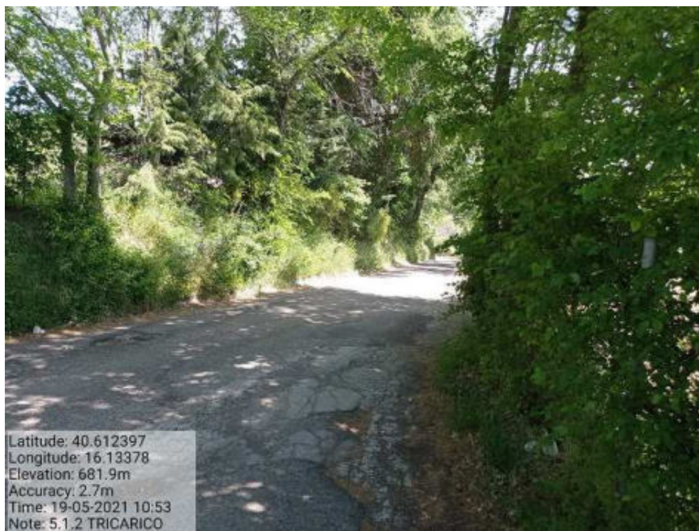
Int. 5.1.2 Tricarico F.64 Strada Comunale Malcanale 1