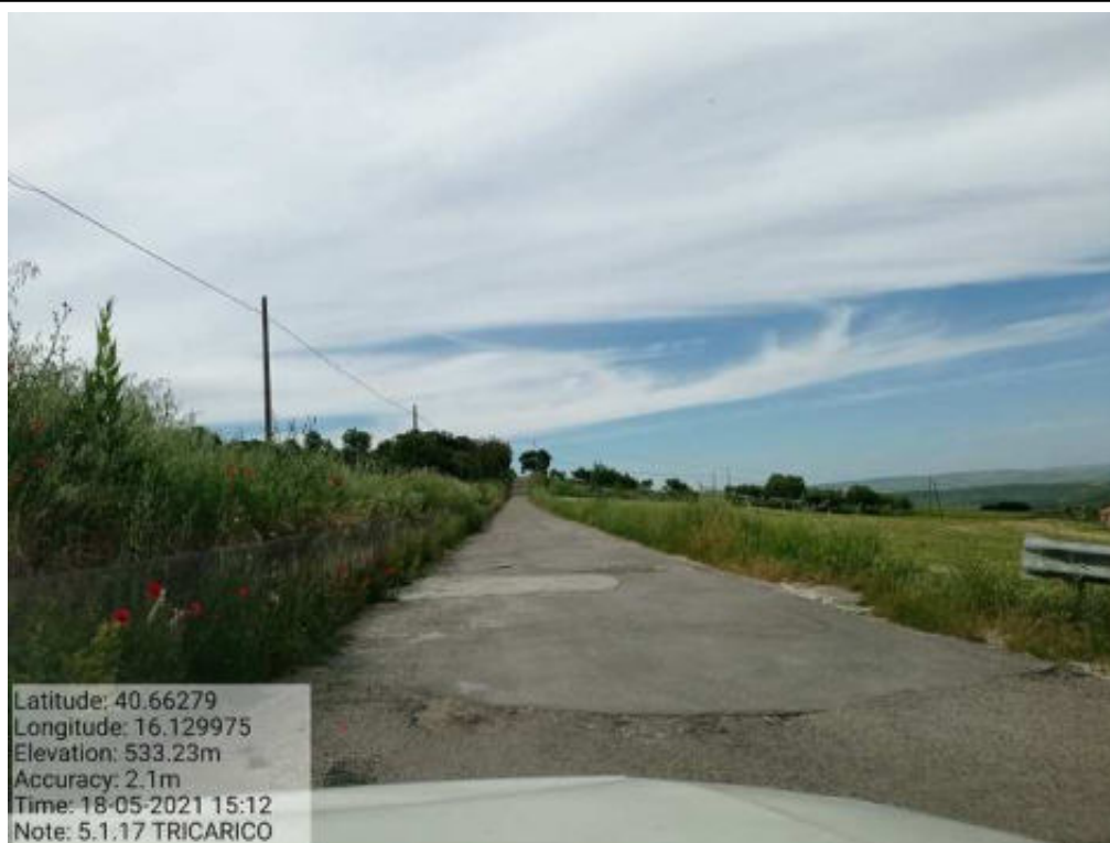
Int. 5.1.17 Tricarico Fg-12 Strada Comunale San Marco