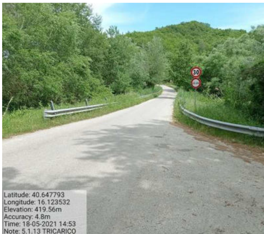
Int. 5.1.13 Tricarico Fg. 46-45-33-34-11-12-4 Strada Comunale Albanello-Cucno della Pica - Foto 53