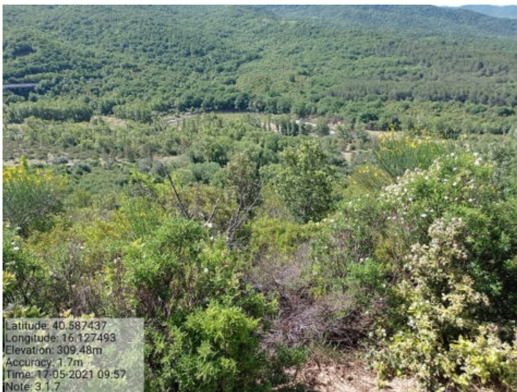
Int.3.1.7 Tricarico Fg.77 part.78 Foresta mantenera - Fosso Malcanale