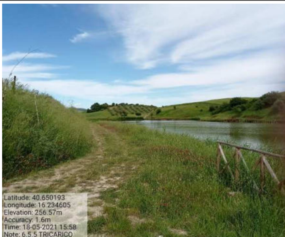
Int. 6.5.5 Tricarico F.41 part.31 Lago Piani Sottani