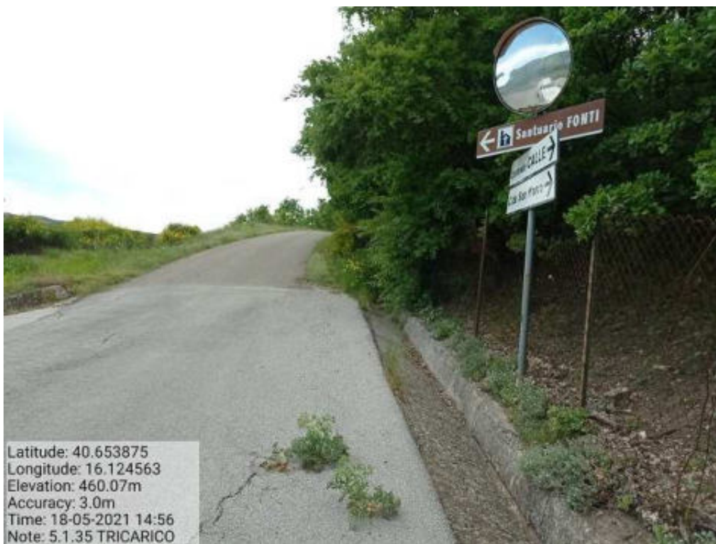
Int.5.1.35 Tricarico Fg. 16-19-20-31-32-42 Strada Comunale Trionte Foto 70