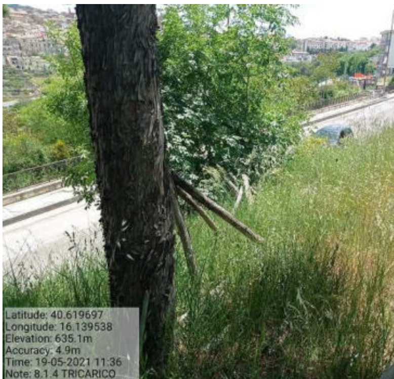
Int.8.1.4 Tricarico Fg.62 Part strade Villetta Ilario - Foto 101