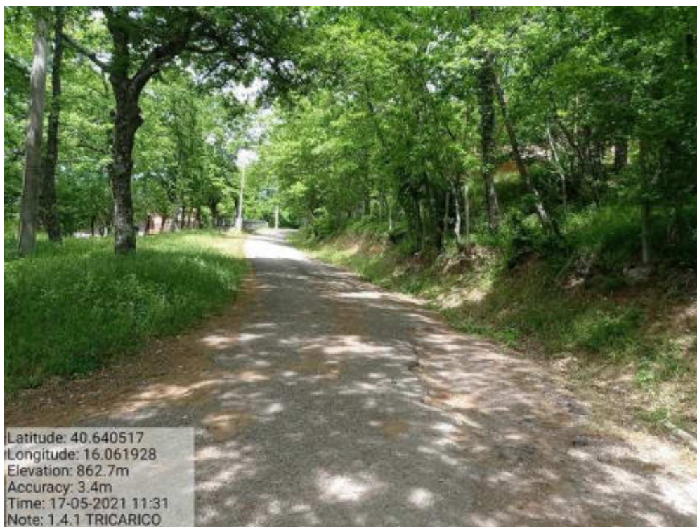
Int. 1.4.1 Tricarico Fg.42 part.242 Loc. Trecancelli