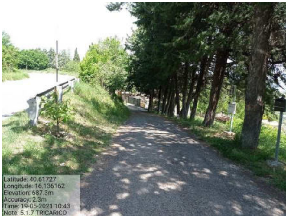
Int. 5.1.7 Tricarico Fg.60 Strada Comunale San Martino - Foto 47