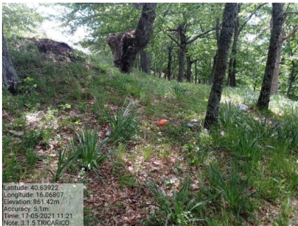
Int. 3.1.5 Tricarico Fg.42 part.182 Bosco Fonti Cugno del Bosco - Foto 25