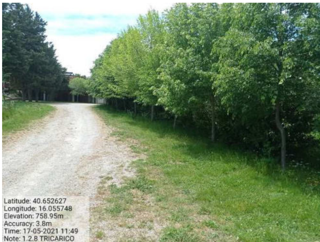
Int. 1.2.8 Tricarico_Fg.50 Part.168 Loc.Fonti perimetro Santuario