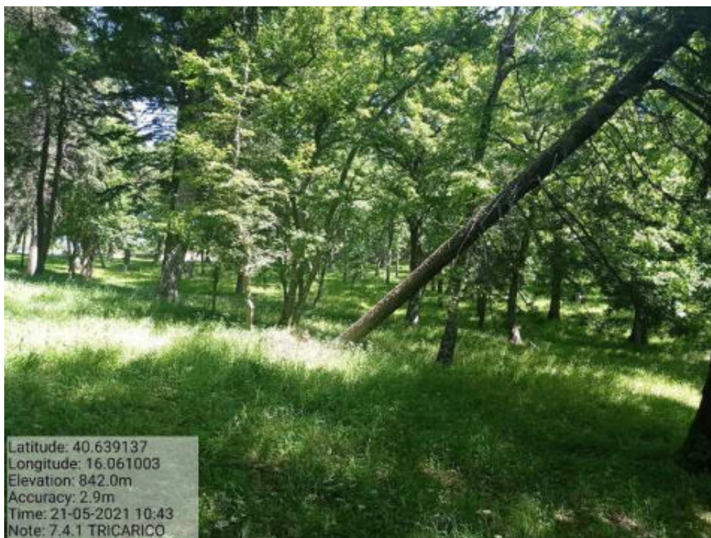
Int. 7.4.1 Tricarico Fg.50 part.171 Bosco Trecancelli - Foto 96