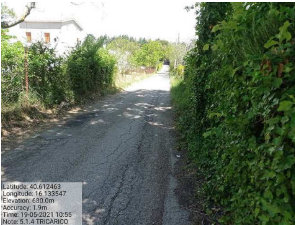
Int. 5.1.4 Tricarico fg.64-74 strada comunale Malcanale 3 Foto 44