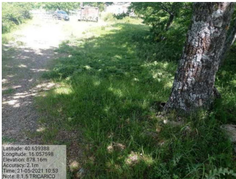
Int. 8.1.5 Tricarico Fg. 50 Trecancelli