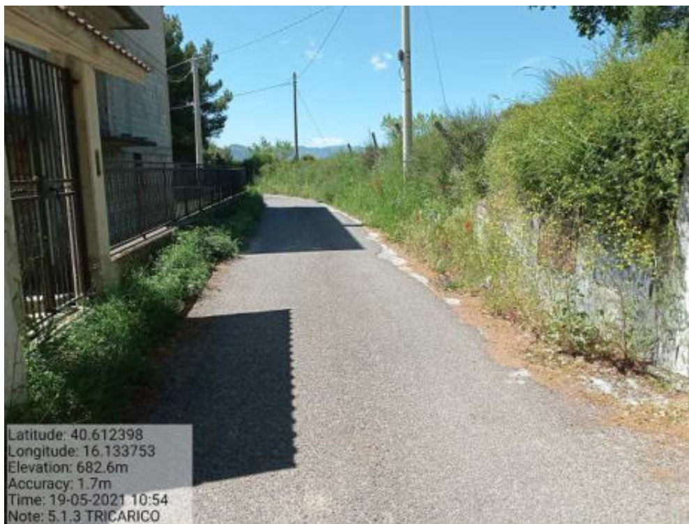
Int.5.1.3 - Foto 43