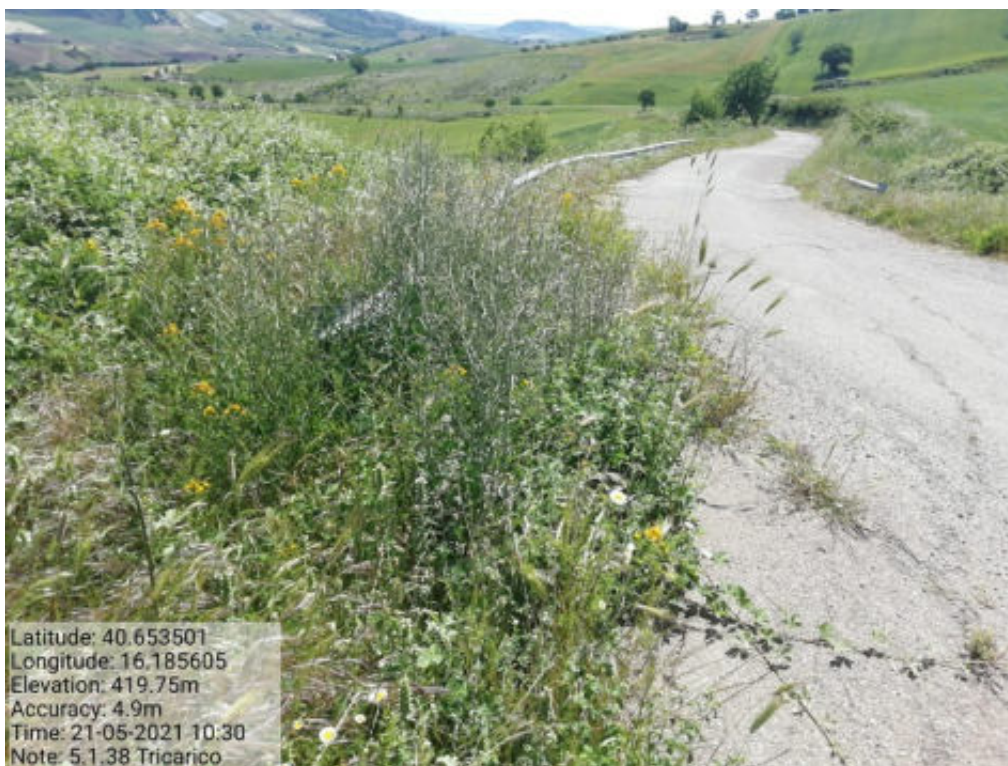
Int. 5.1.38 Tricarico Fg.38 Part.143 e Strade - Strada Comunale Pantano di Volpe