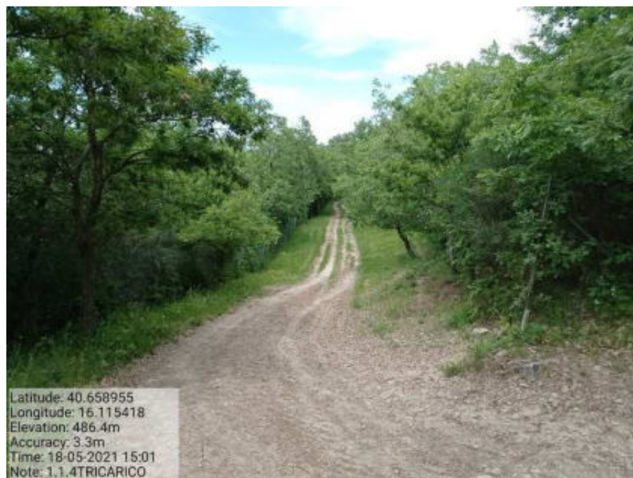
Intervento 1.1.4 Tricarico Fg.11 part.1 Loc. Cugno della Pica Foto 4