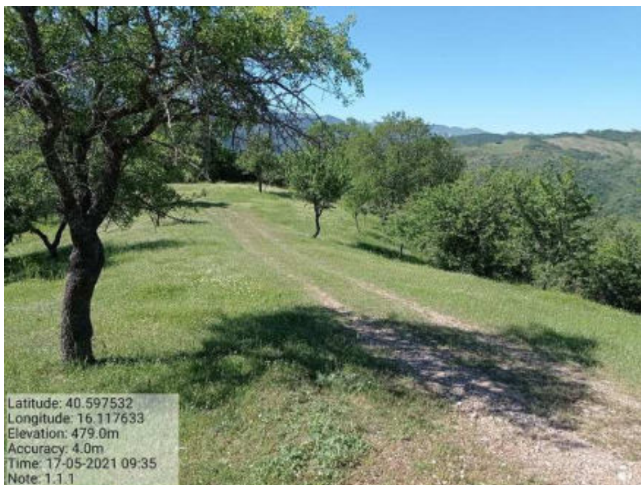
Tricarico Fg.77 part.22-24- 20-79-133-80 Loc. Mantenera Malcanale -