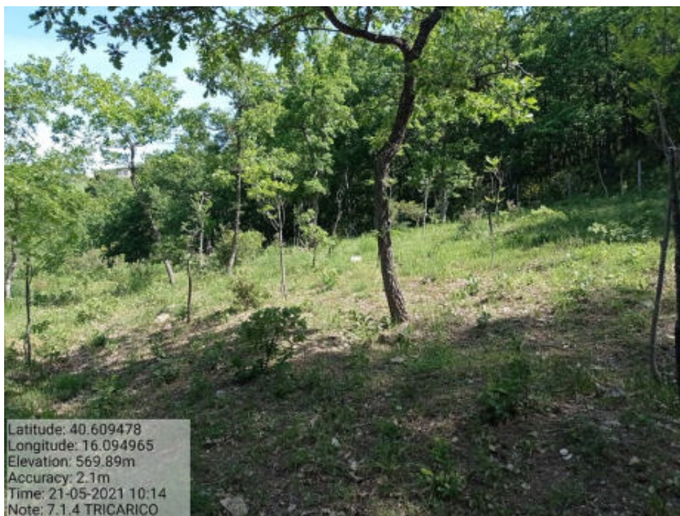
Int. 7.1.4 Tricarico Fg.62 part.42 Bosco Mantener - Foto 89