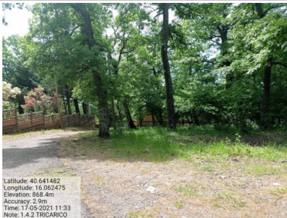
Int. 1.4.2 Tricarico Fg.42 part.242 Loc.Trecancelli (strada interna trecancelli diramazione)