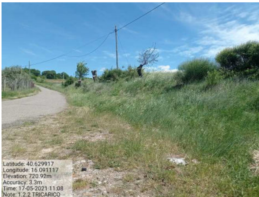
Intervento 1.2.2 Tricarico Fg.42 Part.184 e Fg.43 part.9 Loc.Trecancelli- Masseria Carbonara