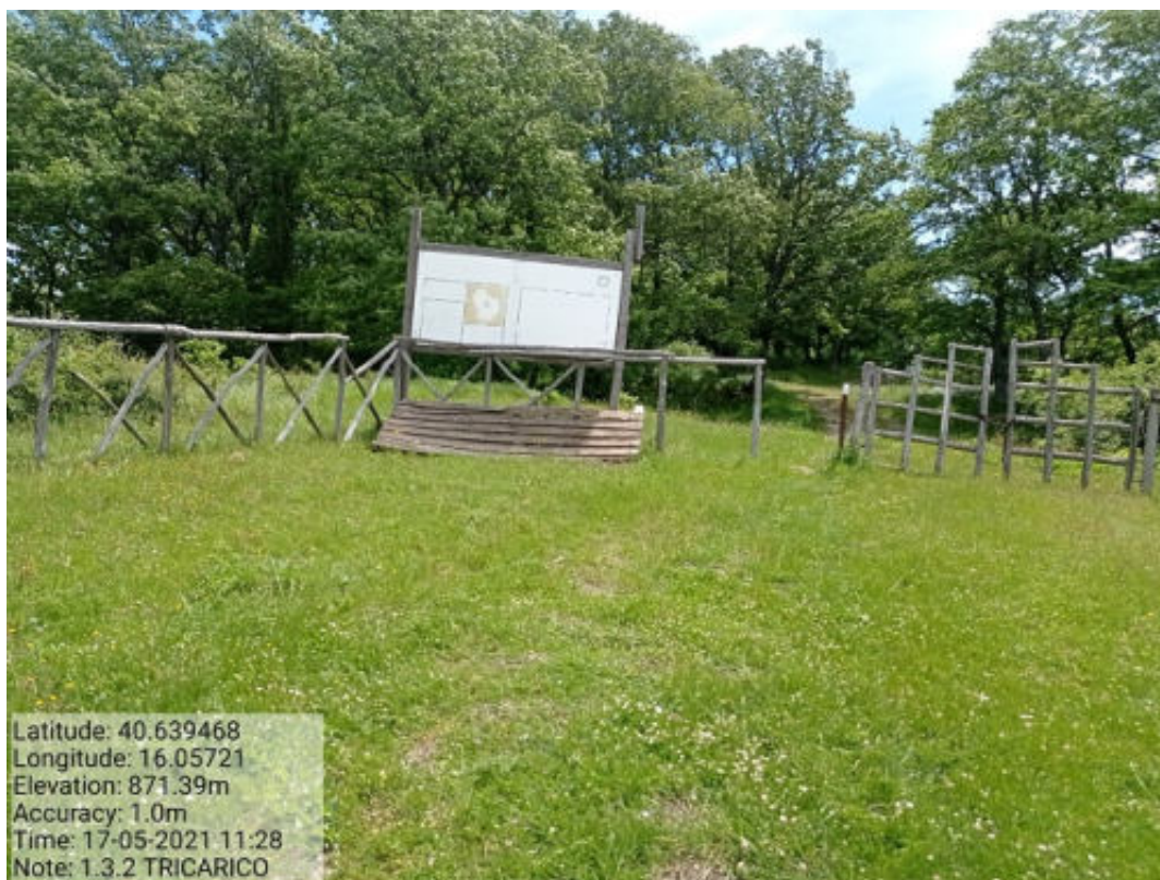
Int.1.3.2 Tricarico Fg.50 part.171-7- 41-43-61-50-55 Loc.Trecancelli -Civita (sito archeologico) -Foto 14