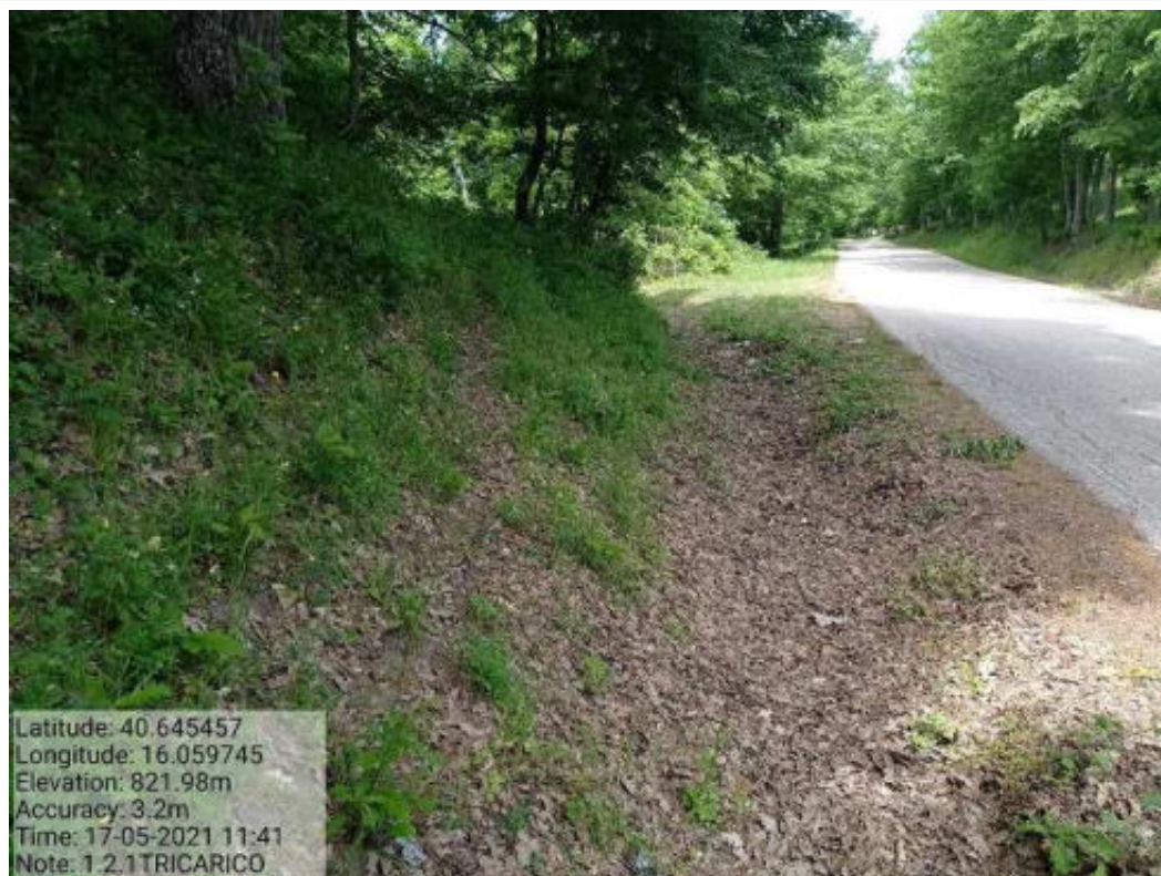
Intervento 1.2.1 Tricarico Fg.42 Part.184 Loc.Trecancelli-