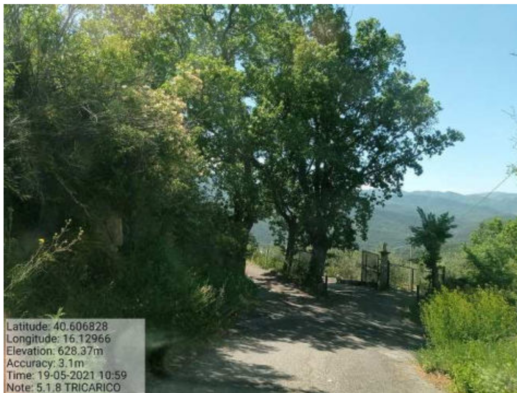
Int. 5.1.8 Tricarico Fg.64 Strada Comunale Malcanale 6 Foto 48