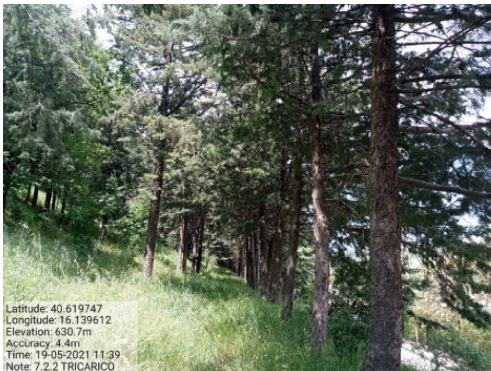
Int. 7.2.2 Tricarico Fg.60 Part.300 - 1103 Via Don Pancrazio Toscano - Foto 91