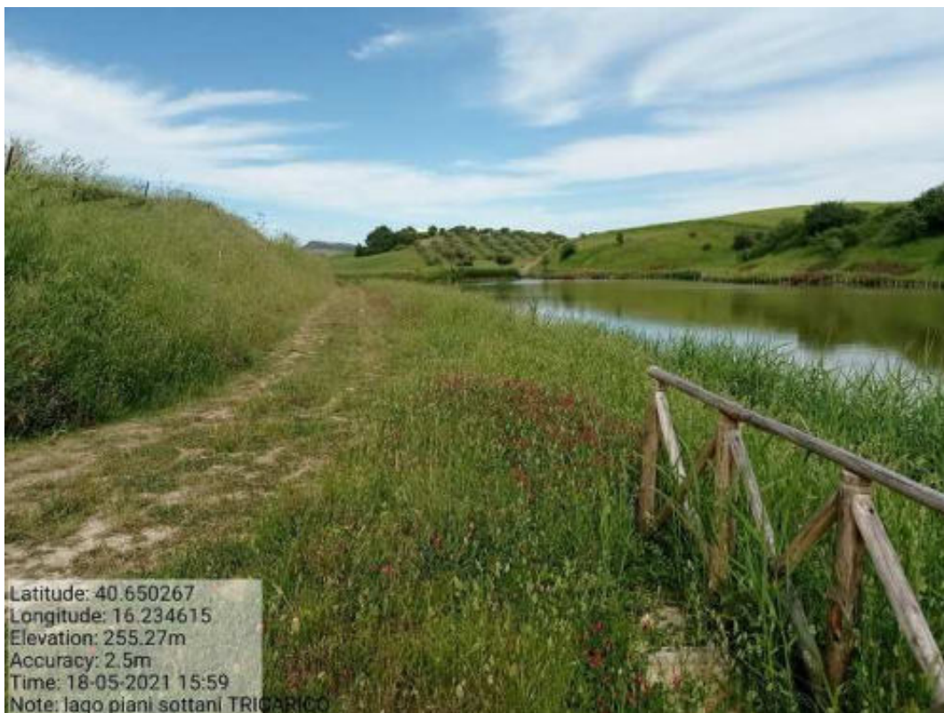
Int. 8.1.1 Tricarico Fg.41 part.31 Lago Piani Sottani - Foto 98