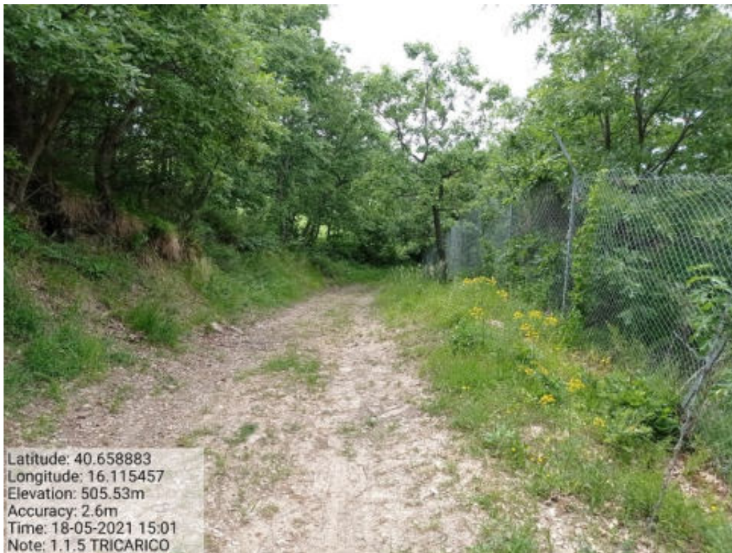
Intervento 1.1.5 Tricarico Fg.11 part.1-27 Loc. Vallone San Chirico