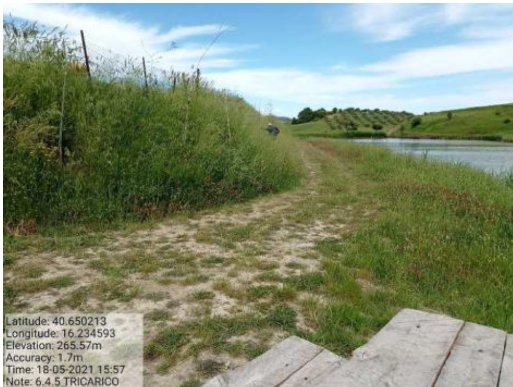
Int. 6.4.5 Tricarico F.41 part.31 Lago Piani Sottani