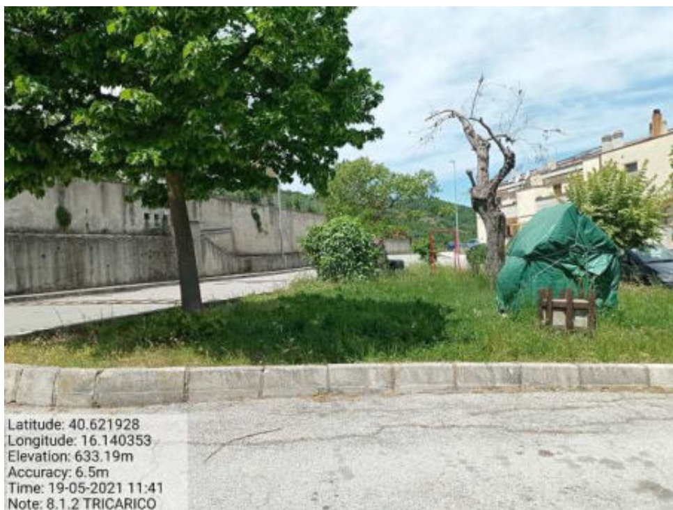
Int.8.1.2 Tricarico Fg.62 Part strade Rione Carmine - Foto 99