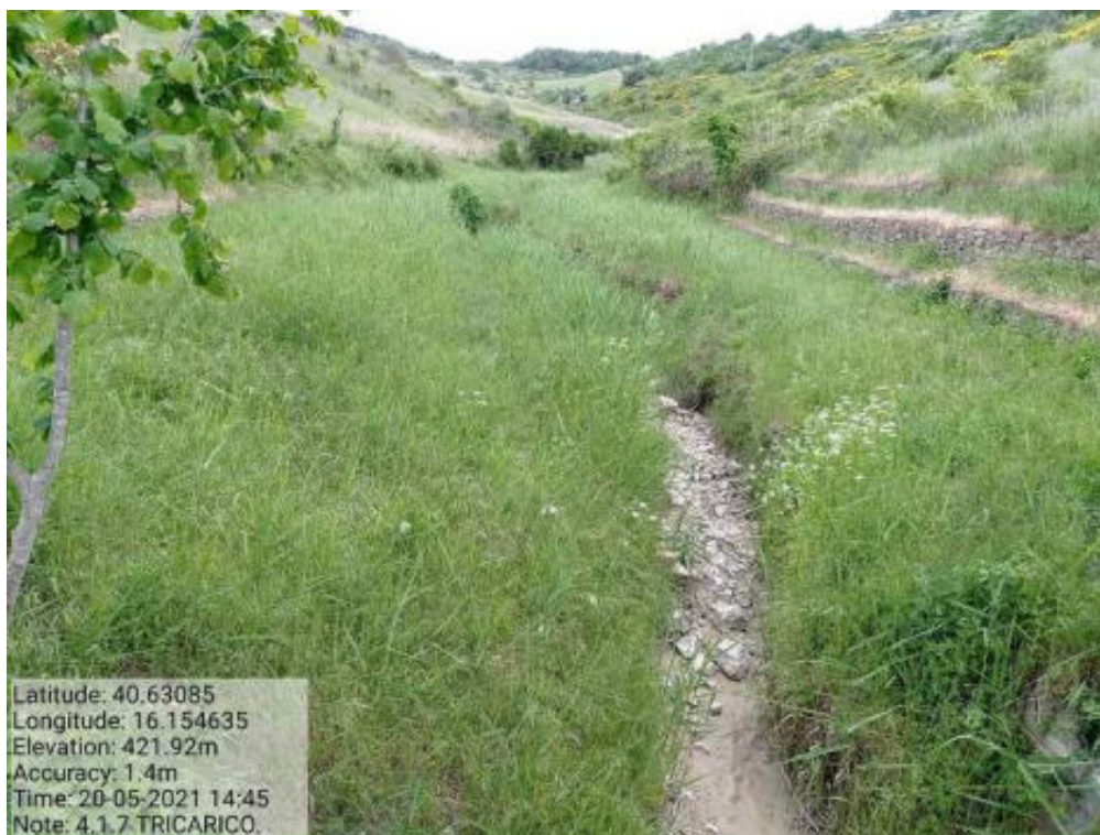
Int.4.1.7 Tricarico Fg.61 Part.Acque VALLONECASTAGNONE