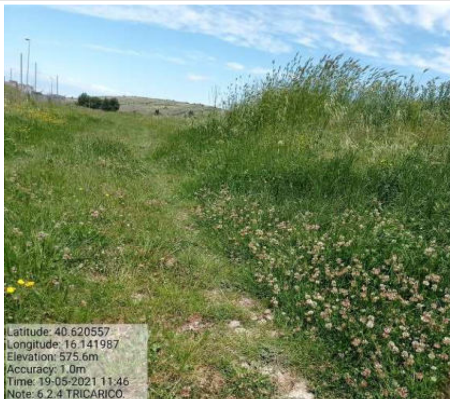
Int.6.2.4 Tricarico F.60 part.869 -320 - 347 - 348 Zona campo sportivo nuovo Ha.2.26 -Foto 78