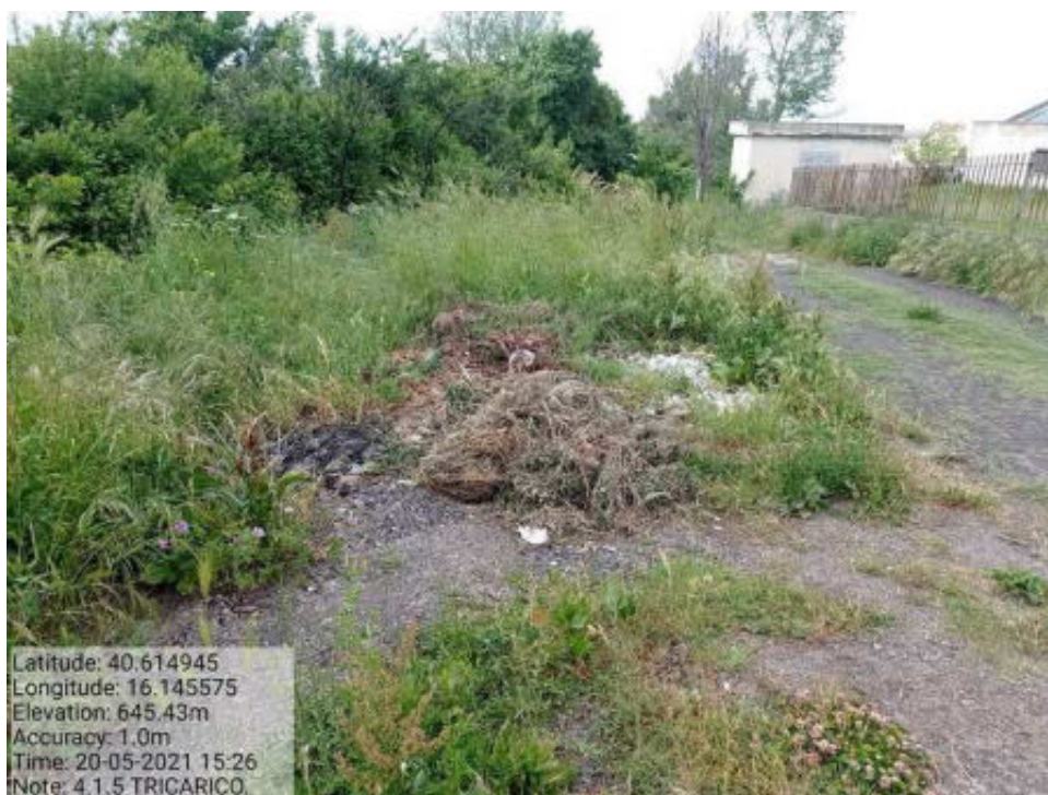
Int. 4.1.5 Tricarico Fg.65 Part.Acque PRETURA FONTANA VECCHIA