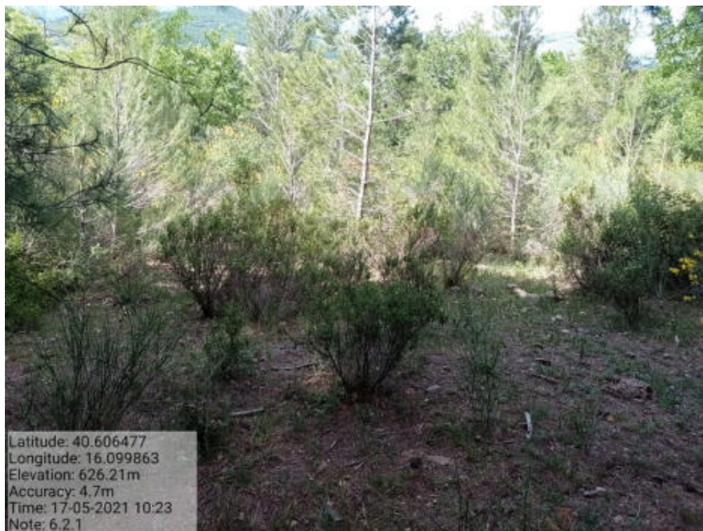
Int. 6.2.1 Tricarico Fg.62 part.24-122 Bosco Matenera