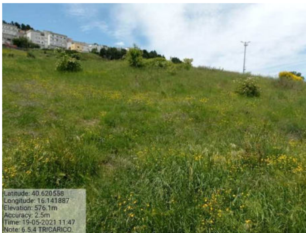
Int.6.5.4 Tricarico F.60 part.869 -320 - 347 - 348 Zona campo sportivo nuovo Ha.2.26 - Foto 85