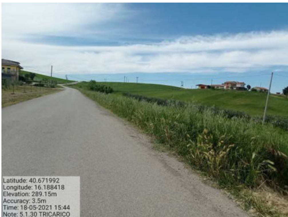
Int. 5.1.30 Tricarico Fg. 5-8 Strada Comunale Serramendola alta - Foto 65