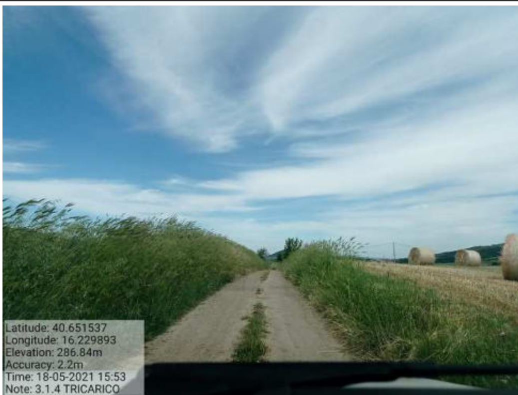
Int. 3.1.4 Tricarico Fg.41 part.52 -31 Lago Piani Sottani