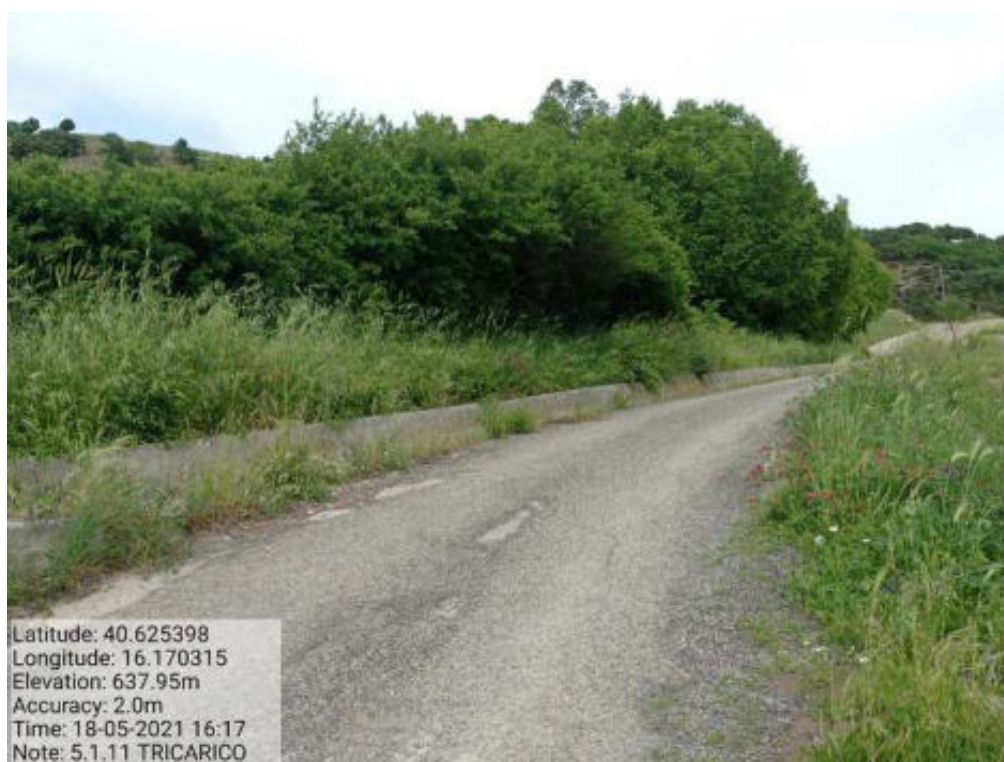
Int. 5.1.11 Tricarico Fg. 55-66 Tratturo Tricarico Grassano1° tratto - Foto 51