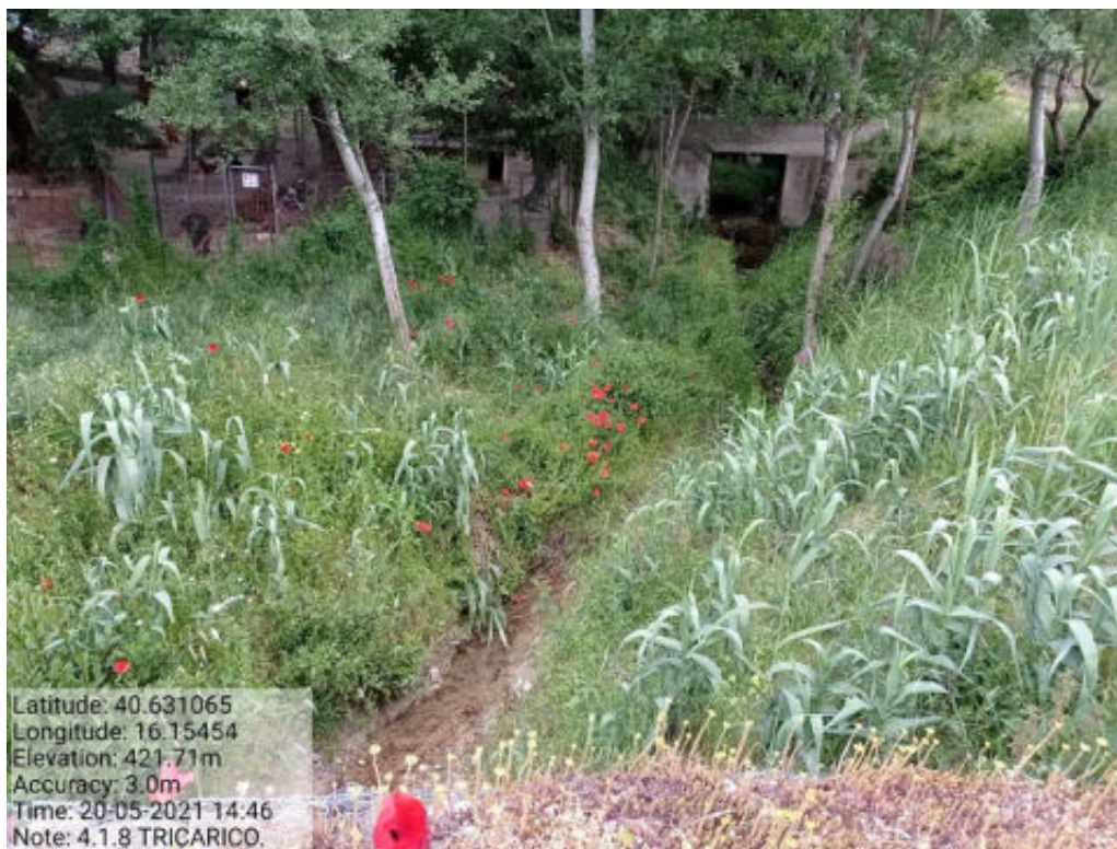
Int.4.1.8 Tricarico Fg.61 Part.Acque VALLONE CASTAGNONE (AFFLUENTE)