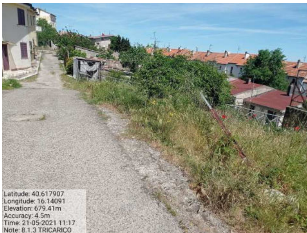
Int. 8.1.3 Tricarico Fg.62 Part strade Viale Europa