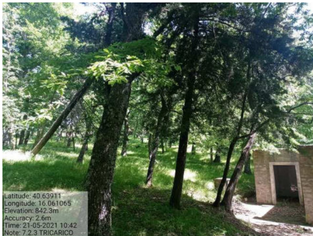
Int. 7.2.3 Tricarico Fg.50 Part.171 Bosco Trecancelli Foto 92