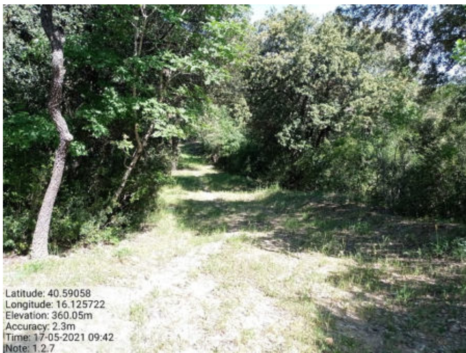
Int.1.2.7 Tricarico_Fg.62 Part.28-124- 24-122 Foresta Mantenera Malcanale - Foto 11