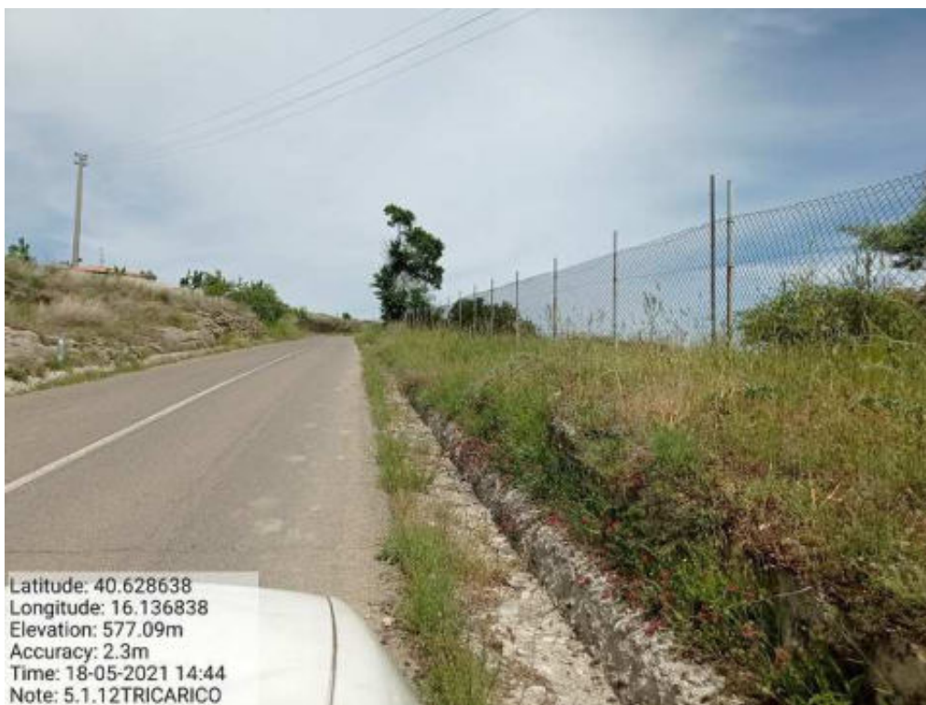
Int. 5.1.12 Tricarico Fg.60-54-46 Strada Provinciale Tricarico-Boccanera 1°Tratto Foto 52