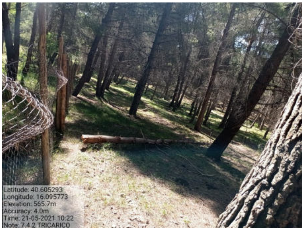
Int. 7.4.2 Tricarico Fg.62 part.42 Bosco Mantenera - Foto 97