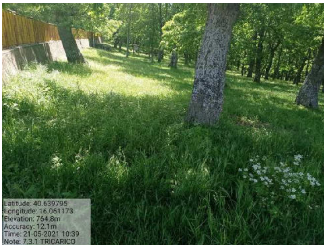
Int. 7.3.1 Tricarico Fg.50 Part.171 Bosco Trecancelli - Foto 94