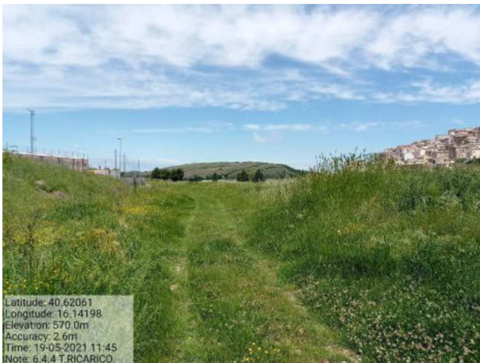
Int. 6.4.4 Tricarico F.60 part.869 -320 - 347 - 348 Zona campo sportivo nuovo Ha.2.26 - Foto 81