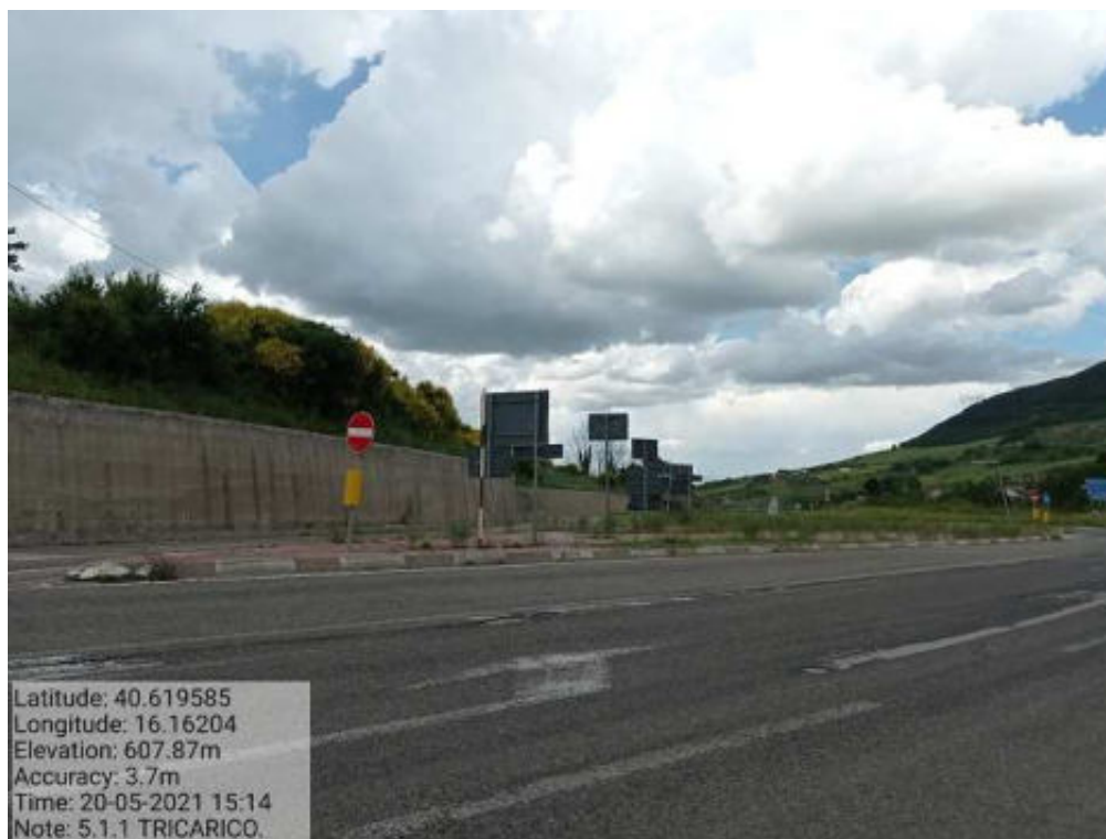
Int. 5.1.1 Tricarico Fg.70-68-66-55 SP di collegamento Basentana- Piano dele Ginestre - Foto 41