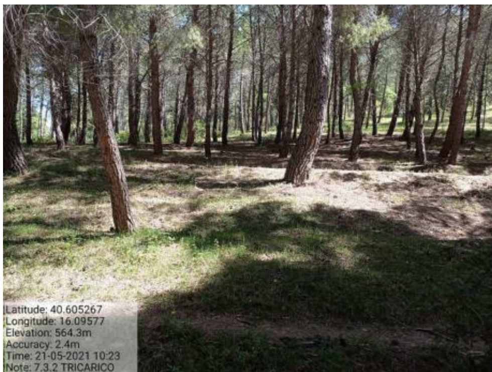
Int. 7.3.2 Tricarico Fg.62 part.42 Bosco Mantenera - Foto 95