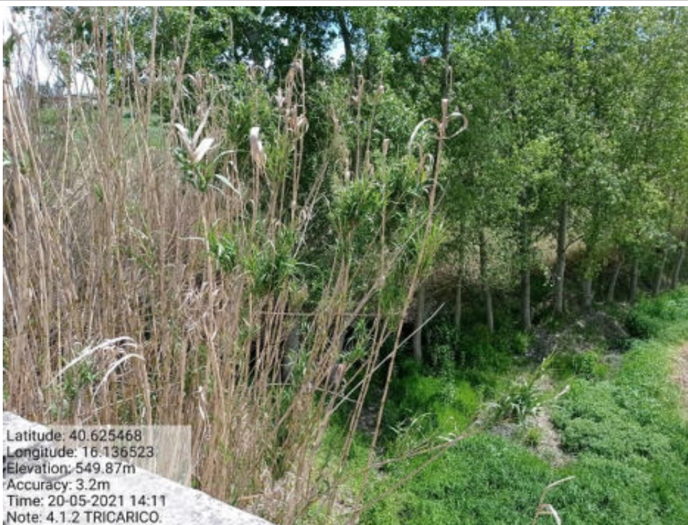
Int.4.1.2 Tricarico Fglio 65 part. Acque TORRENTE CACARONE TRATTO 2°