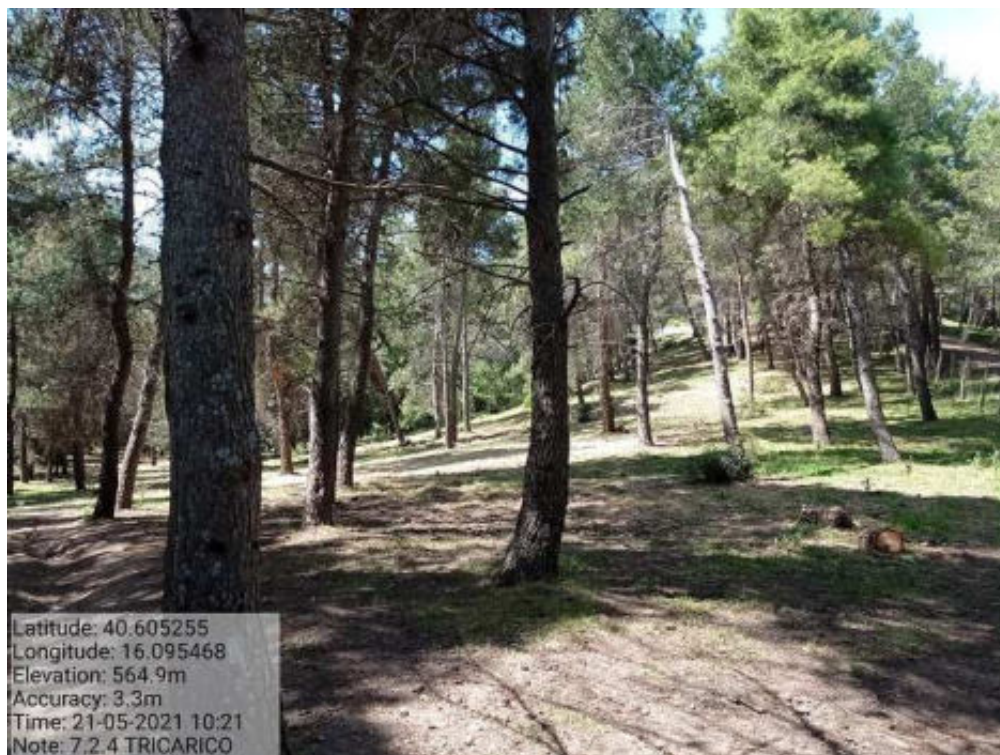
Int.7.2.4 Tricarico Fg.62 part.42 Bosco Mantenera - Foto 93