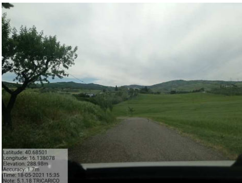
Int. 5.1.18 Tricarico Fg. 4 Strada Comunale Forte Orlando