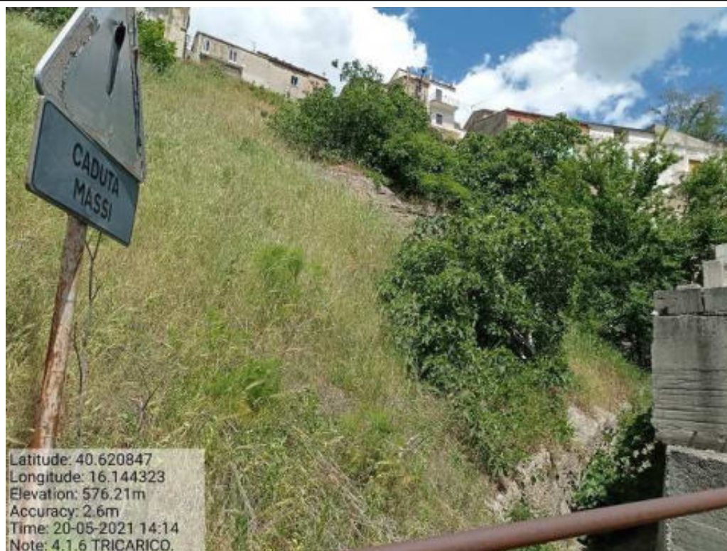
Int.4.1.6 Tricarico Fg.60 Part.Acque TORRENTE CACARONE (affluente)