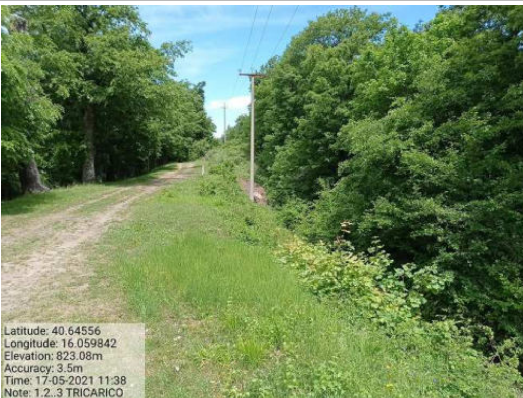
Intervento 1.2.3 Tricarico Fg.42 Part.184 - Loc.Trecancelli - Fonti fascia perimetrale al Camping Don Girolamo