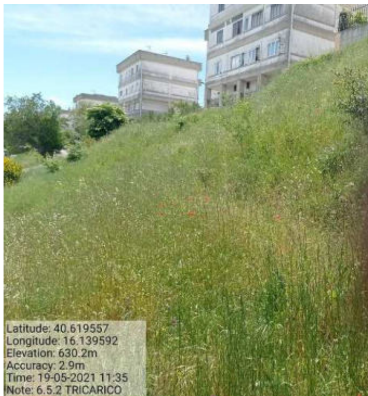
Int. 6.5.2 Tricarico Fg.60 Part.300 - 1103 Via Don Pancrazio Toscano - Foto 84