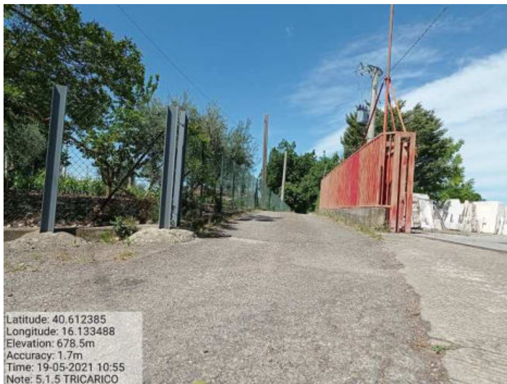
Int.5.1.5 Tricarico Fg.64 Strada Comunale Malcanale 4 - Foto 45