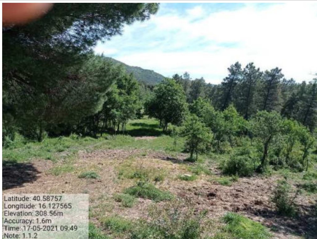
Intervento 1.1.2 Tricarico Fg.77 part.32-33- 16-134 Loc Mantenera Malcanale Cugno del Vescovo