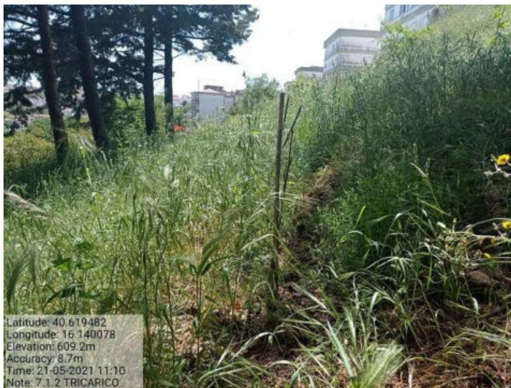
Int. 7.1.2 Tricarico Fg.60 Part.300 1103 Via Don Pancrazio Toscano - Foto 88