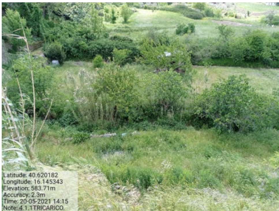
Int.4.1.1 Tricarico Fg.65- Part. Acque VALLONE CACARONE 1° TRATTO - Foto 31