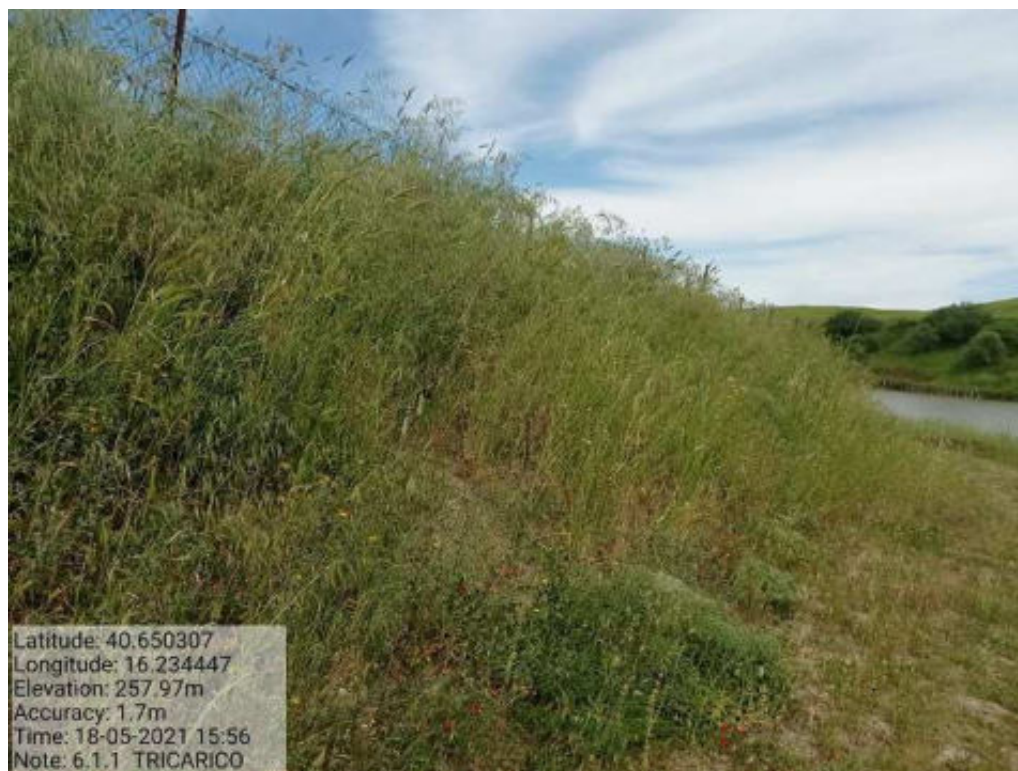
Int. 6.1.1 Tricarico fg.41 part.31 Lagho Piani Sottani