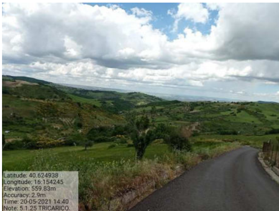
Int.5.1.25 Tricarico Fg 61-48-37- Strada Comunale Castagnone 2 Foto 60