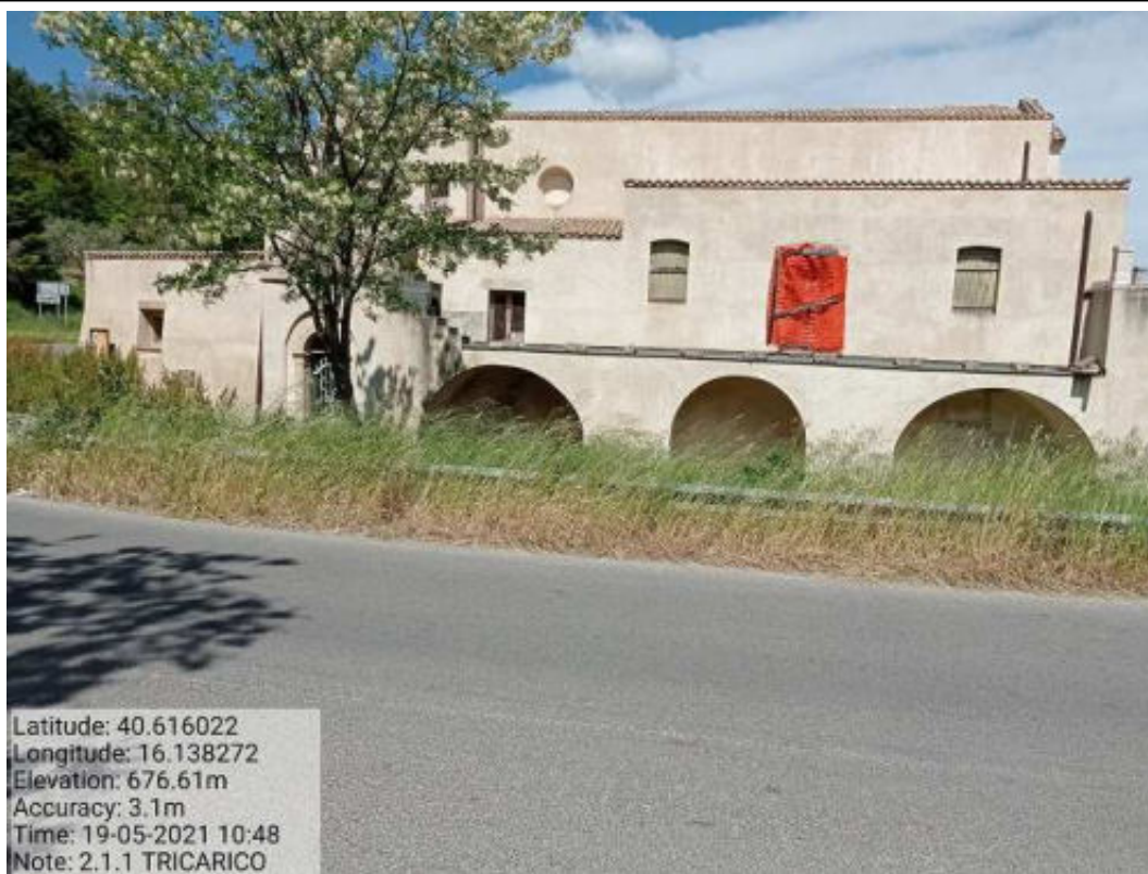
Int.2.1.1 Tricarico Vede urbano e periurbano