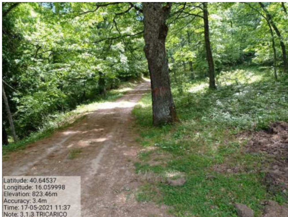
Int 3.1.3 Tricarico Fg.42 part.184 Bosco Fonti pista Santo Janni – Tricarico