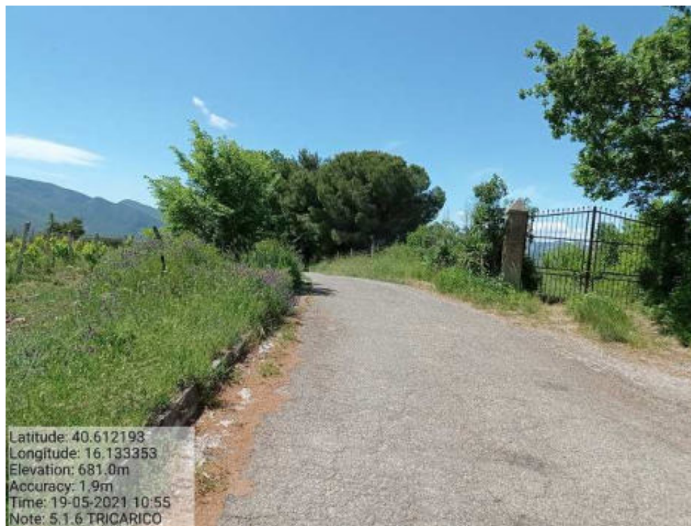
Int.5.1.6 Tricarico Fg.64 Strada Comunale Malcanale 5 Foto 46