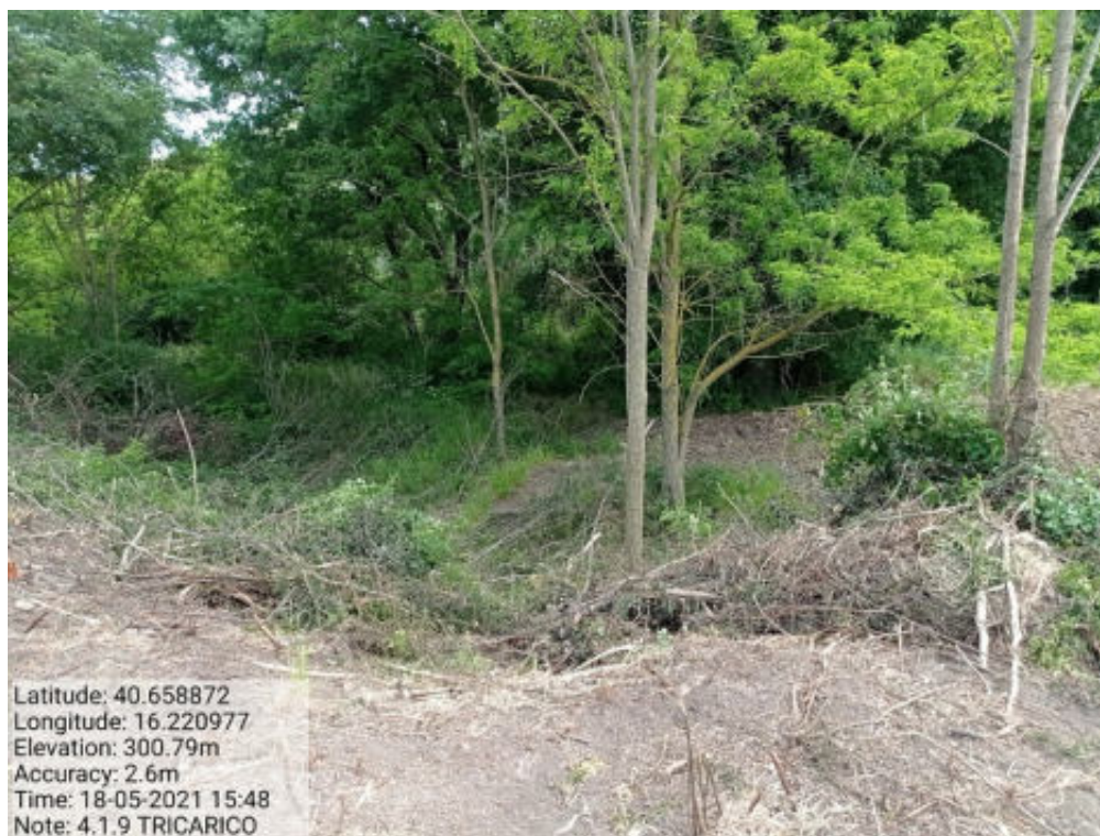
Int.4.1.9 Tricarico Fg.41 Part.Acque TORRENTE BILIOSO - Foto 39