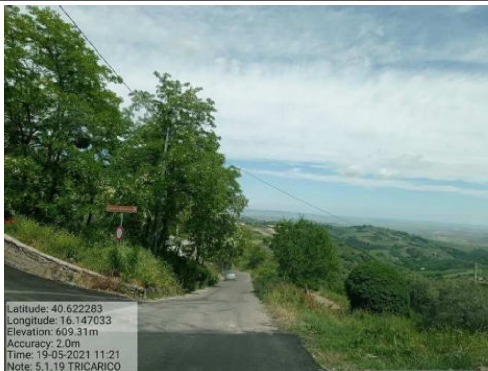
Int. 5.1.19 Tricarico Fg.54-61 Strada Comunale Saracena