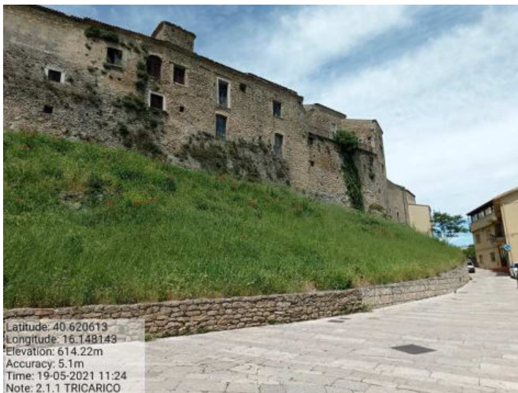
Int.2.1.1 Tricarico Vede urbano e periurbano