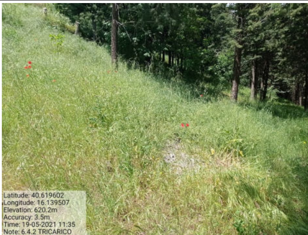
Int.6.4.2 Tricarico Fg.60 Part.300 - 1103 Via Don Pancrazio Toscano - Foto 80