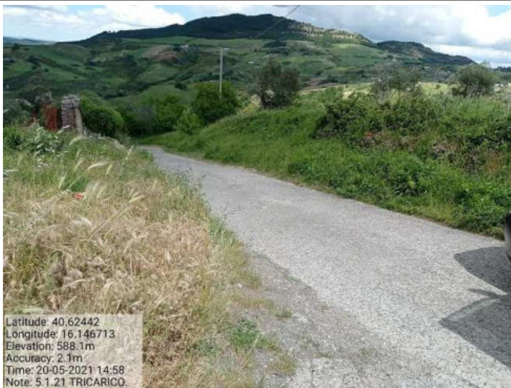
Int. 5.1.21 Tricarico Fg61 Strada Comunale della Trinità Foto 58