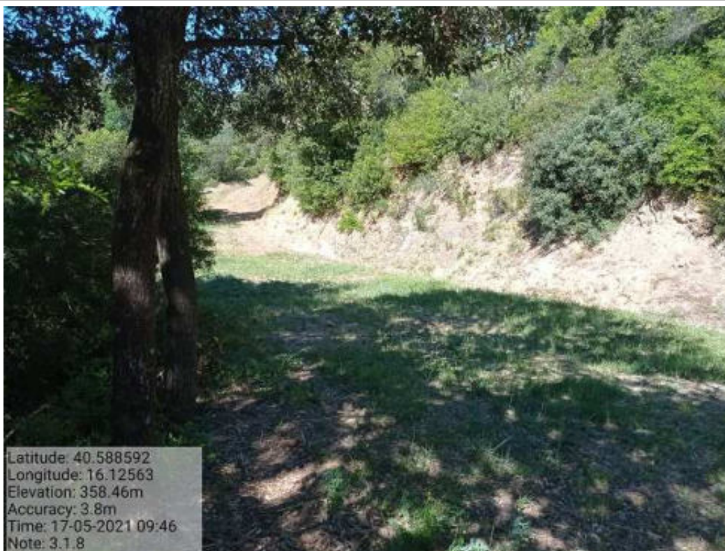
Int.3.1.8 Tricarico Fg.77 Strade Foresta mantenera Malcanale - Masseria Pinto