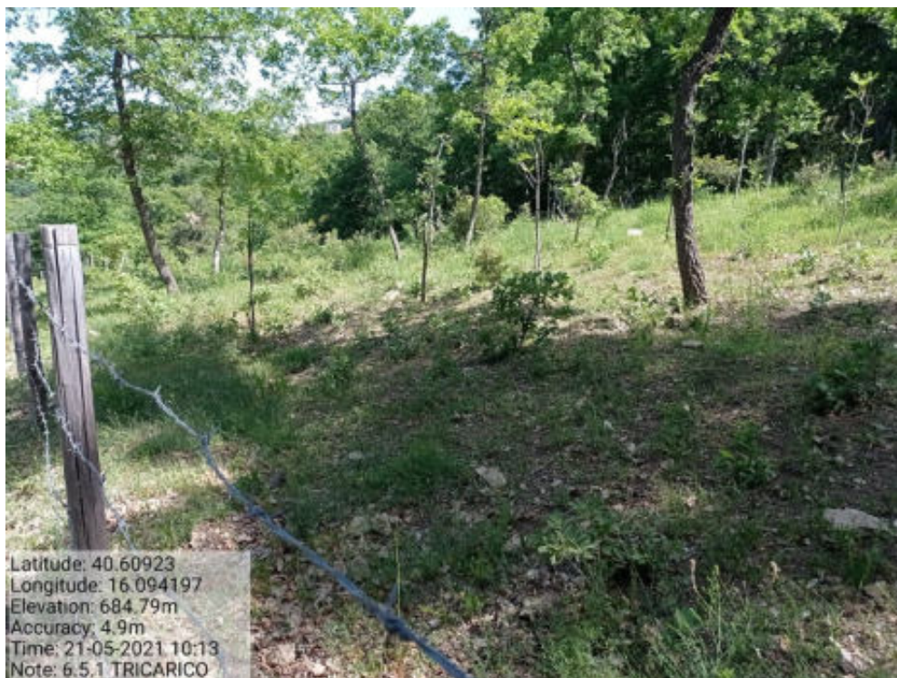
Int. 6.5.1 Tricarico Fg.62 part.24-122 Bosco Matenera - Foto 83