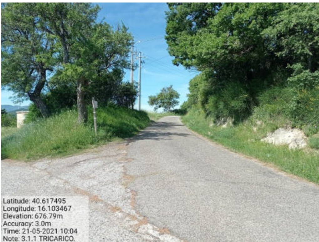
Int.3.1.1 Tricarico Fg.62 part.Strade Strada di accesso alla Foresta Malcanale - Masseria Pepe Gagliardi - Foto 21