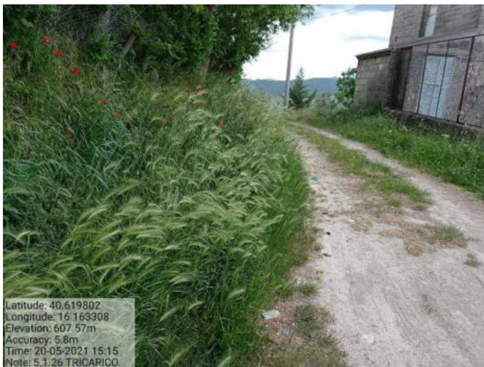
Int. 5.1.26 Tricarico Fg 66-67 Strada Comunale ex Collegamento Basentana - Foto 61