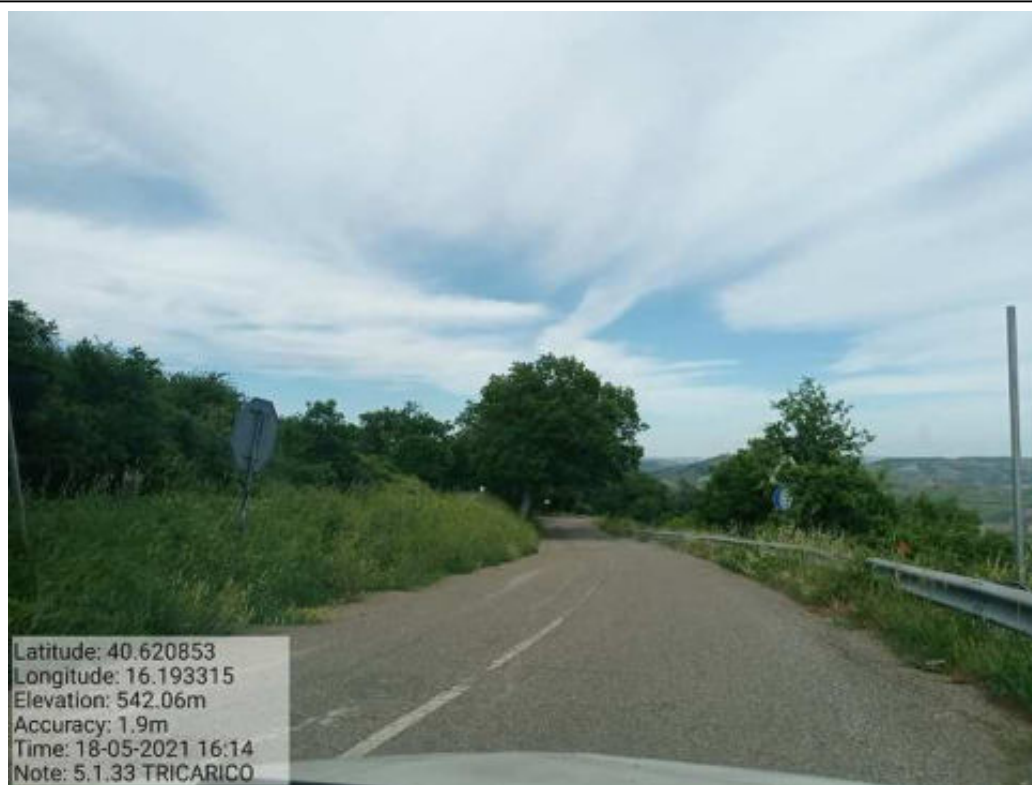
Int.5.1.33 Tricarico Fg. 57-70 Strada Comunale per la Discarica Foto 68