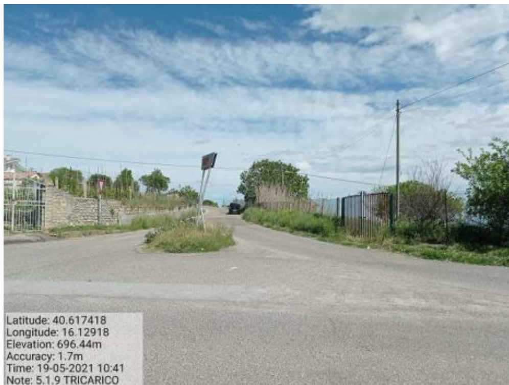
Int. 5.1.9 Tricarico Fg. 59 Strada Comunale Salumificio - Foto 49