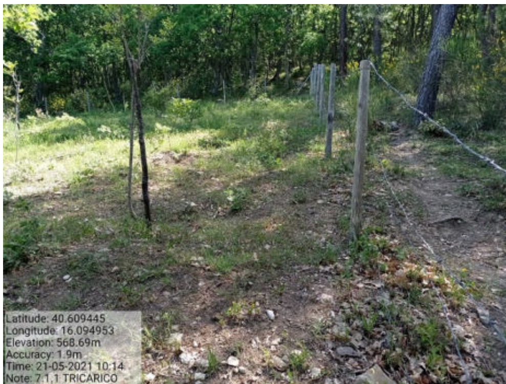
Int.7.1.1 Tricarico Fg.62 part.24-122 Bosco Matenera - Foto 87