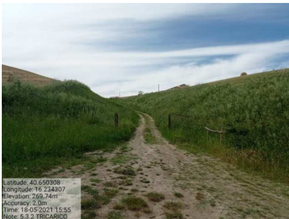
Int. 5.3.2 Tricarico Fg.2 part.90-52-31 Strada di accesso Lago Piani Sottani