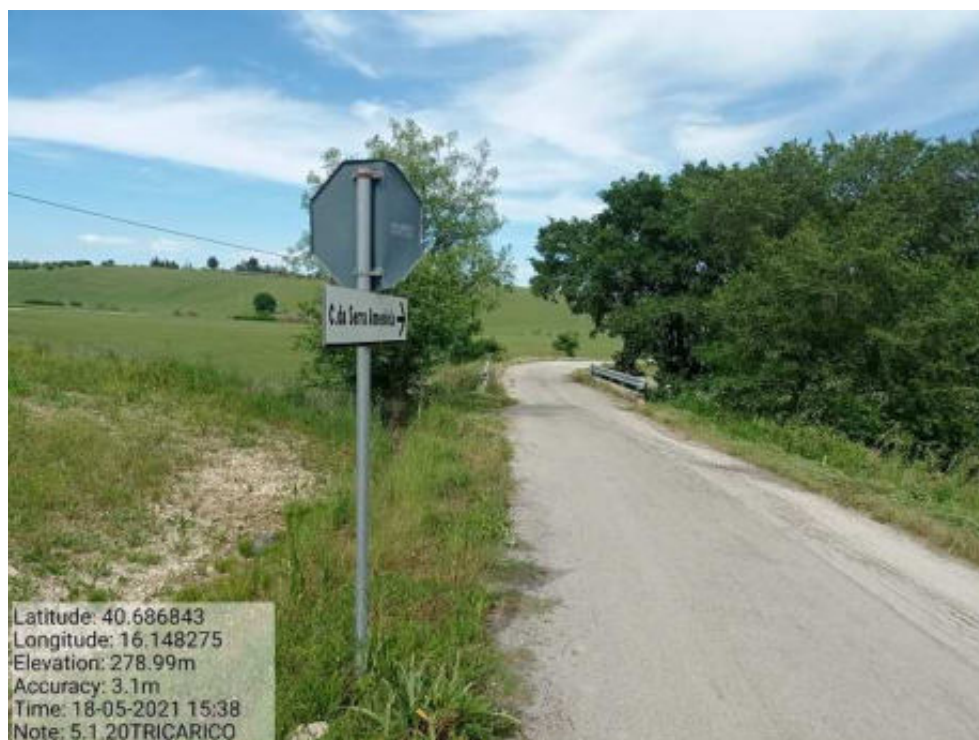
Int. 5.1.20 Tricarico Fg 15-14-6-10 Strada Comunale Serramendola Bassa - Foto 57