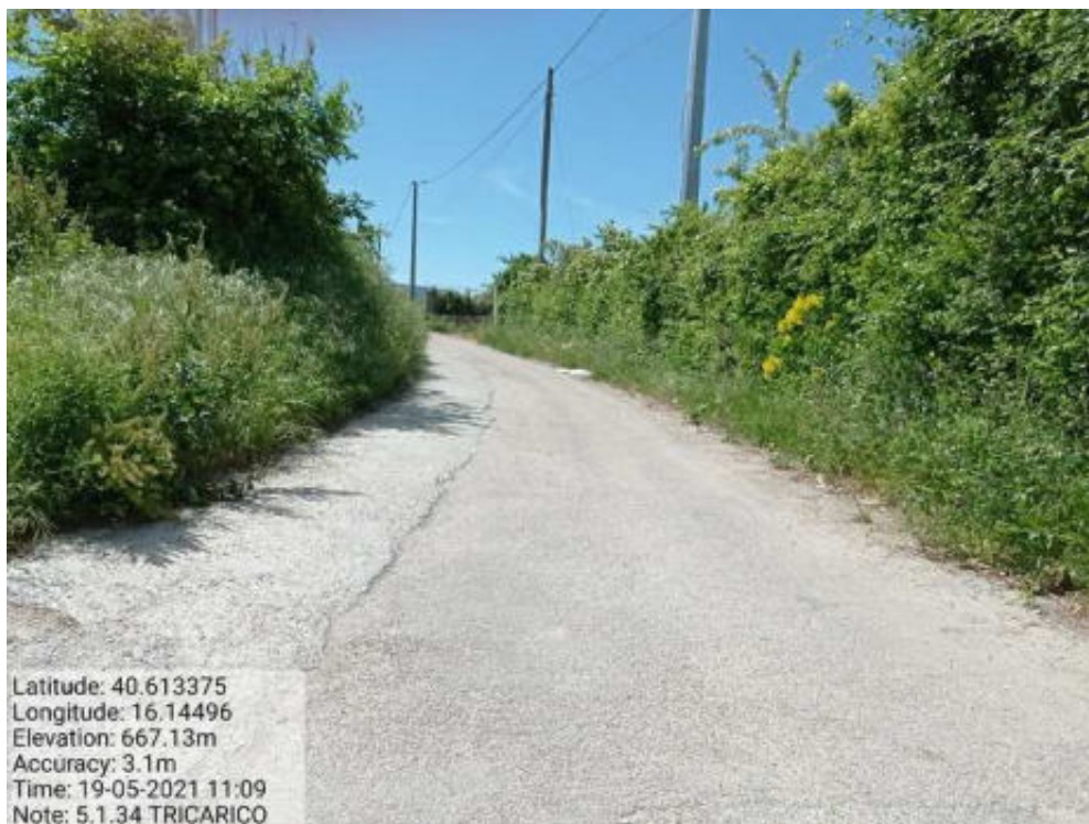
Int. 5.1.34 Tricarico Fg. 65-75-76 Strada Comunale San Valentino - Foto 69