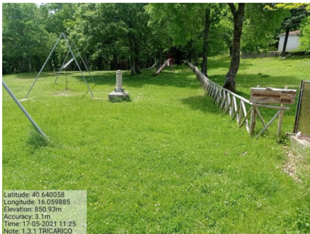
Int. 1.3.1 Tricarico Fg.50 part.171 Loc.Trecancelli area attrezzata