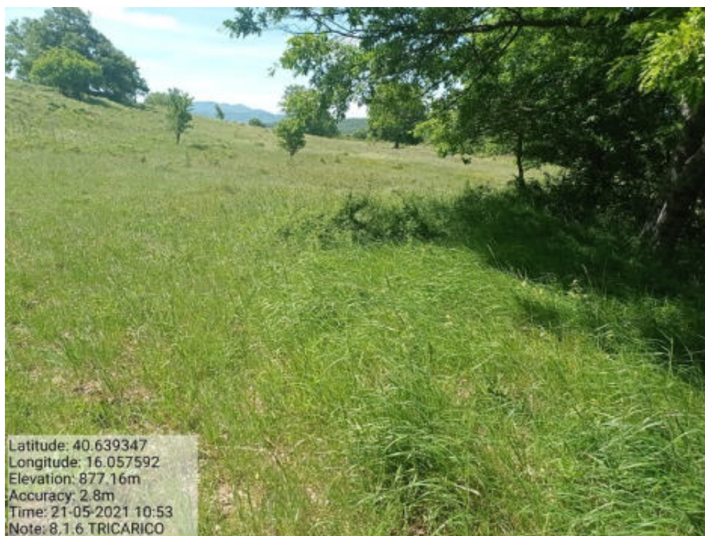
Int.8.1.6 Tricarico Fg. 50 Trecancelli Sito Archeologico