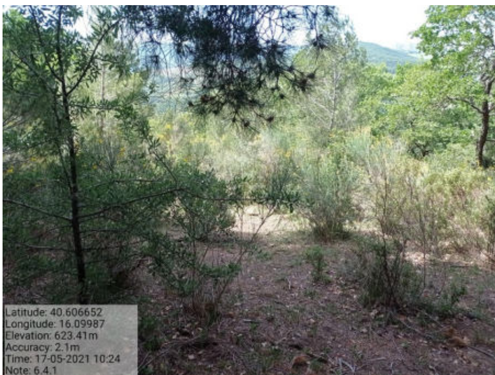
Int. 6.4.1 Tricarico Fg.62 part.24-122 Bosco Matenera - Foto 79