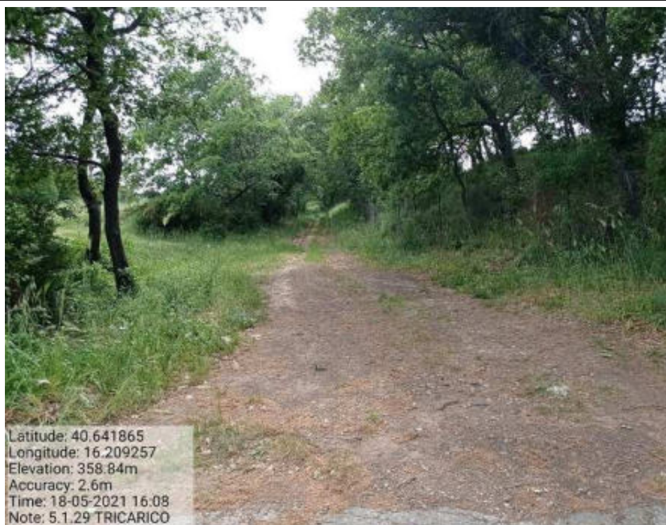
Int. 5.1.29 Tricarico fg.57 Tratturo Tricarico Grassano 3° Tratto