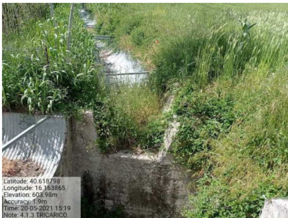
Int.4.1.3 Tricarico Fg.66 part.97-574-39 CANALE PIANO DELLE GINESTRE