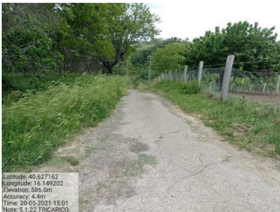
Int. 5.1.22 Tricarico Fg 61 Strada Vicinale della Trinità - Foto 59