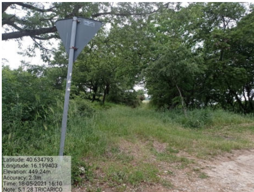
Int. 5.1.28 Tricarico fg. 56-57 Tratturo Tricarico Grassano 2° Tratto