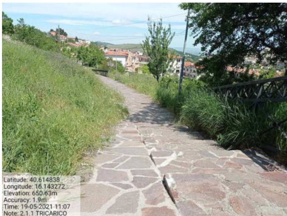
Int. 2.1.1 Tricarico Vede urbano e periurbano - Foto 19