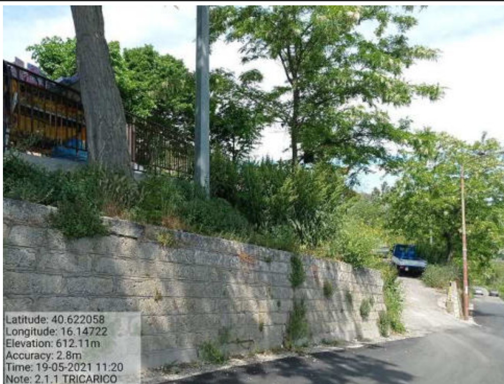
Int.2.1.1 Tricarico Vede urbano e periurbano