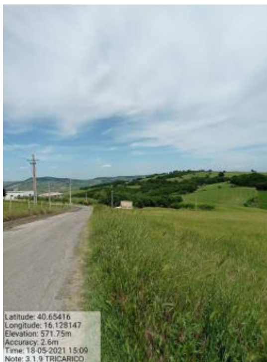
Int.3.1.9 Tricarico Fg. 11 Tratturo Comunale Cugno dei Greci - Strada Comunale S. Marco - Foto 30