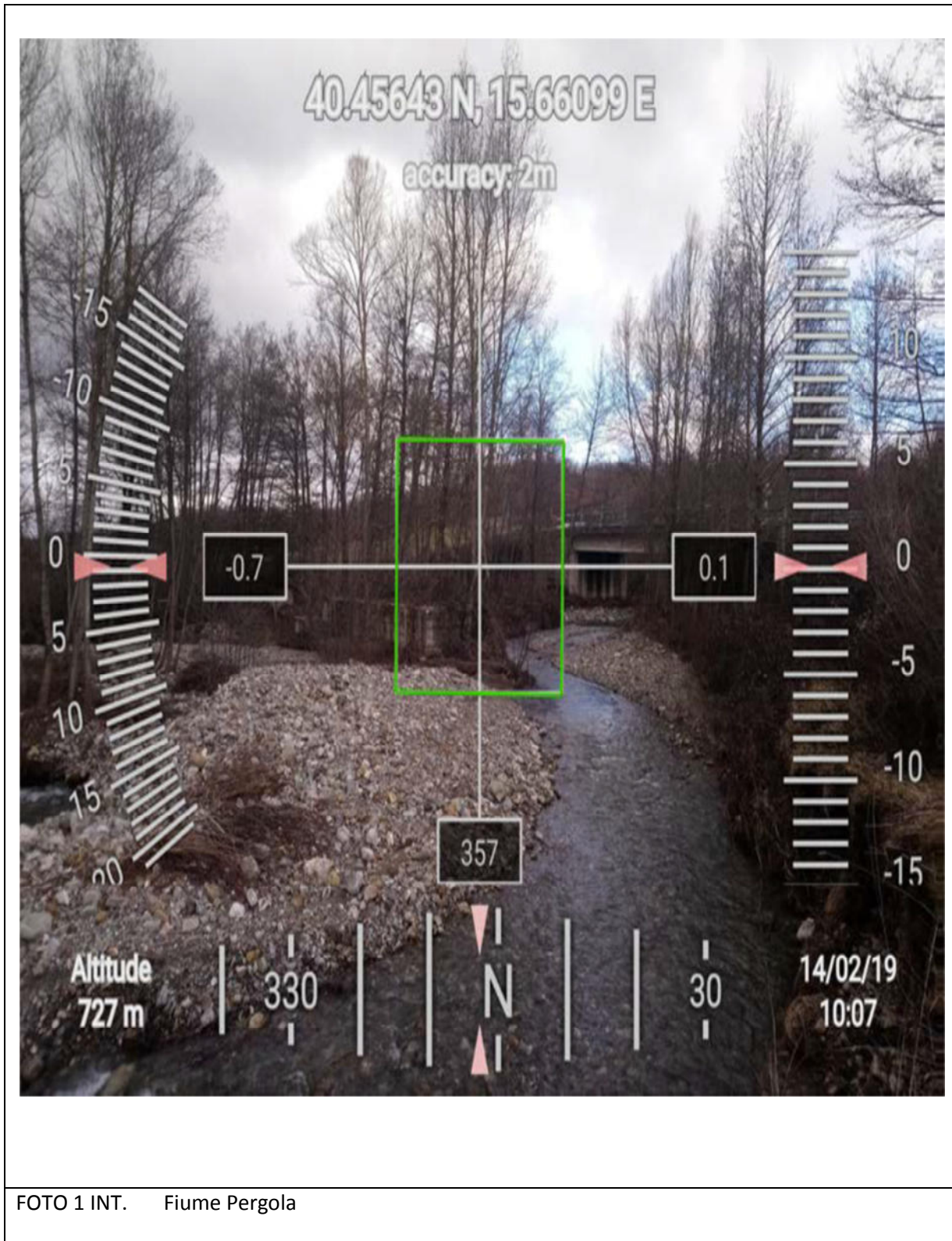
FOTO 1 INT. Fiume Pergola