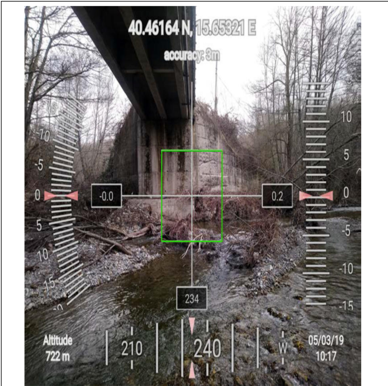
FOTO 3 INT. Fiumara Pergola