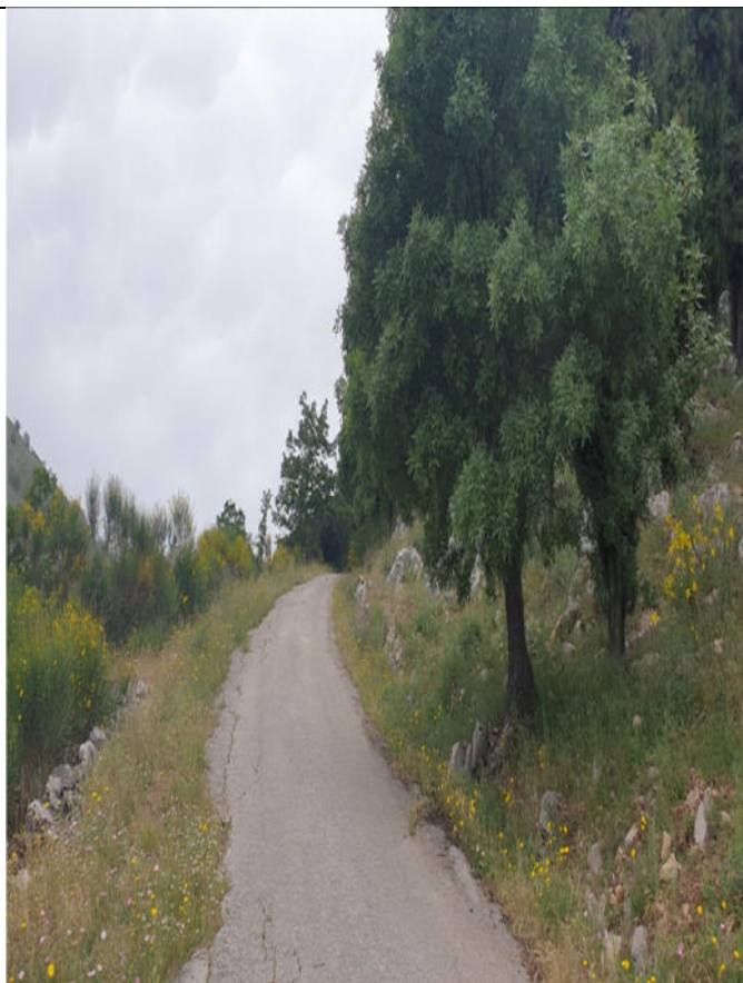
FOTO 1- INT. 1.1.1_LOC.Crocifisso coordinate 05252088 - 4482602