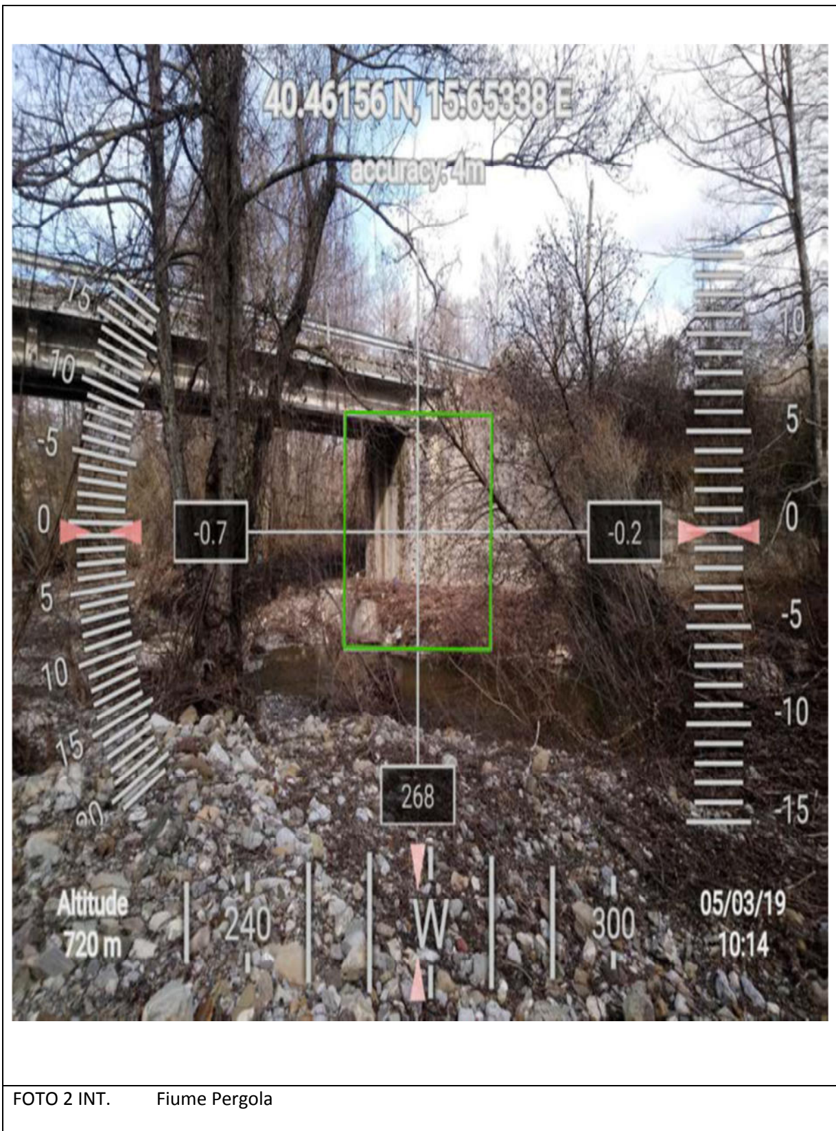
FOTO 2 INT. Fiume Pergola