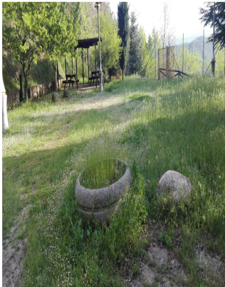
FOTO 2- INT.2.1.1_LOC. Parco giochi Concento Faitiello