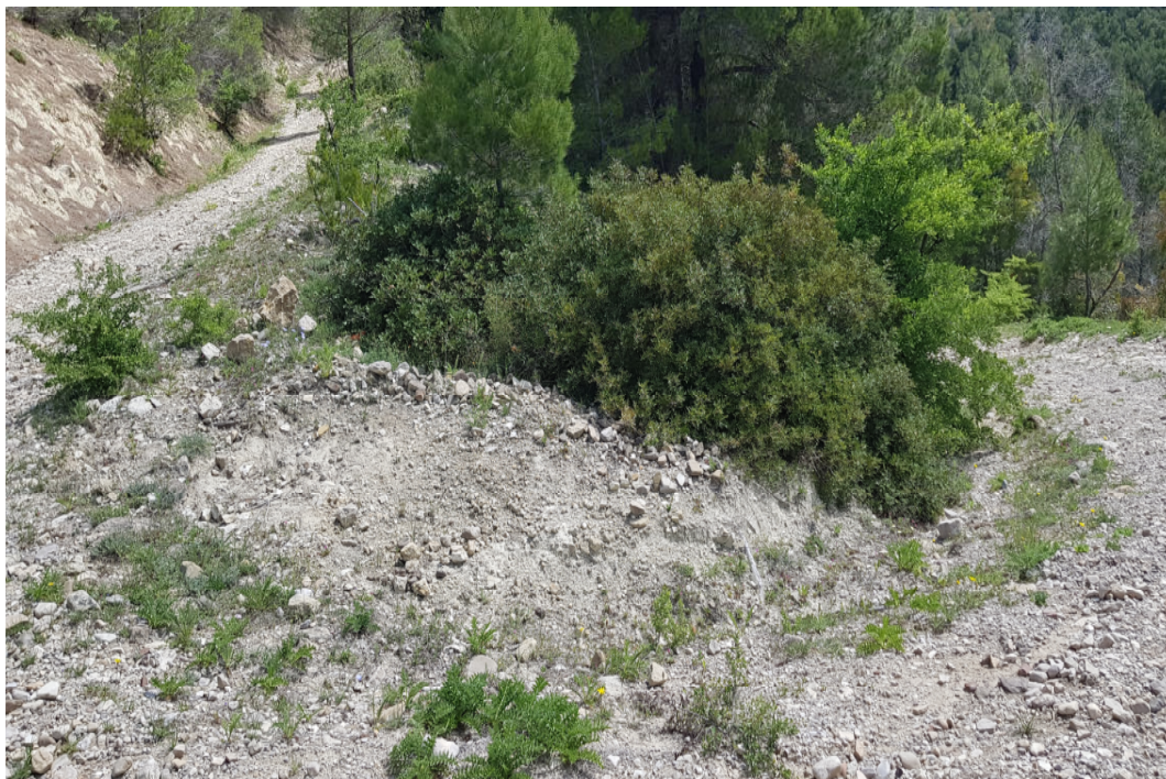
Manutenzione pista forestale – Loc. Castiglione