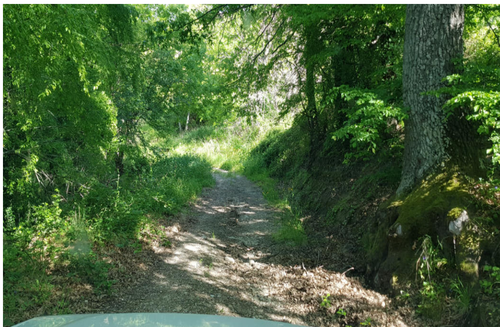
Manutenzione pista forestale Loc. Bosco Accera