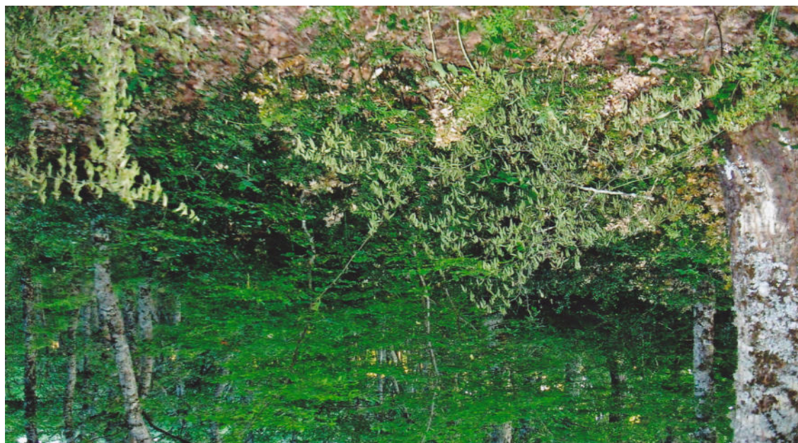
Miglioramenti boschi esistenti (diradamento)