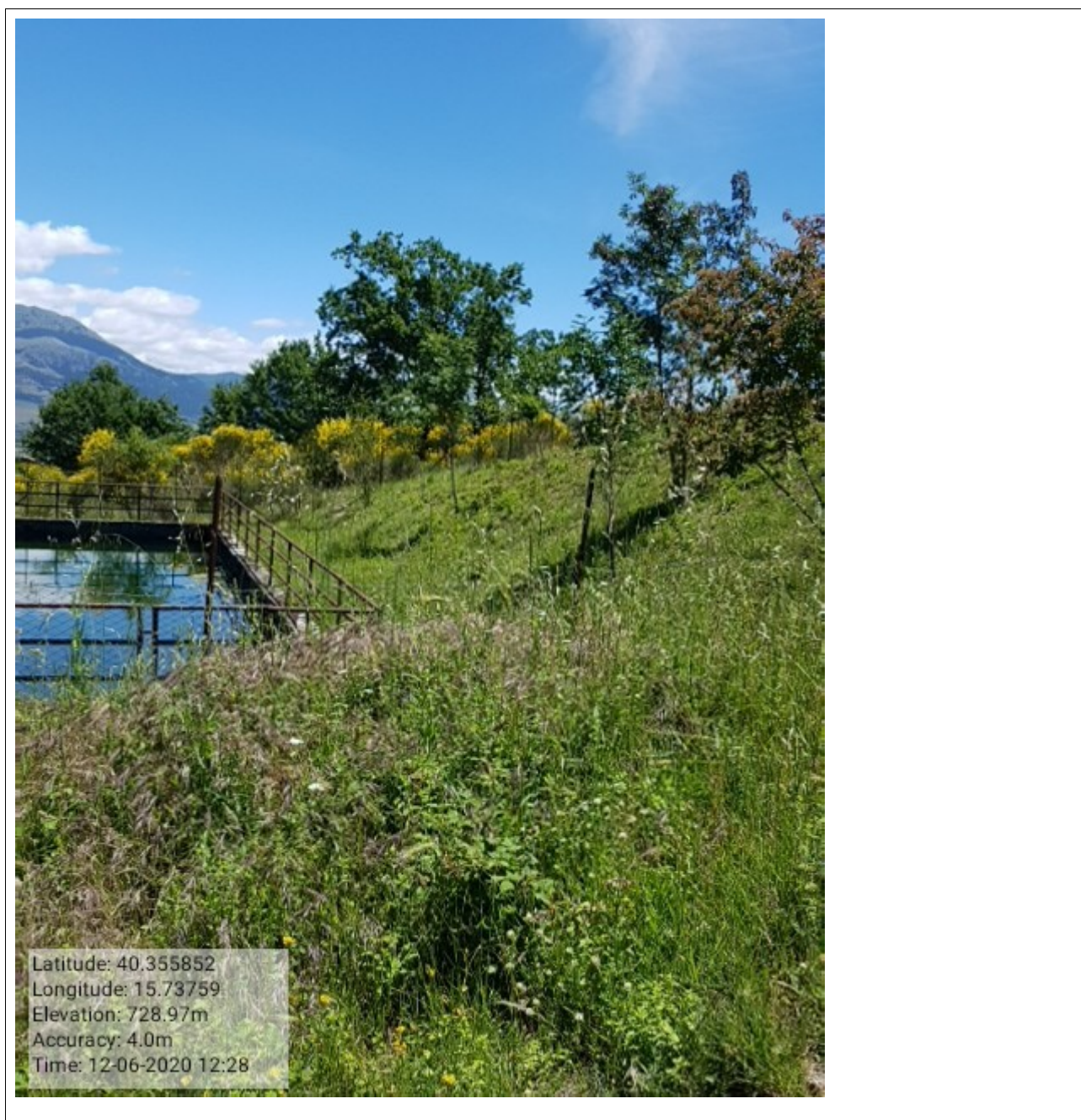
Vasca San Miele int.4.2.4