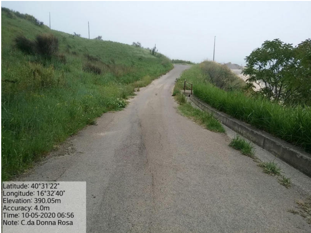
Int. 5.1.1 Loc. Strada Comunale Pomarico-Contrada Donna Rosa – Decespugliamento Scarpate stradali