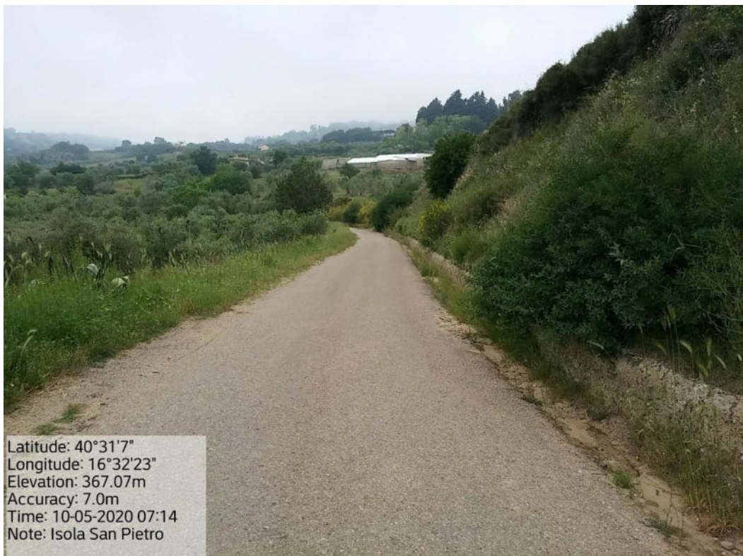
Int. 5.1.2 Loc. Strada Comunale Pomarico - Isola S. Pietro – Decespugliamento Scarpate stradali