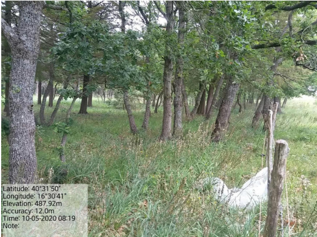
Int. 1.1.1 Loc.Bosco Manferrara – Manutenzione di viale tagliafuoco