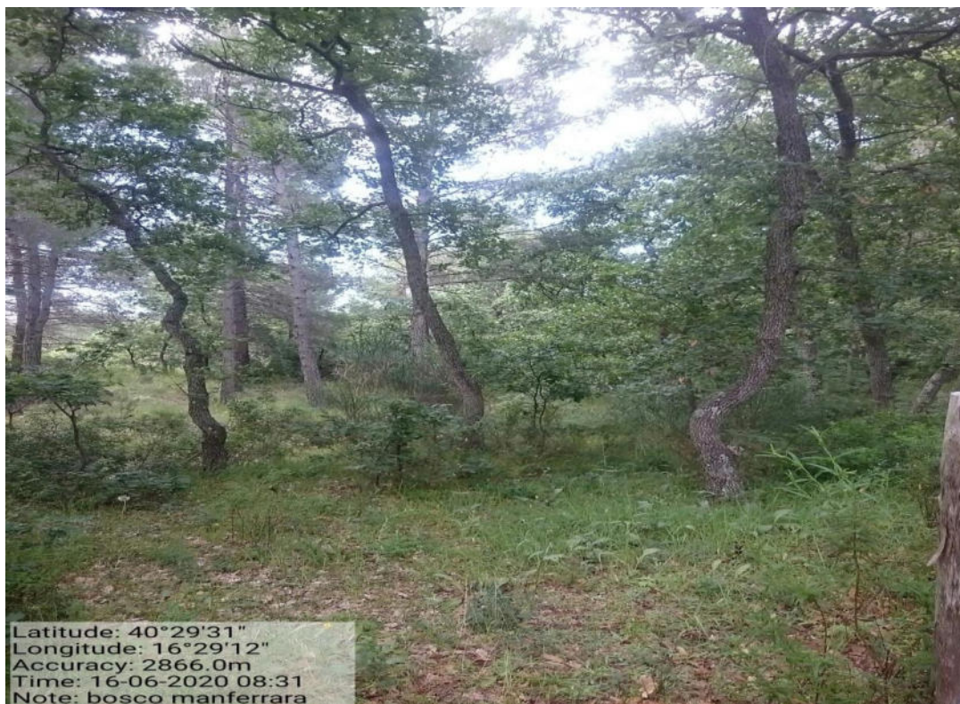
Int. 1.7.1.1 – Loc. Bosco Manferrara - decespugliamento