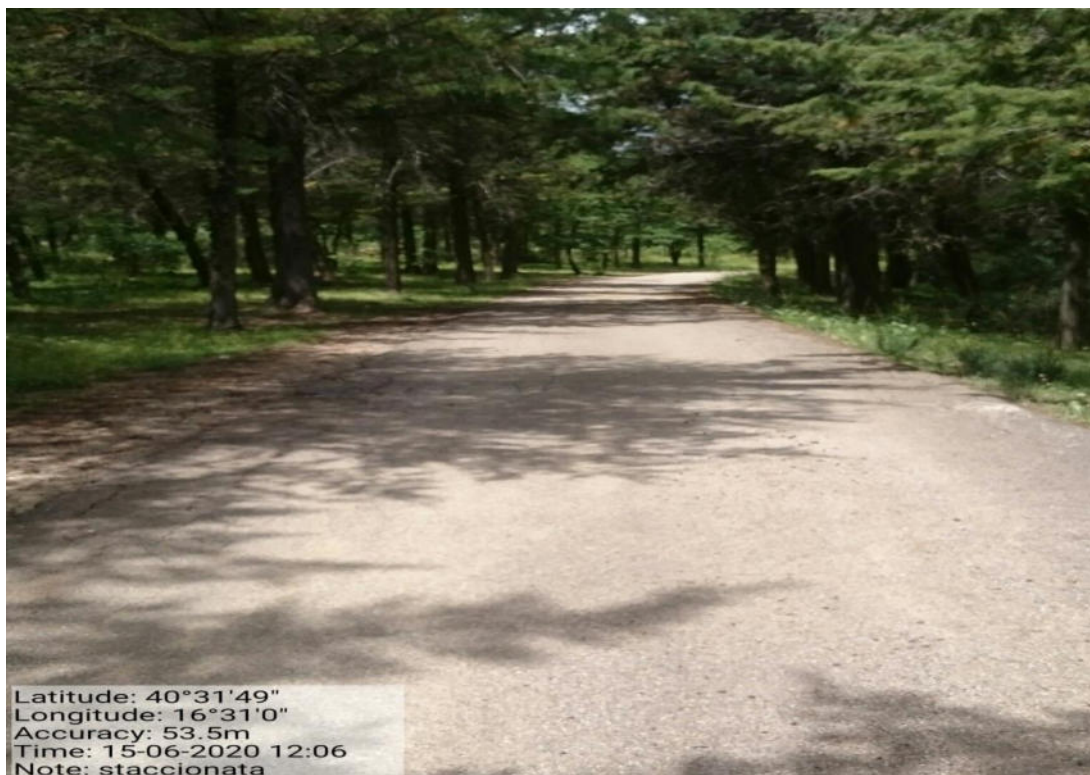
Int. 1.8.1.1 – Loc. Bosco Manferrara – Fornitura e realizzazione staccionata