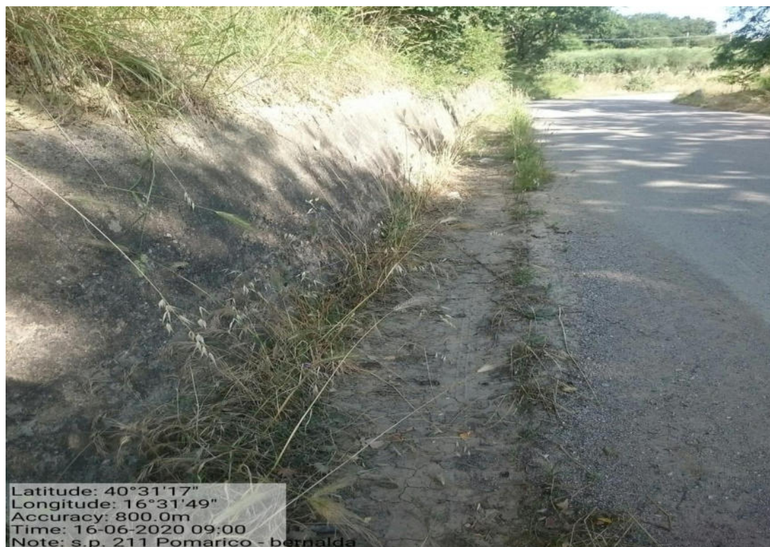
Int. 5.2.9 – Tronco S.P.211 Pomarico - Bernalda – Pulizia cunette