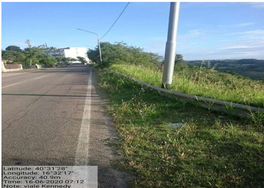
Int. 5.2.6 – Strada Comunale Viale Kennedy – Pulizia cunette