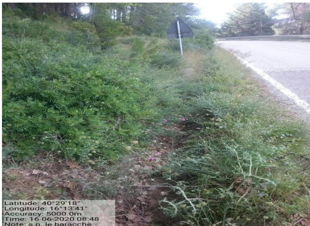
Int. 5.2.5 – Strada S.P. Le Baracche – Pulizia cunette