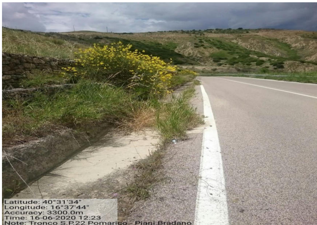
Int. 5.2.8 - S.P.211 Tronco S.P. 22 Piani Bradano – Pulizia cunette