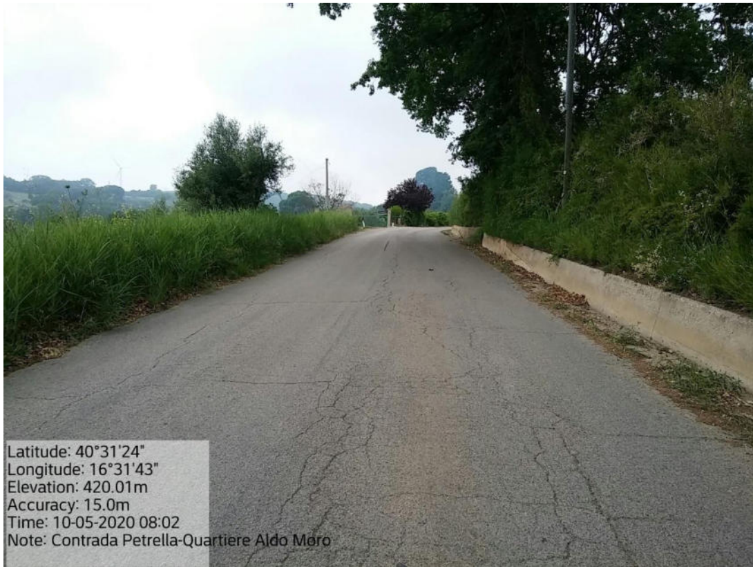
Int. 5.1.3 Loc. Strada Com.lePomarico - C.da Petrella-Quartiere A. Moro – Decespugliamento Scarpate stradali