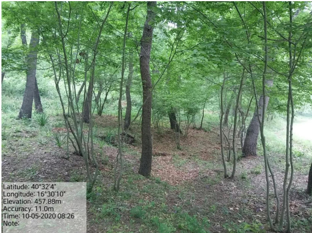
Int. 1.1.2 Loc.Bosco Manferrara – Manutenzione di viale tagliafuoco