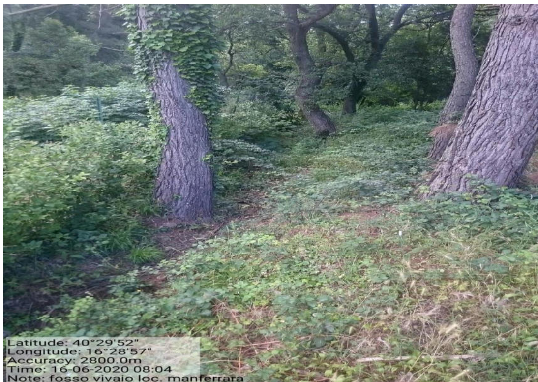
Int. 1.4.1.1 – Fosso Vivaio Loc. Bosco Manferrara - Decespugliamento