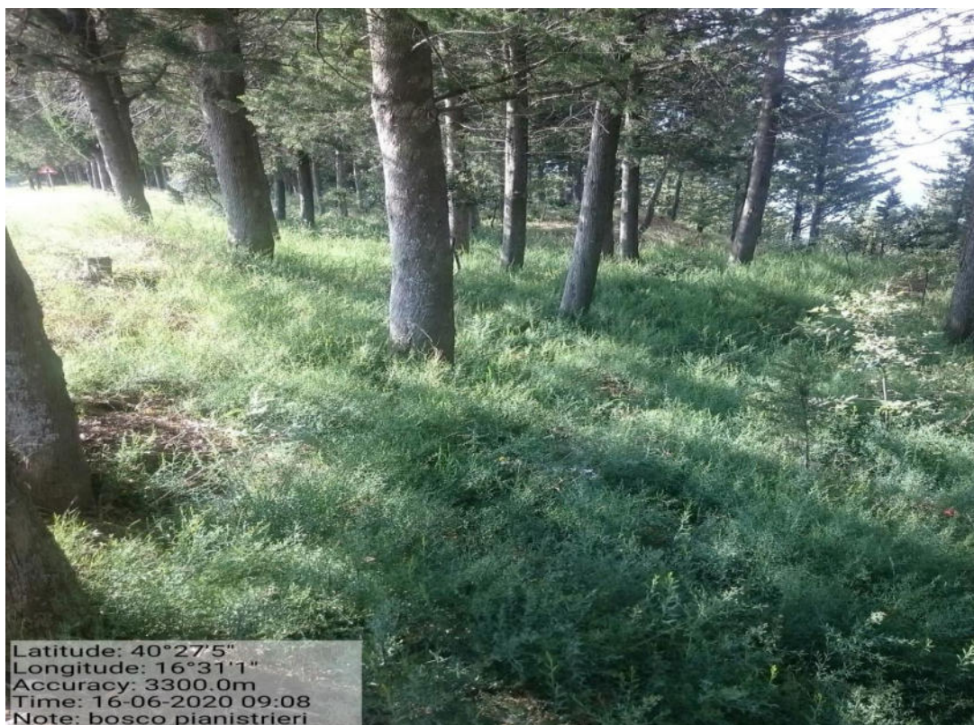
Int. 1.7.1.2 – Loc. Bosco Pianistriero - decespugliamento