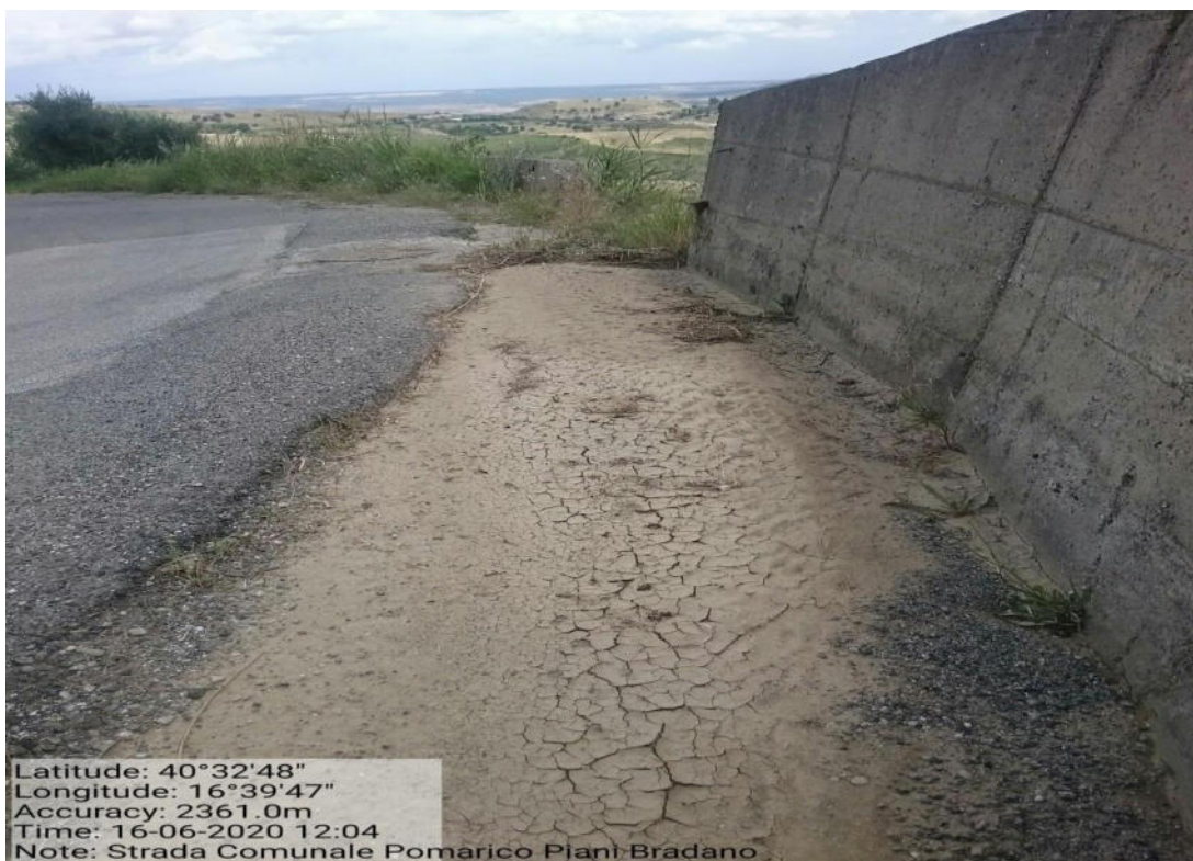
Int. 5.2.7 – Strada Comunale Pomarico – Piani Bradano – Pulizia cunette