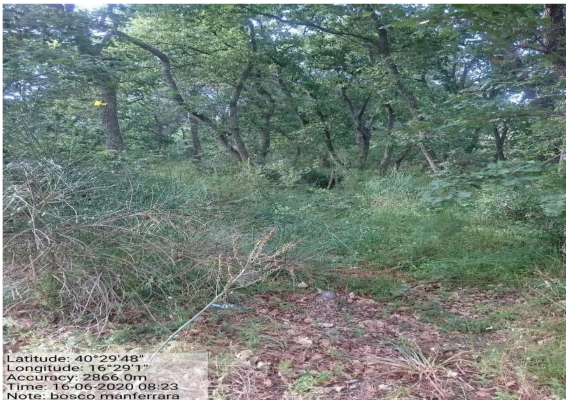
Int. 1.7.3.1 – Loc. Bosco Manferrara - Diradamento