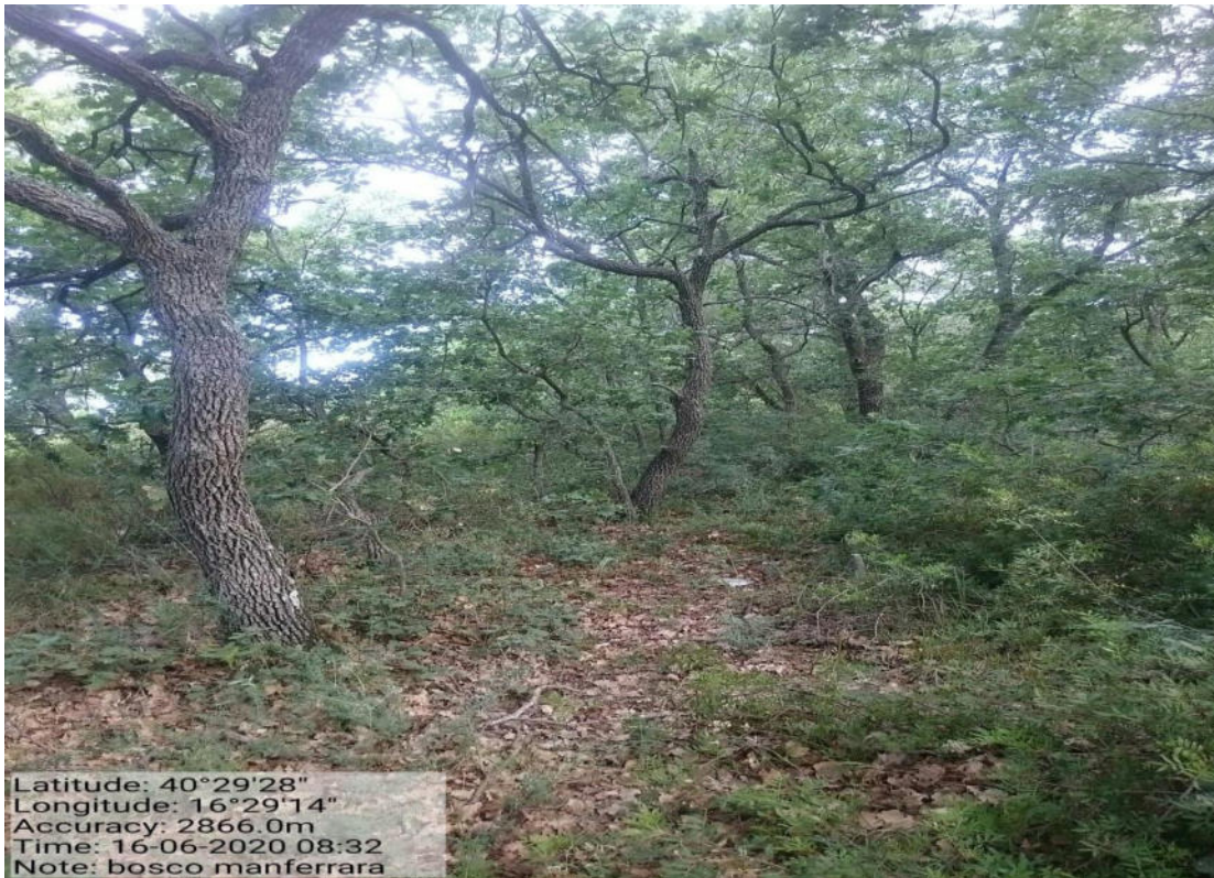
Int. 1.7.2.1 – Loc. Bosco Manferrara - Spalcatura