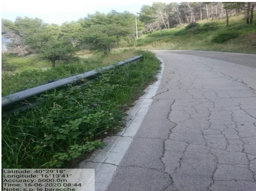
Int. 5.1.5 - S.P. Le Baracche – Decespugliamento scarpate stradali