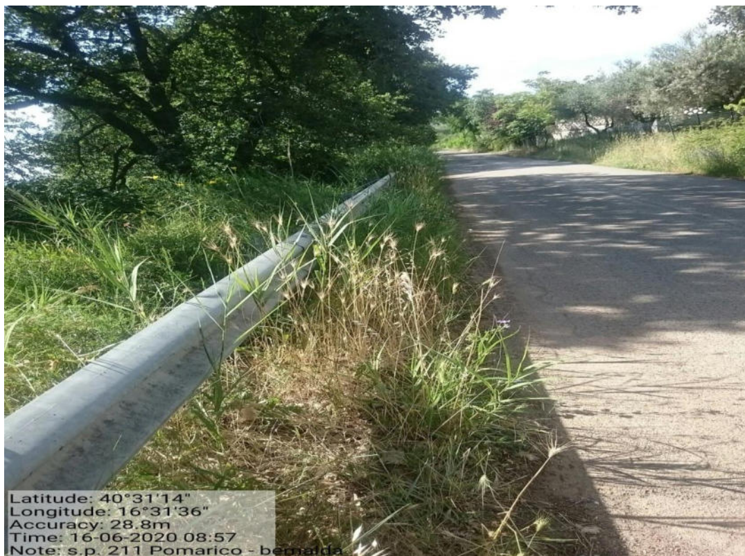
Int. 5.1.9- S.P.211 Tronco S.P. 211 Pomarico – Bernalda - decespugliamento scarpate stradali