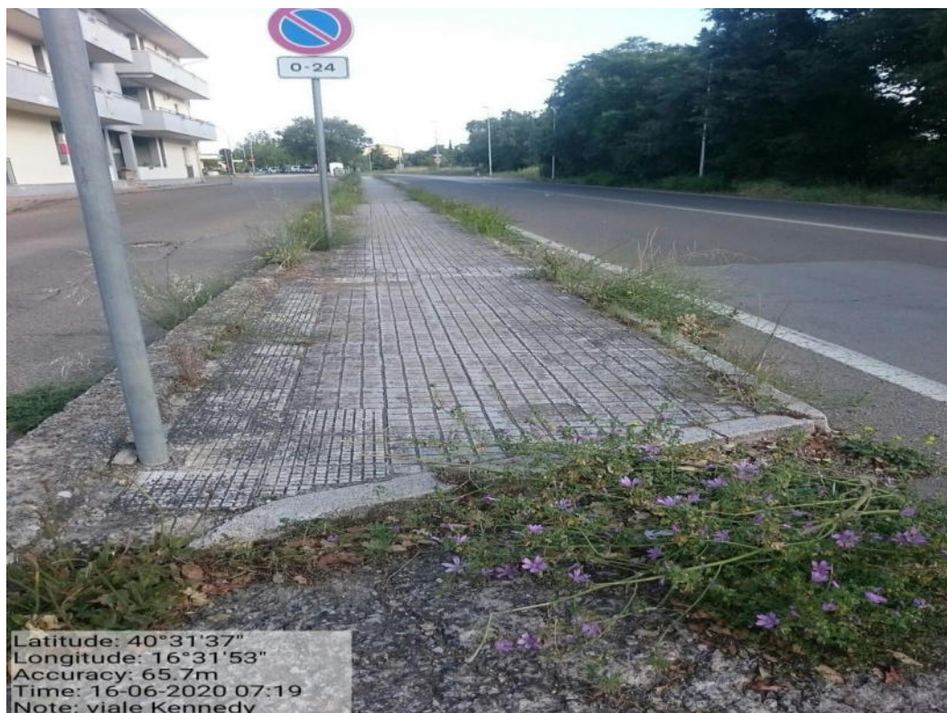
Int. 5.1.6 – Strada comunale V.le Kennedy – Decespugliamento scarpate stradali