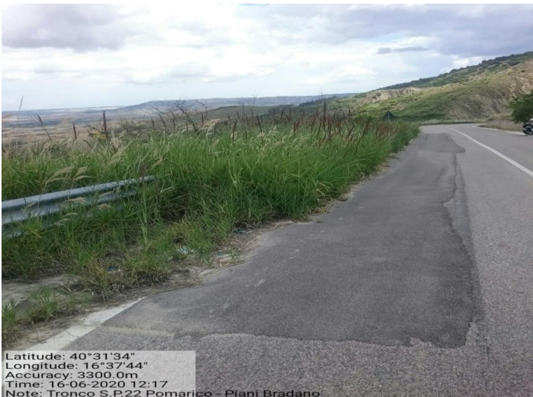
Int. 5.1.8 – Tronco S.p. 22 Piani Bradano - decespugliamento scarpate stradali