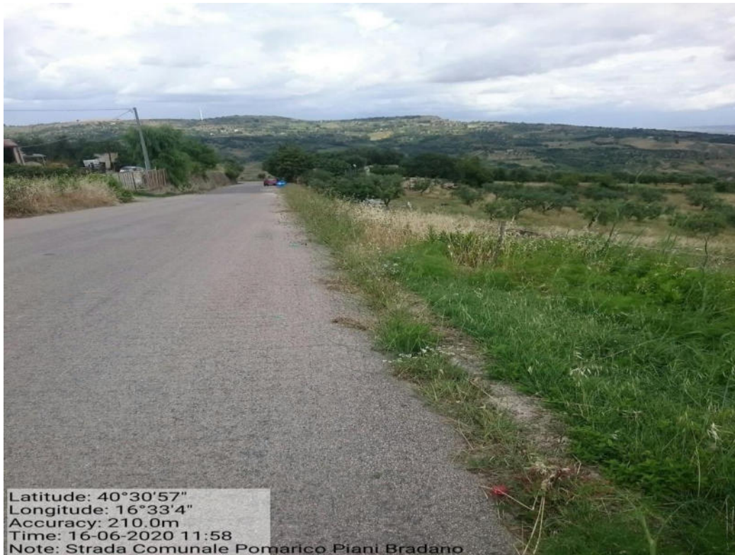
Int. 5.1.7 – Strada Comunale Pomarico – Piani Bradano – decespugliamento scarpate stradali