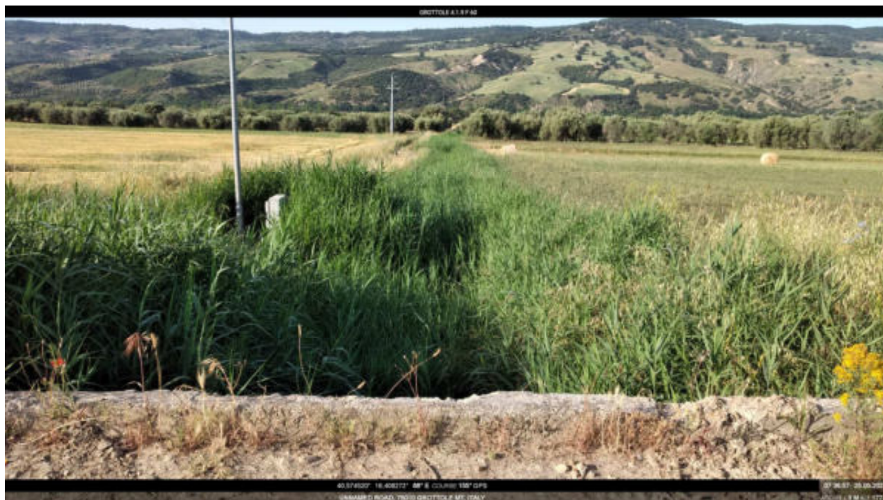
Intervento 4.1.9 Grottole F.60 Canale 9 Ischia Basento Lat. 40.574520 Lon. 16.408272 FOTO N.19