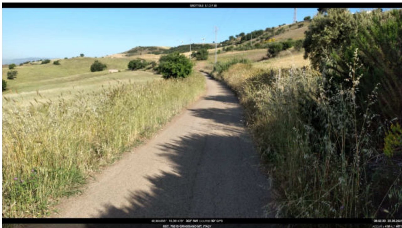
Intervento 5.1.2 Grottole Fg.38 Strada Comunale Fonatana di Lupo Lat.40.604355 Lon.16.361479 FOTO N.22