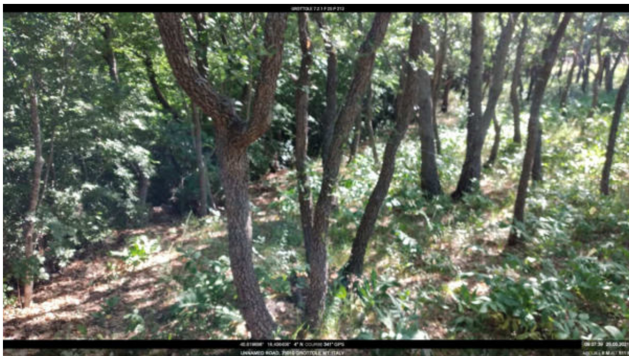
Intervento 7.2.1 Grottole Fg.25 part.212 Bosco Coste Lat.40.619698 Lon.16.406406 FOTO N.36