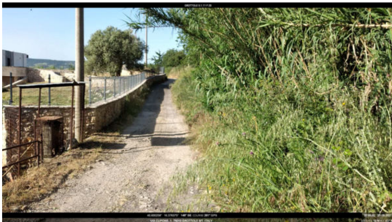
Intervento 5.1.11 Grottole Fg.20- Starda Comunale Cupone e Fontana dei Fichi Lat. 40.600258 Lon.16.376375 FOTO N.31