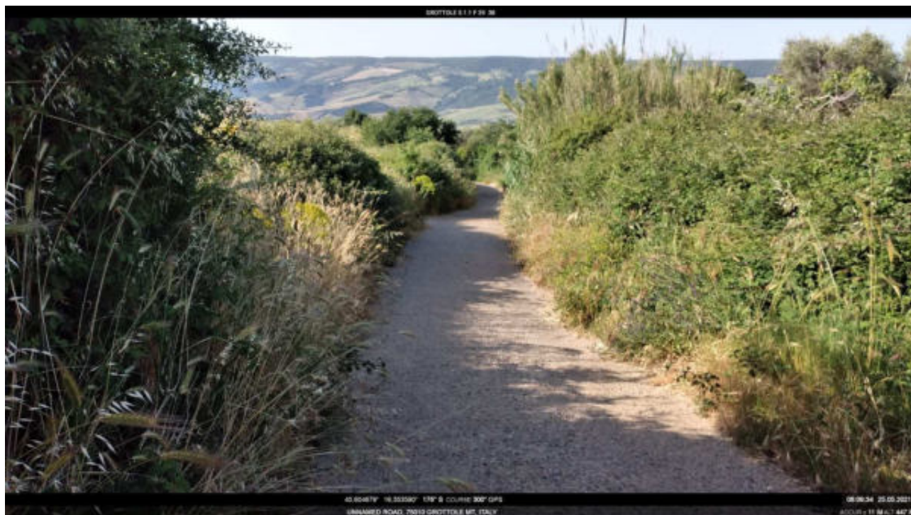
Intervento 5.1.1 Grottole Fg.39-38 Strada Comunale Fonatana di Lupo – Garrambone Lat. 40.604679 Lon. 16.353590 FOTO N.21