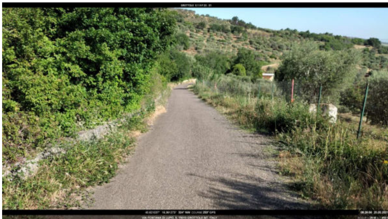
Intervento 5.1.9 Grottole Fg.20-31 Starda Comunale Cerreta Lat.621037 40. Lon. 16.361273 FOTO N.29