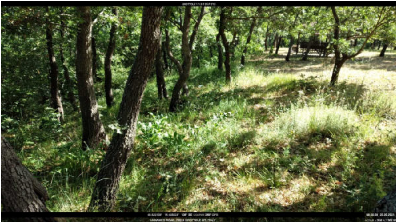
Intervento 1.1.2 Grottole Fg.25 part.212 Bosco Coste Lat. 40.620159 Lon. 16.408028 FOTO N.2