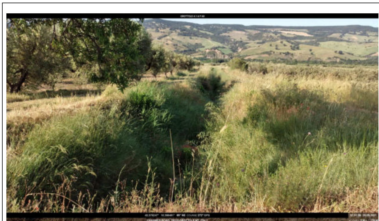
Intervento 4.1.6 Grottole F.60 Canale 6 Ischia Basento Lat. 40.579247 Lon. 16.398481 FOTO N.16