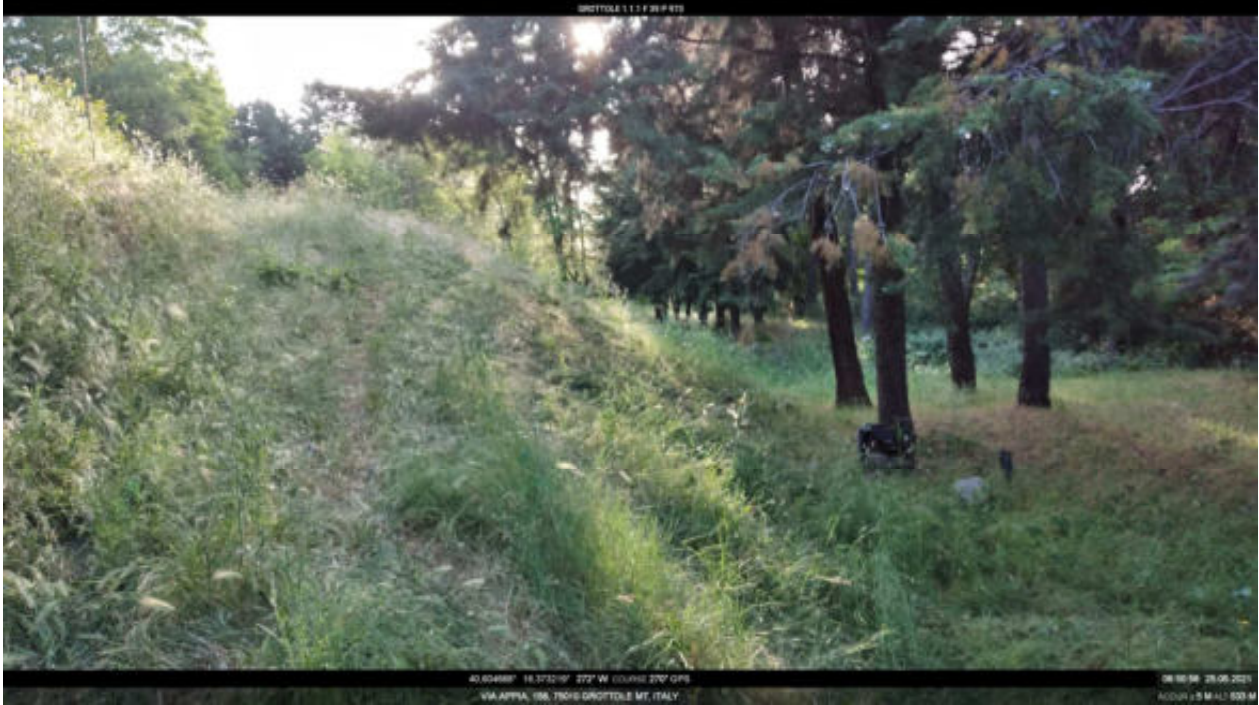
Intervento 1.1.1 Loc. Grottole Fg.39 part.973 -Cappucini Lat. 40.604668 Lon. 16.373219 FOTO N.1