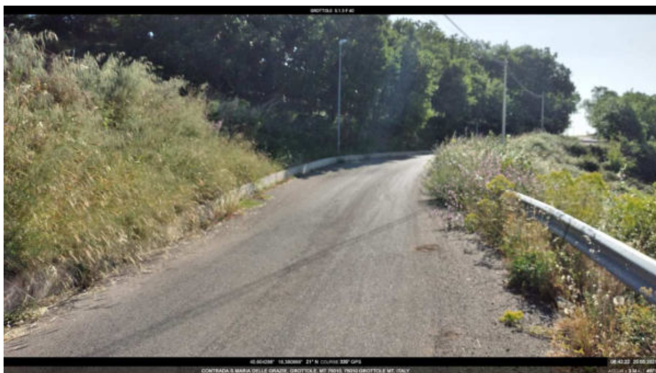
Intervento 5.1.3 Grottole F.40 Strada comunale per il Cimitero Lat. 40.604286 Lon. 16.380869 FOTO N.23