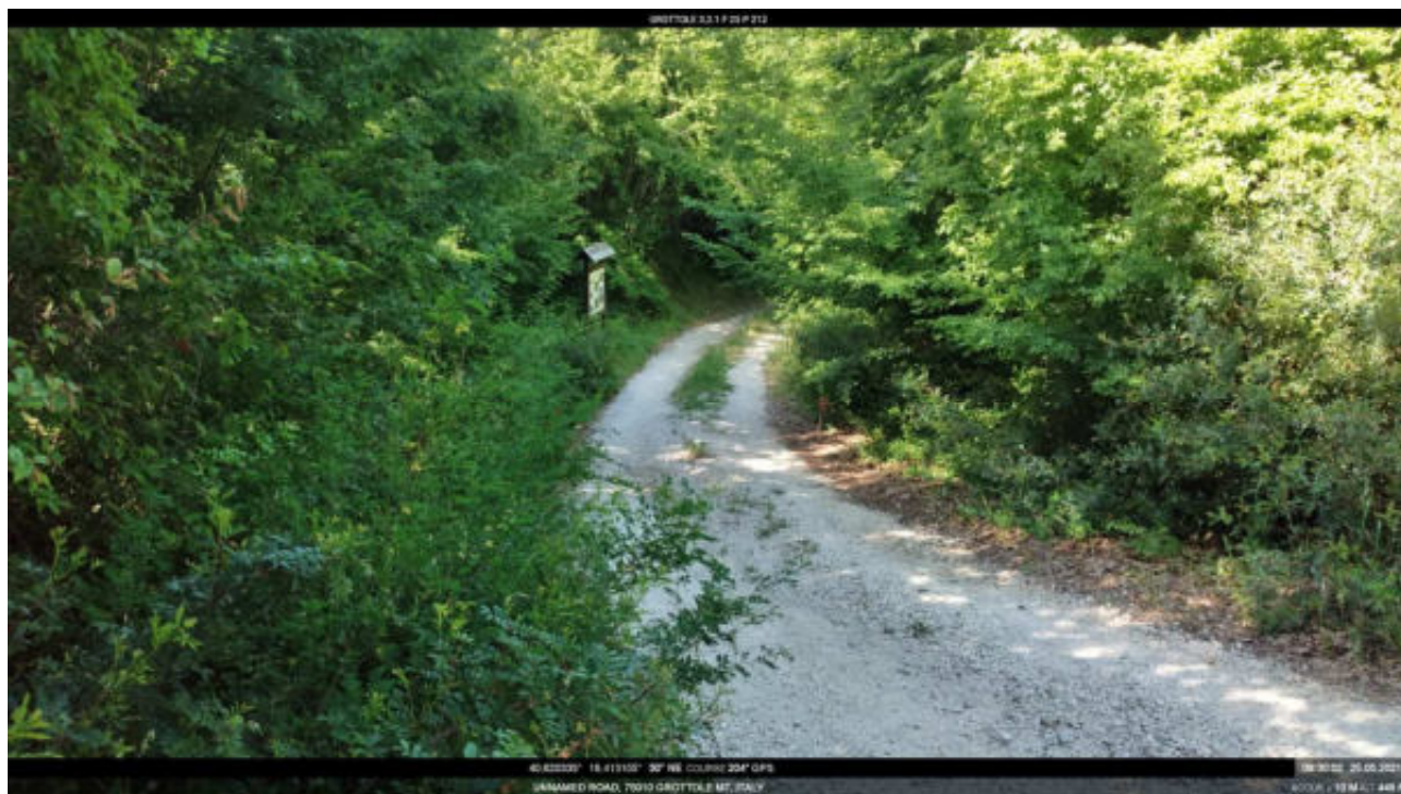
Intervento 3.2.1 Grottole Grottole F.25 Part.212 Loc. Coste Lat. 40.620335 Lon.16.413105 FOTO N.9