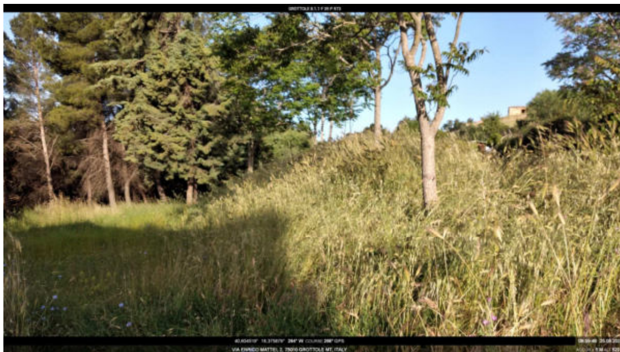
Intevento 8.1.1 Grottole Fg.39 part.973 Cappuccini Lat.40.604519 Lon.16.375879 -FOTO N.40