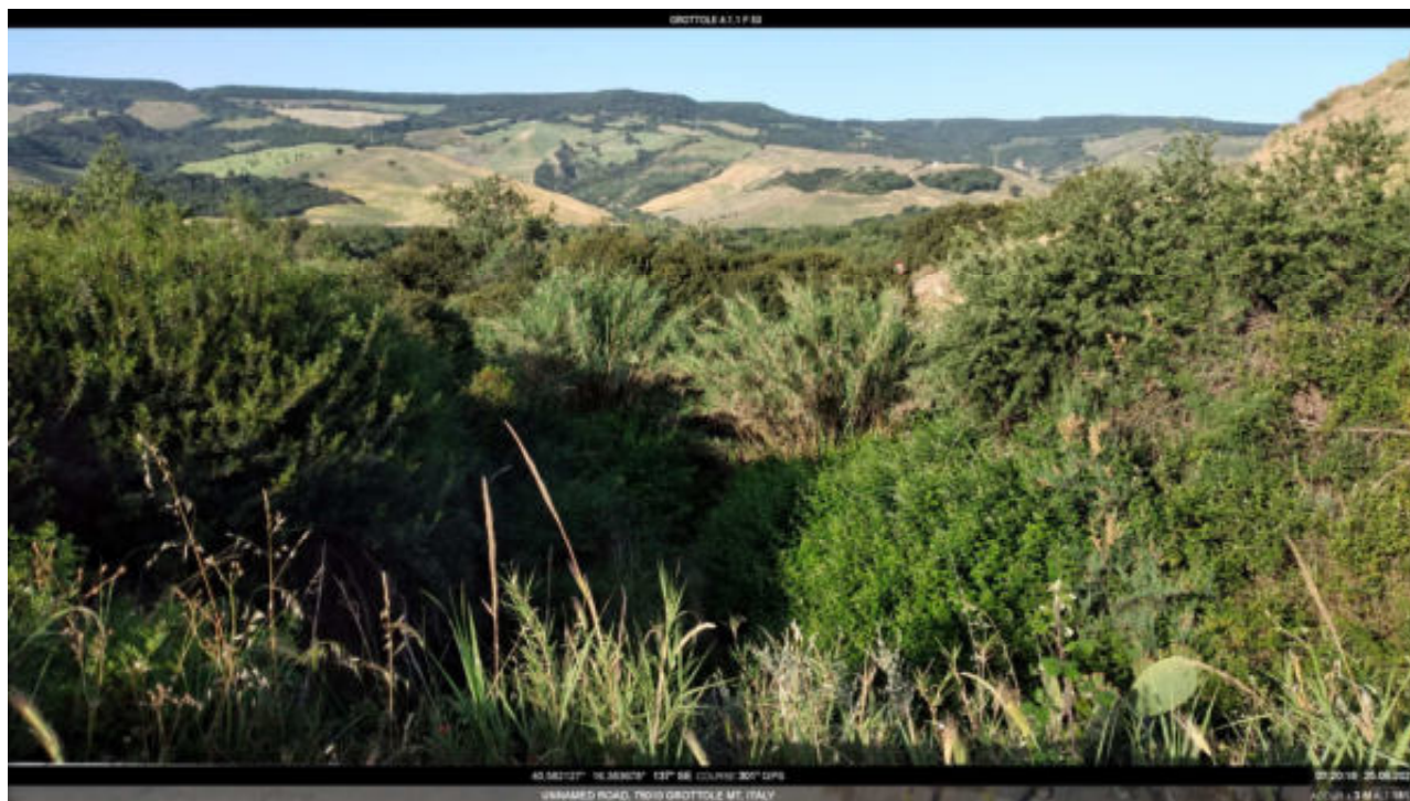
Intervento 4.1.1 Grottole F.53 Canale 1 Ischia Basento Lat. 40.582127 Lon. 16.383678 FOTO N.11