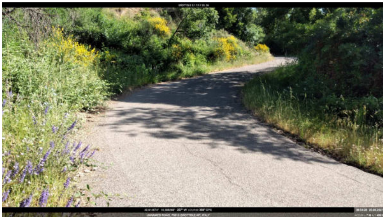
Intervento 5.1.12 Grottole Fg.35-36 part.Strade - Starda Comunale Pietrarola - Bosco Coste Lat.40.614674 Lon.16.398266