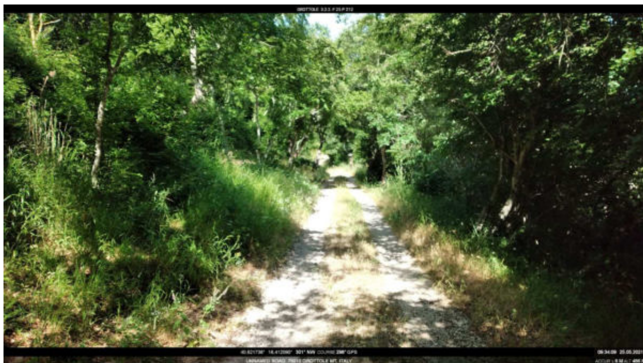
Intervento 3.2.2 Grottole Grottole F.25 Part.212-59 Loc. Coste Lat. 40.621738 Lon. 16.412090 FOTO N.10