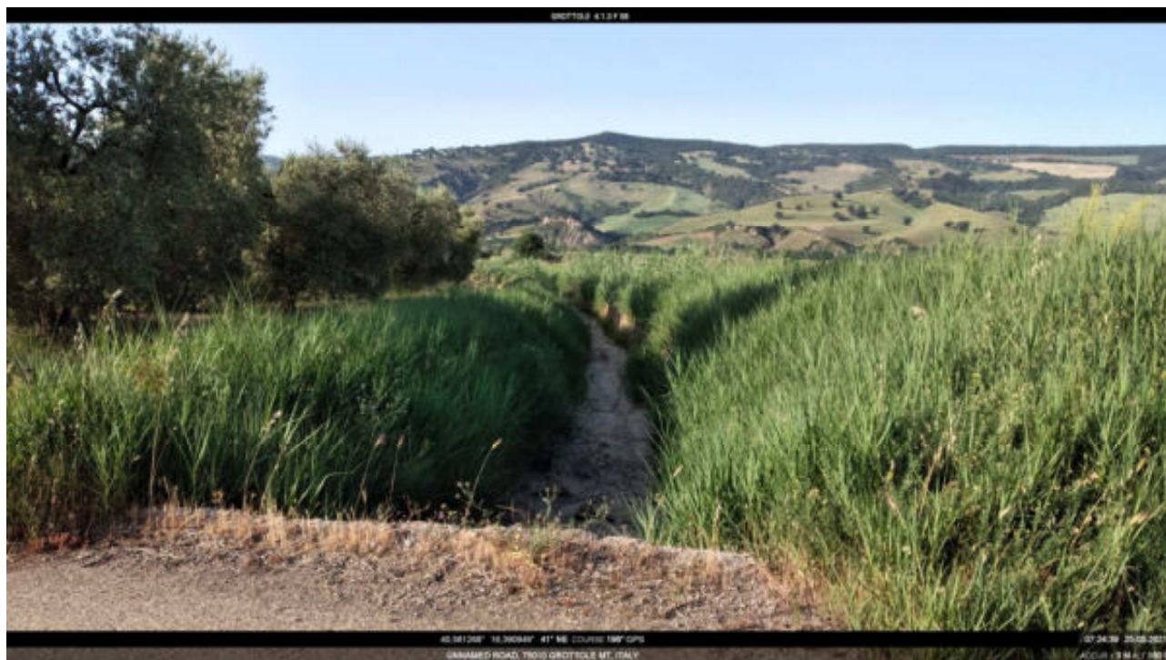
Intervento 4.1.3 Grottole F.58 Canale 3 Ischia Basento Lat. 40.581268 Lon. 16.390949 FOTO N.13