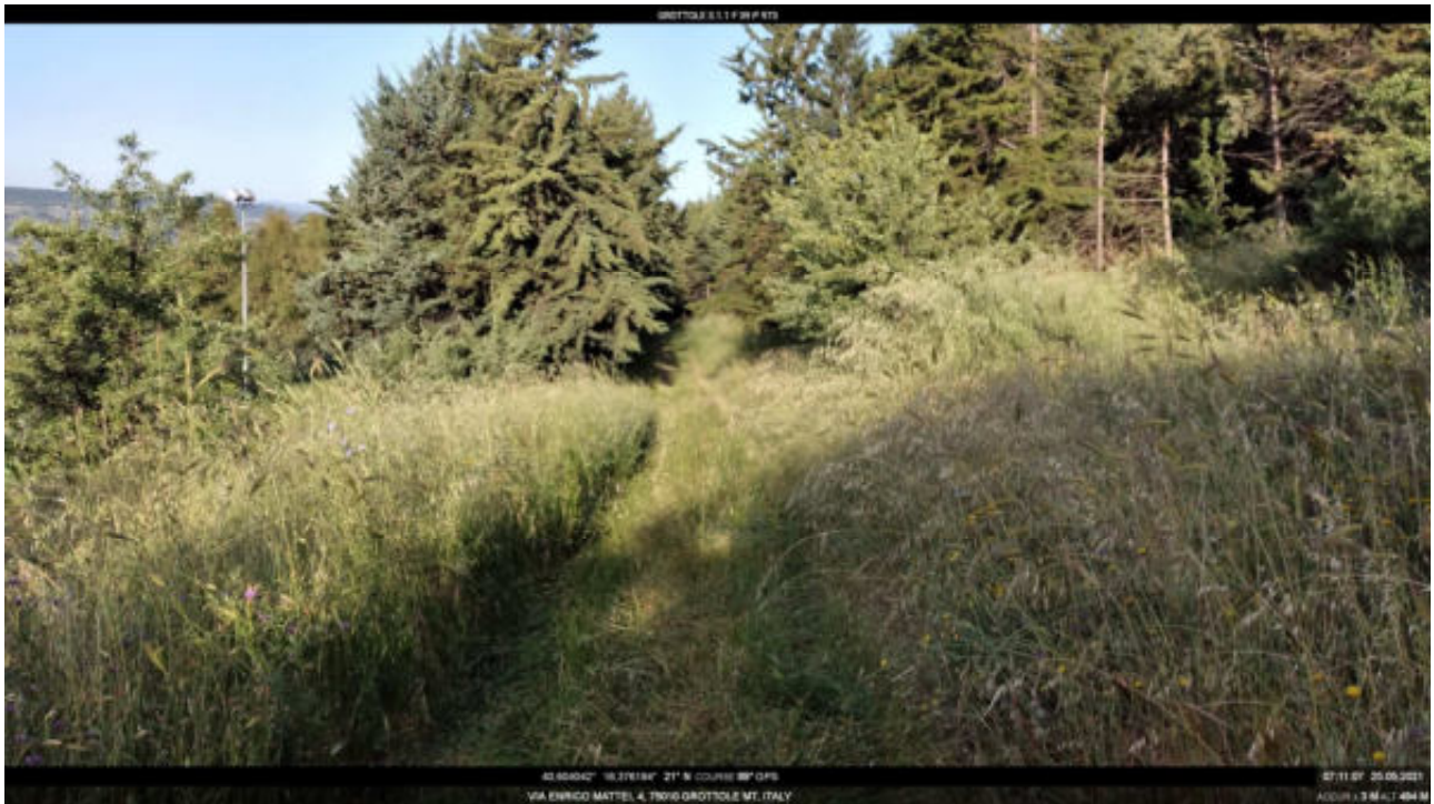
Intervento 3.1.1 Grottole Fg.39 part.973 Loc.Cappuccini Lat. 40.604042. Lon. 16.376194 FOTO N.7