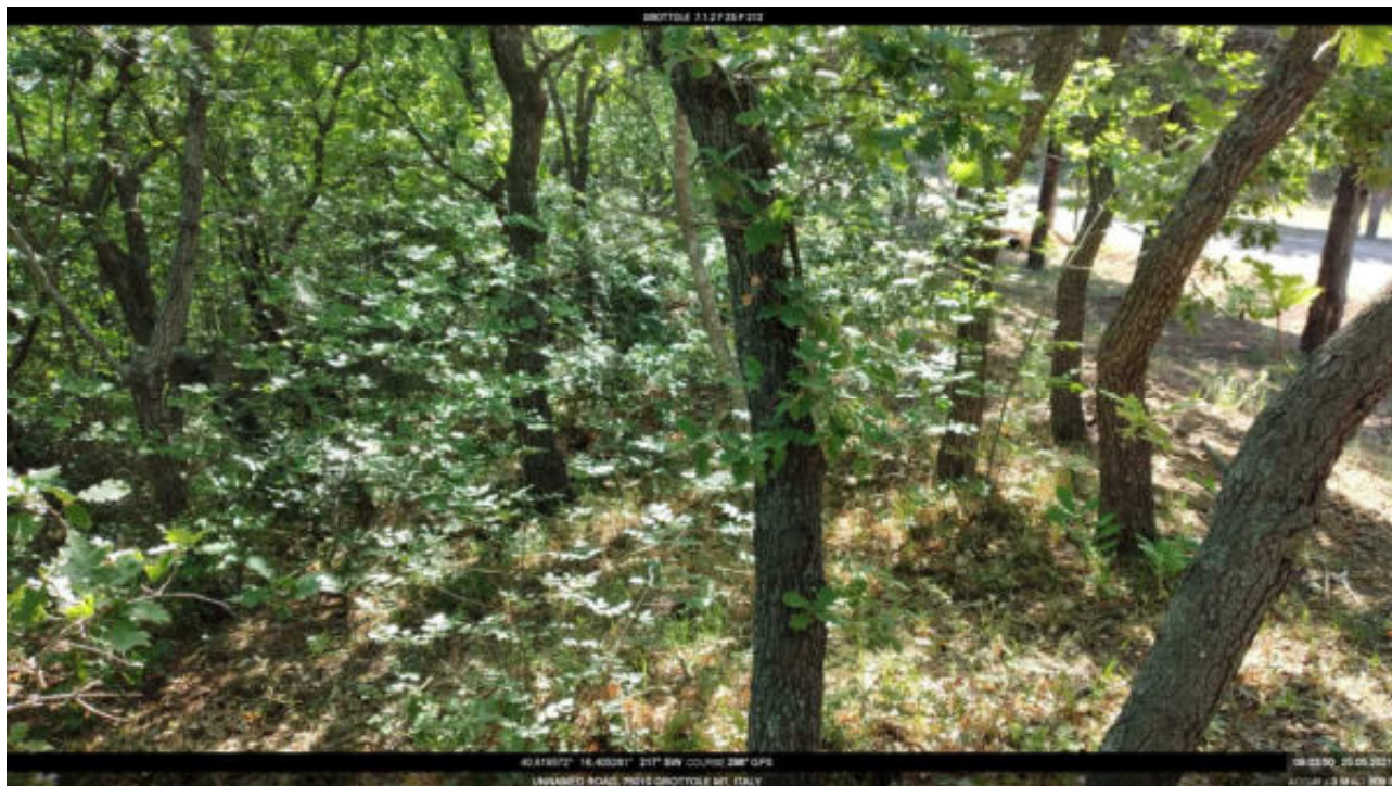
Intervento 7.1.2 Grottole Fg.25 part.212 Bosco Coste Lat.40.619572 Lon.16.405281 FOTO N.34