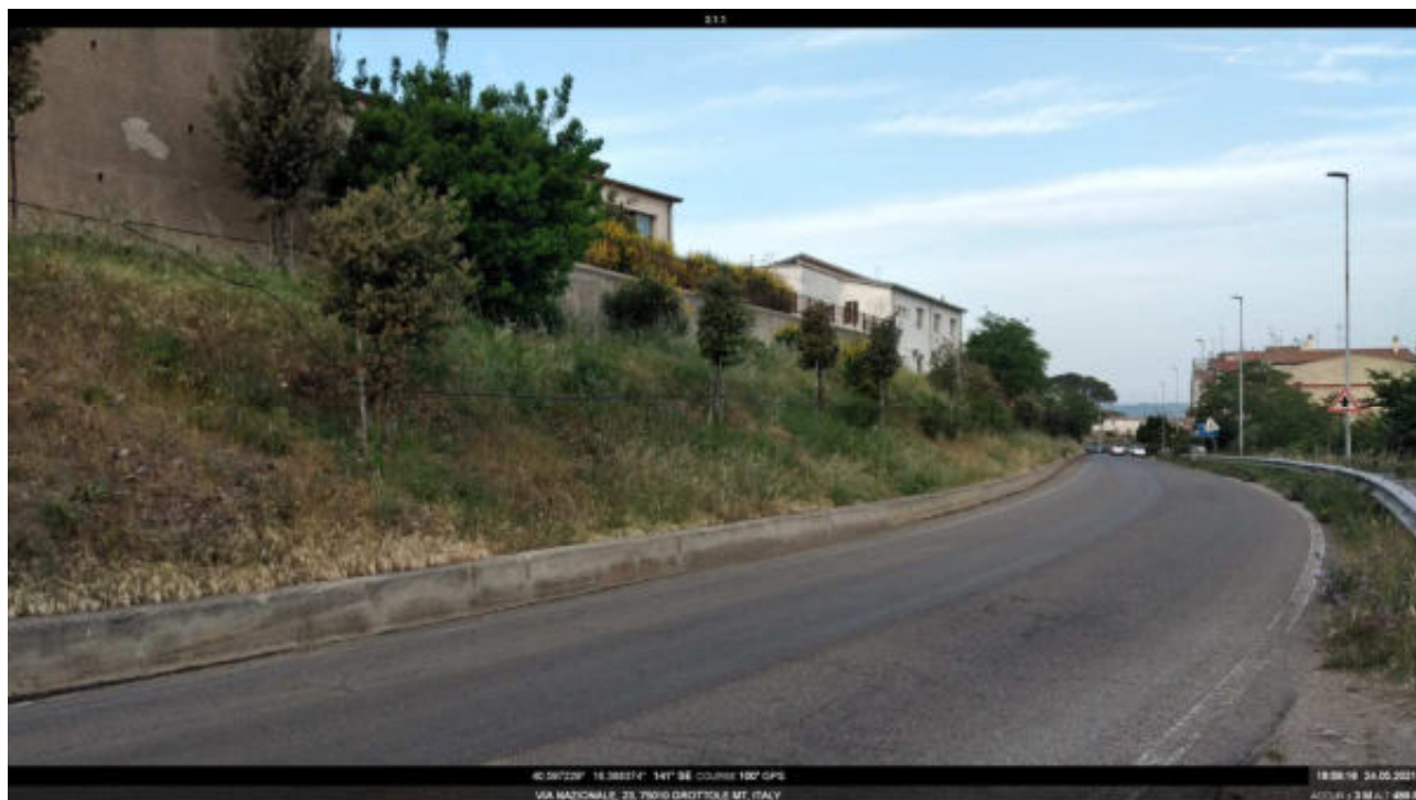
Intervento 2.1.1 Grottole Fg.49-50-39-40 verde urbano e periurbano Lat.40.597229 lon.16.388374 FOTO N.6