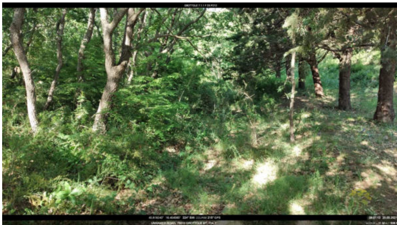
Intervento 7.1.1 Grottole Fg.25 part.212 Bosco Coste Lat.40.619240 Lon.16.404585 FOTO N.33