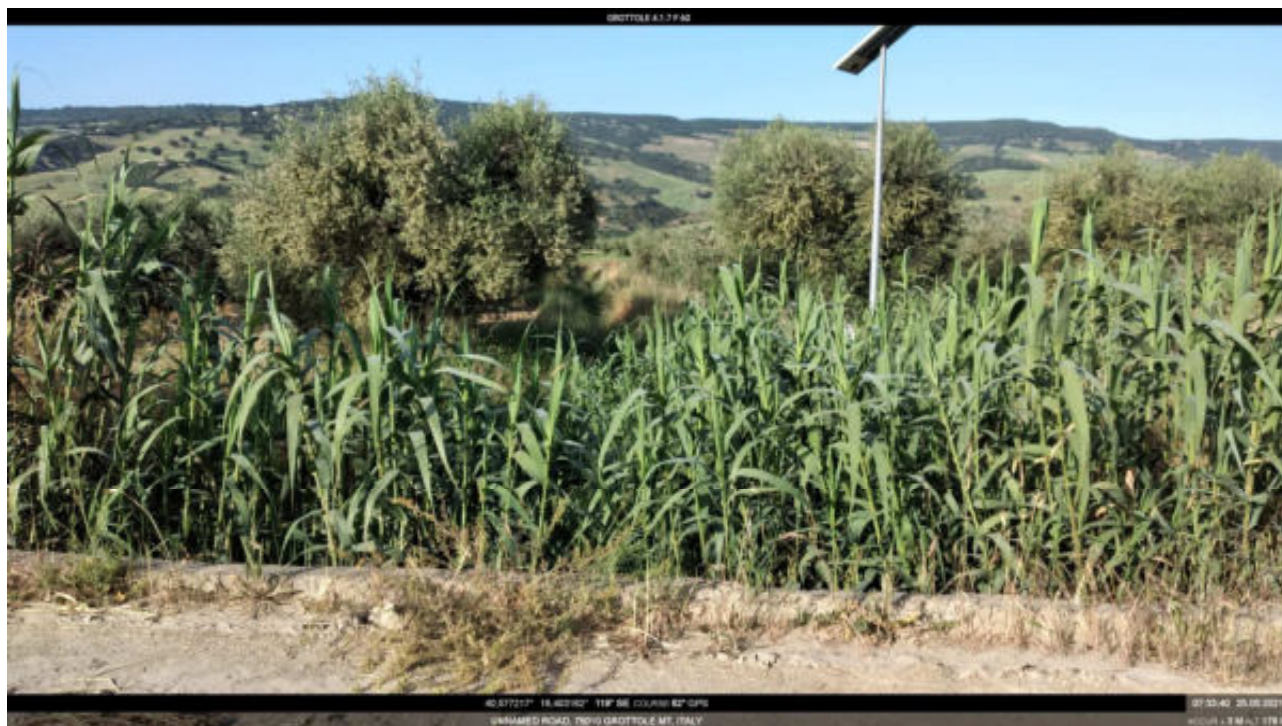
Intervento 4.1.7 Grottole F.60 Canale 7 Ischia Basento Lat. 40.577217 Lon. 16.403162 FOTO N.17