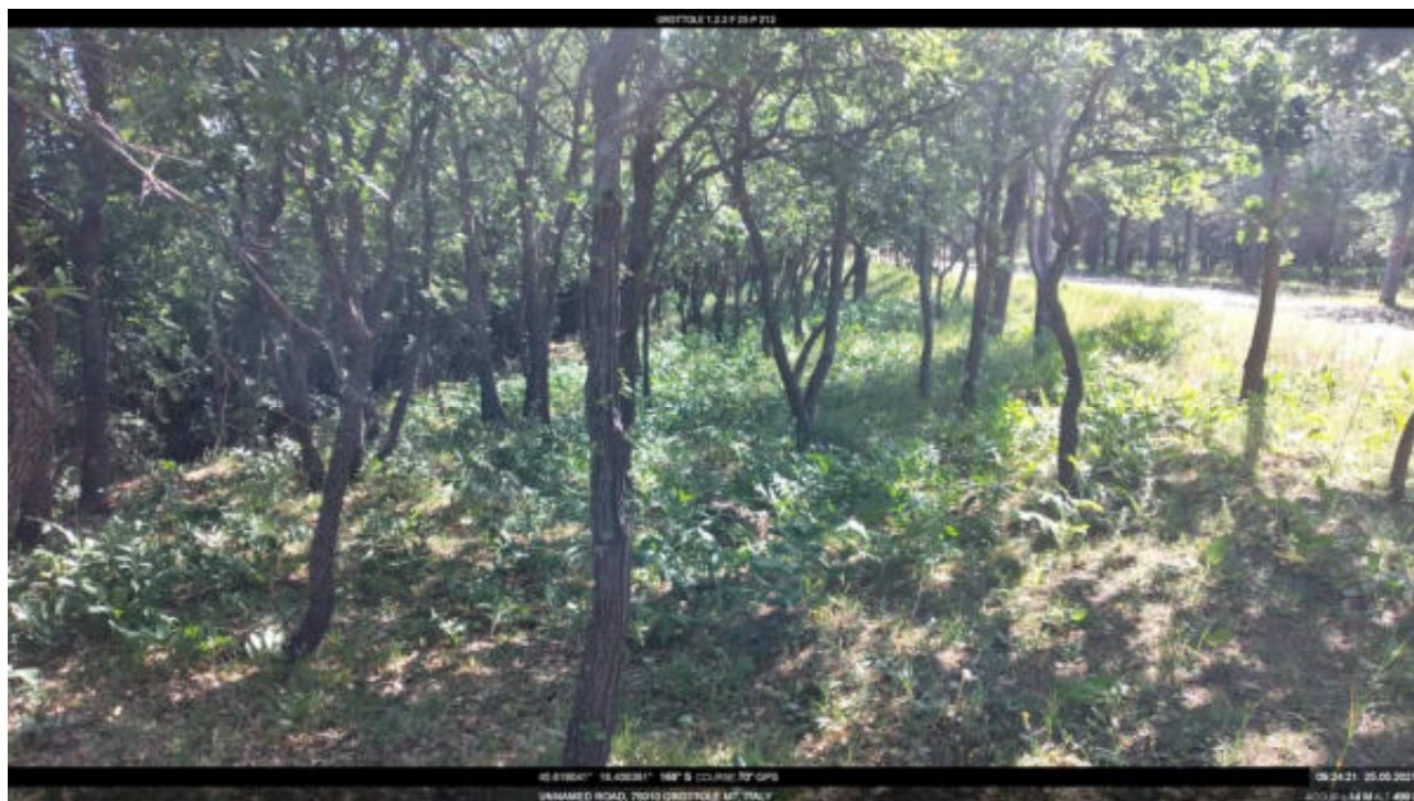
Intervento 1.2.2 Loc. Grottole Fg.25 part.212-Coste Lat. 40.619041 Lon. 16.406361 FOTO N.4