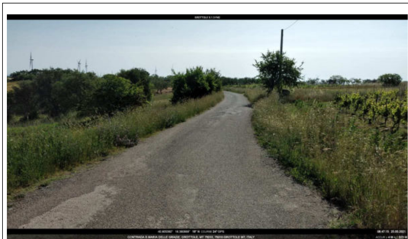
Intervento 5.1.5 Grottole F.40 Strada Comunale Pietrarola Lat. 40.605392 Lon. 16.380888 FOTO N.25