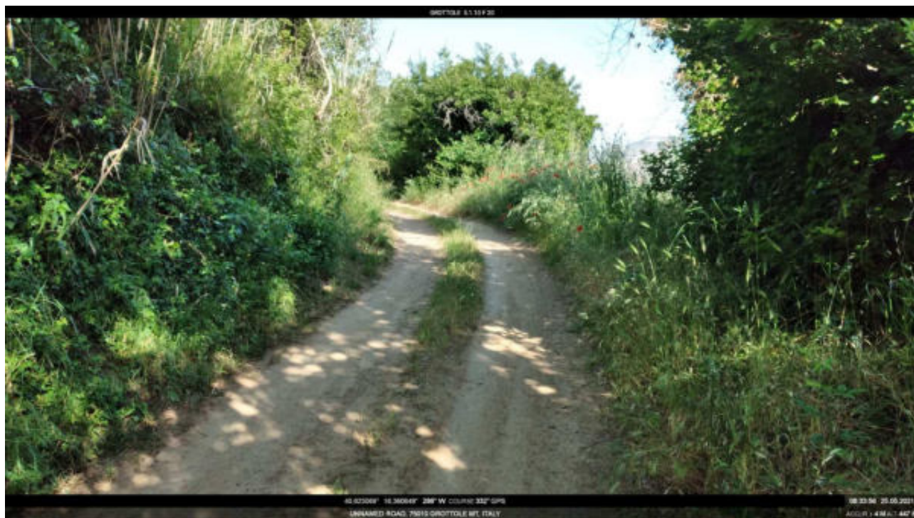
Intervento 5.1.10 Grottole Fg.20- Starda Comunale Cornaleta Lat. 40.625069 Lon.16.360649 FOTO N.30