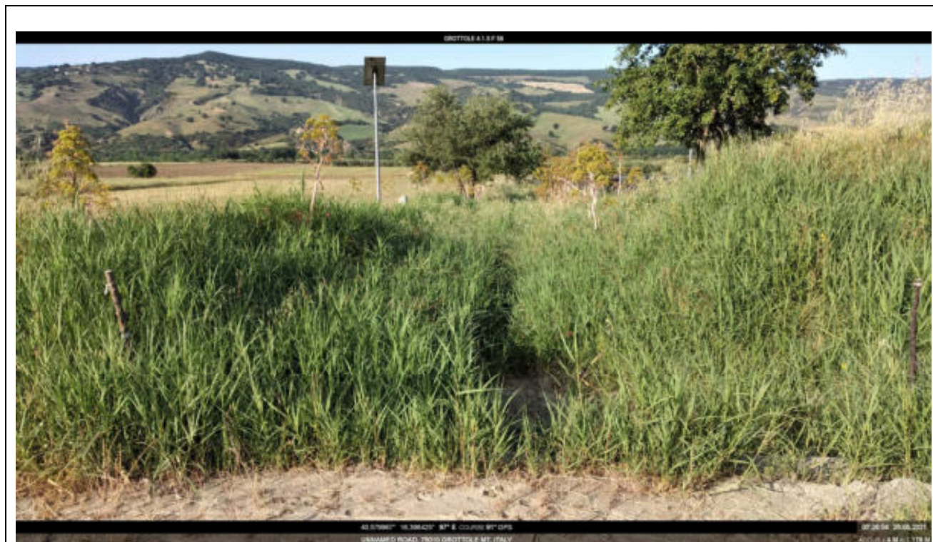
Intervento 4.1.5 Grottole F.58 Canale 5 Ischia Basento Lat. 40.579967 Lon. 16.396425 FOTO N.15