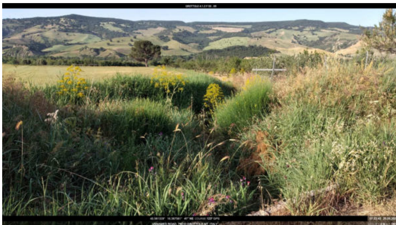
Intervento 4.1.2 Grottole F.53-58 Canale 2 Ischia Basento Lat.40.581329 Lon.16.387581 FOTO N.12