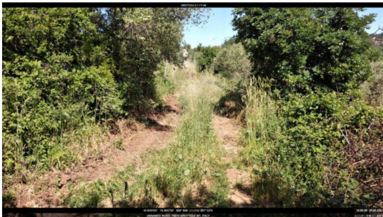
Intervento 5.1.7 Grottole Fg.40 Starda Comunale Vignale diramazione Lat. 40.606350 Lon. 16.393759 FOTO N.27