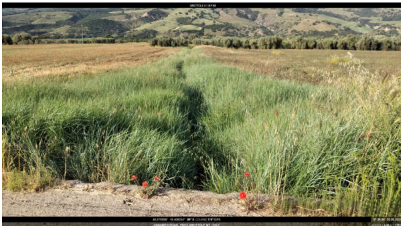
Intervento 4.1.8 Grottole F.60 Canale 8 Ischia Basento Lat.40.575558 Lon.16.406335 FOTO N.18