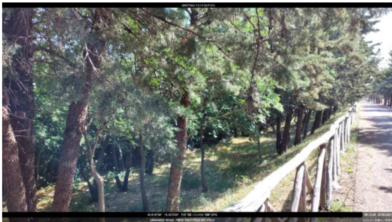
Intervento 7.3.1 Grottole Fg.25 part.212 Bosco Coste Lat.40.619736 Lon.16.407200 FOTO N.38