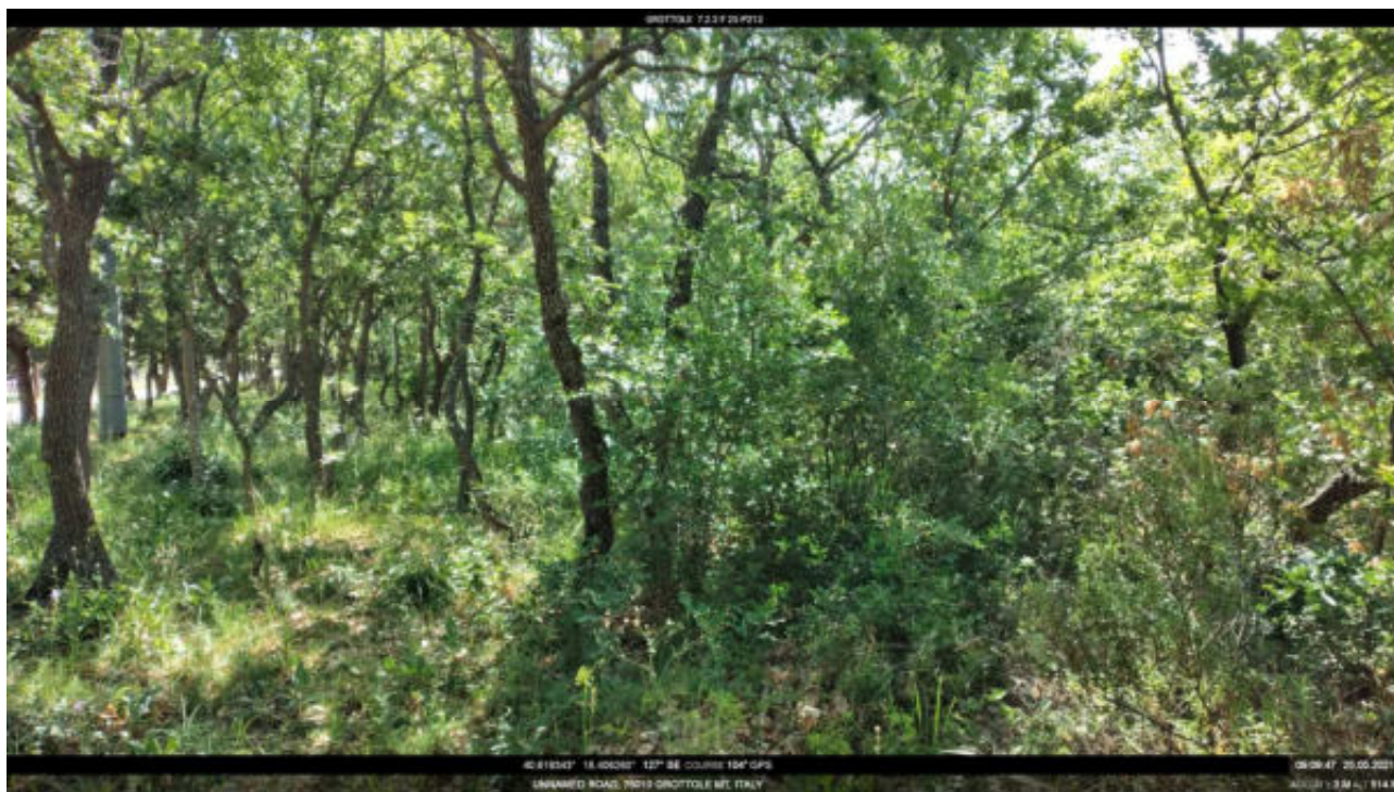
Intervento 7.2.2 Grottole Fg.25 part.212 Bosco Coste Lat.40.619343 Lon.16.406260 FOTO N.37