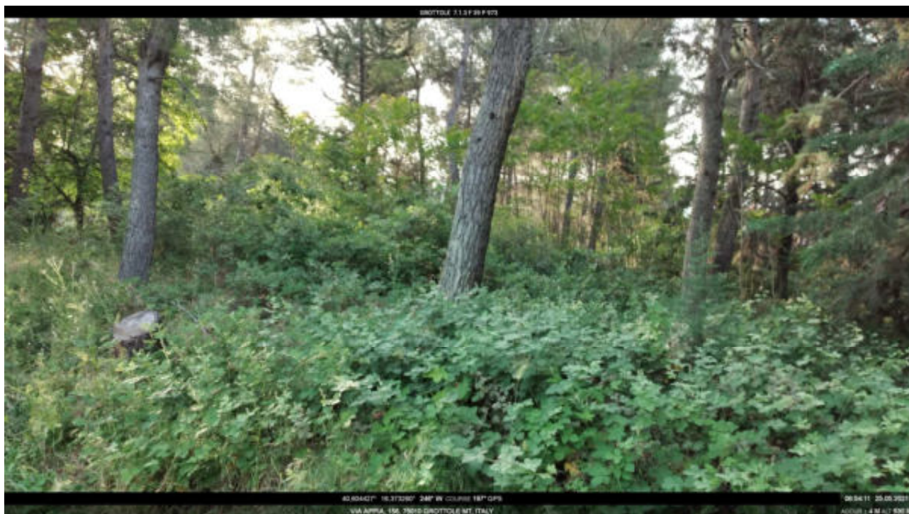
Intervento 7.1.3 Grottole Fg.39 part.973 Cappuccin Lat.40.604427 Lon.16.373260 FOTO N.35