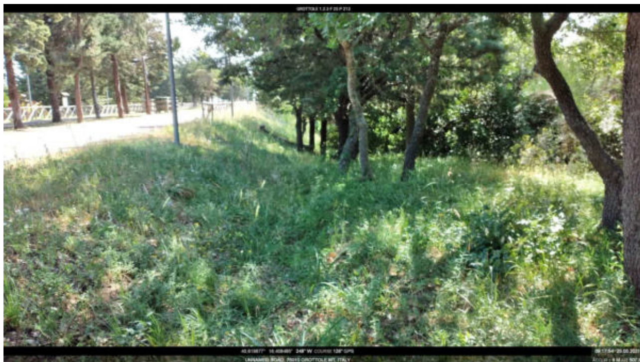
Intervento 1.2.3 Loc. Grottole Fg.25 part.212 -Coste Lat. 40.619877 Lon. 16.408435 FOTO N.5