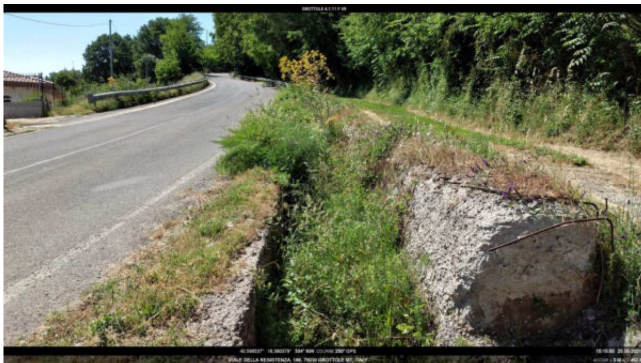
Intervento4.1.11 Grottole F. 59 Strada comunale per Matera Lat. 40.588537 Lon. 16.390379 FOTO N.20