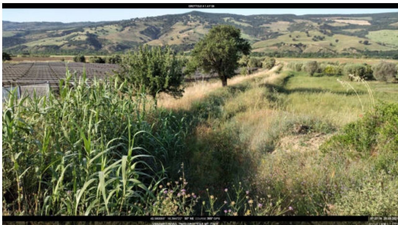
Intervento 4.1.4 Grottole F.58 Canale 4 Ischia Basento Lat. 40.580093 Lon. 16.394722 FOTO N.14