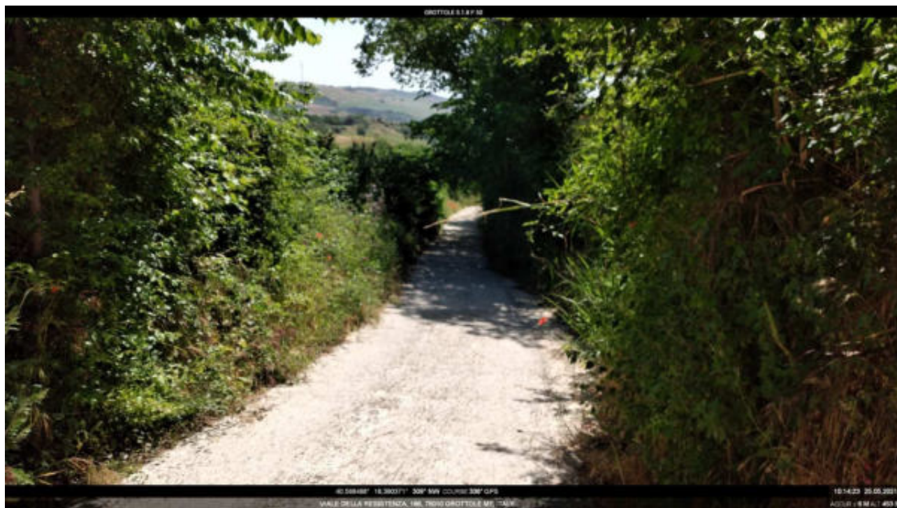
Intervento 5.1.8 Grottole Fg.50 Starda Comunale Peschiera Lat.40.598488 Lon. 16.390371 FOTO N.28