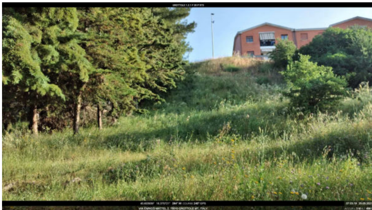
Intervento 1.2.1 Loc. Grottole Fg.39 part.973 -Cappuccini Lat. 40.603939 Lon. 16.375721 FOTO N.3