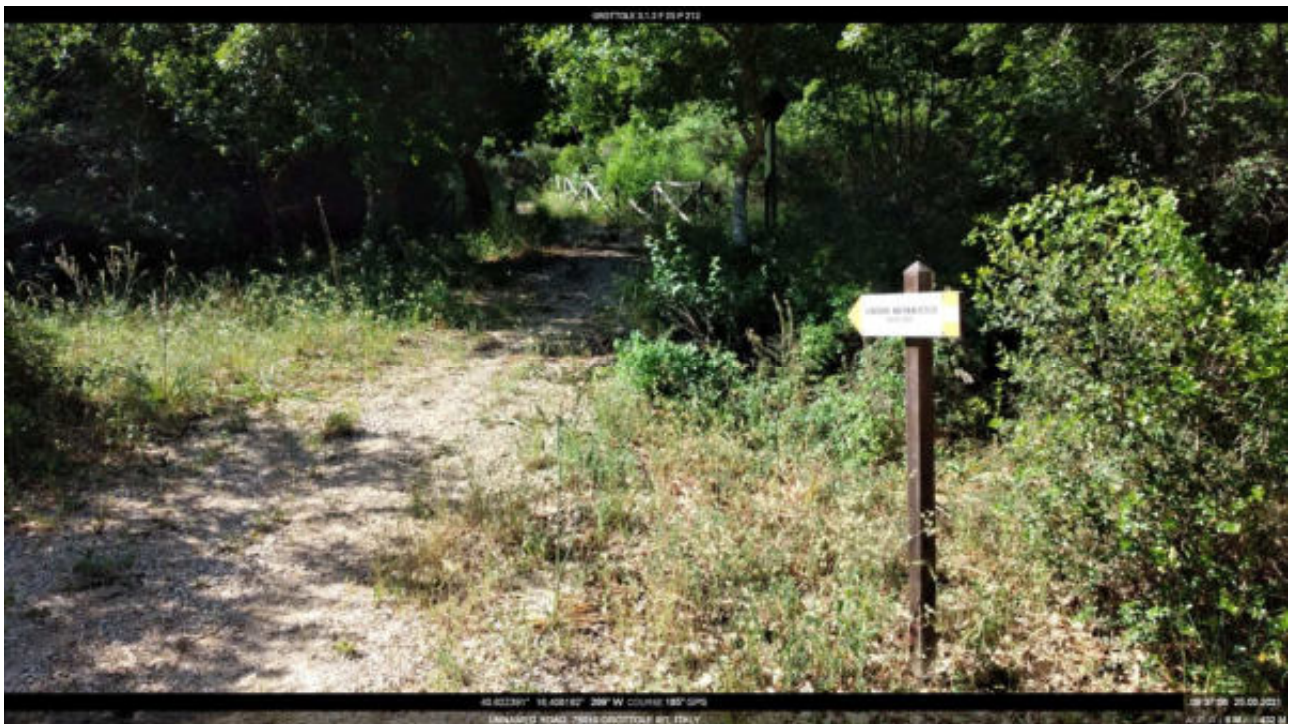
Intervento 3.1.2 Grottole Fg.25 part.212 Loc.Coste Lat. 40.622391. Lon. 16.408192 FOTO N.8