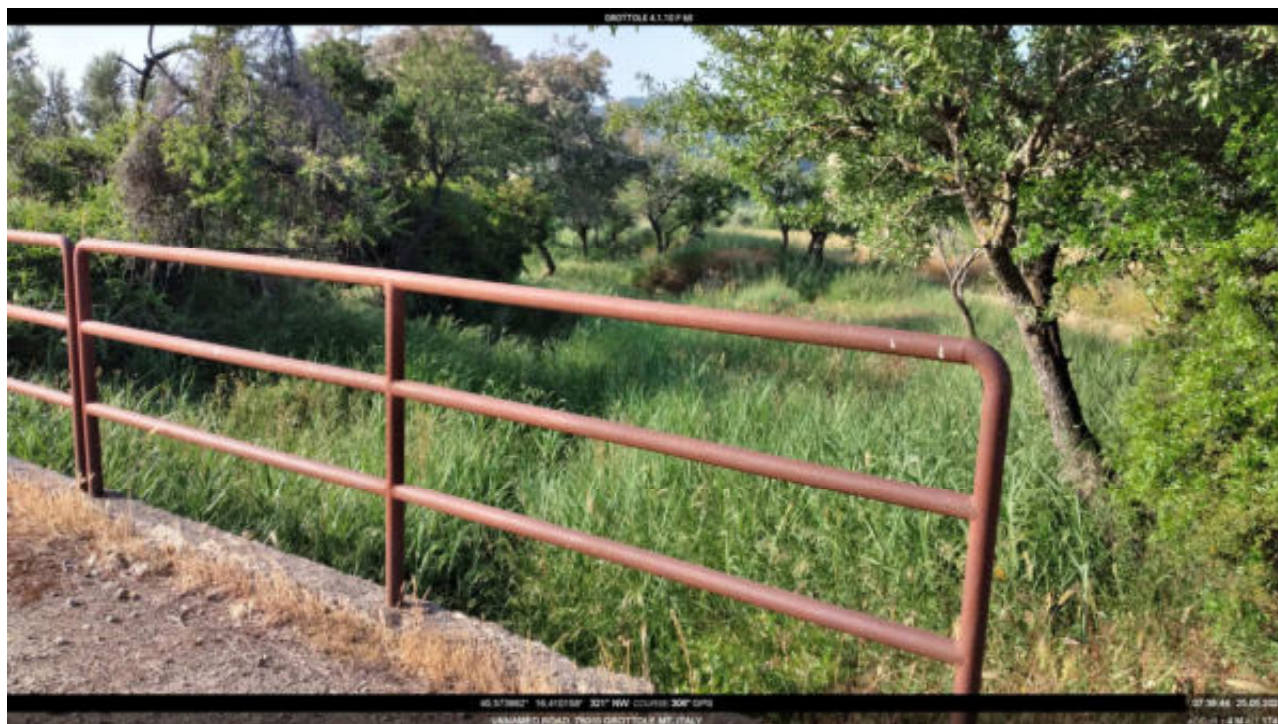
Intervento 4.1.10 Grottole F.60 Canale 10 Ischia Basento Lat. 40.473882 Lon. 16.410158 FOTO N.20