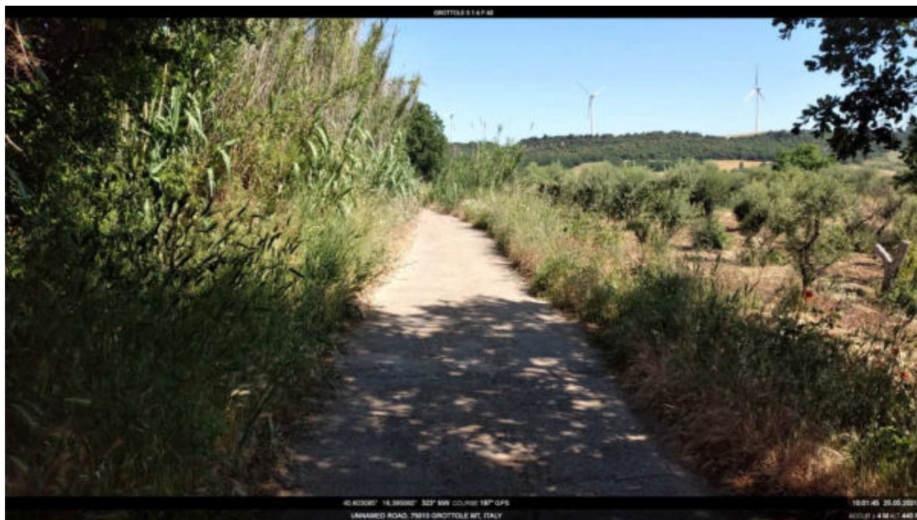
Intervento 5.1.6 Grottole Fg.40 Strada Comunale Vignale Lat. 40.603085 Lon. 16.395060 FOTO N.25