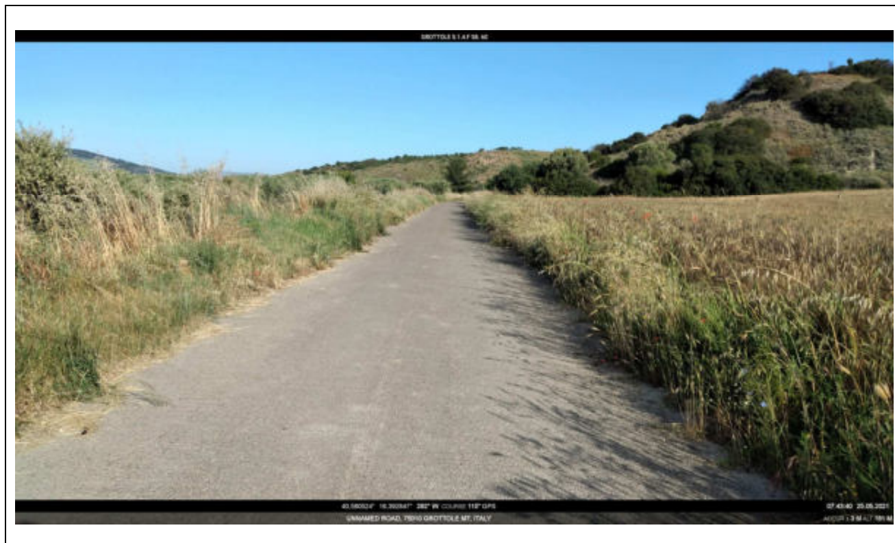
Intervento 5.1.4 Grottole F.58 - 60 Strada Comunale Ischia Basento Lat. 40.580524 Lon. 16.392847 FOTO N.24