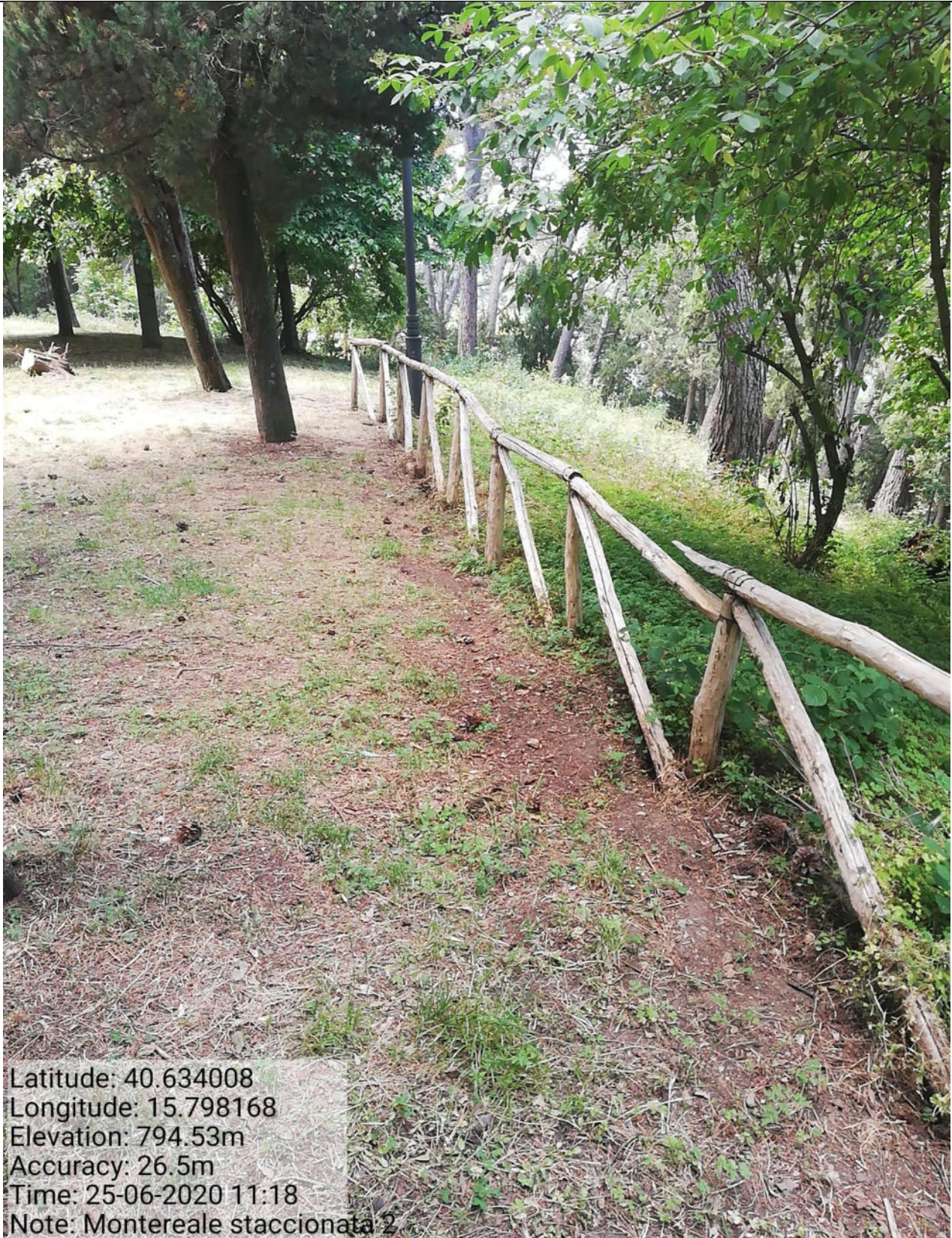
FOTO 6 INT. 8.1.1 Località Montereale