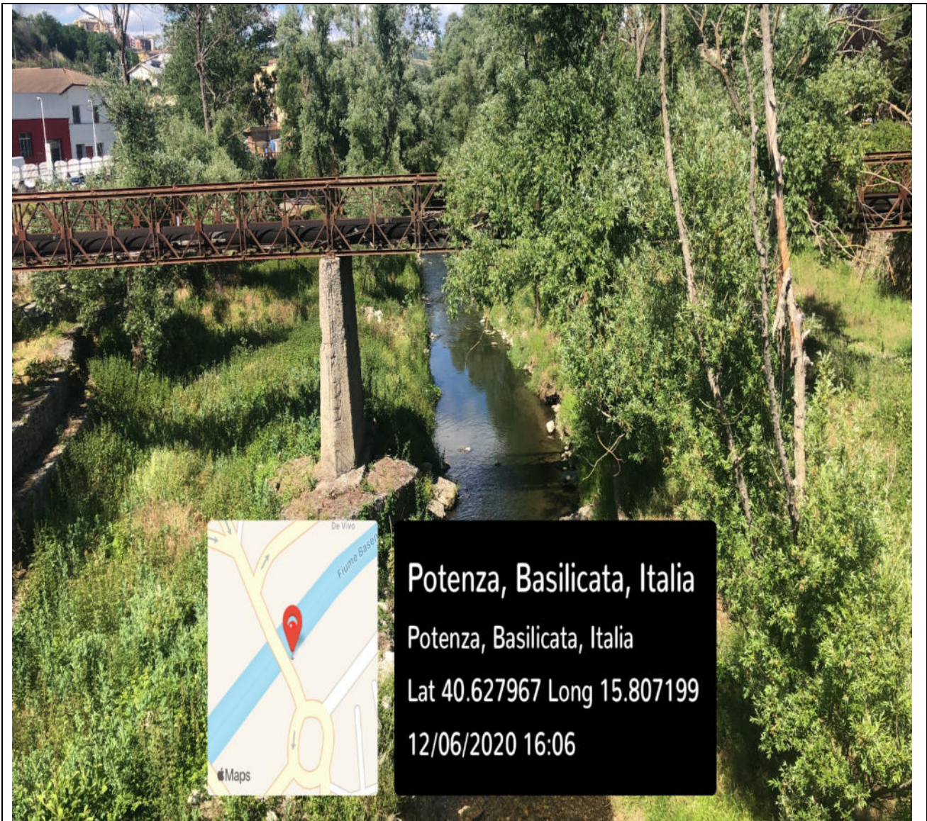
FOTO 8 INT. 4.1.1 Fiume Basento