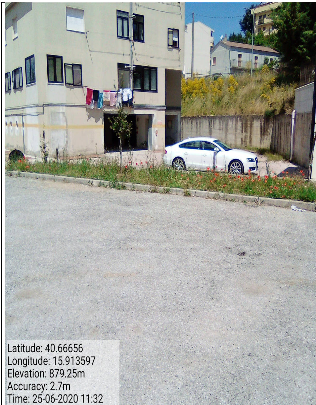
FOTO 2 INT. 2.1.1 Verde urbano