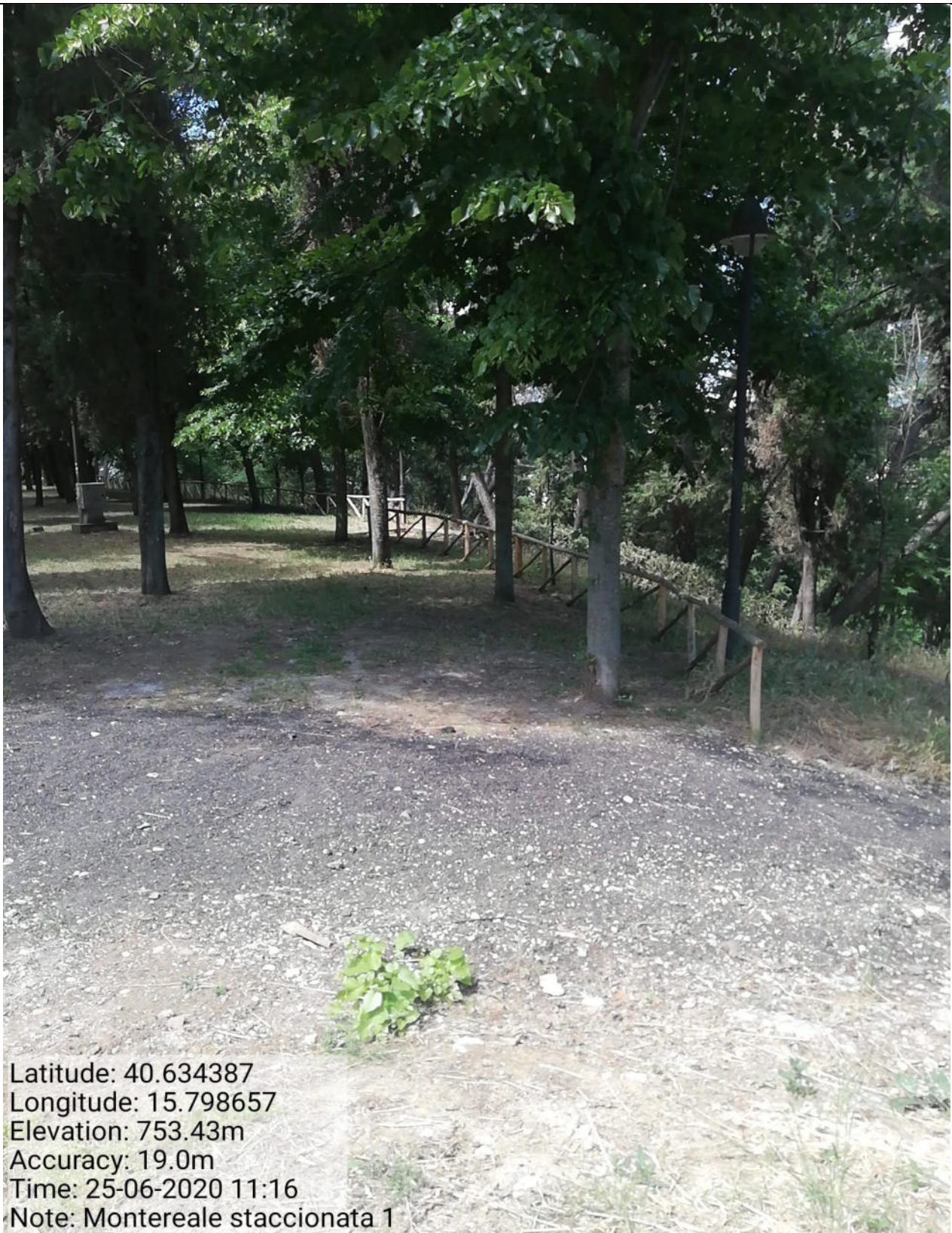
FOTO 7 INT. 8.1.1 Località Montereale