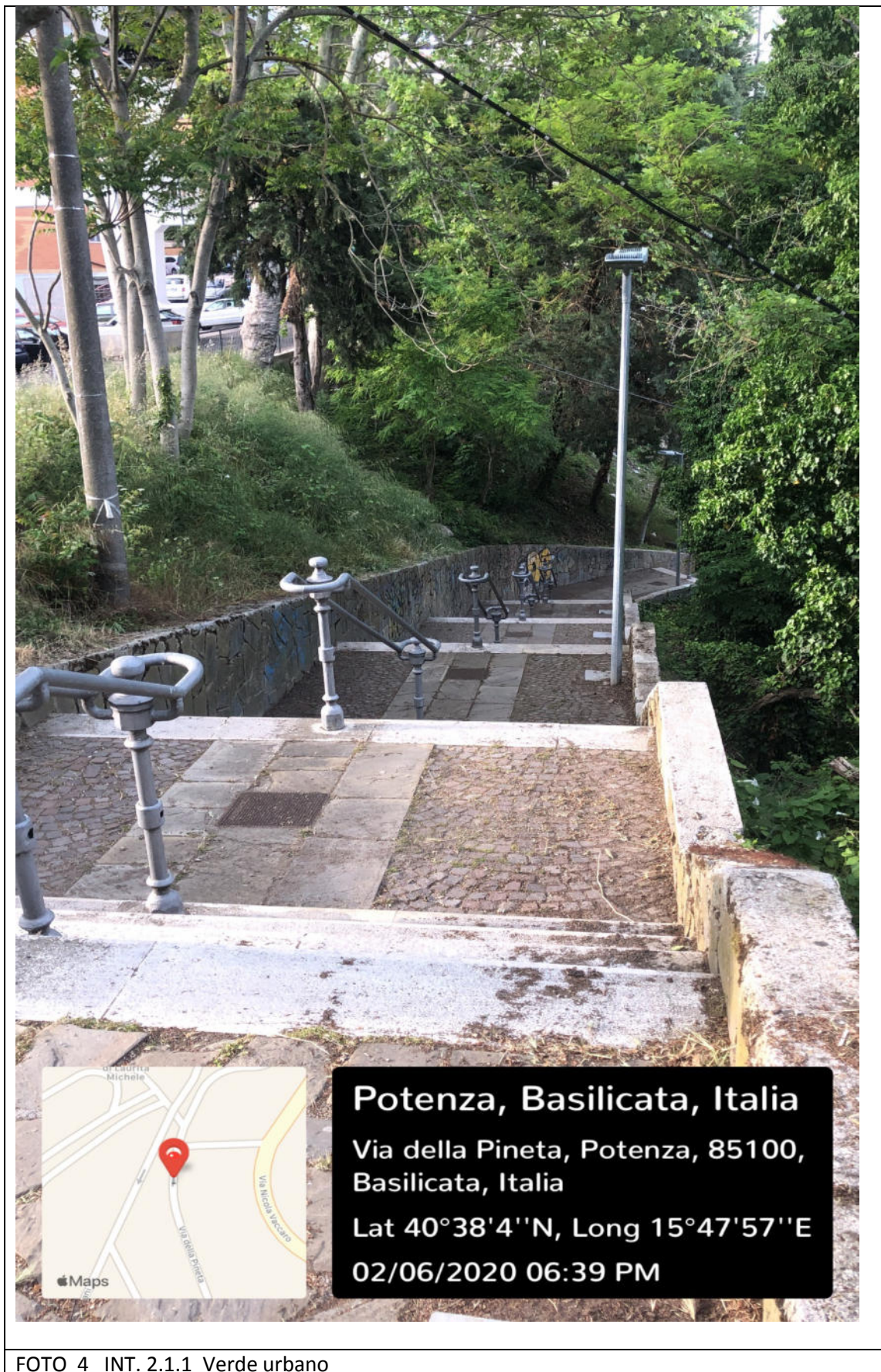
FOTO 4 INT. 2.1.1 Verde urbano