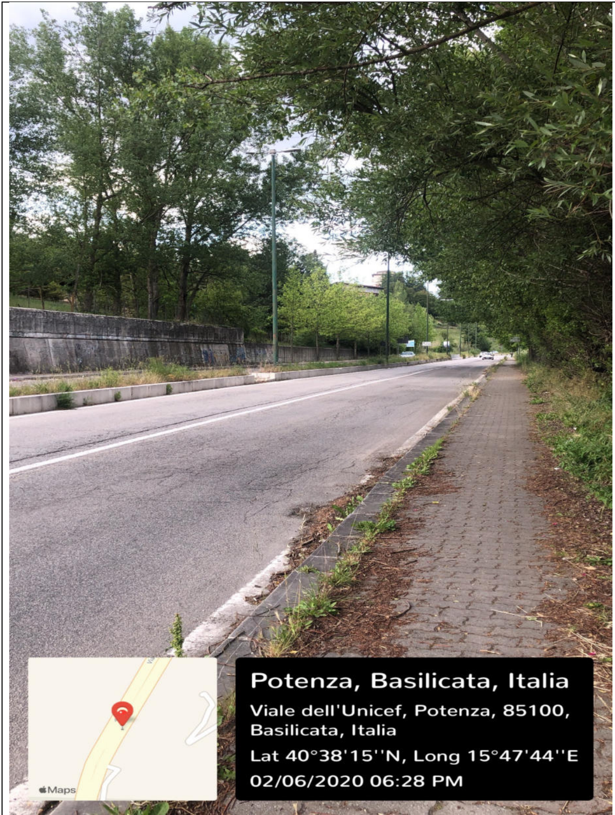
FOTO 3 INT. 5.1.1 Strada Comunale