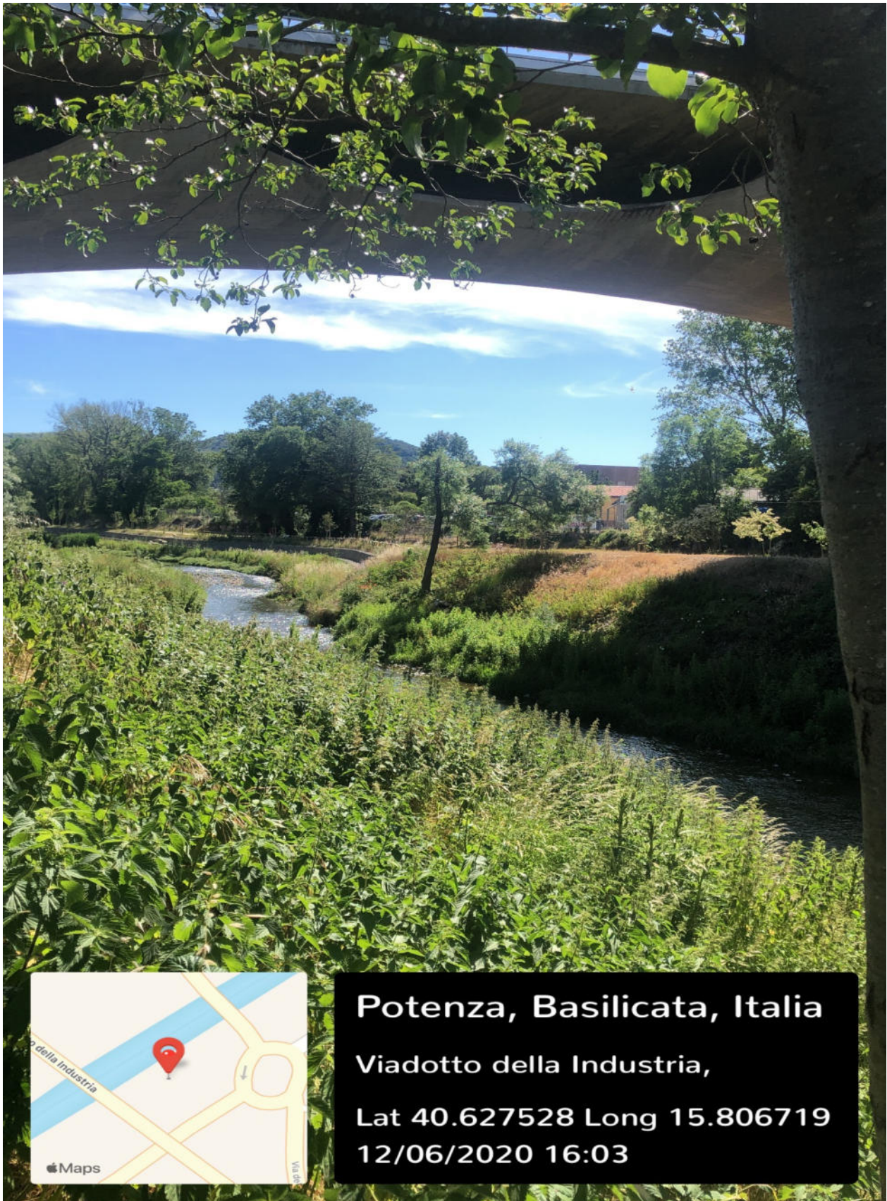
FOTO 5 INT. 4.1.2 Fiume Basento