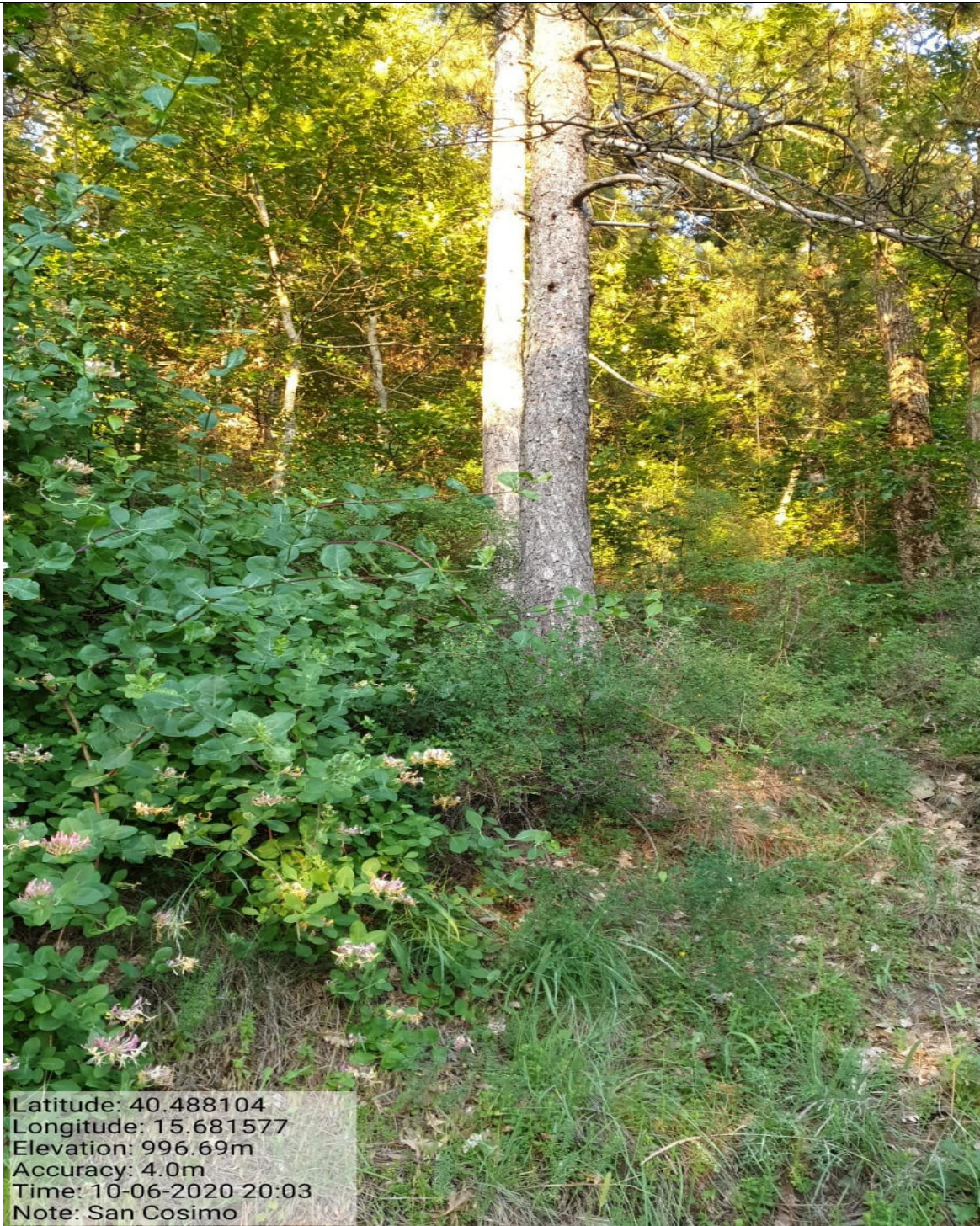
FOTO 4 INT. 3.1..2 Loc.tà San Cosimo