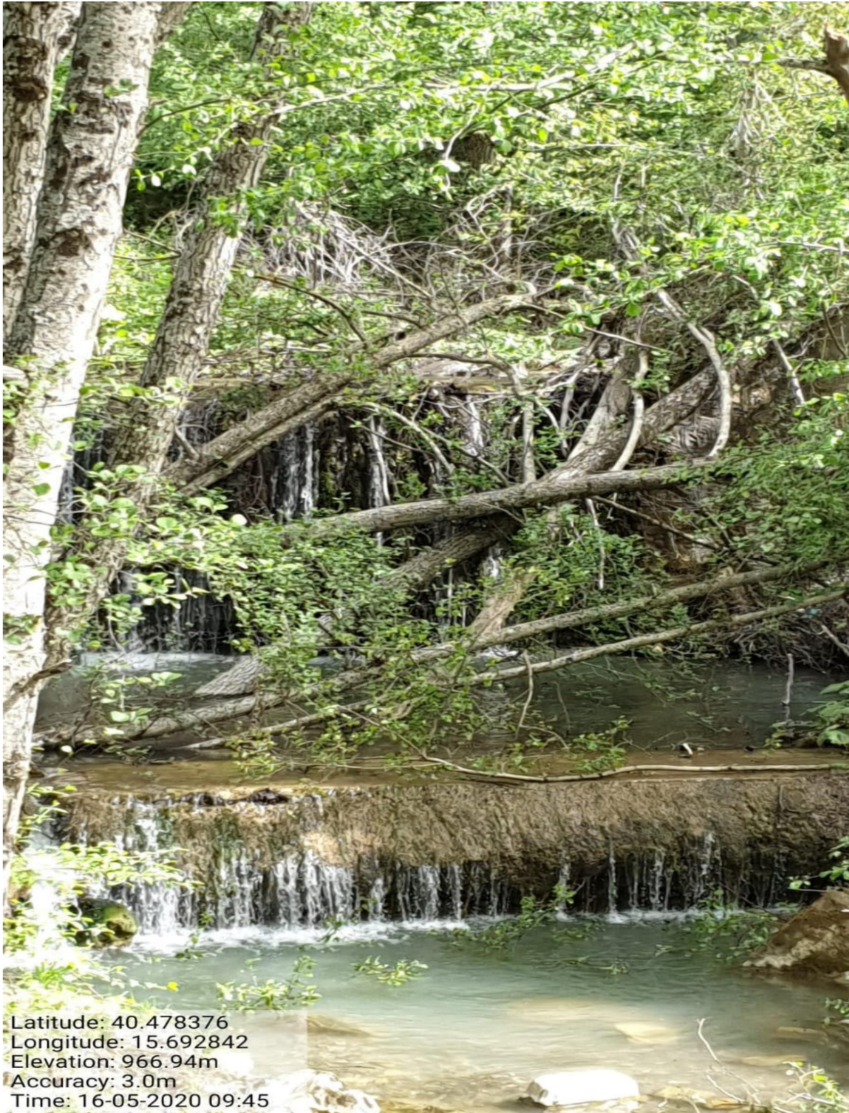
FOTO 3 INT. 4.1.1 Loc.tà Patri Torrente Fiumicello