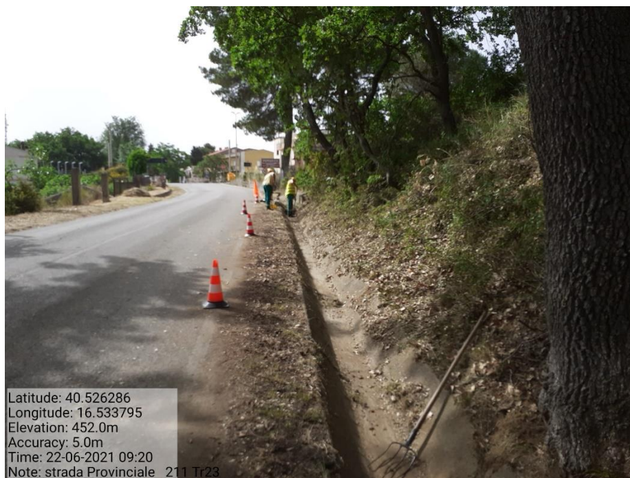
Intervento 5.1.9 Manutenzione Viabilità comunale (Pulizia cunette ) Tronco 23 SP 211 POST OPERAM