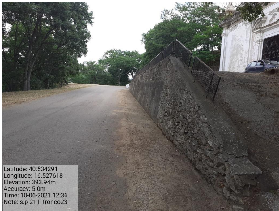
Intervento 5.1.9 Manutenzione Viabilità comunale (Pulizia cunette ) Tronco 23 SP 211 POST OPERAM