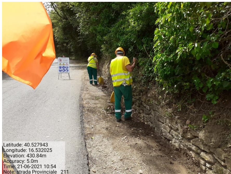
Intervento 5.1.9 Manutenzione Viabilità comunale (Pulizia cunette ) Tronco 23 SP 211 POST OPERAM

Latitude: 40.527943 Longitude: 16.532025 Elevation: 430.84m Accuracy: 5.0m Time: 21-06-2021 10:54 Note: strada Provinciale 211