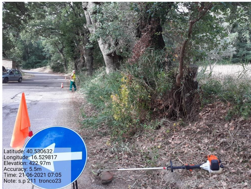
Intervento 5.1.9 Manutenzione Viabilità comunale (Pulizia cunette ) Tronco 23 SP 211 ANTE OPERAM