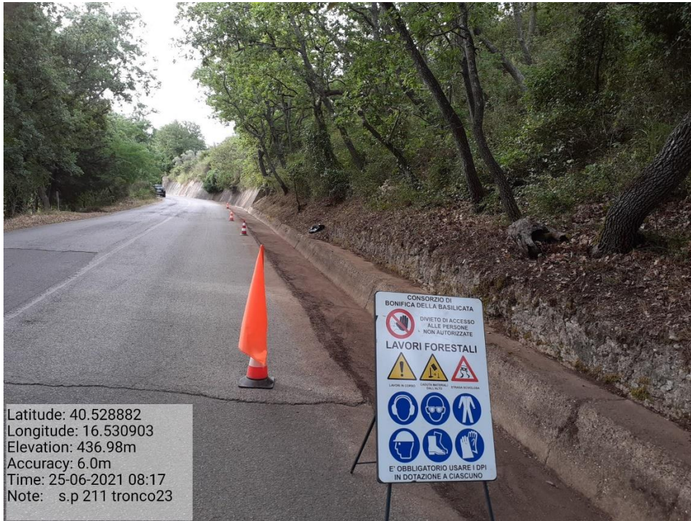
Intervento 5.1.9 Manutenzione Viabilità comunale (Pulizia cunette ) Tronco 23 SP 211 POST OPERAM