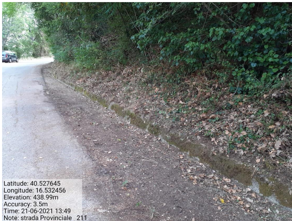
Intervento 5.1.9 Manutenzione Viabilità comunale (Pulizia cunette ) Tronco 23 SP 211 POST OPERAM