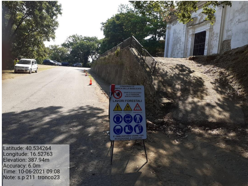
Intervento 5.1.9 Manutenzione Viabilità comunale (Pulizia cunette ) Tronco 23 SP 211 ANTE OPERAM