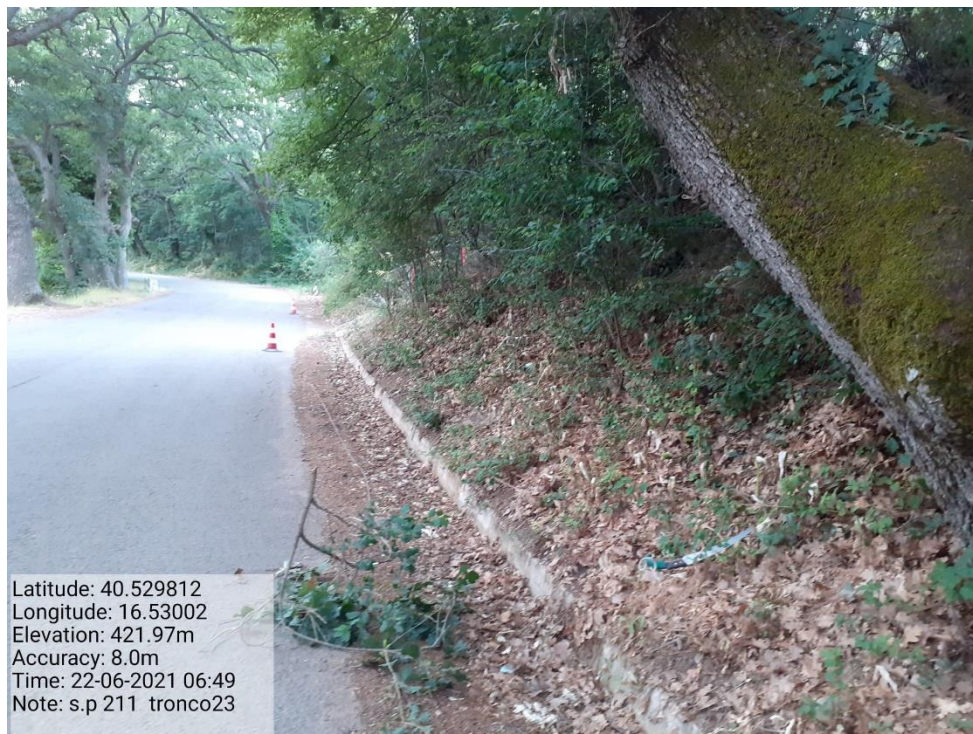
Intervento 5.1.9 Manutenzione Viabilità comunale (Pulizia cunette ) Tronco 23 SP 211 ANTE OPERAM