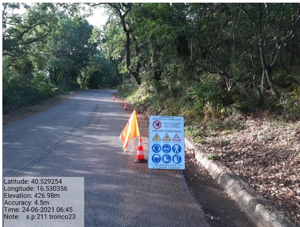
Intervento 5.1.9 Manutenzione Viabilità comunale (Pulizia cunette ) Tronco 23 SP 211 ANTE OPERAM