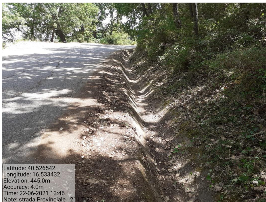
Intervento 5.1.9 Manutenzione Viabilità comunale (Pulizia cunette ) Tronco 23 SP 211 POST OPERAM