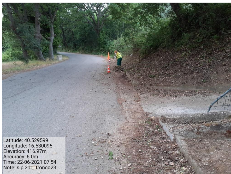
Intervento 5.1.9 Manutenzione Viabilità comunale (Pulizia cunette ) Tronco 23 SP 211 ANTE OPERAM