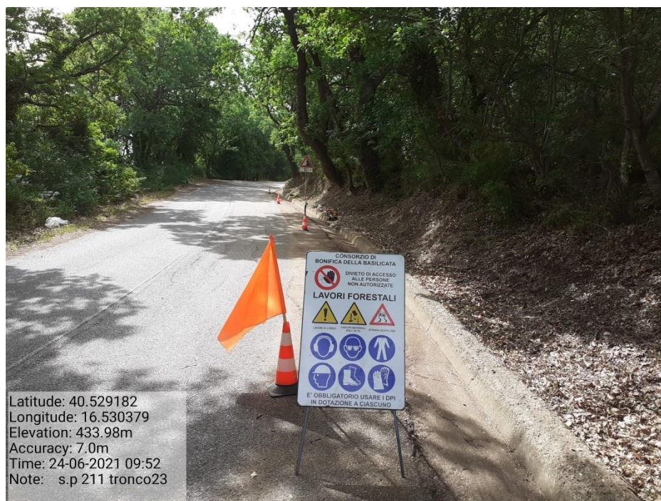
Intervento 5.1.9 Manutenzione Viabilità comunale (Pulizia cunette ) Tronco 23 SP 211 POST OPERAM