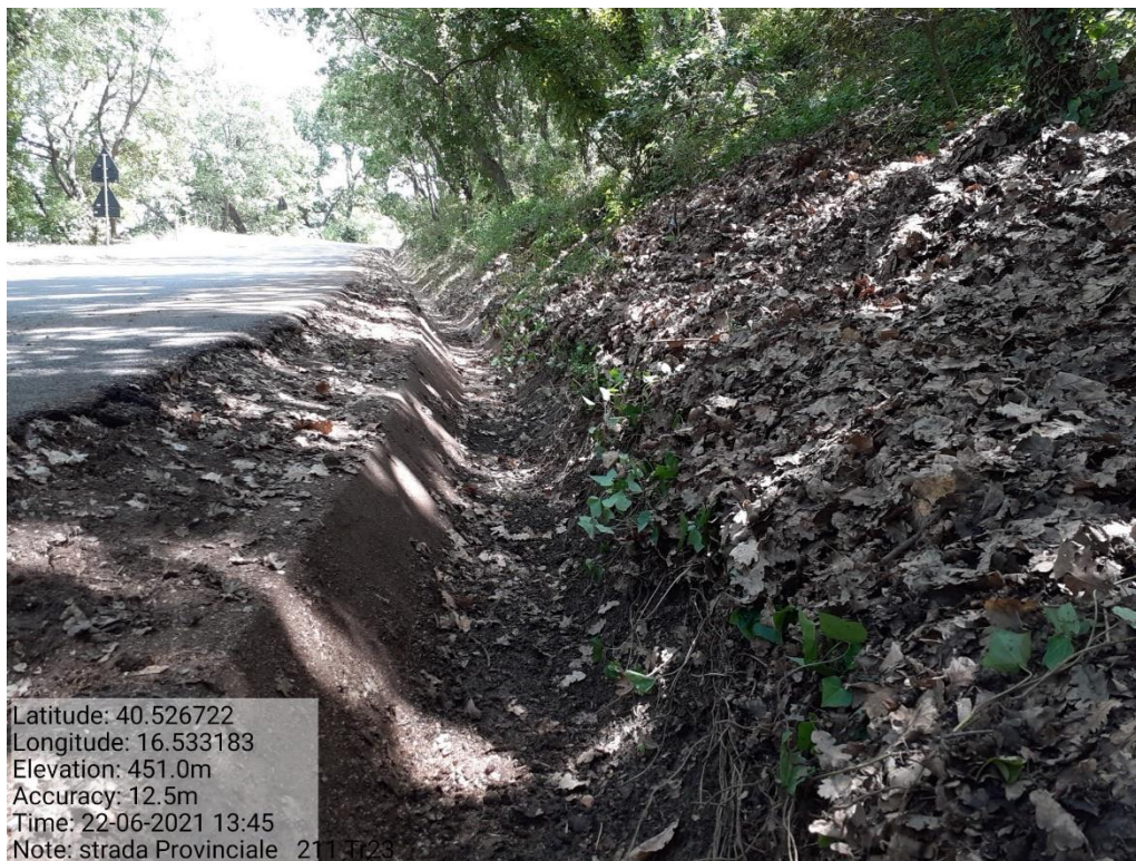
Intervento 5.1.9 Manutenzione Viabilità comunale (Pulizia cunette ) Tronco 23 SP 211 ANTE OPERAM