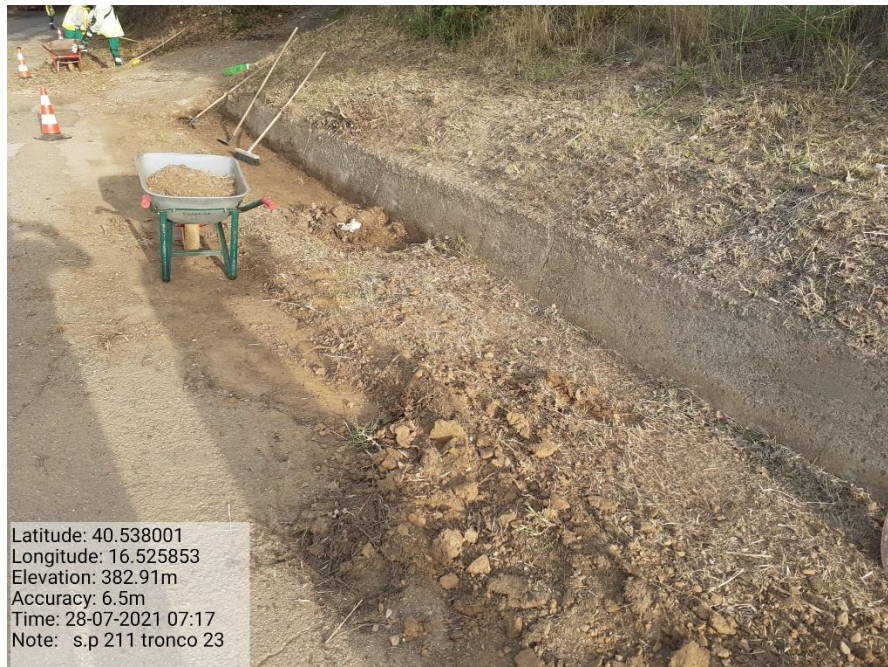
Intervento 5.1.9 Manutenzione Viabilità comunale (Pulizia cunette ) Tronco 23 SP 211 ANTE OPERAM