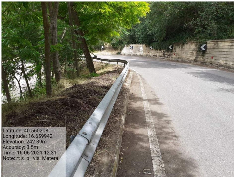
Intervento 5.1.2 Viabilità SP Montescaglioso -Matera (Decespugliamento) — POST OPERAM