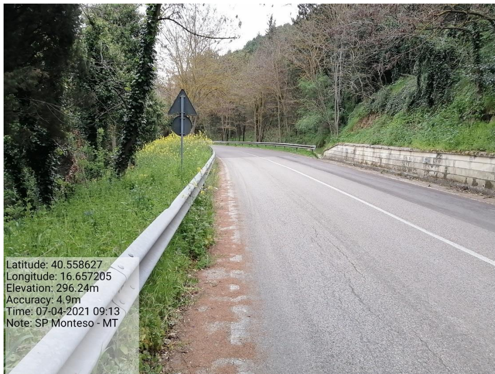
Intervento 5.1.2 Viabilità SP Montescaglioso -Matera (Decespugliamento) — ANTE OPERAM