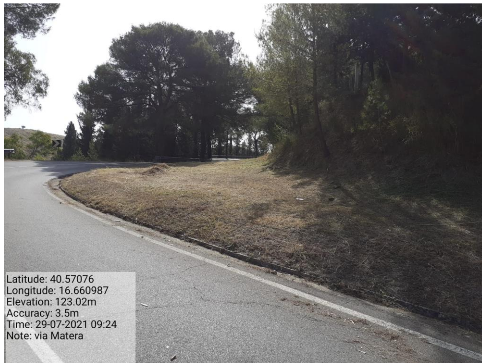
Intervento 5.1.2 Viabilità SP Montescaglioso -Matera (Decespugliamento) — POST OPERAM