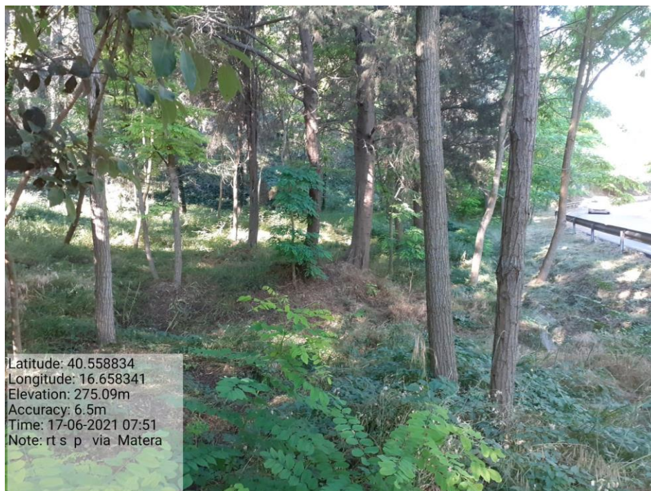
Intervento 5.1.2 Viabilità SP Montescaglioso -Matera (Decespugliamento) — ANTE OPERAM