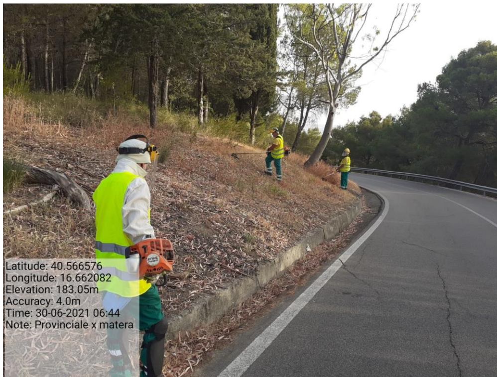
Intervento 5.1.2 Viabilità SP Montescaglioso -Matera (Decespugliamento) — ANTE OPERAM