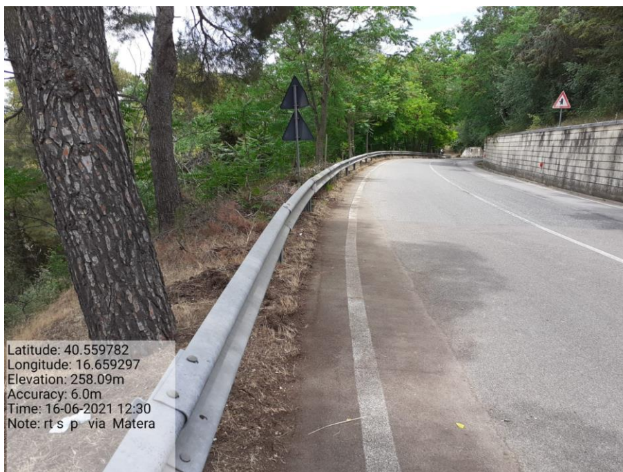
Intervento 5.1.2 Viabilità SP Montescaglioso -Matera (Decespugliamento) — POST OPERAM