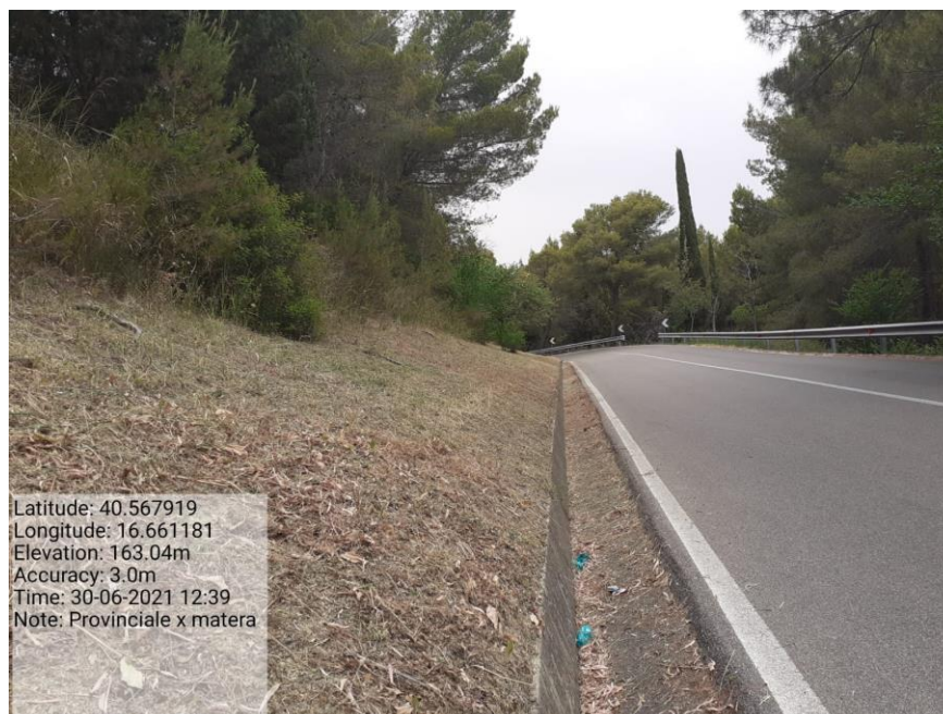
Intervento 5.1.2 Viabilità SP Montescaglioso -Matera (Decespugliamento) — POST OPERAM