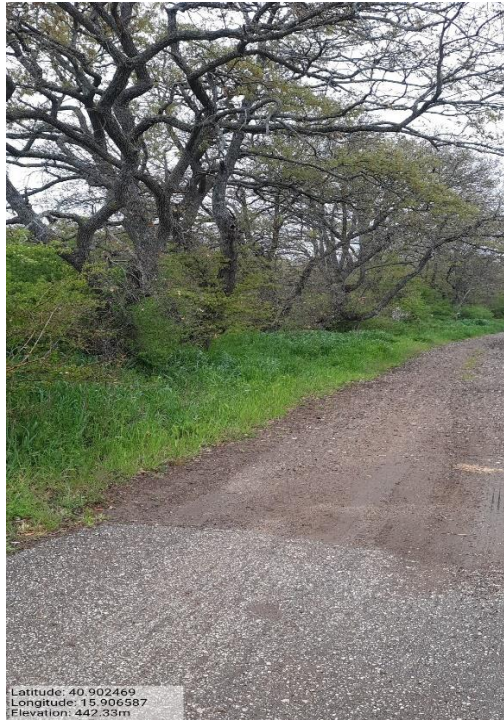
Int. 1 Loc. San Martino fascia tagliafuoco