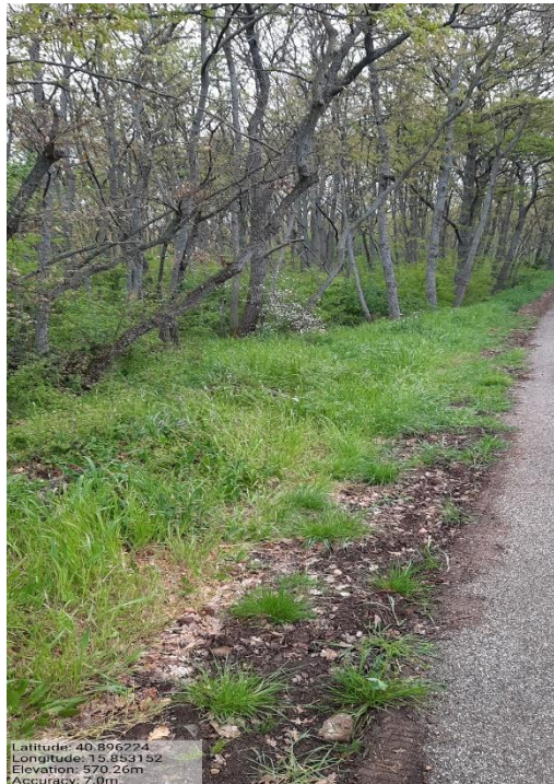
Int. 1 Loc. San Martino fascia tagliafuoco