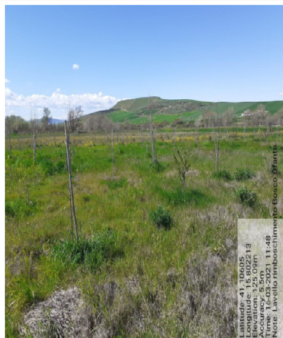
Int. 7.1.2 – Foto 11