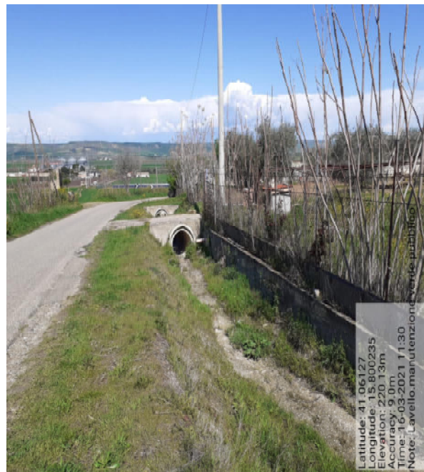
Int. 5.2.1 - Foto 9