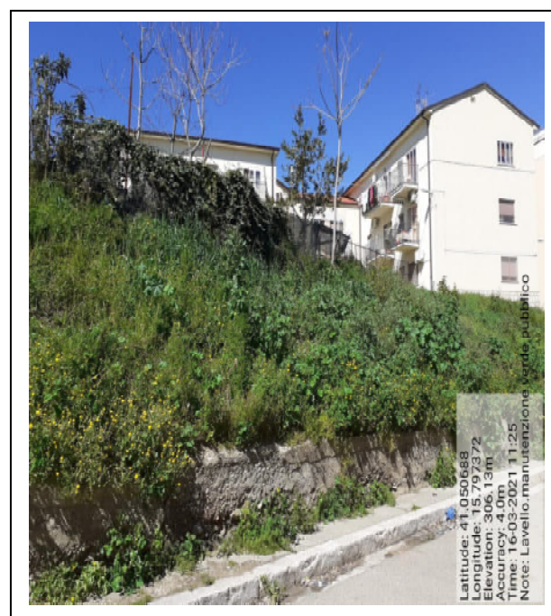
Int. 2.1.1 - Foto 4