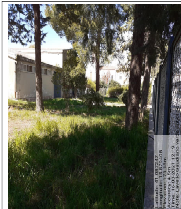
Int. 2.1.2 – Foto 3