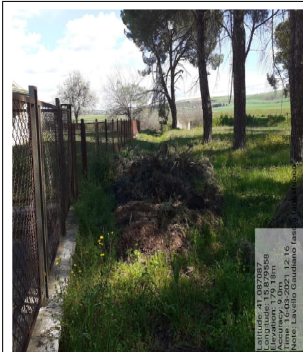
Int. 1.1.3 - Foto 1