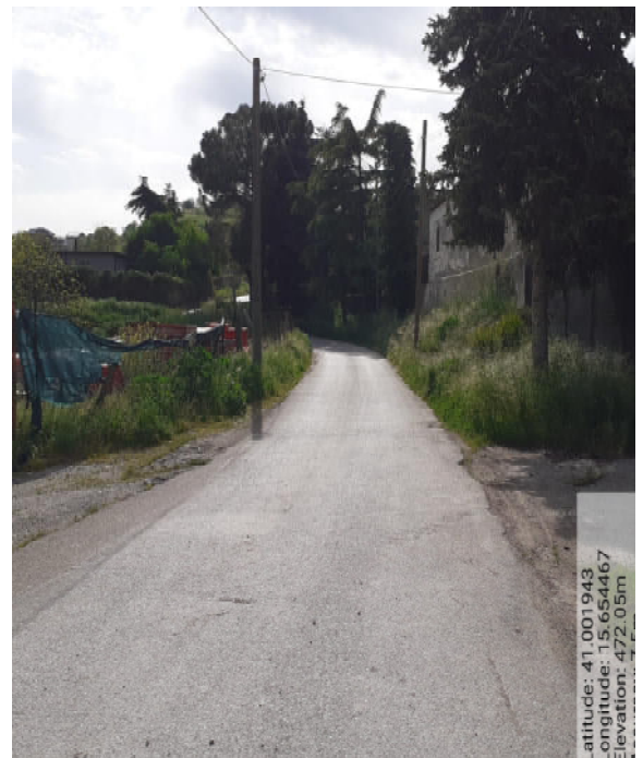
Int. 6.3.4 – Foto 12