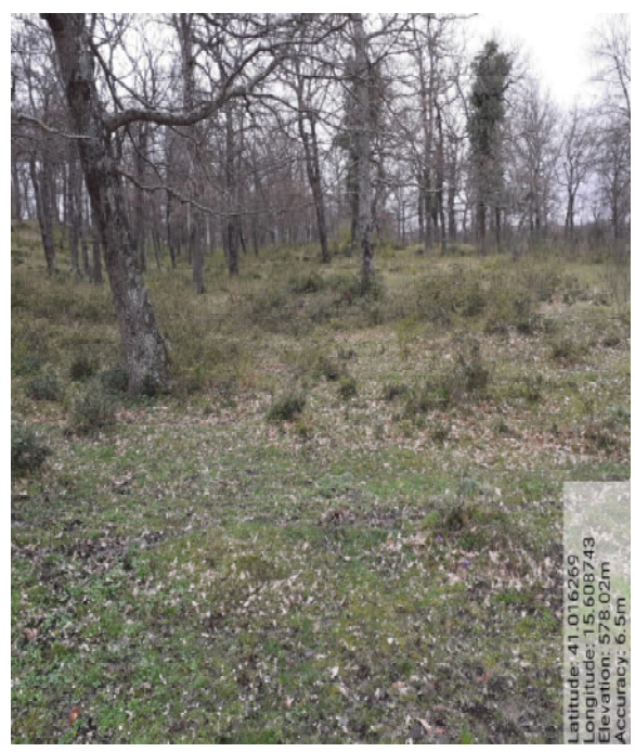
Int. 5.1.1 – Foto 8