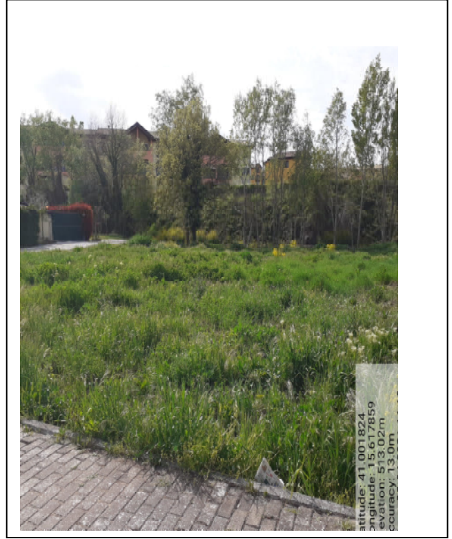
Int.2.1.1 - Foto 2