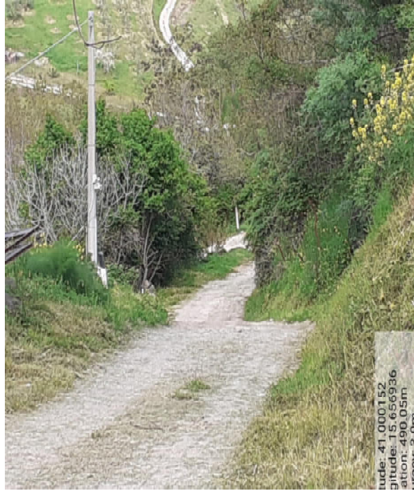
Int. 4.3.2 – Foto 5