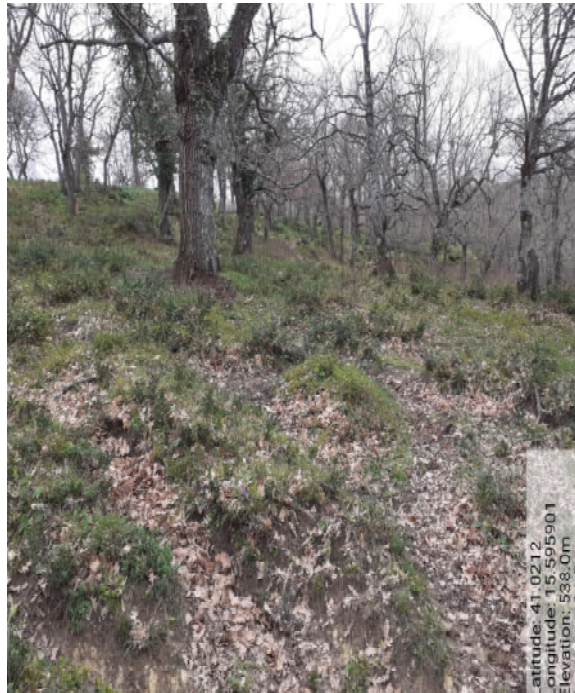
Int. 5.1.1 – Foto 7