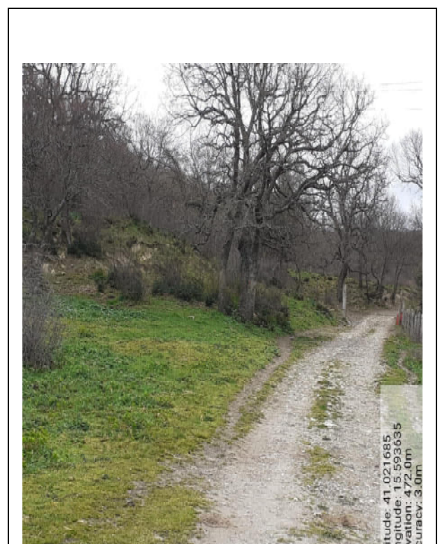
Int. 4.2.1– Foto 4