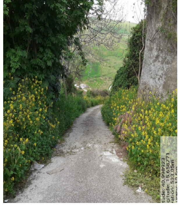
Int. 4.3.3 – Foto 6