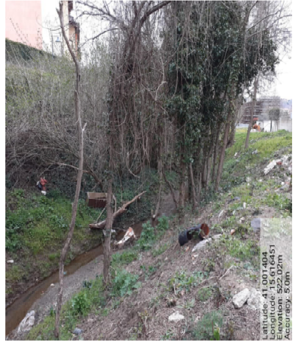
Int.6.1.2- Foto 10