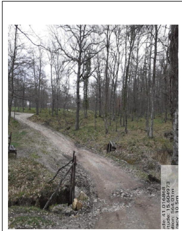
Int. 4.2.1– Foto 3