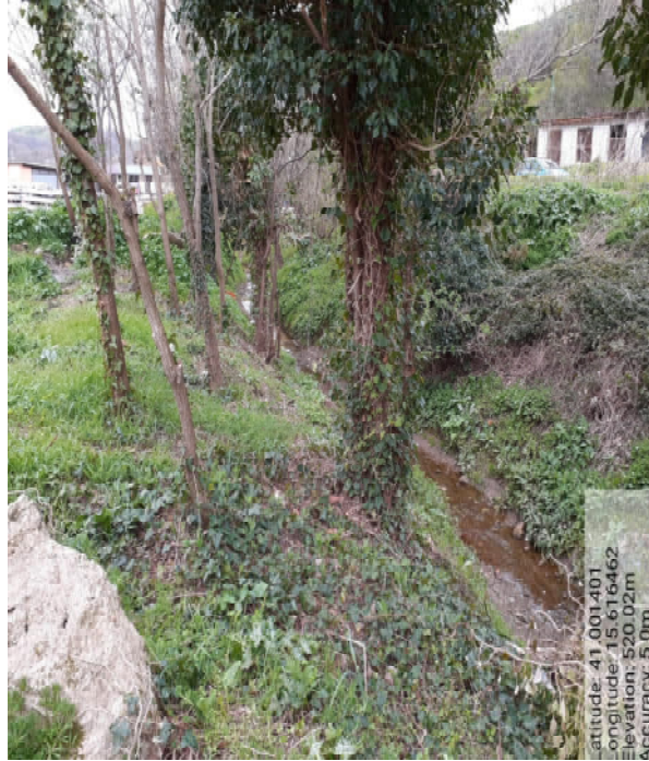
Int. 6.1.2 – Foto 9