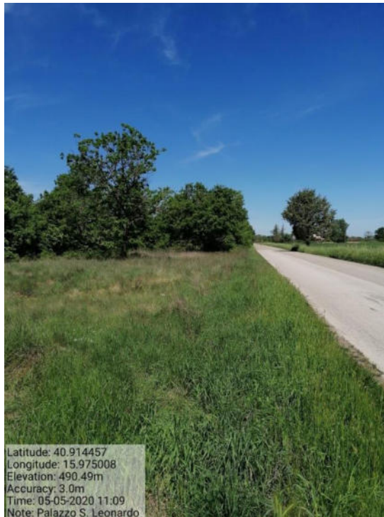
Int. 1 Loc. S. Leonardo fascia tagliafuoco