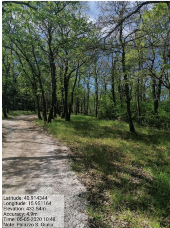
Int. 1 Loc. S. Giulia fascia tagliafuoco