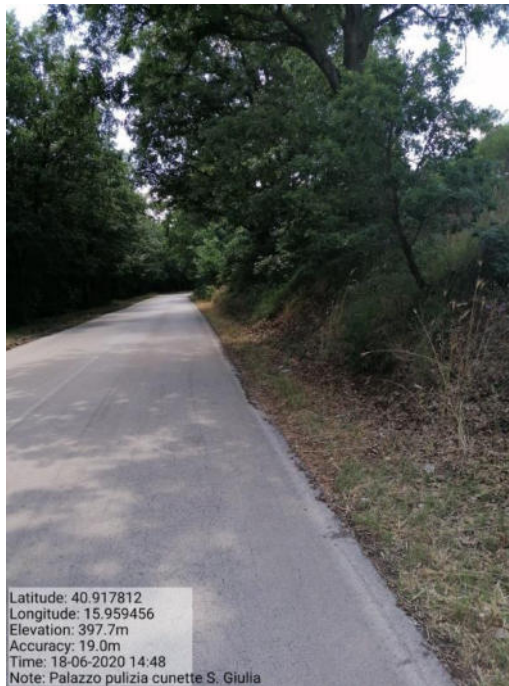
Int. 5 Loc. Zona campo sportivo-tabacchificio - pulizia cunette