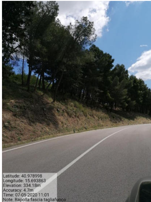
Int. 1 Loc. Canalone fascia tagliafuoco