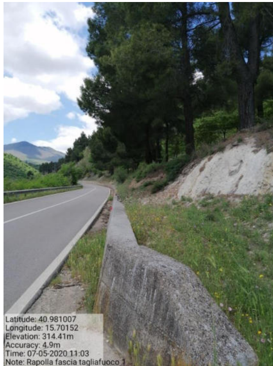
Int. 1 Loc. Canalone fascia tagliafuoco