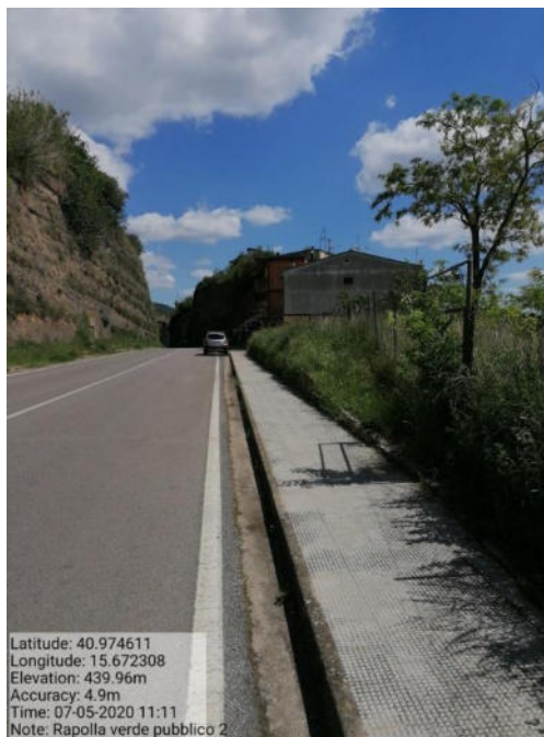
Int. 2 Loc. verde urbano