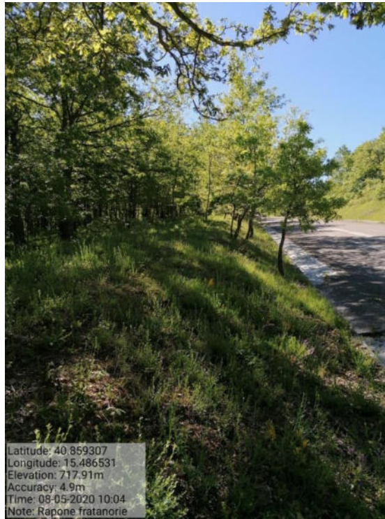
Int. 1 Loc. Fratanorie fascia tagliafuoco