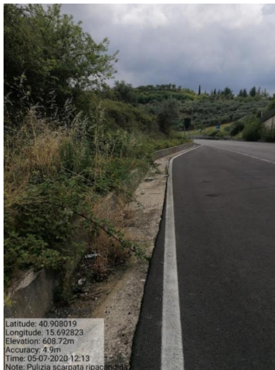
Int. 1 Loc. Cantone fascia tagliafuoco