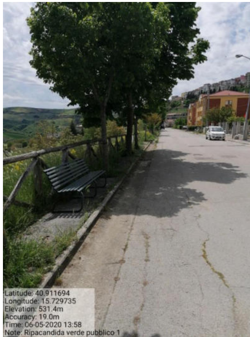
Int. 2 Loc. verde urbano