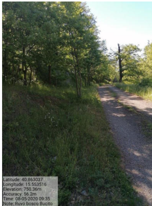
Int. 1 Loc. Bucito fascia tagliafuoco