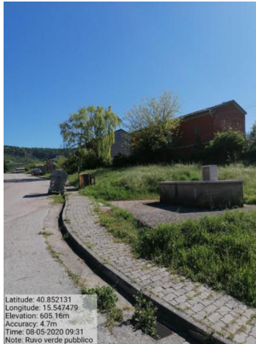
Int. 2 Loc. verde urbano