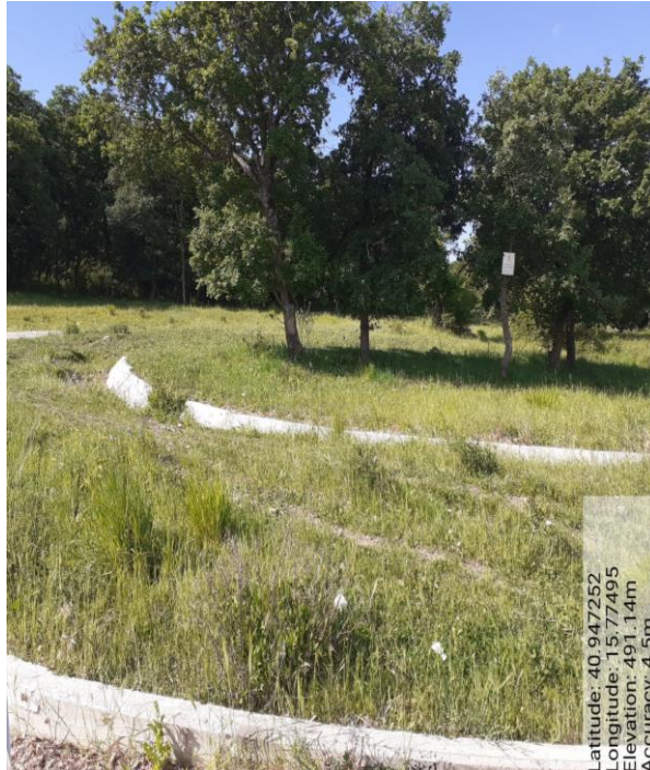
Int.1.1.1 - Foto 1