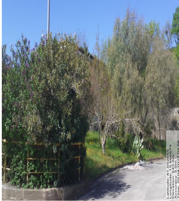
Int.2.1.2 - Foto 5