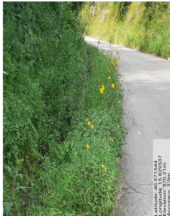
Int. 6.3.8 – Foto 11