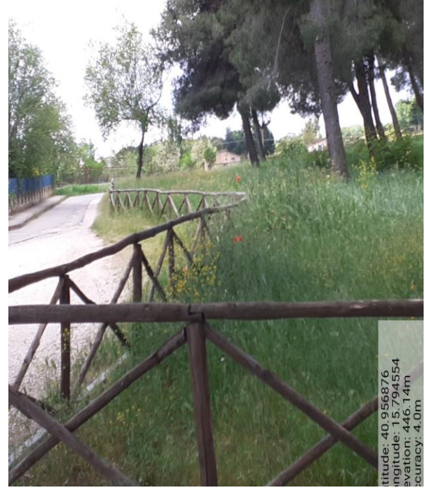
Int.1.1.2 – Foto 2