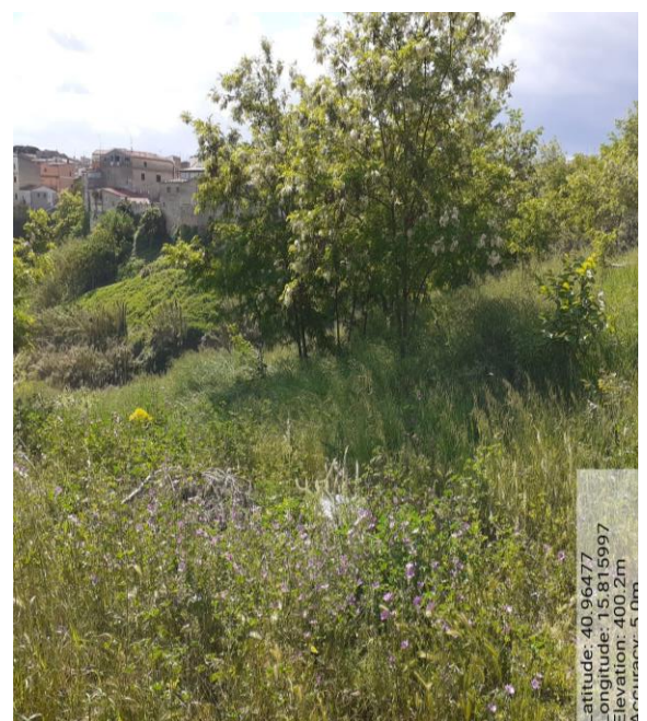
Int. 2.1.1 - Foto 4