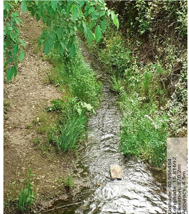
Int. 6.1.4 - Foto 10