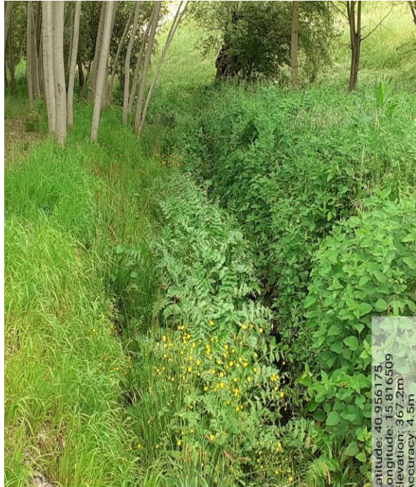
Int. 6.1.4 – Foto 9