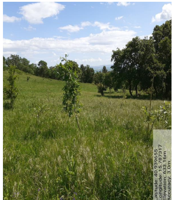
Int. 5.2.1 - Foto 8