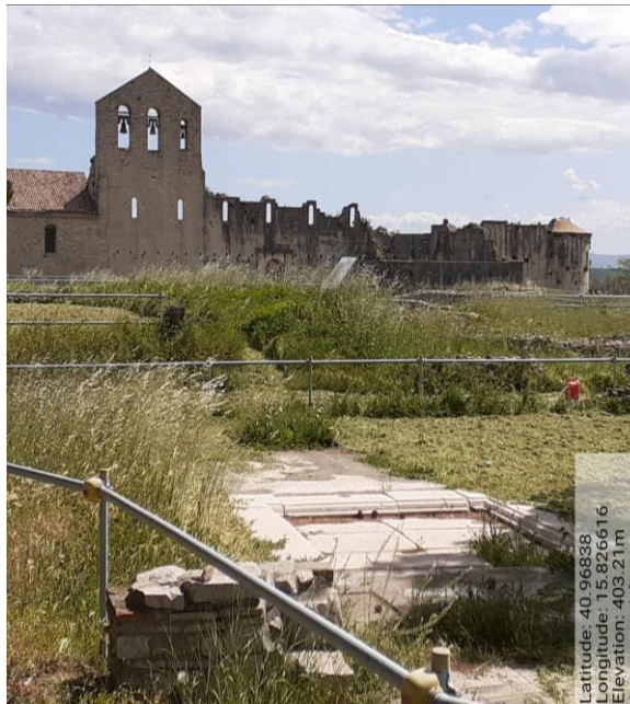
Int. 2.1.3 – Foto 3