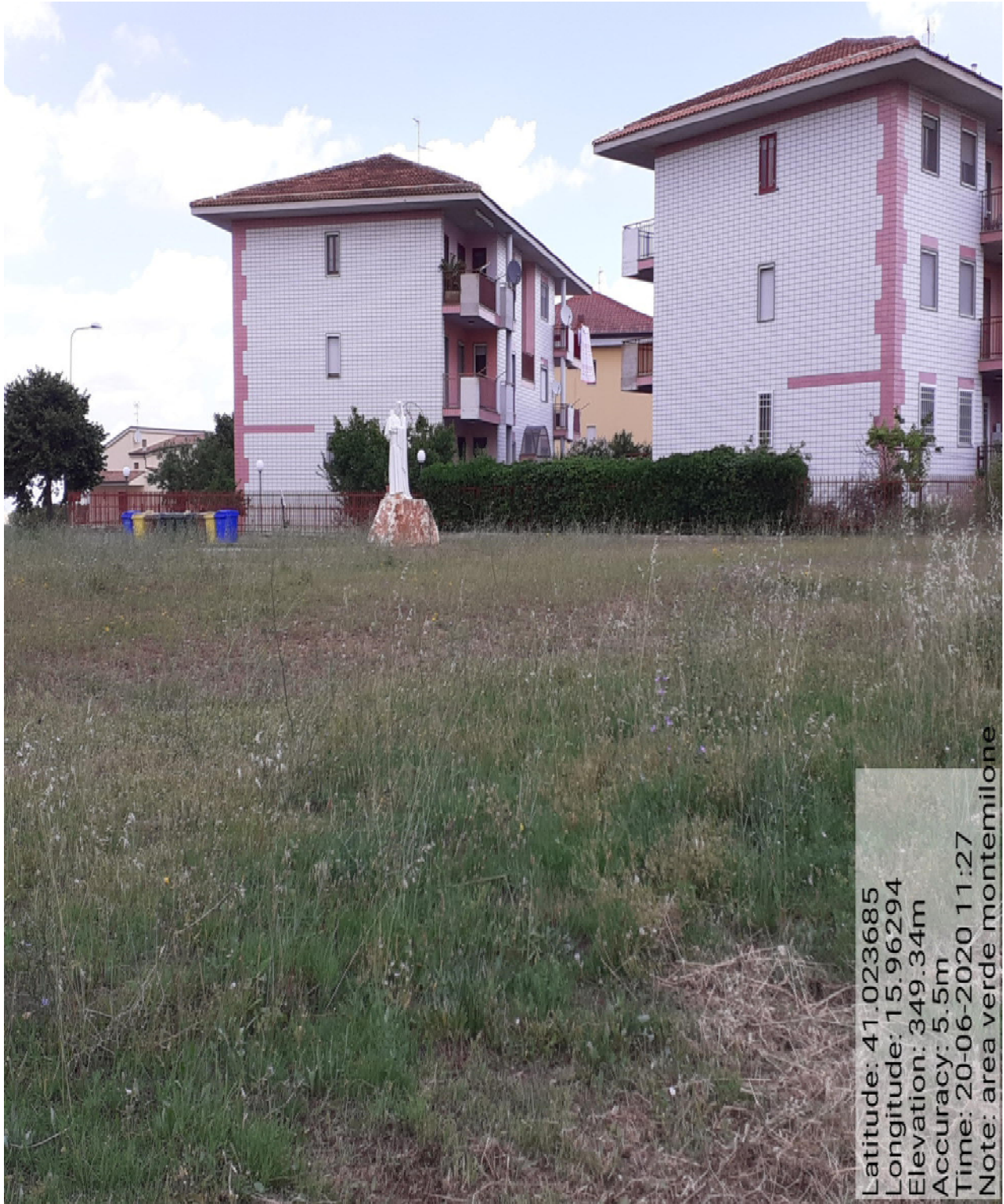
Int. 2.1.1 Verde Urbano