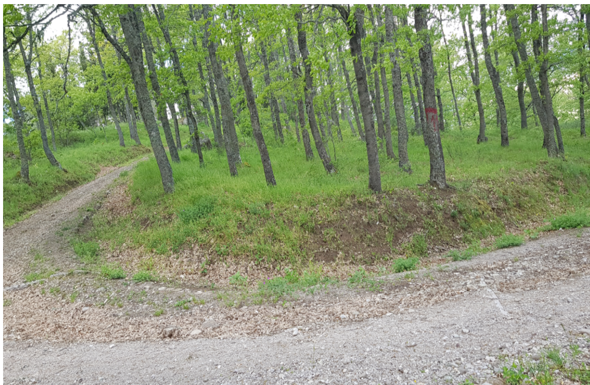
Manutenzione pista di servizio – Loc. Bosco delle Noci