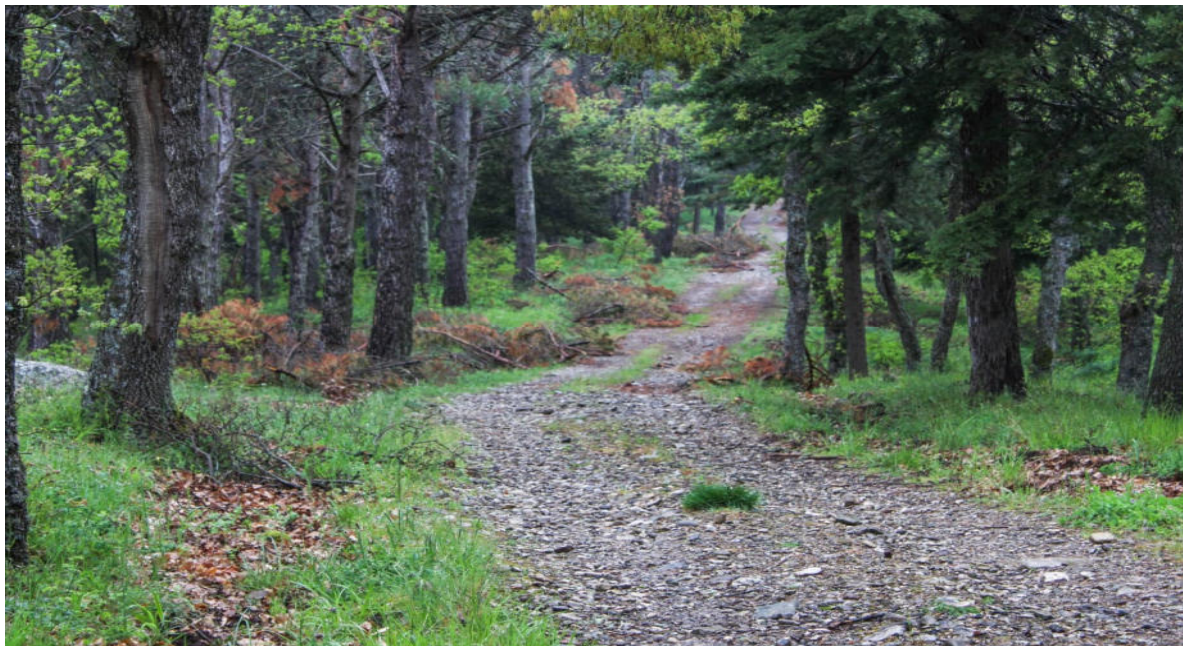
Miglioramenti boschi esistenti (diradamento)