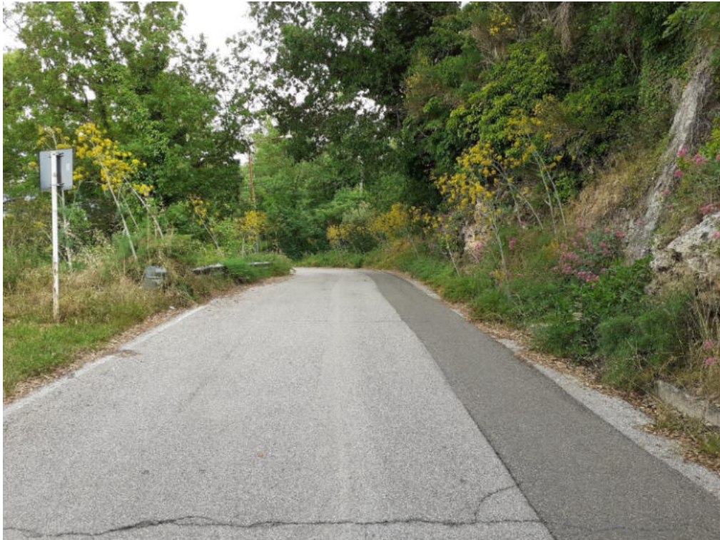
Int. 5.1.2 Loc. Strada Calda 2° tratto