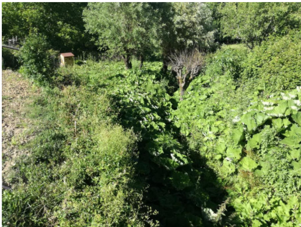
Int. 4.1.8 Fosso Cancellò NORD: 40°03'37.41" EST: 16°01'18.31"