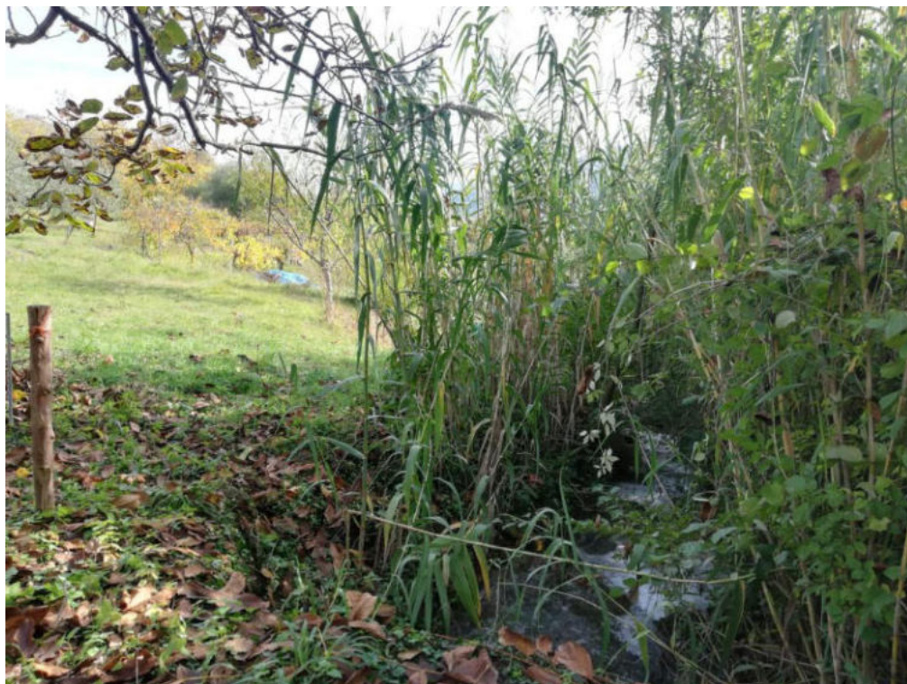
Int. 4.1.1 Fosso Calda