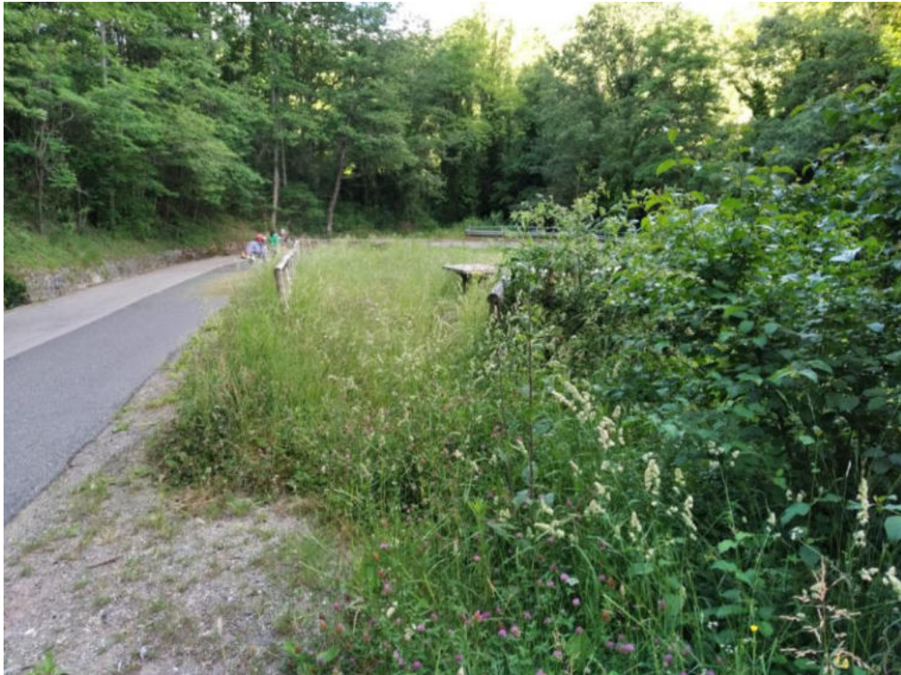
Int. 2.1.1 Loc. Mileo - Zona Villetta Comunale NORD: 40°3'16.42'' EST: 16°01'53.47''