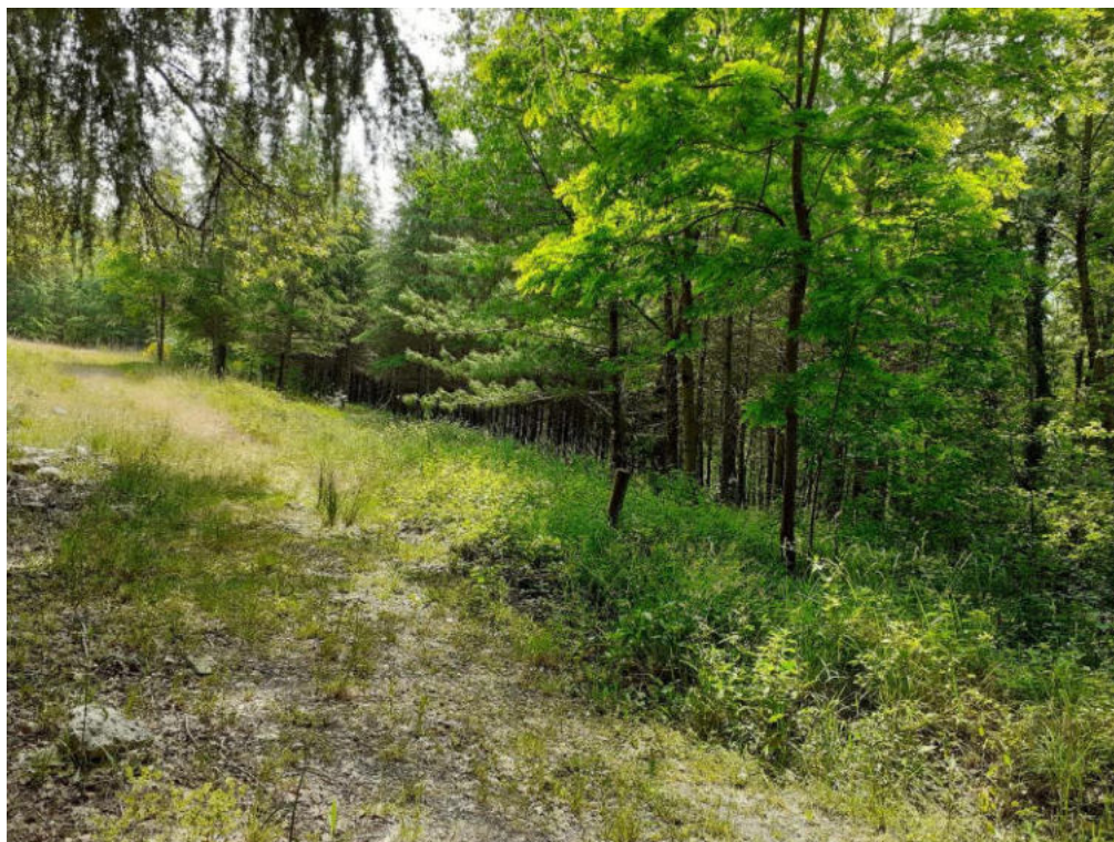
Int. 7.1.1 Bosco Malboschetto NORD: 40°04'51.36'' EST: 15°57'59.96''