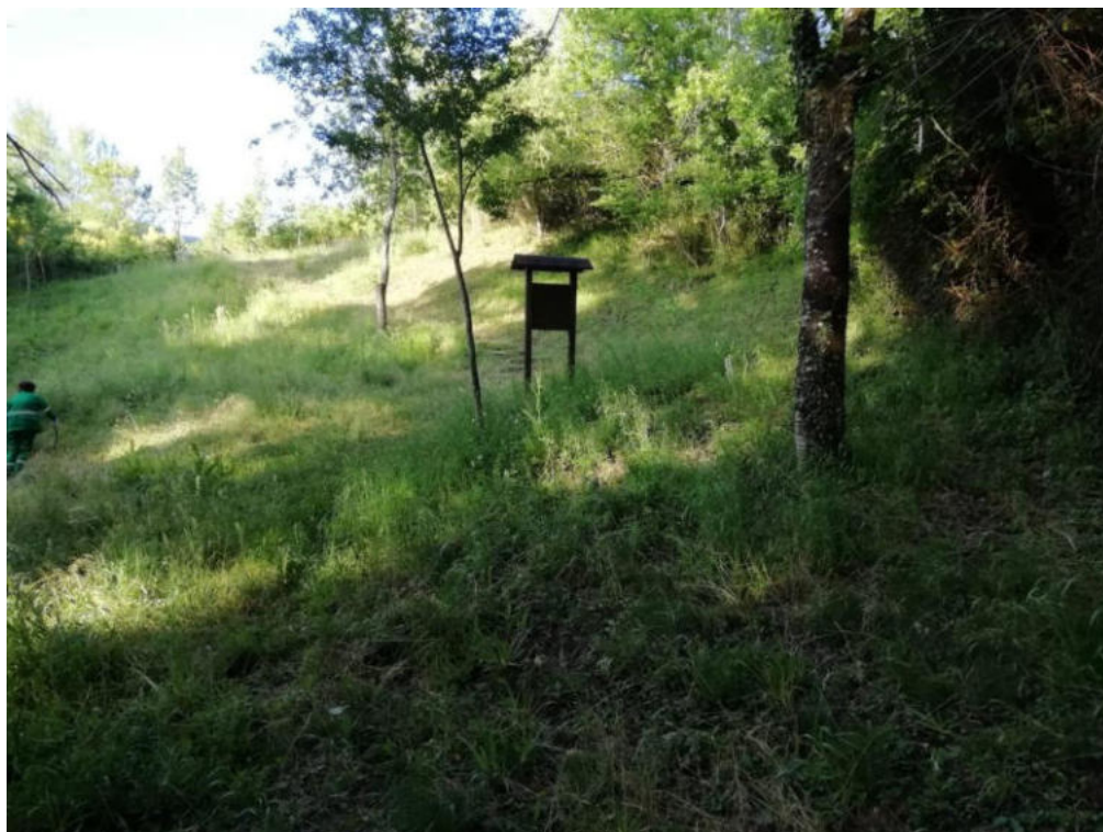
Int. 2.1.1 Loc. Calda - Cascata Zappitella