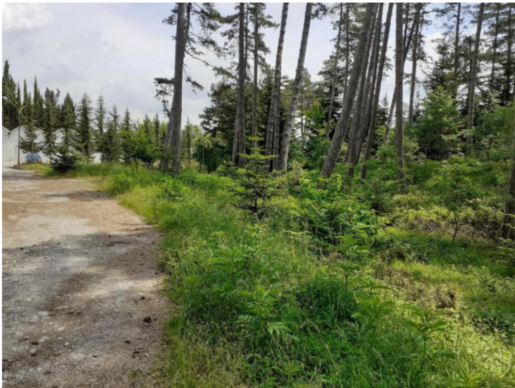
Int. 1.1.3 Loc. Pineta