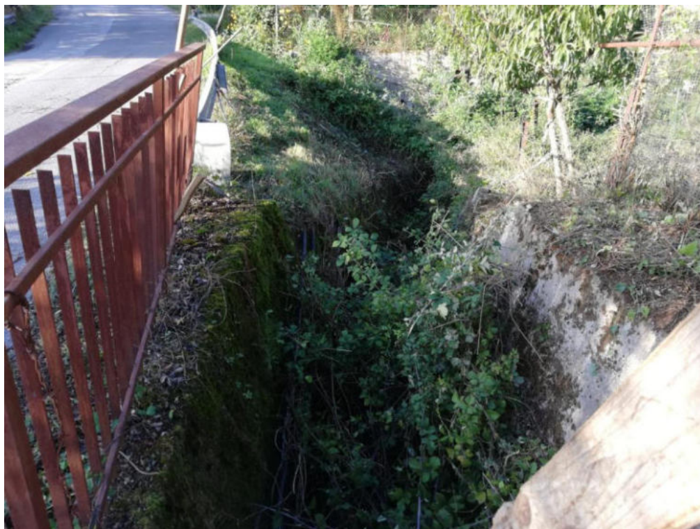
Int. 4.1.1 Fosso Calda