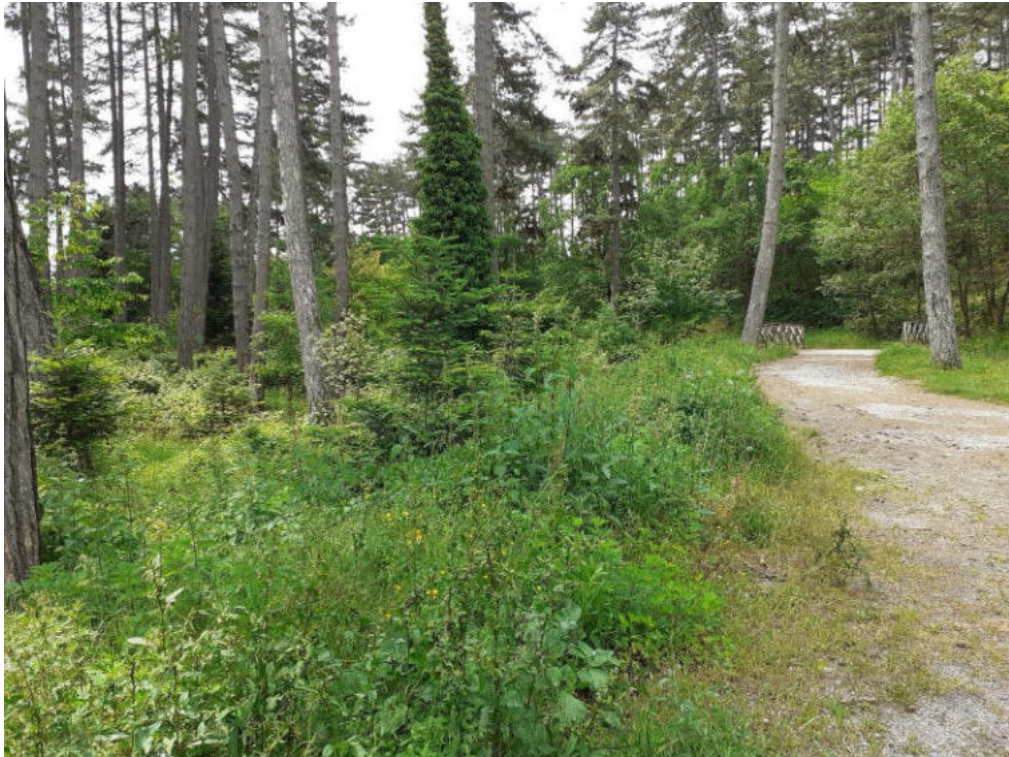
Int. 1.1.3 Loc. Pineta