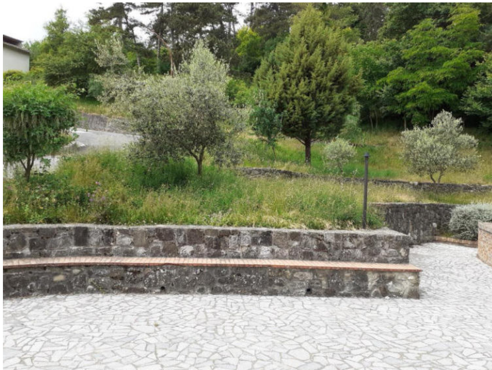
Int. 2.1.1 Zona Piazzetta