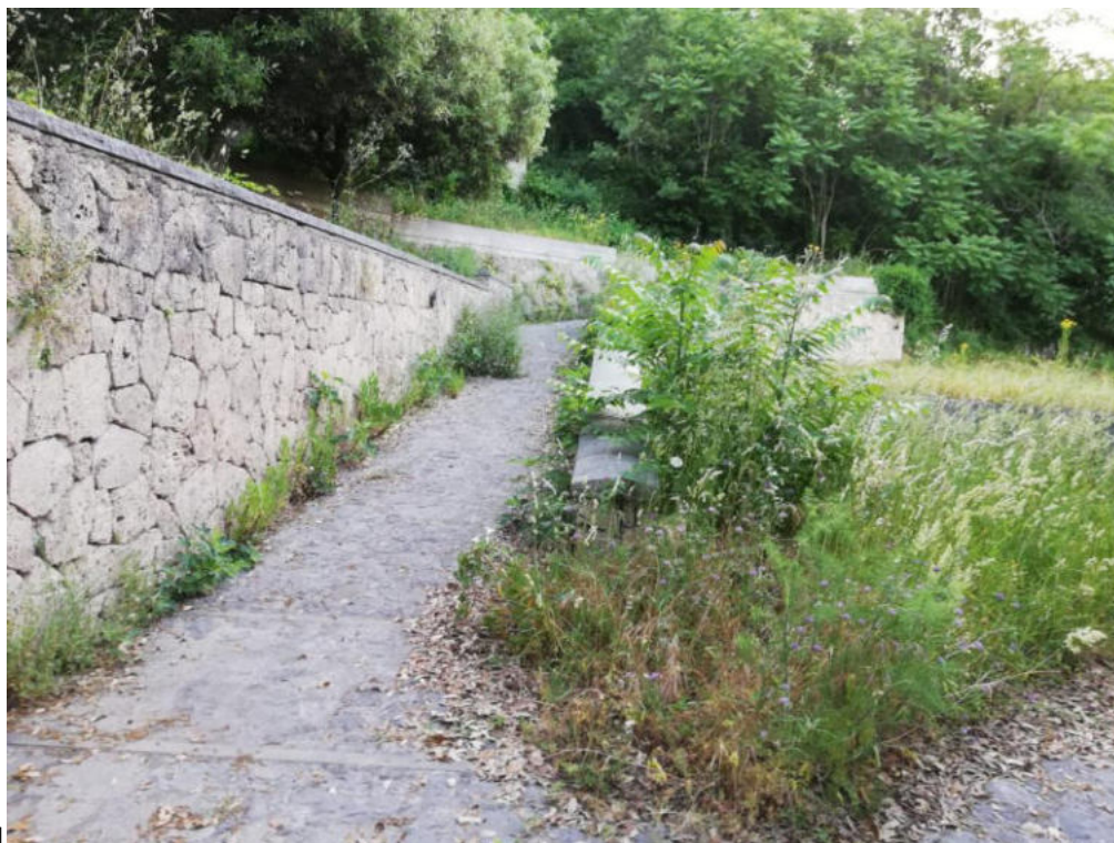
Int. 2.1.1 Loc. Calda - Museo del Termalismo