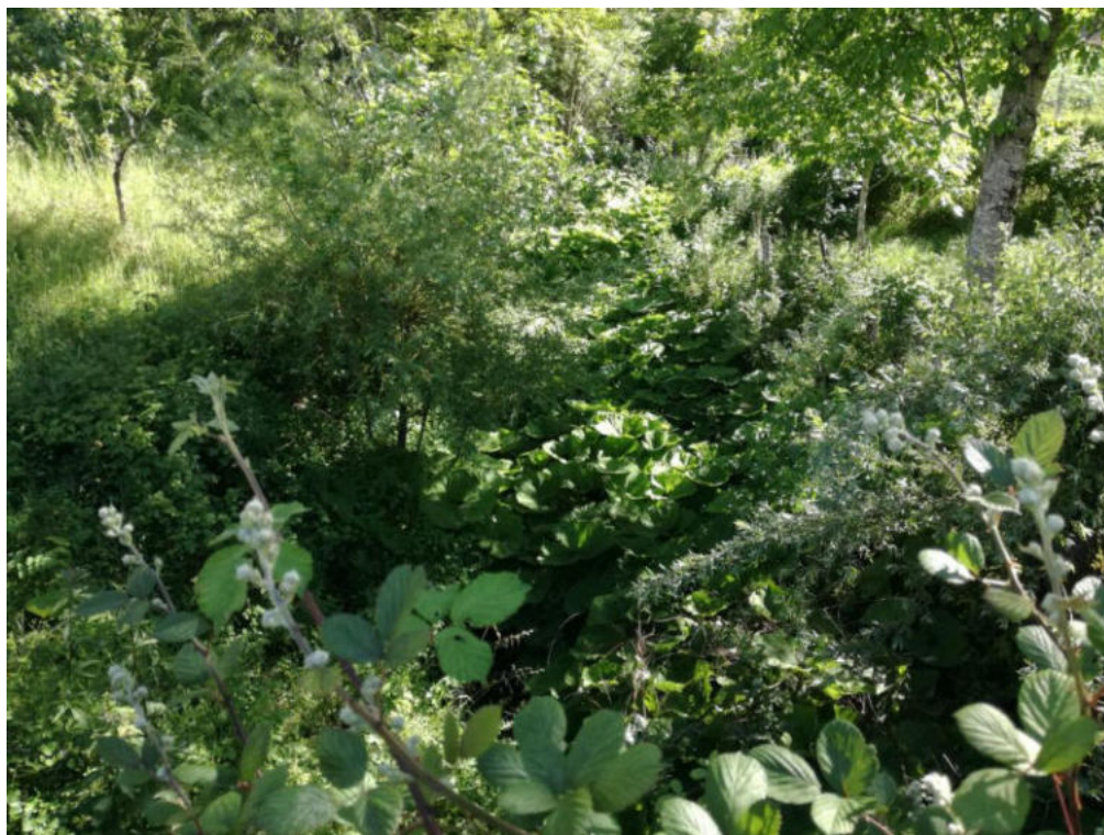
Int. 4.1.8 Fosso Cancellò NORD: 40°03'37.41" EST: 16°01'18.31"