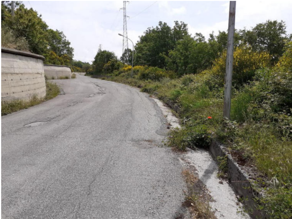
Int. 5.1.8 Loc. Strada Area PIP