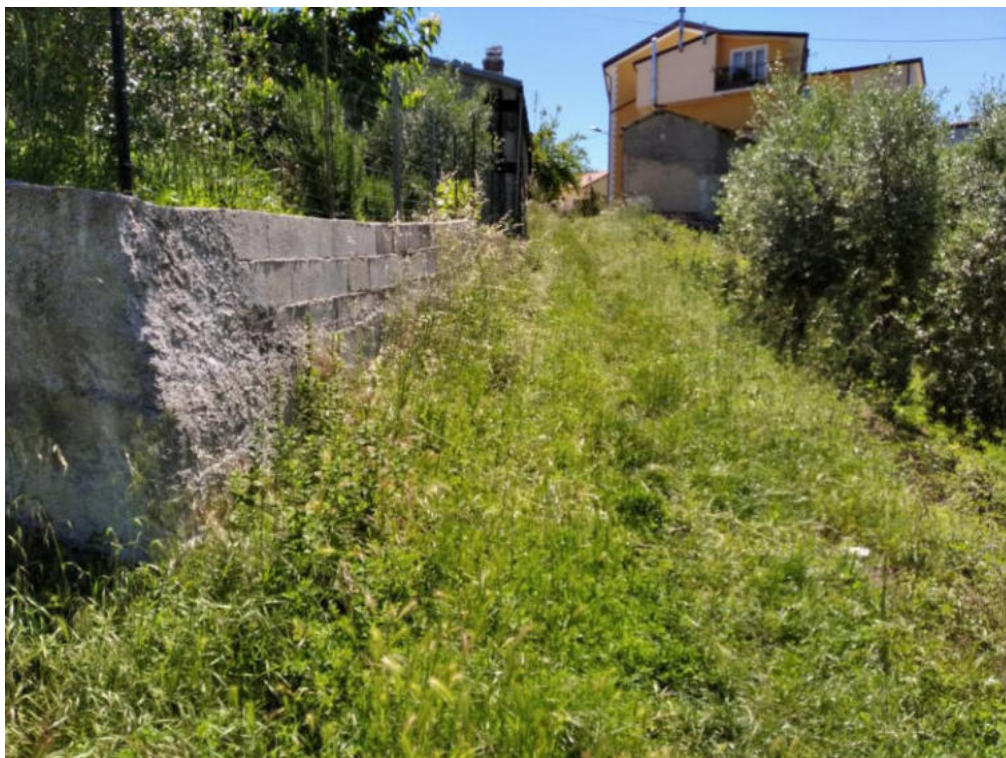
Int 3.2.8 Sentiero Rasizzo