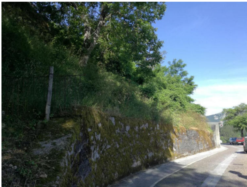
Int. 2.1.1 Zona Montegrappa