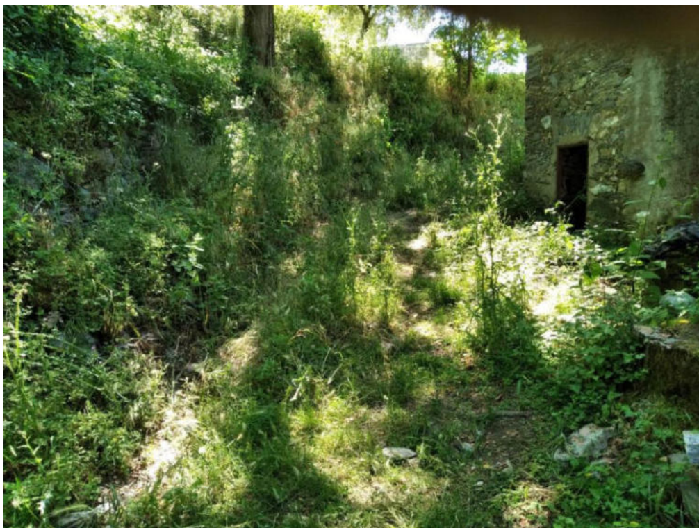
Int 3.2.8 Sentiero Rasizzo