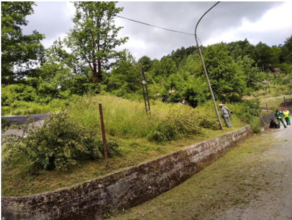
Int. 2.1.1 Loc. Mlleo - Zona Calvario NORD: 40°3'18.52'' EST: 16°01'50.92''