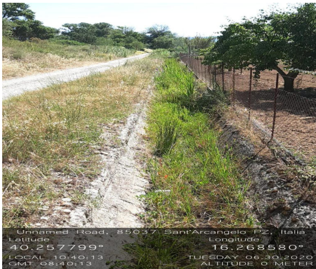
LOC : intervento 4.1.1 fosso roccolone