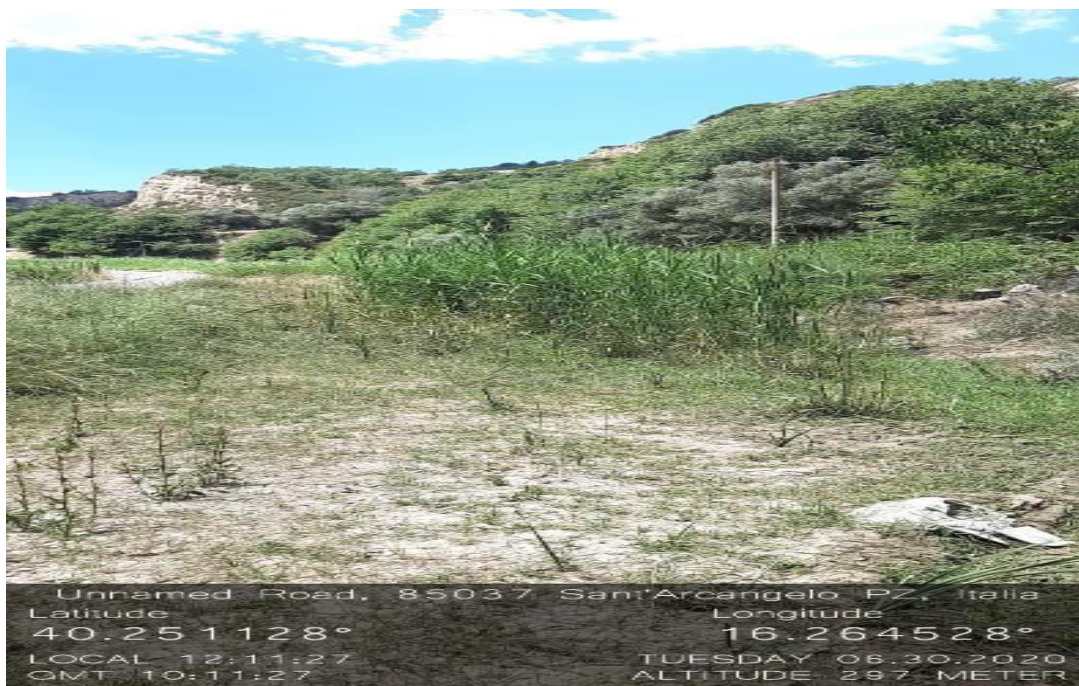
LOC : intervento 4.1.3 fosso Mattina