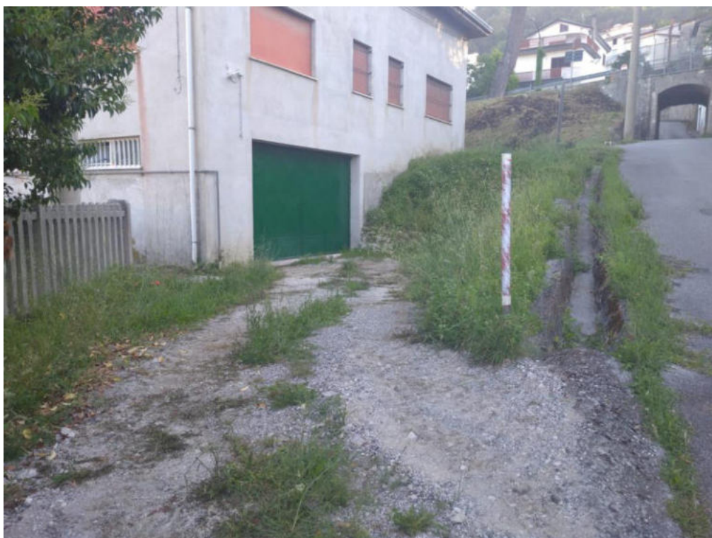
Int. 2.1.1 Ambulatorio AVIS