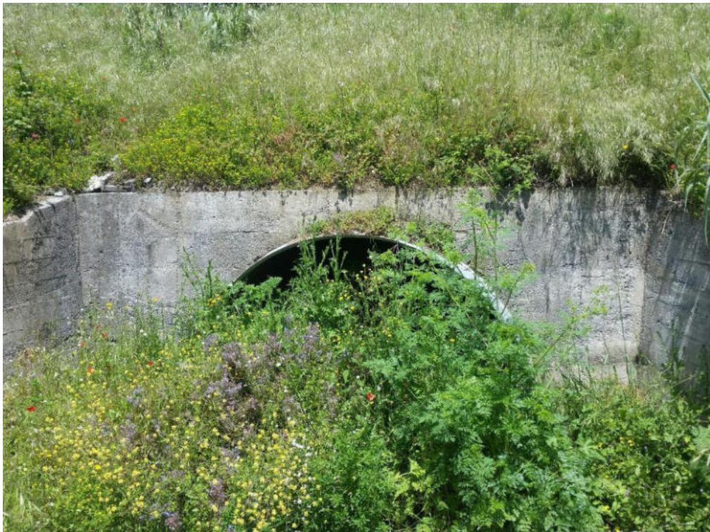
Int. 6.1.1 Cunettone Pidica