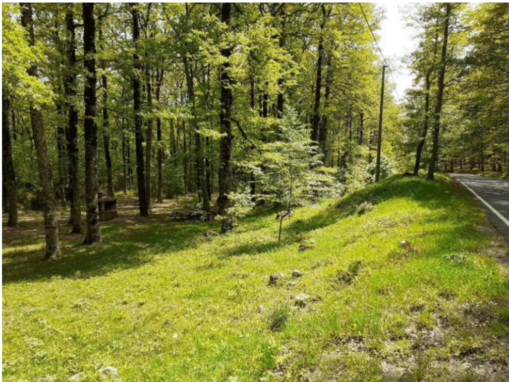
Int. 1.1.1 Loc. Bosco Difesa 1