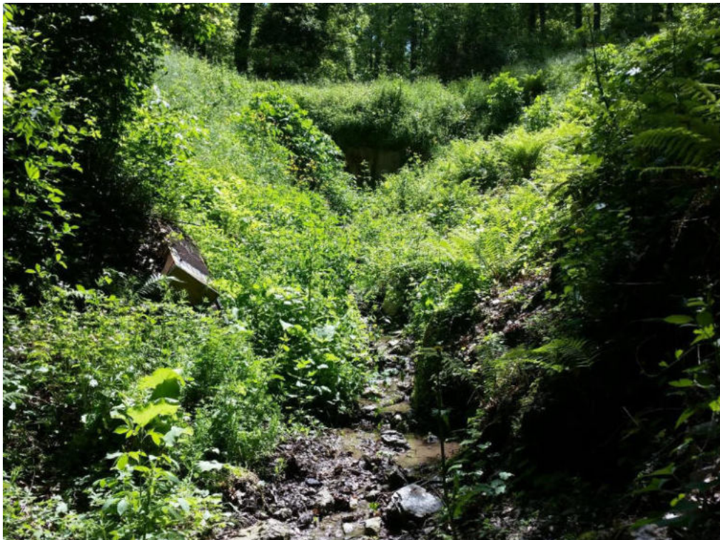
Int. 4.1.6 Fosso Mascolino