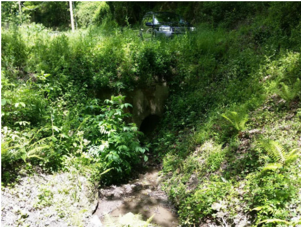
Int. 4.1.6 Fosso Mascolino