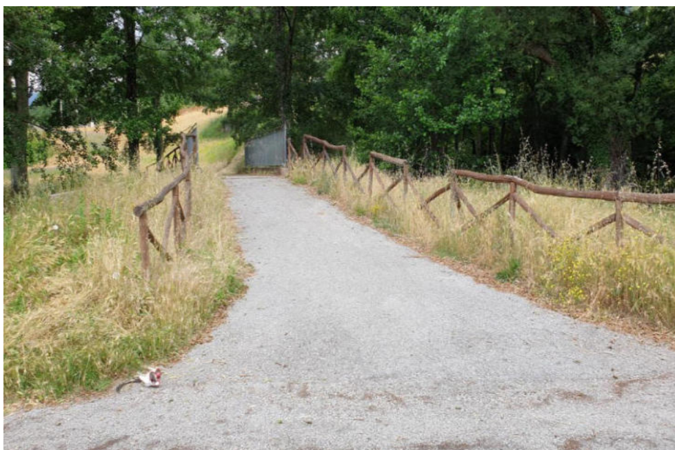
Int. 3.2.1 Pista Pista Ciclabile