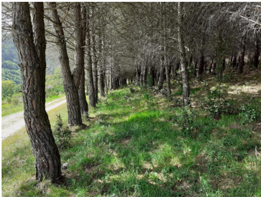
Int. 1.1.2 Loc. Lavatoio