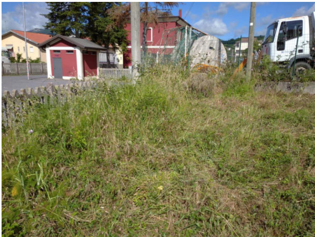
Int. 2.1.1 Ambulatorio AVIS