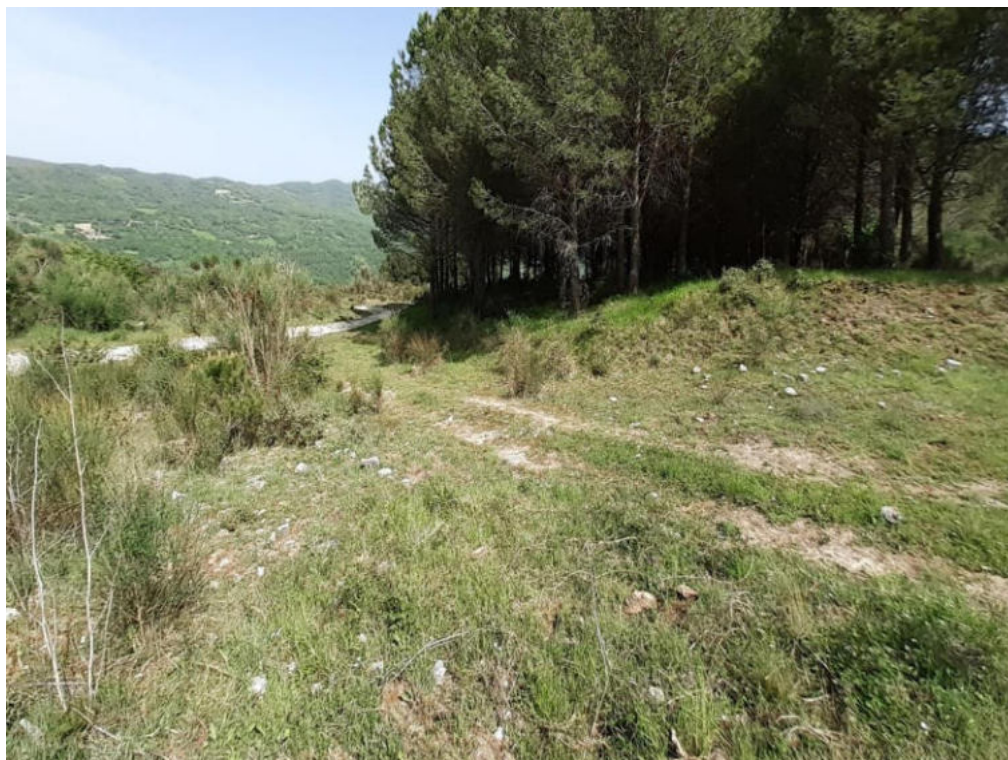
Int. 1.1.2 Loc. Lavatoio