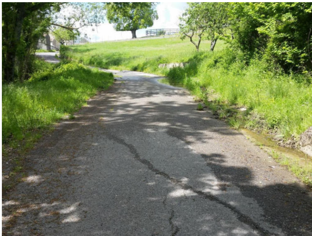
Int. 5.1.19 Strada Pongiuto