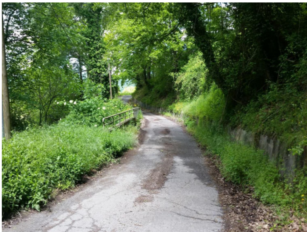
Int. 5.1.8 Strada Cortici