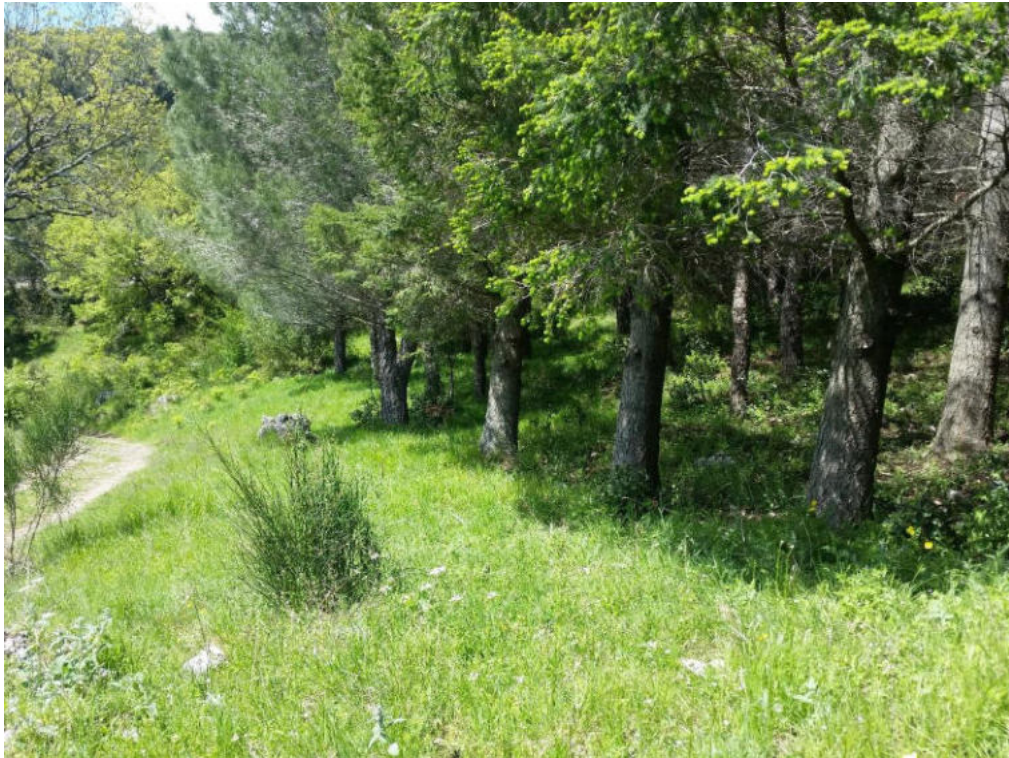
Int. 7.1.1 Bosco Lavatoio