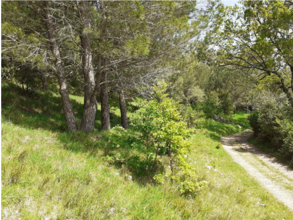
Int. 7.1.1 Bosco Lavatoio