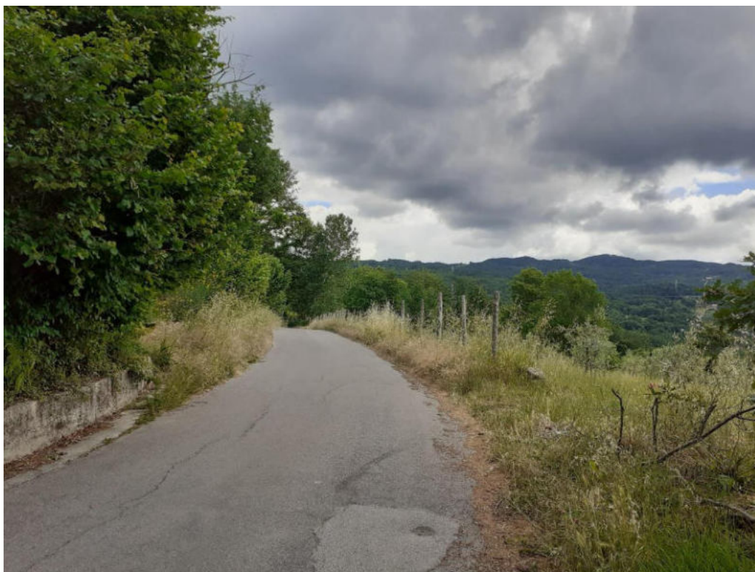
Int. 5.1.4 Strada Madonna della Neve