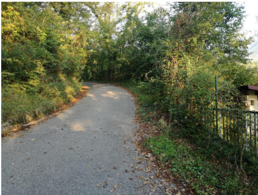
Int. 5.1.1 Strada Amoroso