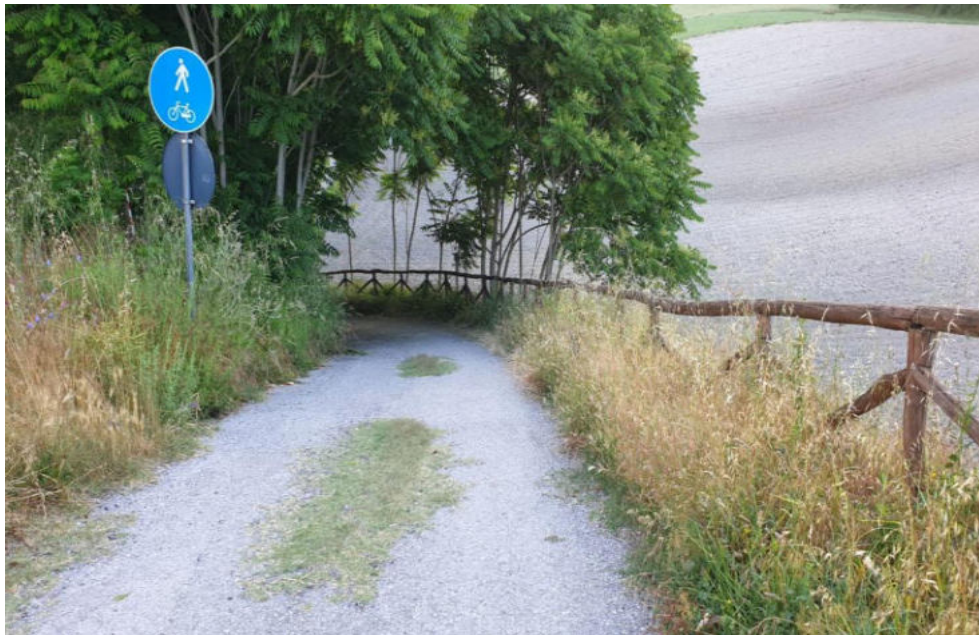
Int. 3.2.1 Sentiero Pista Ciclabile