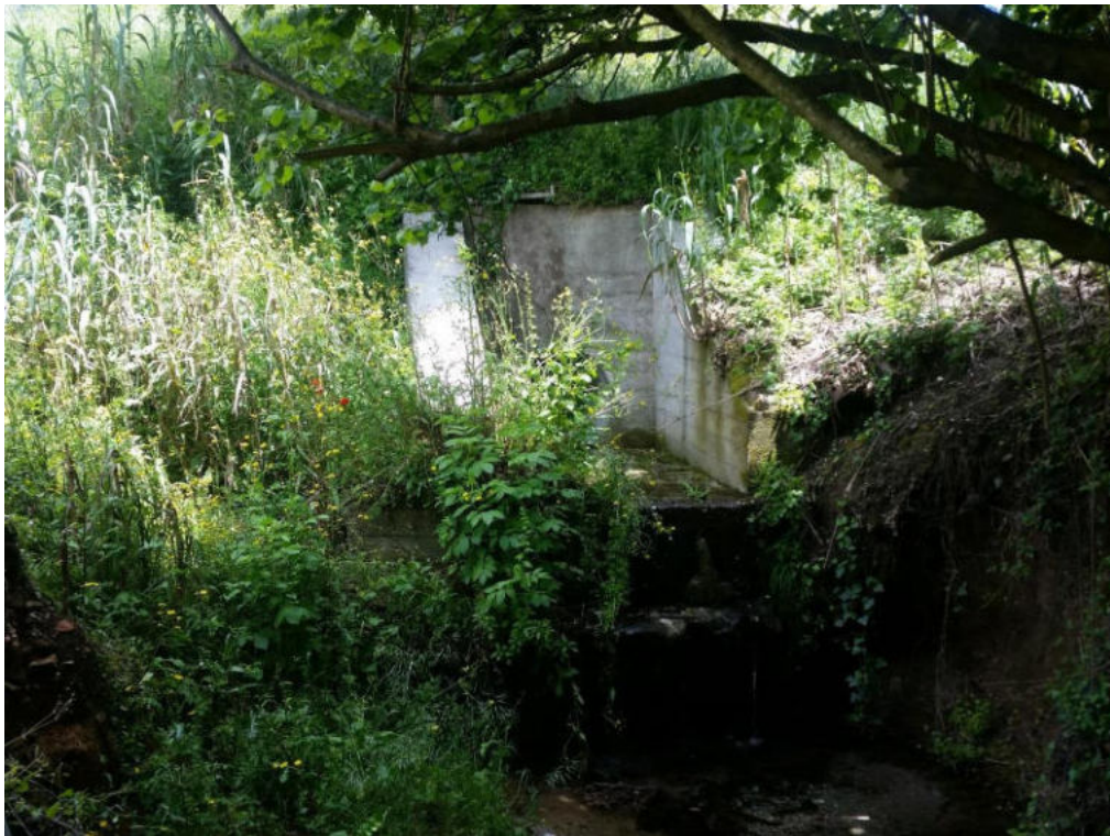
Int. 6.1.1 Cunettone Pidica