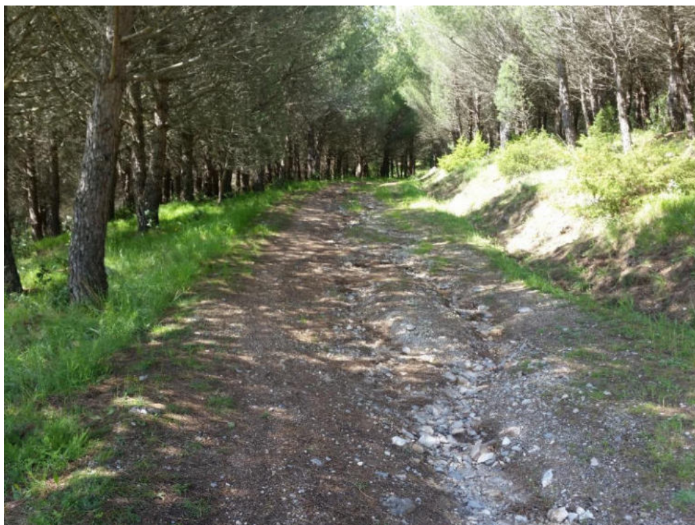
Int. 3.1.1 Pista Lavatoio 1