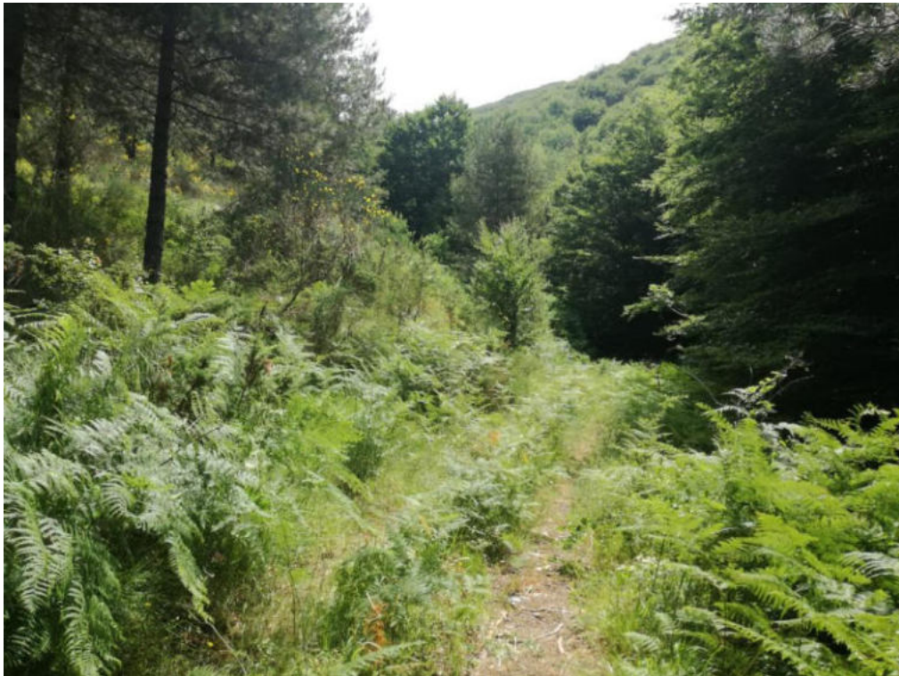
Int. 1.1.2 Loc. Pista Valle Varlaro