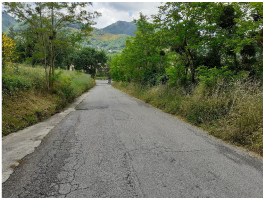
Int. 5.1.4 Loc. Strada San Lorenzo-Pedarreto 1°tratto NORD: 39°56'19.86" EST: E 16°2'49.65"