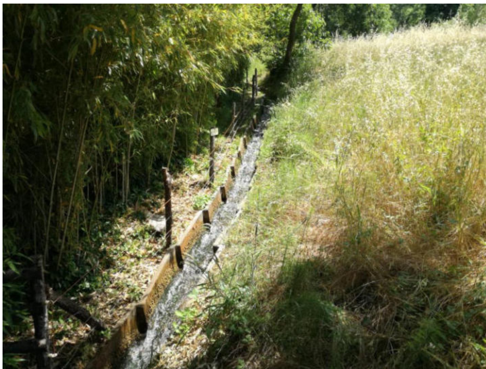
Int. 6.1.4 Canaletta Acqua del Patricone NORD: 39°56'31.66'' EST: 16°03'16.55''