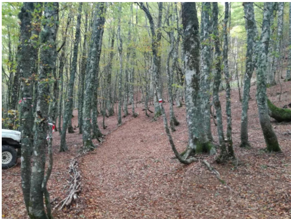
Int. 3.2.1 Sentiero Cozzo Ferriero NORD: 39°54'28.28'' EST: 16°05'21.05''