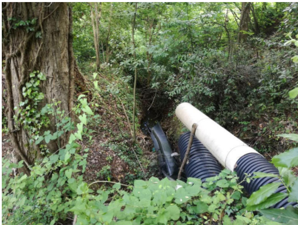
Int. 4.1.15 Fosso Giardini NORD: 39°56'49.14" EST: 16°02'39.15"