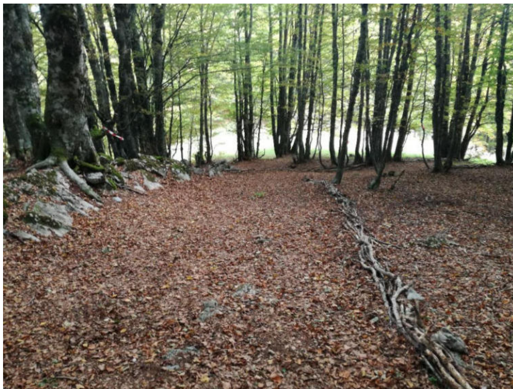
Int. 3.2.1 Sentiero del Cozzo Ferriero 904/C NORD: 39°54'28.28'' EST: 16°05'21.05''