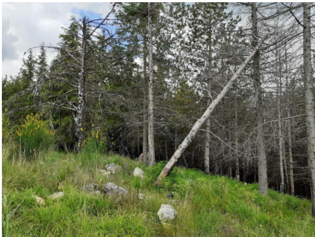
Int. 1.1.3 Loc. San Lorenzo 1