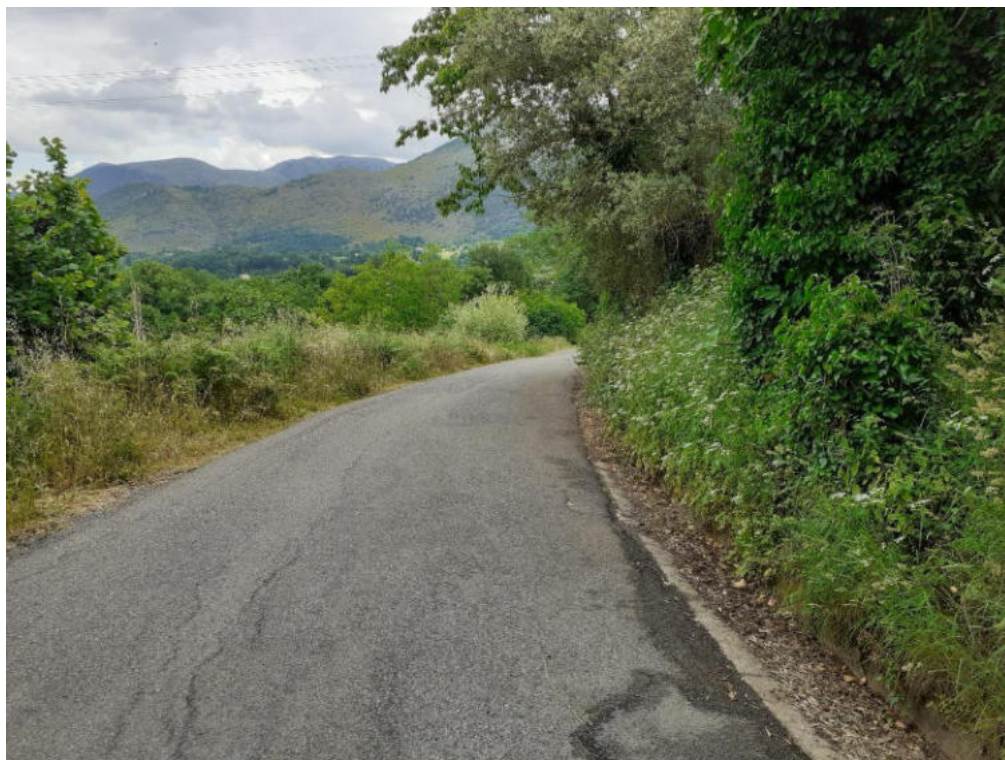
Int. 5.1.2 Loc. Strada Cassaneto-Zarafa NORD: 39°56'29.73" EST: 16°3'6.23"