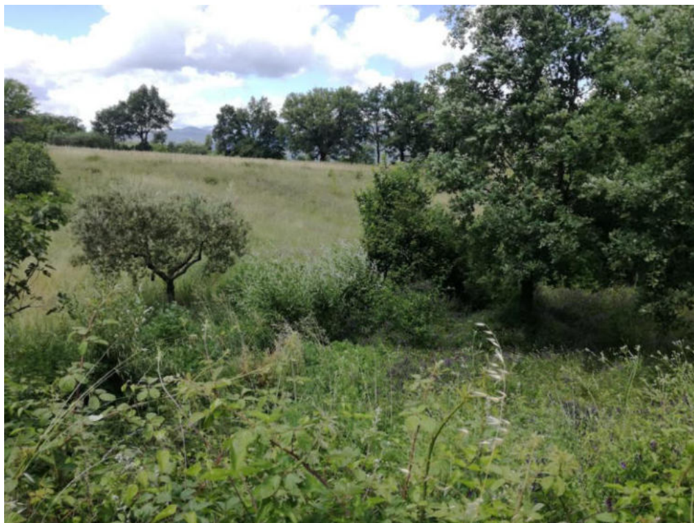
Int. 4.1.18 Fosso Formigosa NORD: 39°56'42.60" EST: 16°02'48.72"