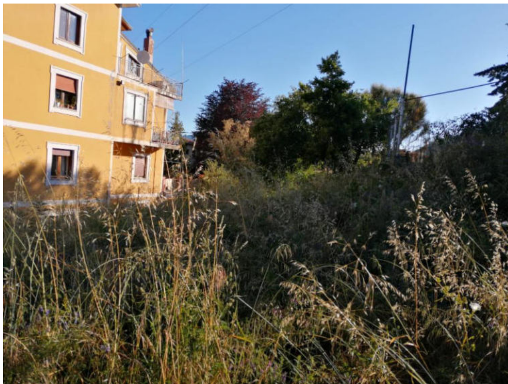
Int. 2.1.1 Loc. Schiavo via Roma (campetti sportivi) NORD: 39°56'19.86" EST: E 16°2'49.65"