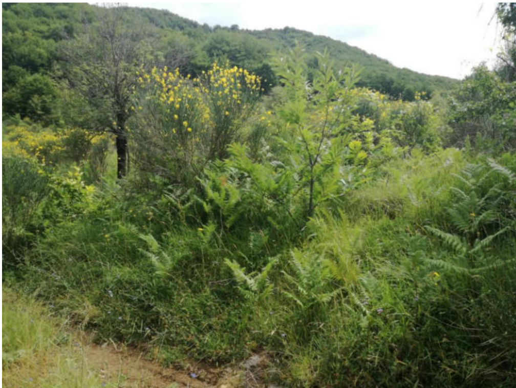
Int. 7.1.1 Loc. Valle Varlaro NORD: 39°54'9.40'' EST: 16°02'54.55''