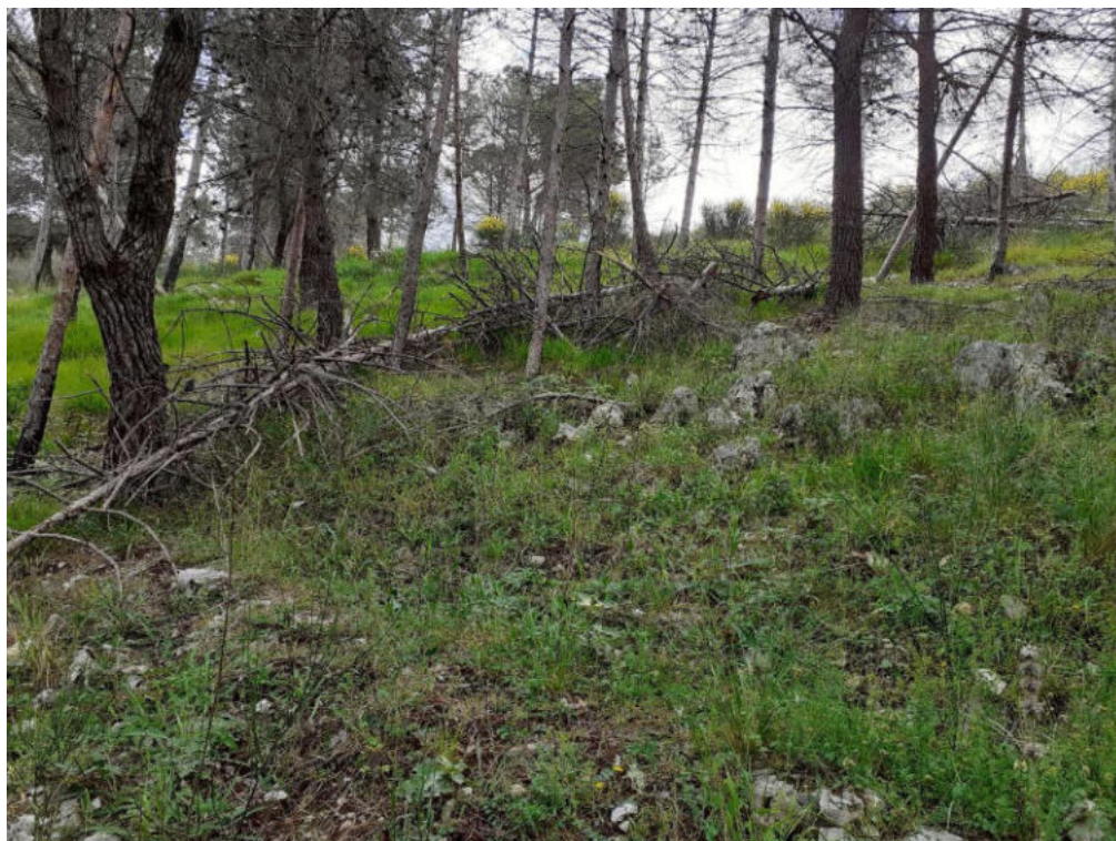
Int. 1.1.4 Loc. San Lorenzo 2