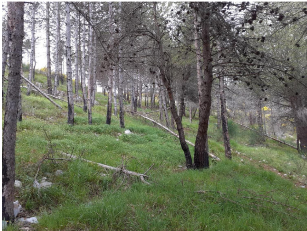
Int. 1.1.4 Loc. San Lorenzo 2