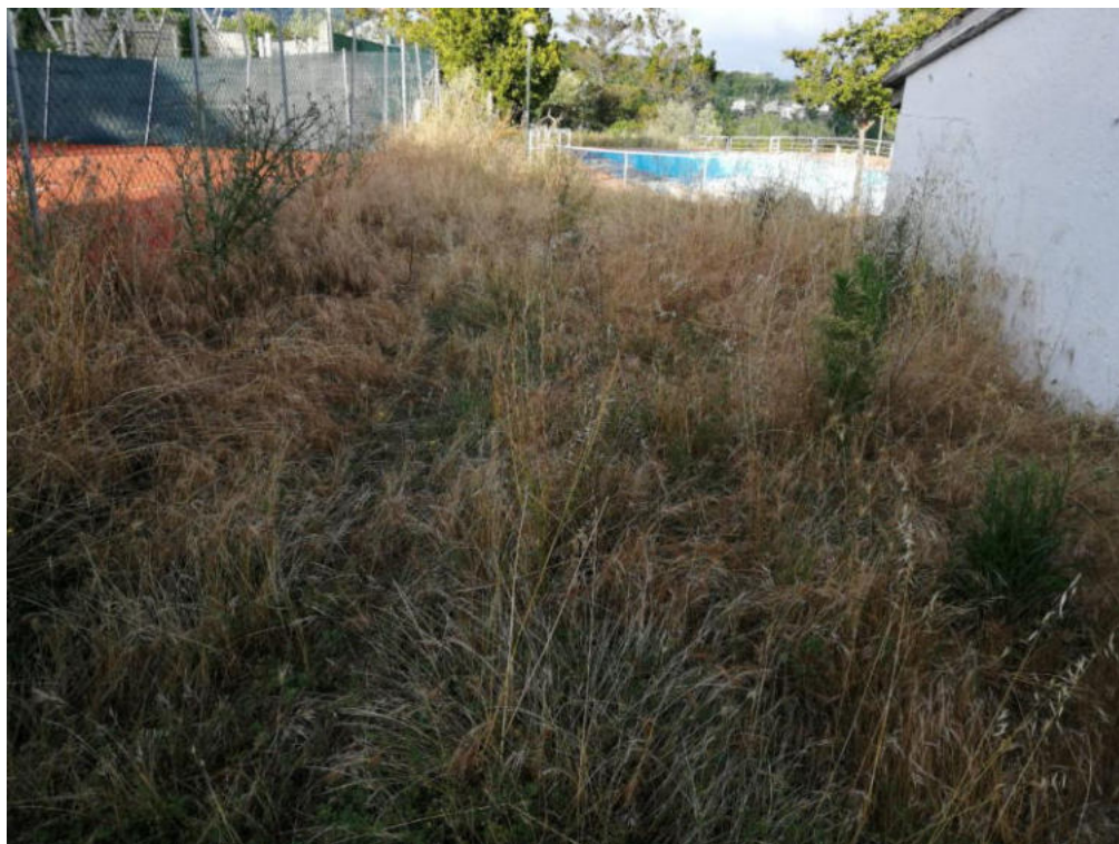
Int. 2.1.1 Loc. Schiavo via Roma (piscina comunale) NORD: 39°56'19.86" EST: E 16°2'49.65"