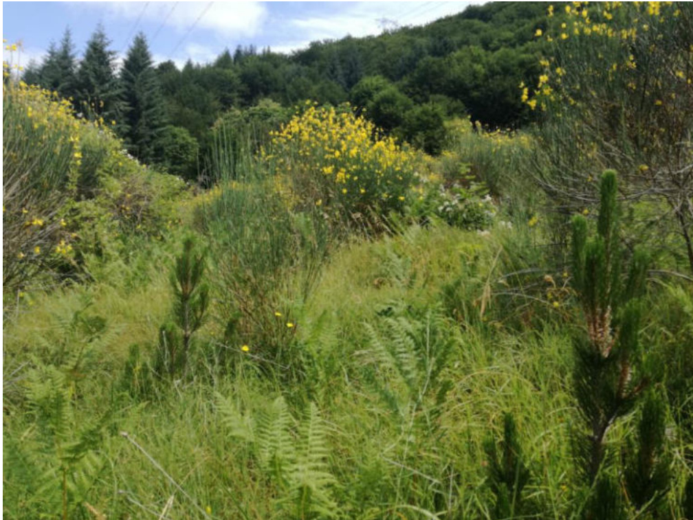
Int. 7.1.1 Loc. Valle Varlaro NORD: 39°54'9.40'' EST: 16°02'54.55''