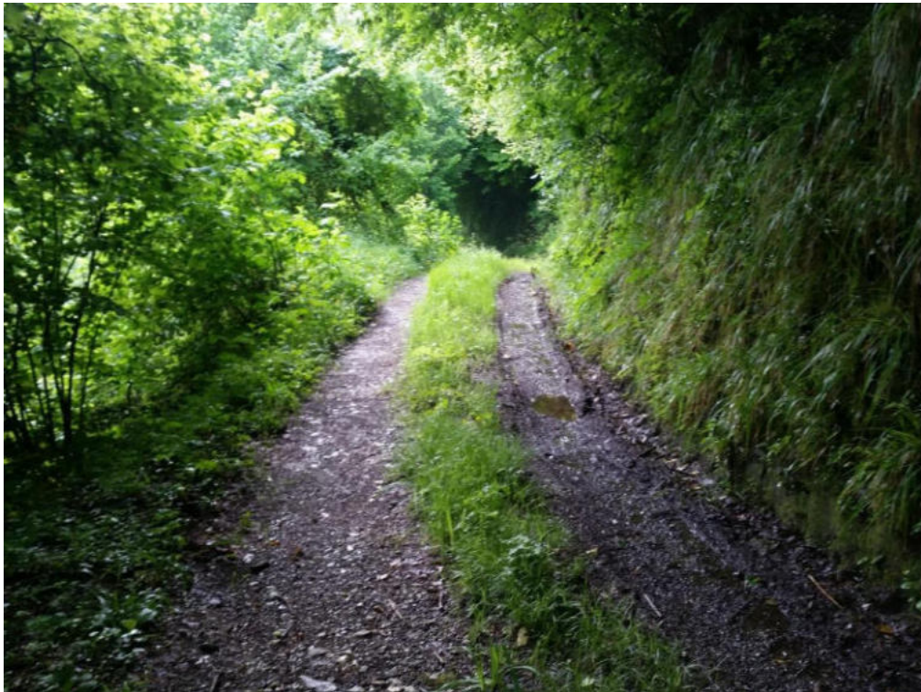
Int. 3.1.1 Pista Fiumara