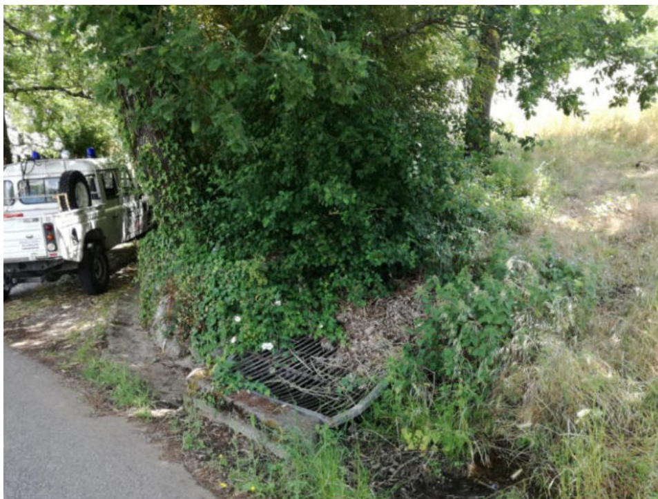
Int. 6.1.4 Canaletta Acqua del Patricone NORD: 39°56'31.66'' EST: 16°03'16.55''