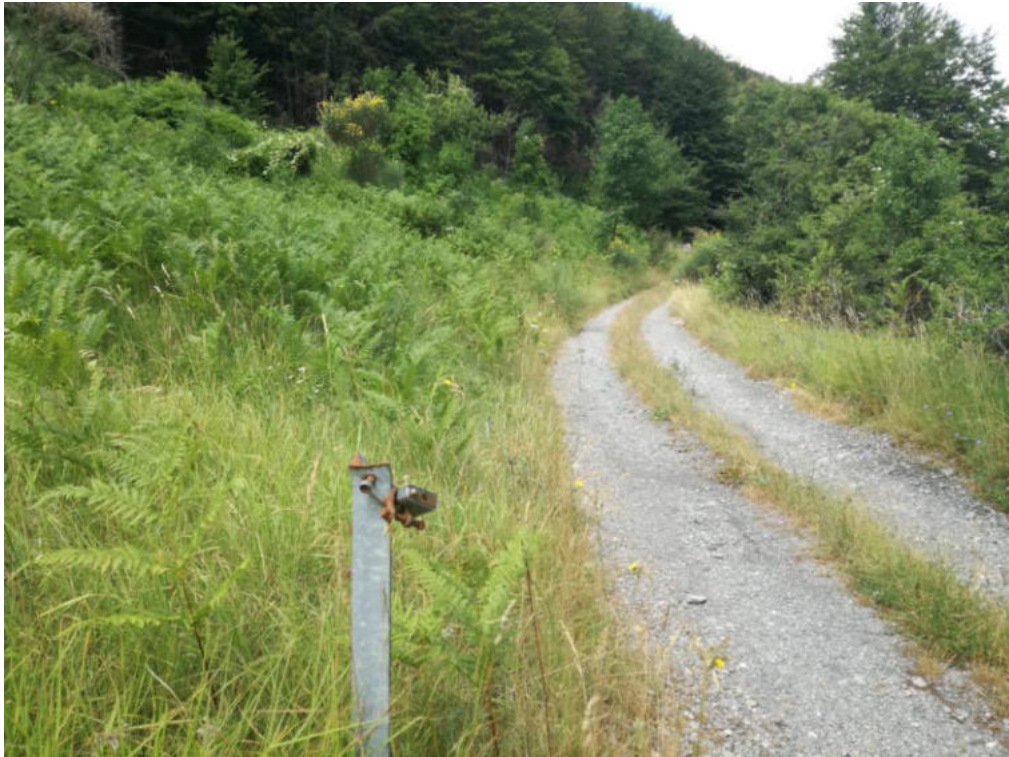
Int. 1.1.2 Loc. Pista Valle Varlaro