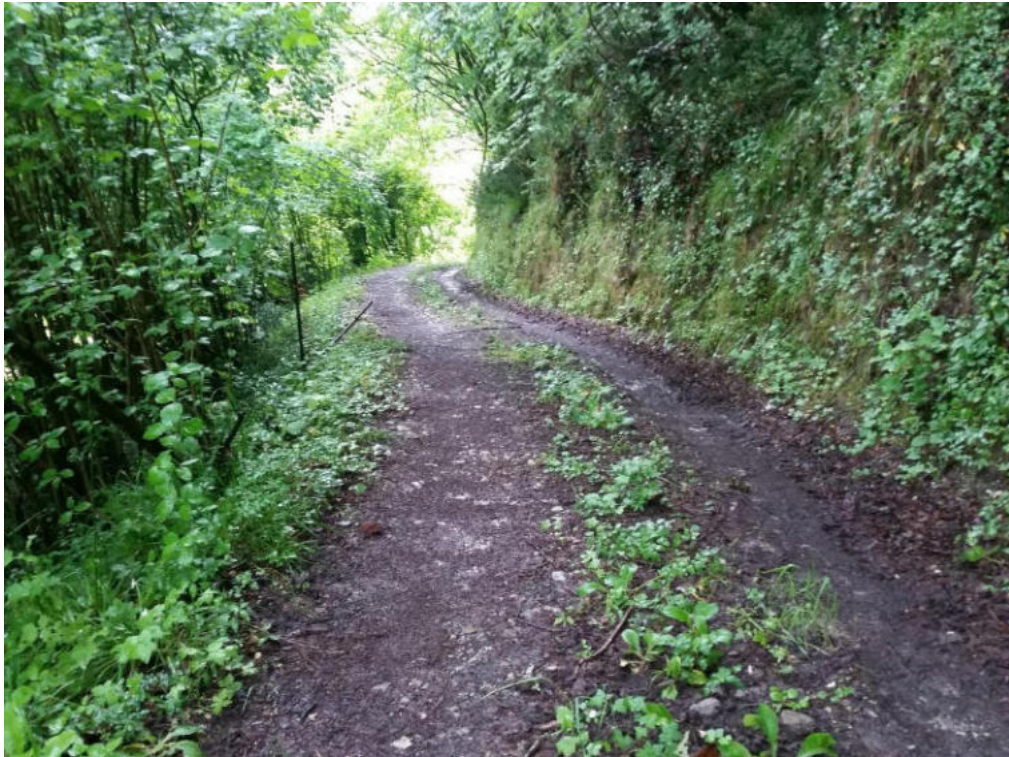
Int. 3.1.1 Pista Fiumara