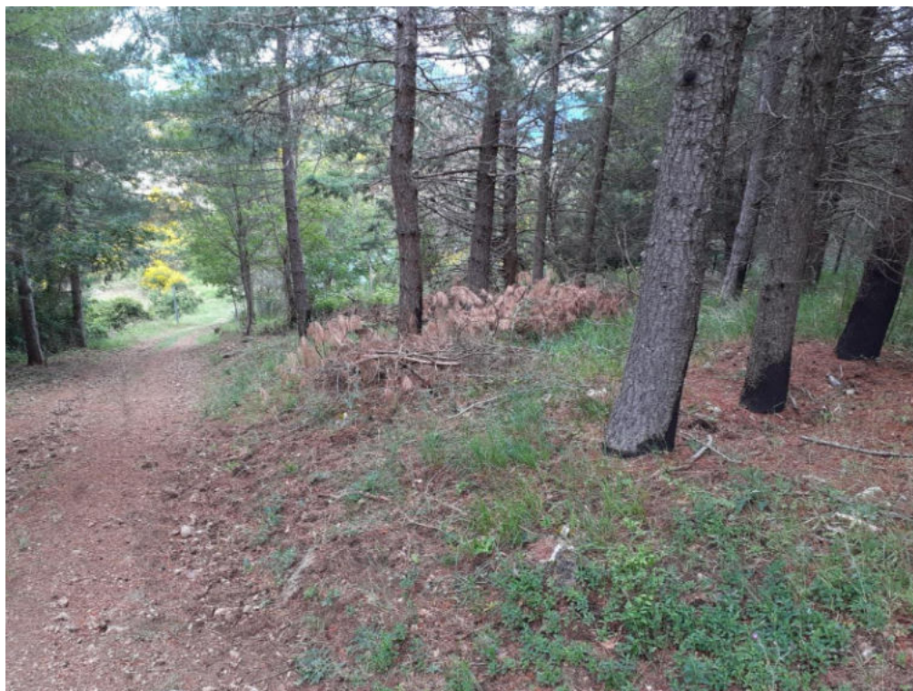
Int. 1.1.3 Loc. San Lorenzo 1