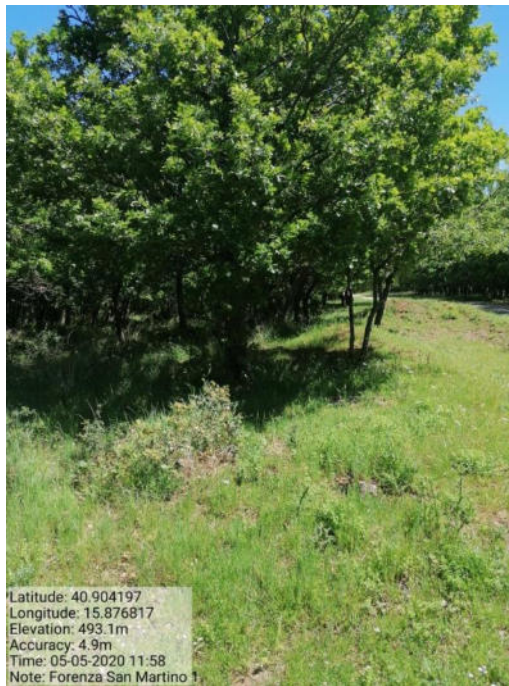
Int. 1 Loc. San Martino fascia tagliafuoco