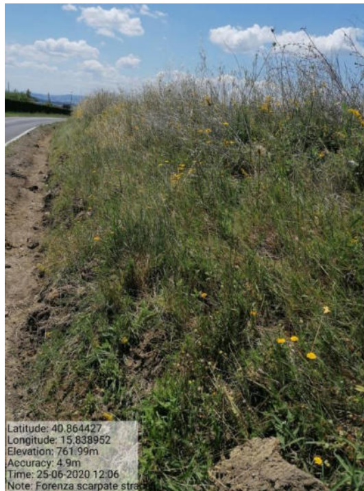
Int. 5 Loc. s. Giuliano