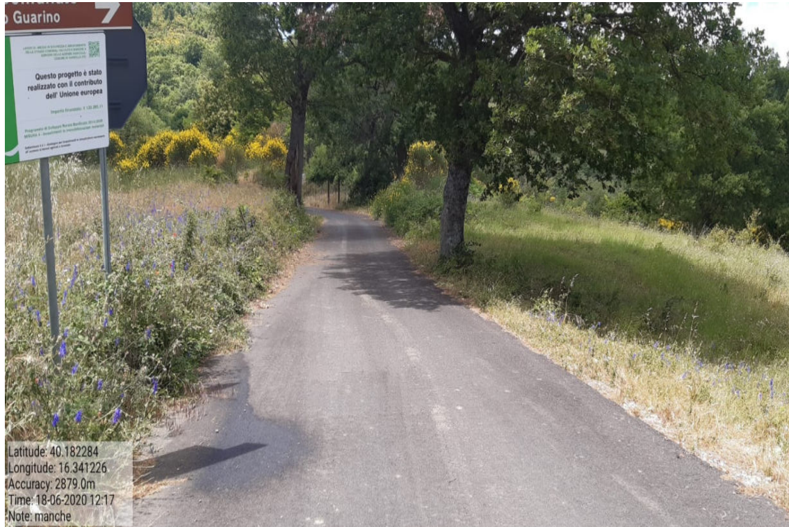
Int. 5.2.16 - Manche