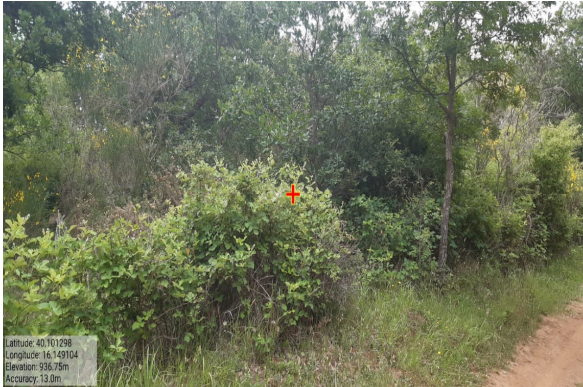
Int. 1.1.2 – Loc. Serra Cerrosa( Belvedere)