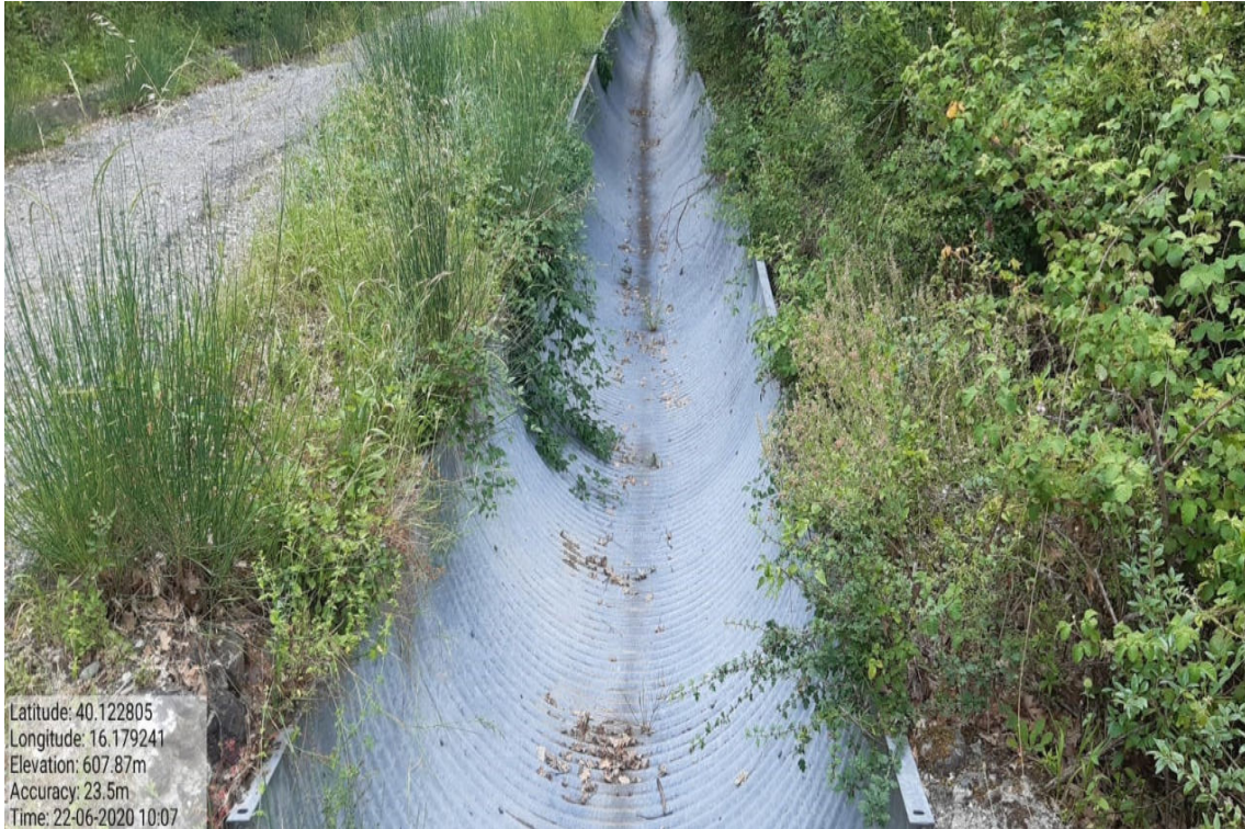
Int. 6.1.6,7 Armco - Piano Molino - Piscicolo