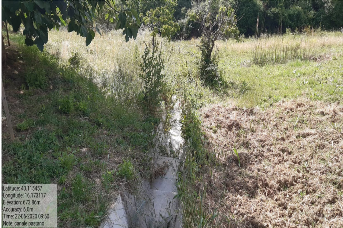
Int. 6.1.5 Canalette - Pastani