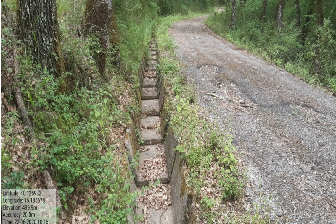
Int. 6.1.7 Canalette – Piano Mulino