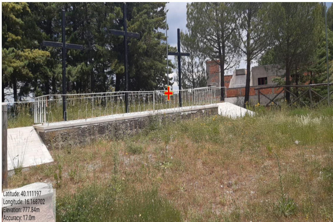
Int. 2.1.1 – Centro Abitato