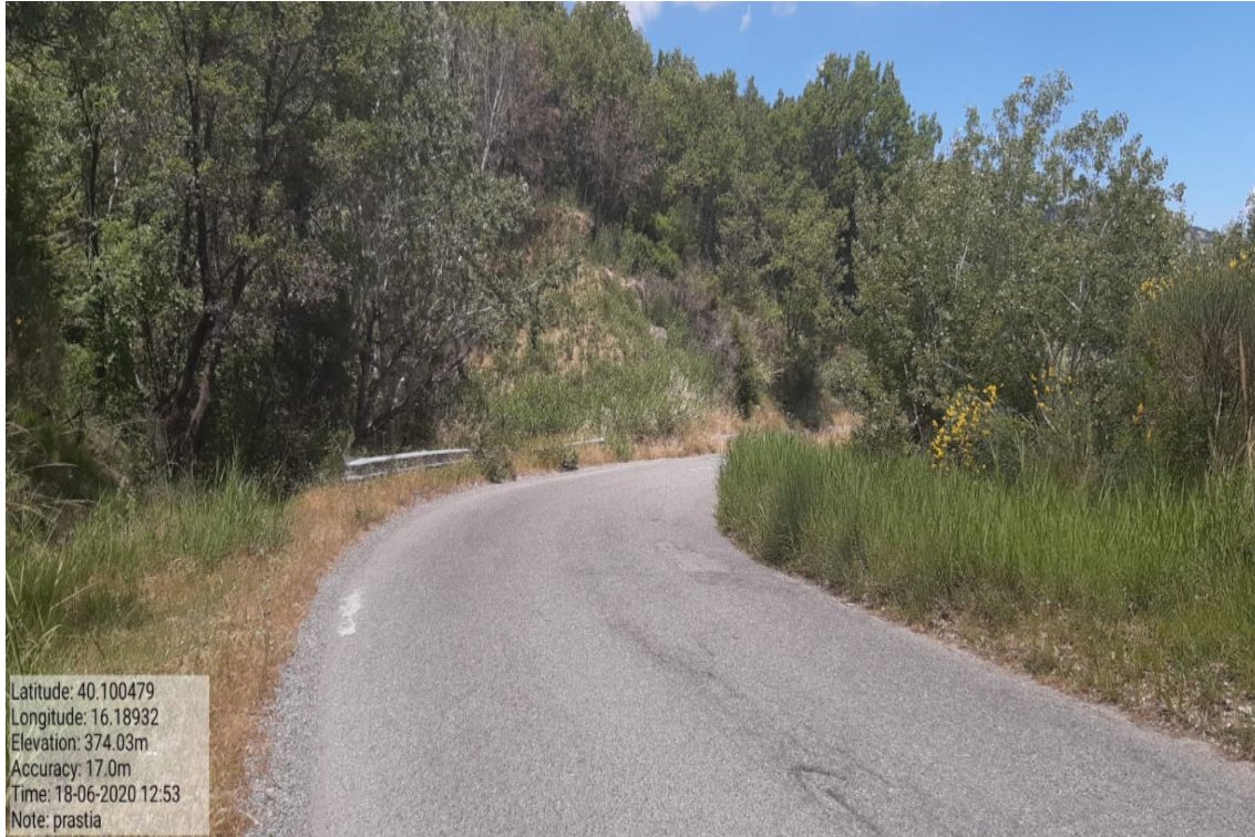
Int.5.1.2-5.2.2 - Serretta-Prastia