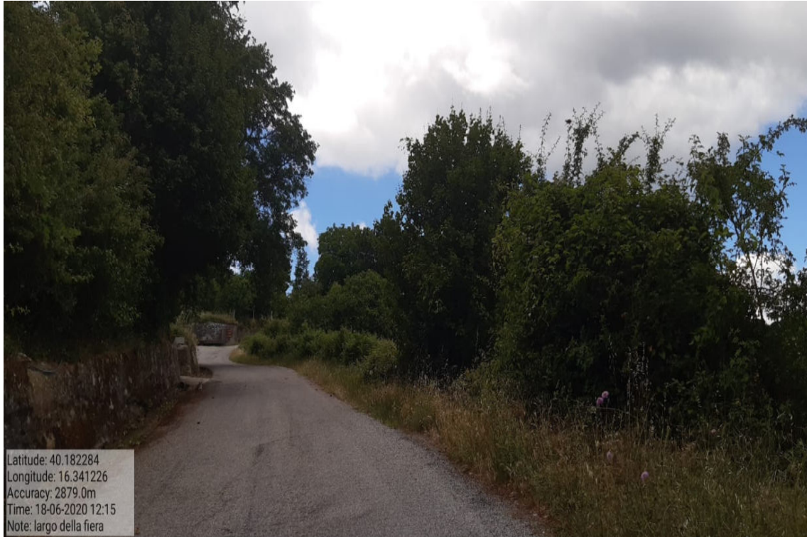
Int. 5.1.3-5.2.3 - Strada Largo Fiera