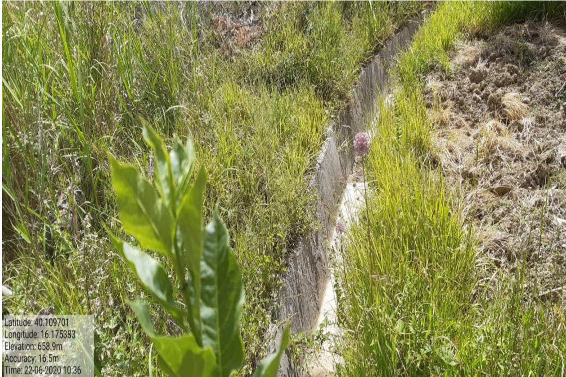
Int. 6.1.4 Canalette - Prastia