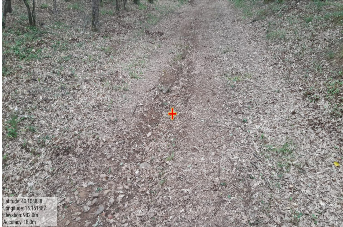
Int. 3.1.1 – Loc. Serra Cerrosa( Belvedere) – Serra dello Zingaro