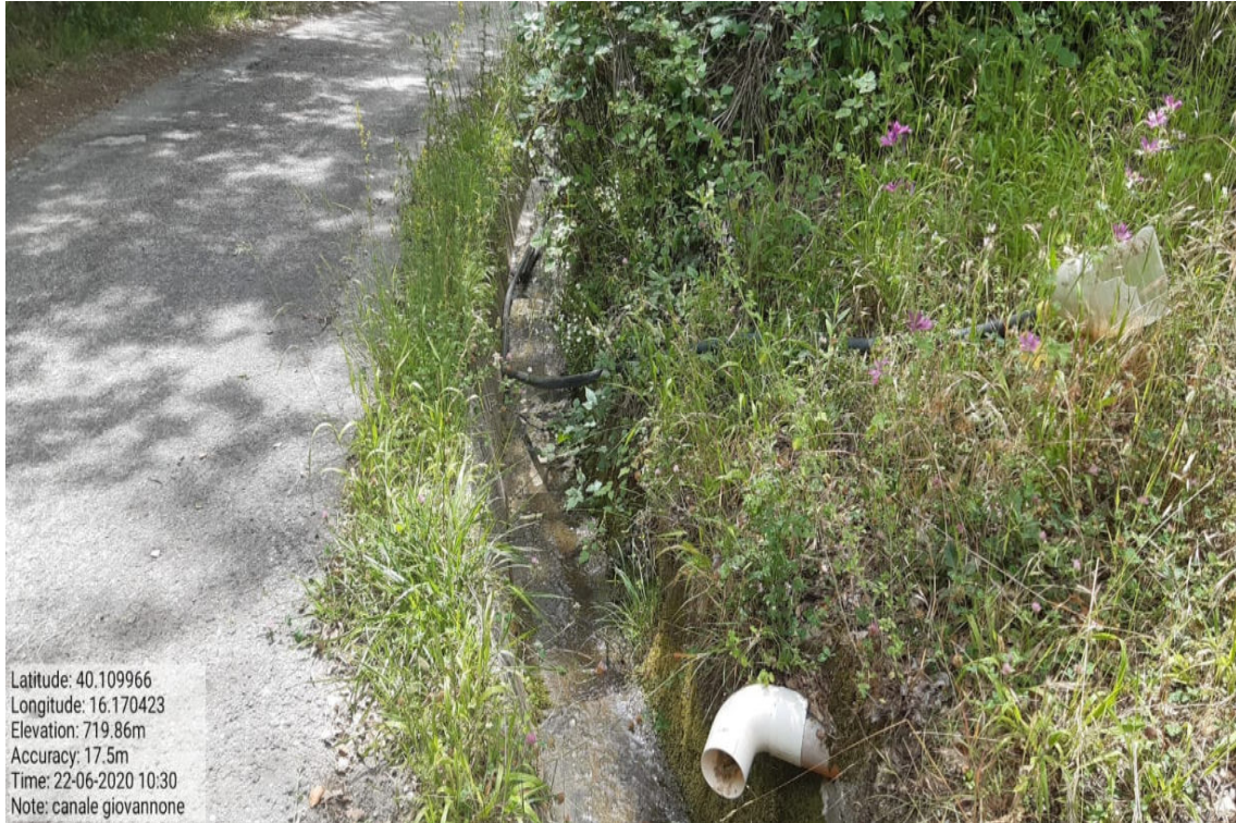
Int. 6.1.3 Canalette - Giovannone