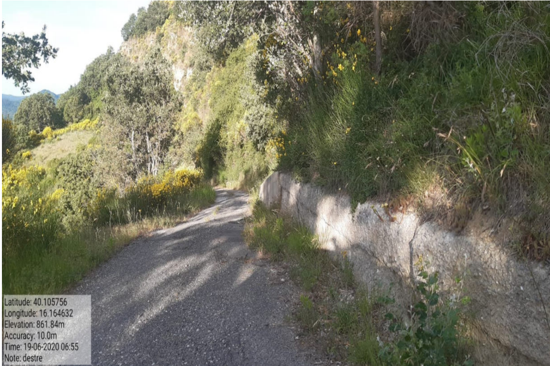
Int. 5.1.6-5.2.6 - Destre