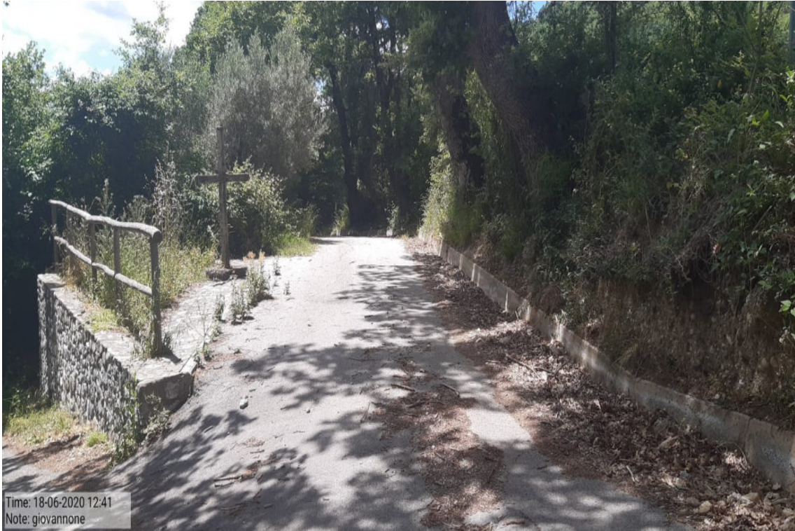
Int. 5.2.11 - Giovannone