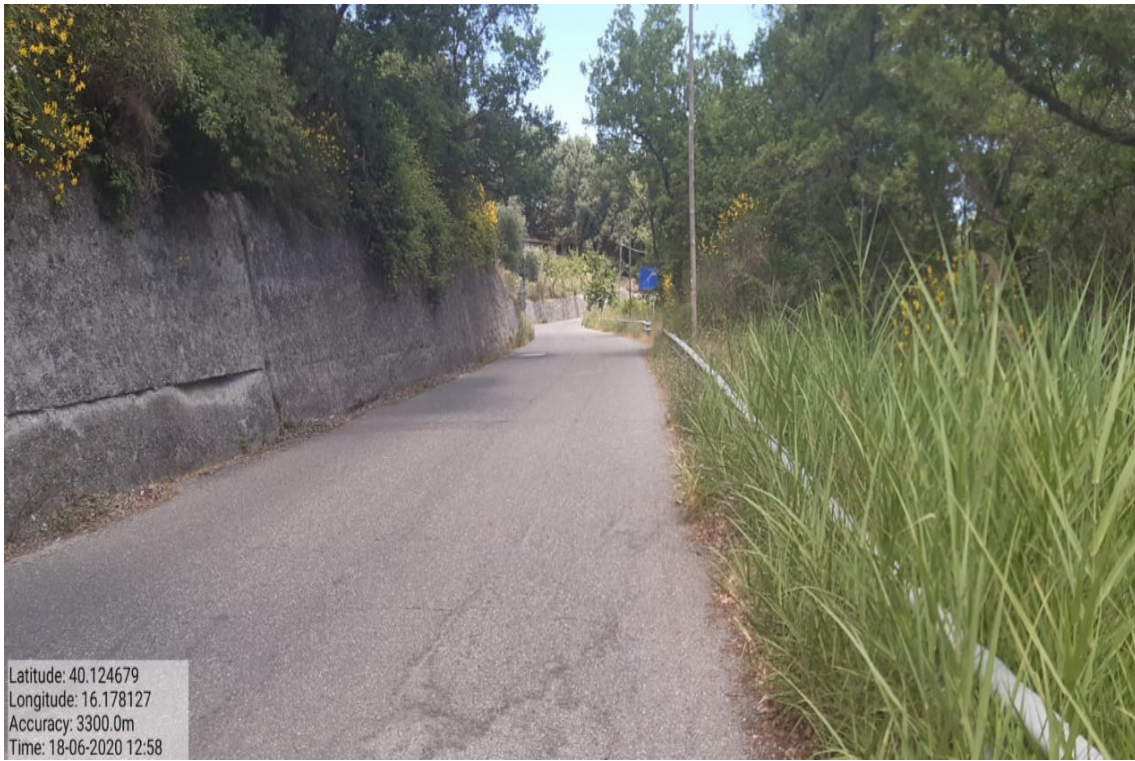
Int. 5.1.7-5.2.7 – Bivio Fardella – Bivio Ponte Chiaromonte