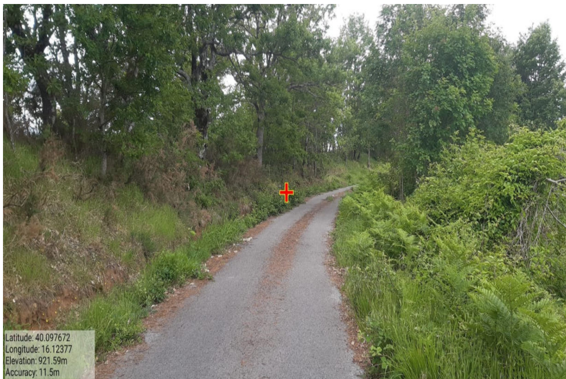
Int. 1.1.1 – Loc. Serra Cerrosa