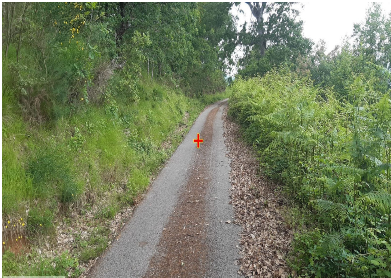
Int. 5.2.10 – Incrocio strada Episcopia – Incrocio Belvedere