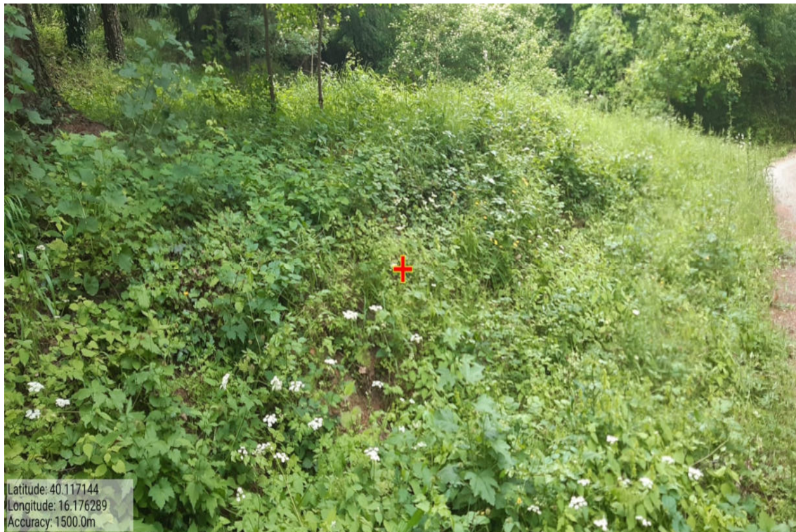
Int. 7.1.1 – Parco Barbattavio