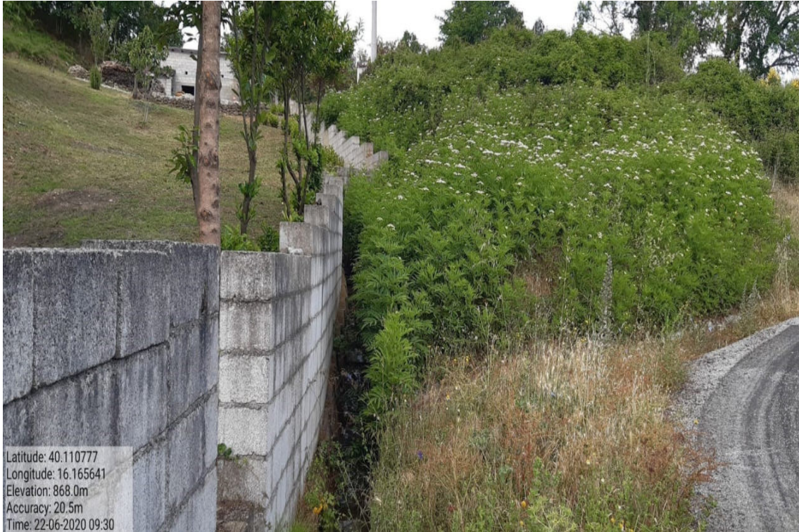
Int. 6.1.2 – Serbatoio