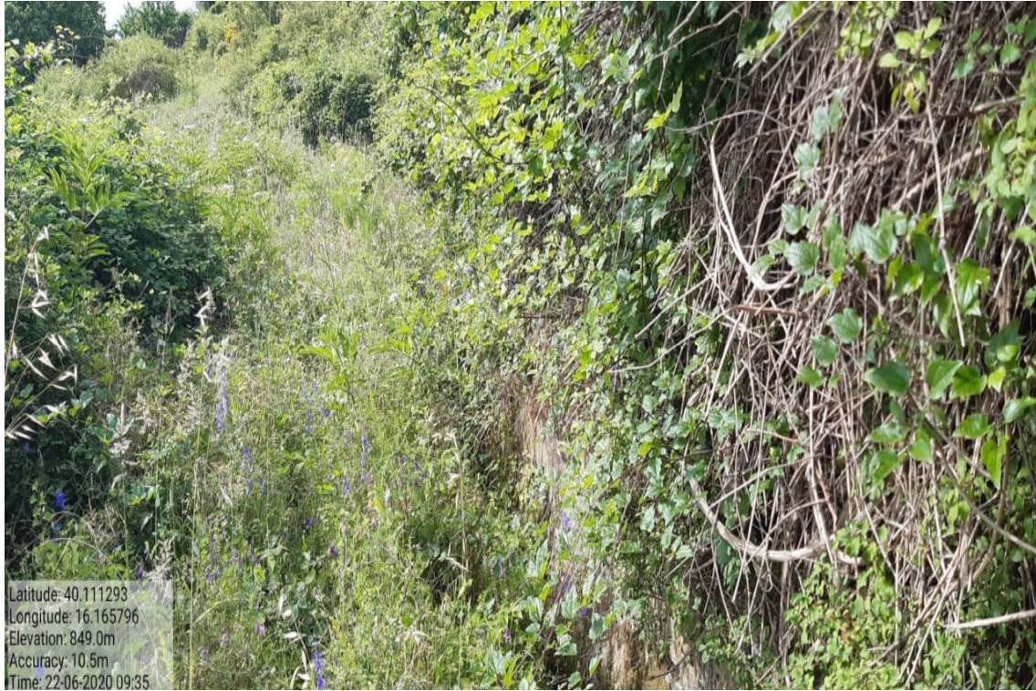
Int. 6.1.1- Canalette – Largo della Fiera