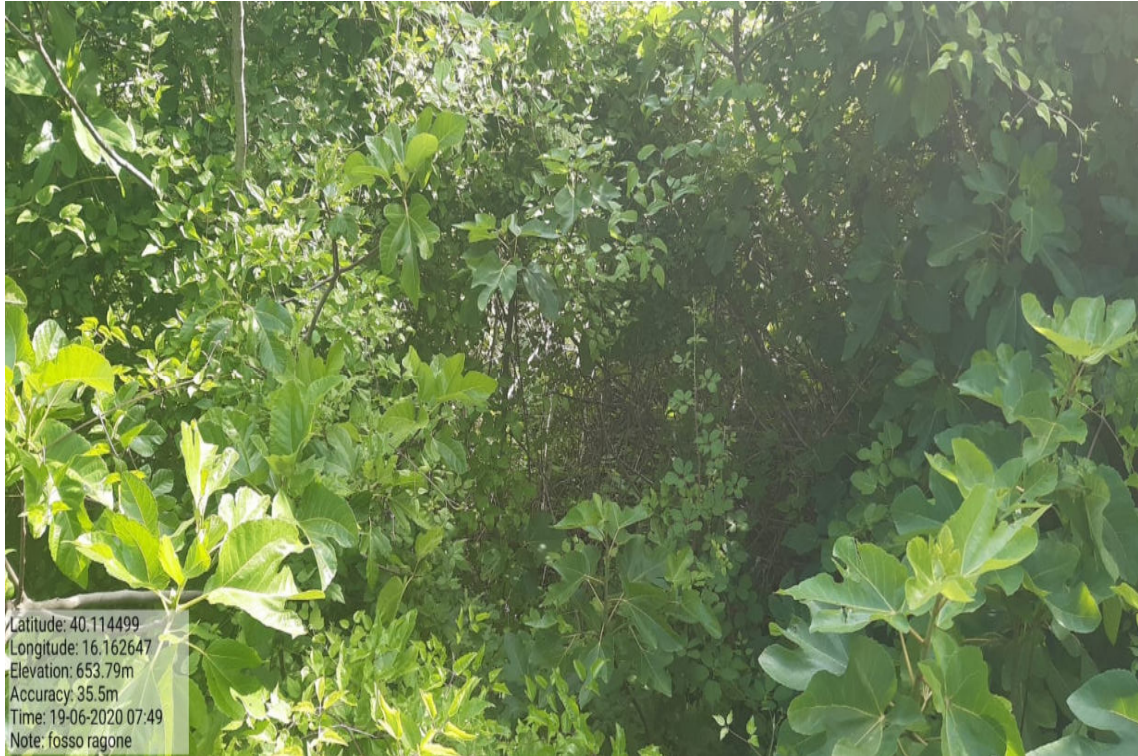
Int. 4.1.1 - Fosso Ragone