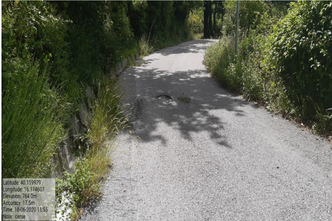
Int. 5.2.15 - Strada Cerse