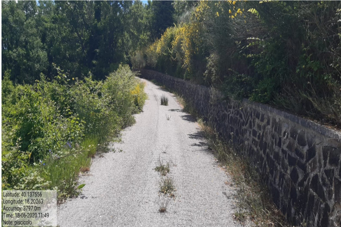
Int. 5.2.13 - Piscicolo