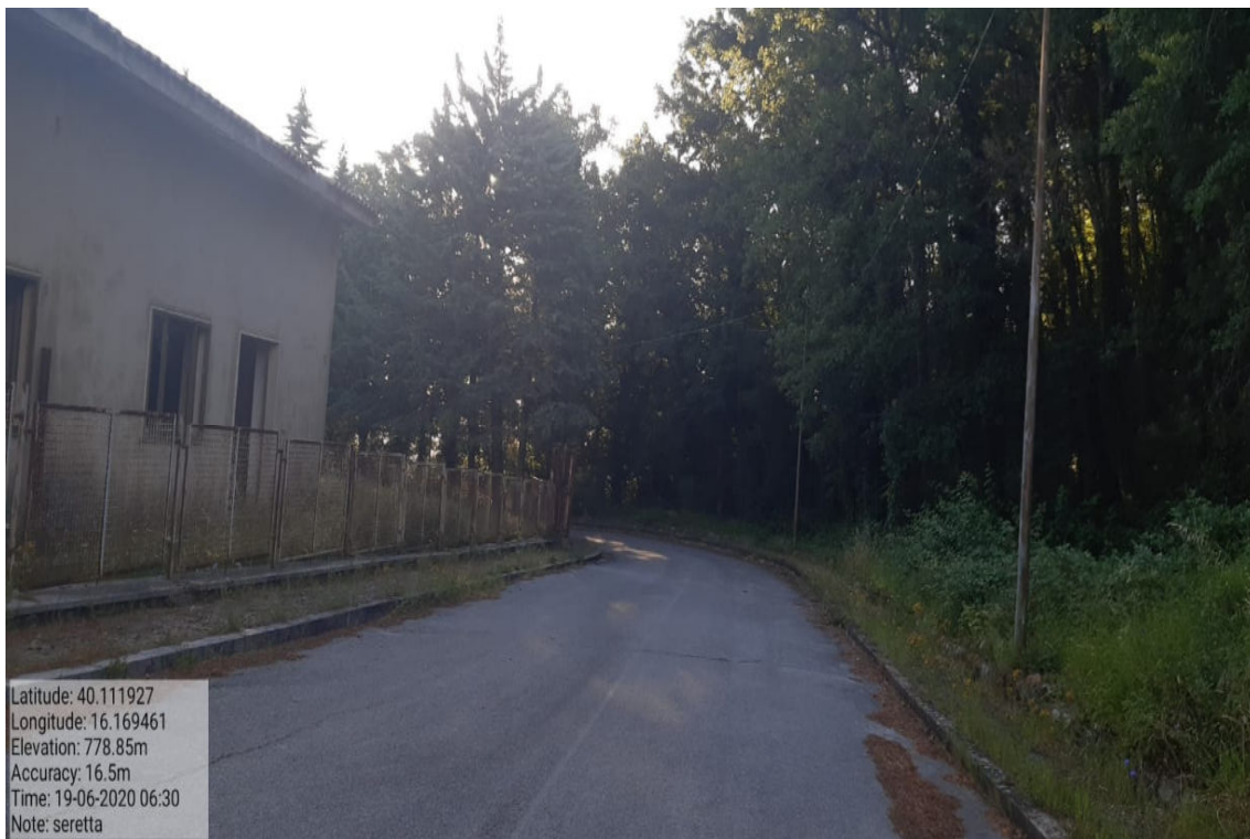
Int. 5.1.1-5.2.1 - Strada Serretta-Antonione