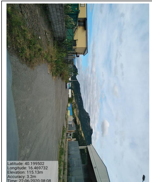
Int. 5.1.2 - COLOBRARO Zona PIP - Foto 30