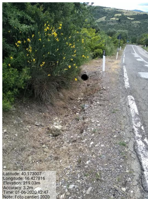
Int. 5.2.1 Strada comunale Valsinni/ Colobraro - Foto 26