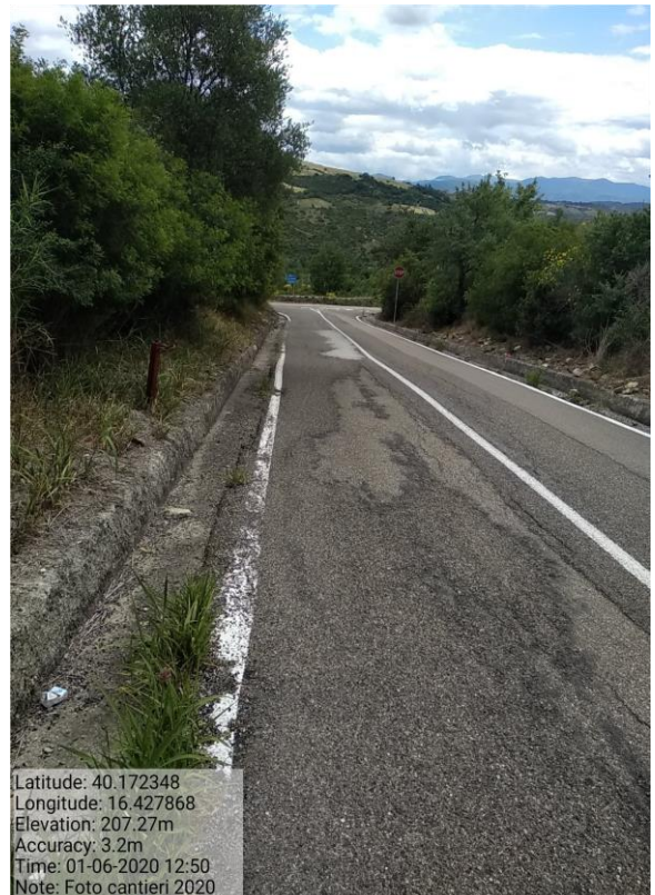
Int. 5.1.1.1 Strada comunale Valsinni/Colobraro - Foto 22