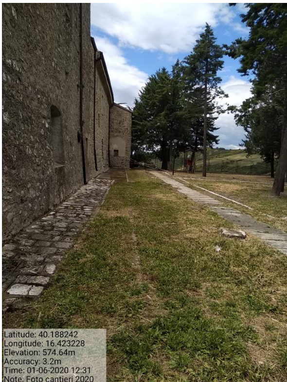
Int. 2 Verde urbano e periurbano- Foto 6