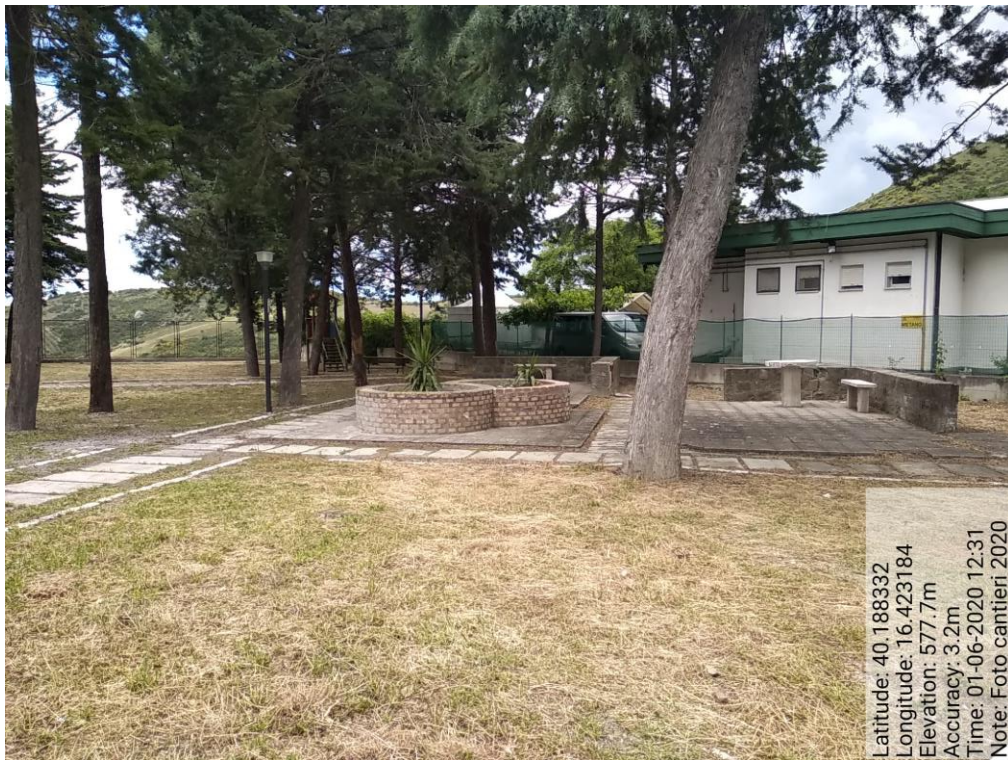
Int.2 – Verde urbano e periurbano - Foto 5