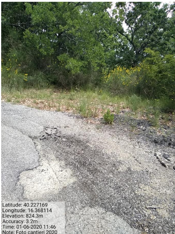
Int.1.1.2 Loc . Sirianni - Foto 10