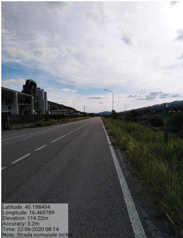
Int.5.1.3 - STRADA COMUNALE ISCHIA - Foto 28