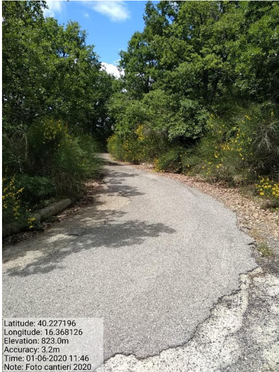
Int.1.1.1 - loc. Sirianni -Foto 8