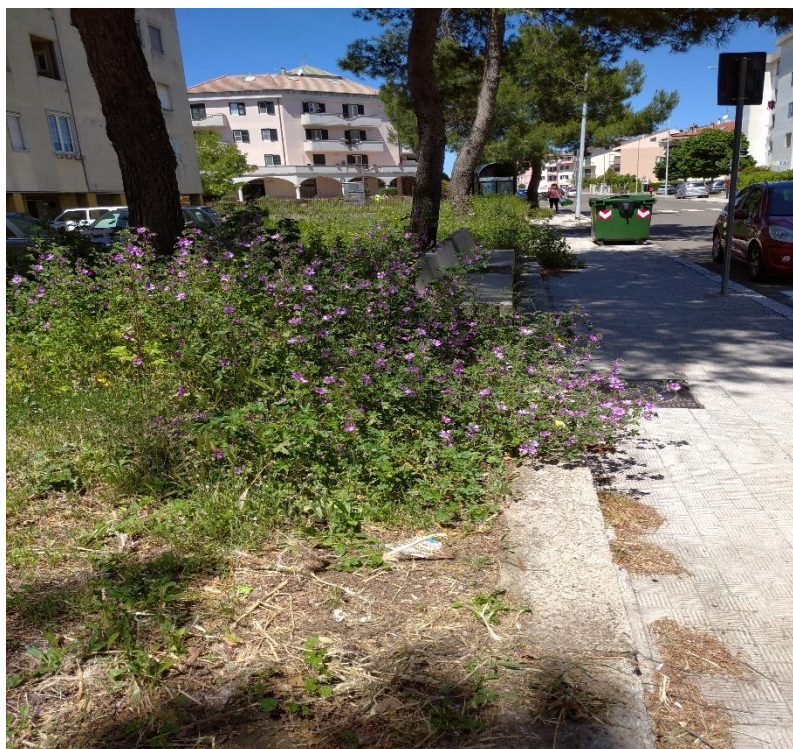
Int. 2.1 Loc.Via Mazzini – Ferrandina ; VERDE URBANO Coordinate geo. 40.506086N 16.49039E