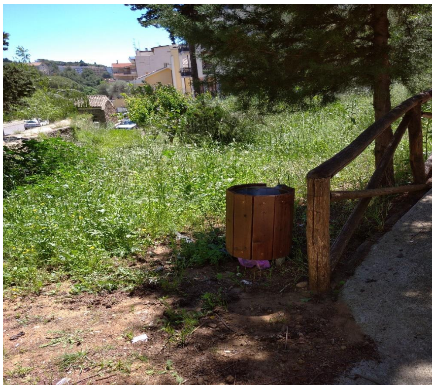
Int. 2.1 Loc.Villa Pirretti – Ferrandina ; VERDE URBANO Coordinate geo. 40.503806N 16.451782E