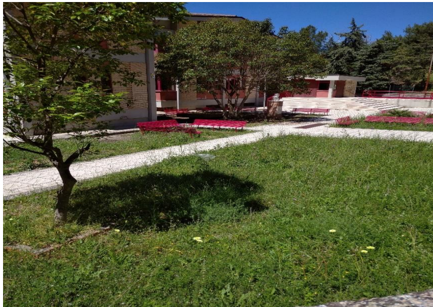
Int. 2.1 Loc.Scuole Medie – Ferrandina; VERDE URBANO Coordinate geo. 40.500768N 16.456051E