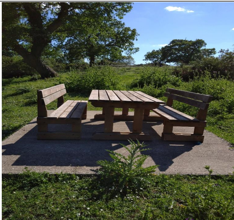
Int.1.2.1 Loc.Fonnoni – parco - Ferrandina; DECESPUGLIAMENTO DEL TERRENO Coordinate geo. 40.534154N 16.371283E