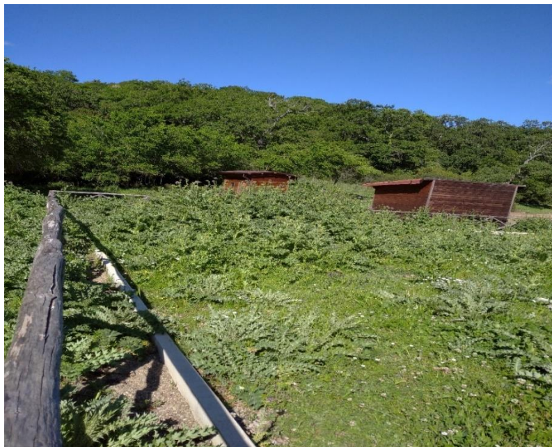
Int. 1.2.1 Loc.Fonnoni – Ferrandina – parco; DECESPUGLIAMENTO DEL TERRENO Coordinate geo. 40.53477N 16.37146E