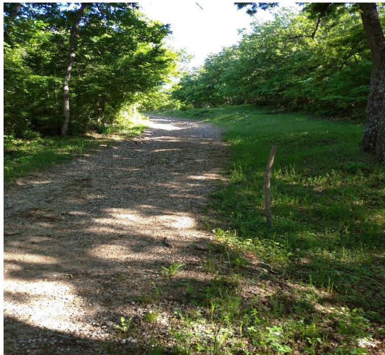
Int. 3.1.1 Loc. La Dispensa , Fonnoni, San Nicola - Ferrandina ; MANUTENZIONE DI PISTA FORESTALE Coordinate geo. 40.546361N 16.378774E