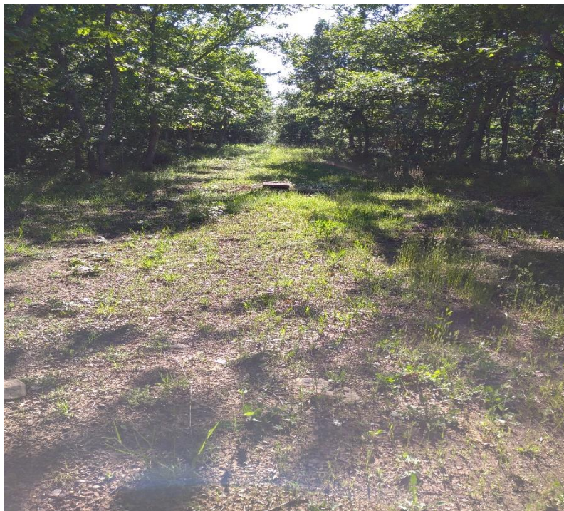
Int.1.1.1 Loc. La Dispensa- Ferrandina; manutenzione VIALE TAGLIAFUOCO Coordinate geo. 40.546341N 16.375484E

MACRO AREA MATERA U.P.T. 7 SUB-AREA N 5 - COMUNE DI FERRANDINA