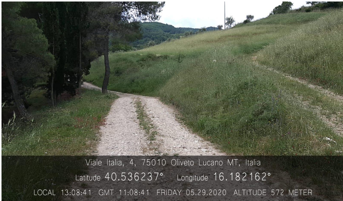
Int. 3.2.2 Loc. Mezzane(via Italia) – Oliveto Lucano ; MANUTENZIONE DI PISTA FORESTALE Coordinate geo. 40.536237N 16.182162E