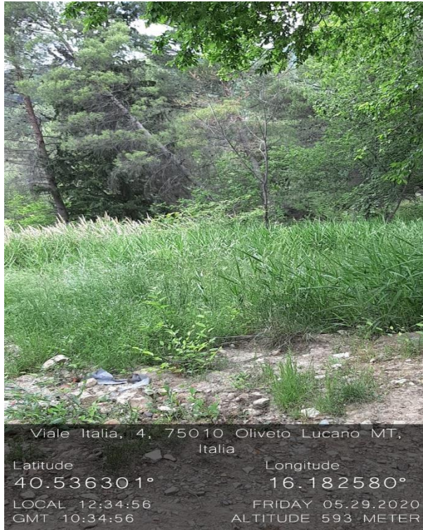
Int. 1.1.3 Loc.Destre( viale Italia) – pineta – Oliveto Lucano; DECESPUGLIAMENTO DEL TERRENO Coordinate geo. 40.536301N 16.182580E