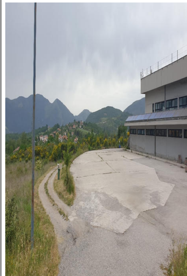
FOTO 1- INT. 1.1.1 Loc. – Bosco Ralle coordinate 0555684-4486271