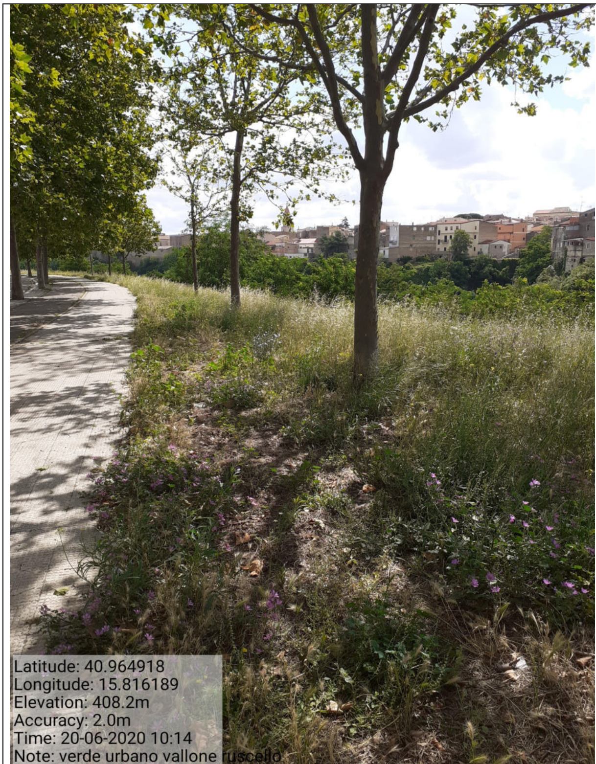
Int. 2.1.1 Verde Urbano Vallone Ruscello