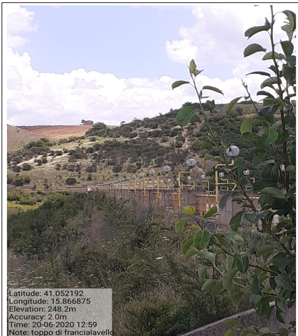
Int.5.1.2 Località Toppo di Francia