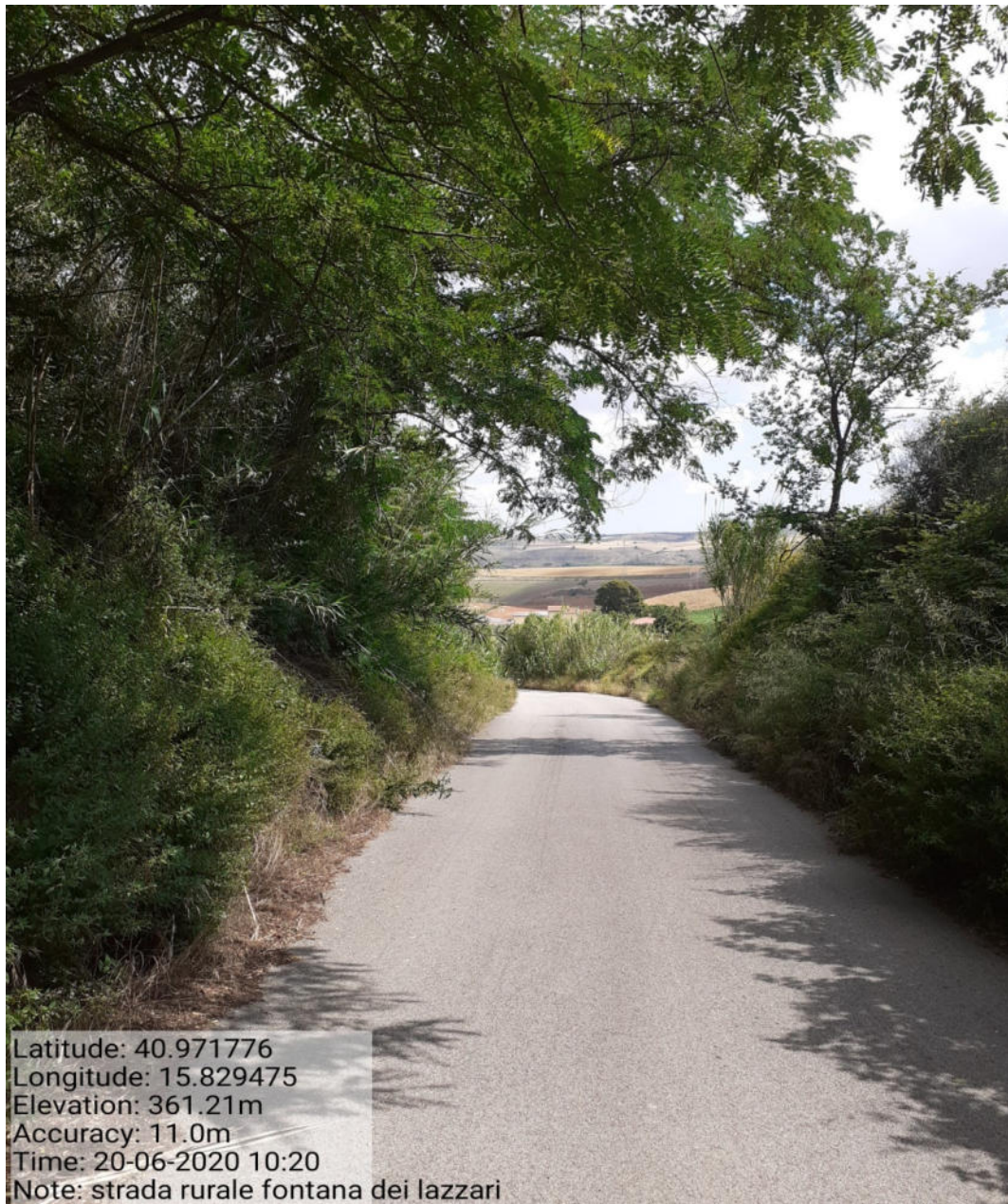
Int. 5.1.3 Strada Fontana dei Lazzari