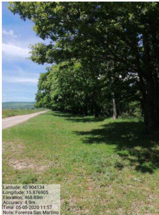
Int. 1 Loc. San Martino fascia tagliafuoco