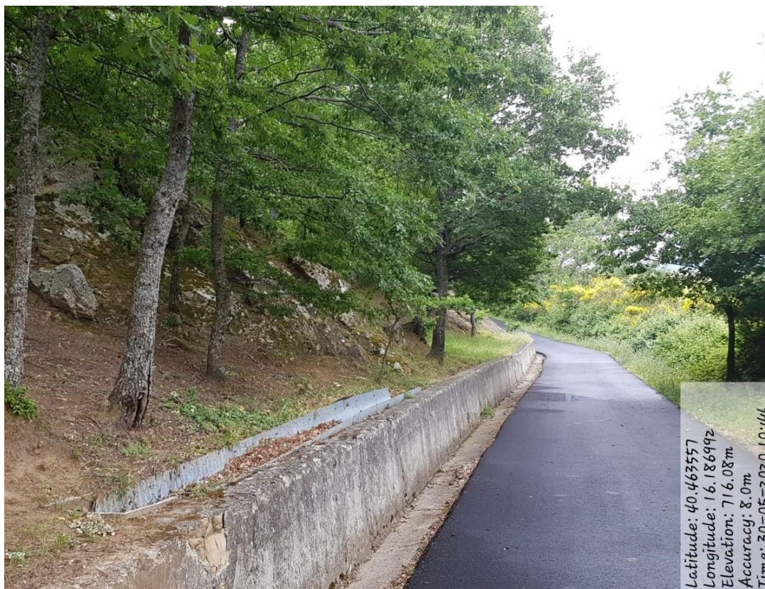
INT. 1.1.2 LOC. COSTE DI RAIA