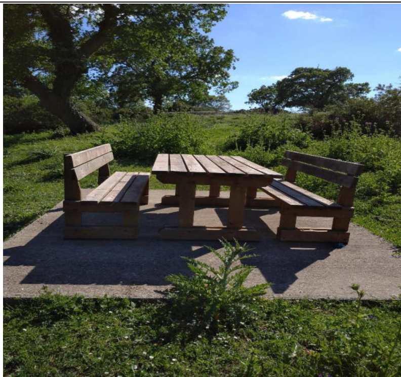
Int. 1.2.1 Loc.Fonnoni – parco - Ferrandina; DECESPUGLIAMENTO DEL TERRENO Coordinate geo. 40.534154N 16.371283E