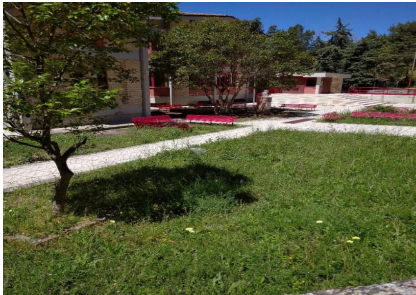
Int. 2.1 Loc.Scuole Medie – Ferrandina; VERDE URBANO Coordinate geo. 40.500768N 16.456051E