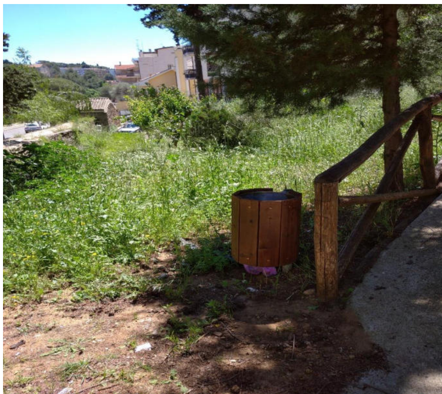
Int. 2.1 Loc.Villa Pirretti – Ferrandina ; VERDE URBANO Coordinate geo. 40.503806N 16.451782E