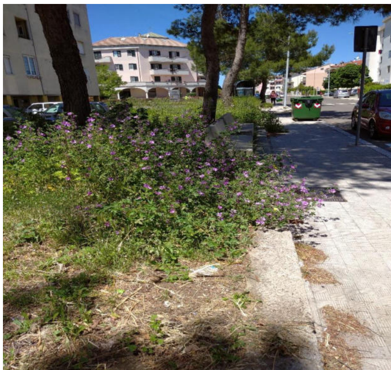
Int. 2.1 Loc.Via Mazzini – Ferrandina ; VERDE URBANO Coordinate geo. 40.506086N 16.49039E