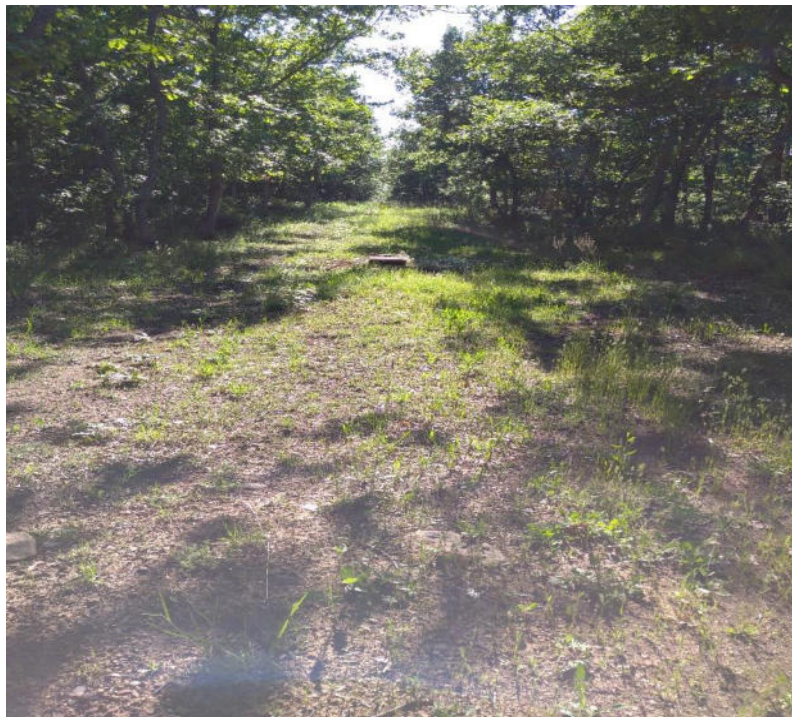
Int.1.1.1 Loc. La Dispensa- Ferrandina; manutenzione VIALE TAGLIAFUOCO Coordinate geo. 40.546341N 16.375484E

MACRO AREA MATERA U.P.T. 7 SUB-AREA N 5 - COMUNE DI FERRANDINA