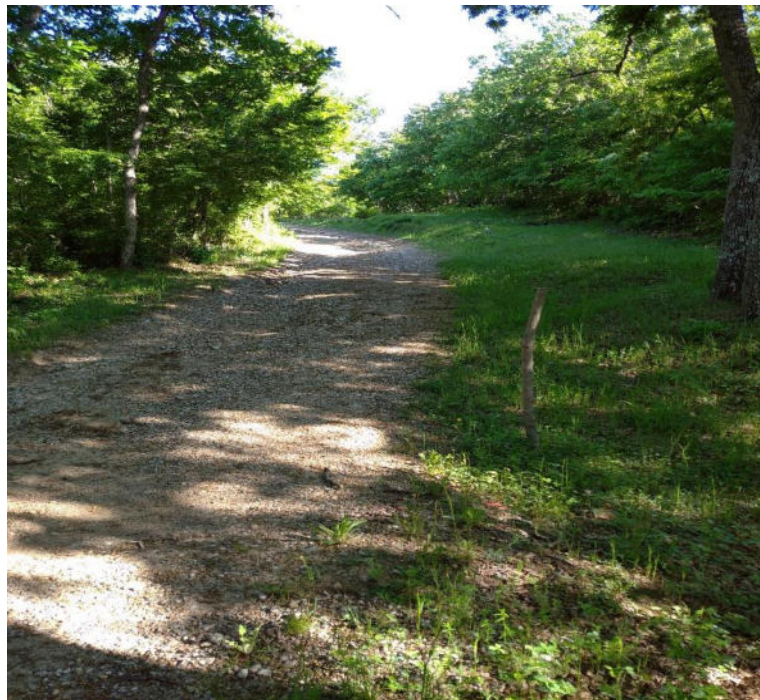
Int. 3.1.1 Loc. La Dispensa , Fonnoni, San Nicola - Ferrandina ; MANUTENZIONE DI PISTA FORESTALE Coordinate geo. 40.546361N 16.378774E