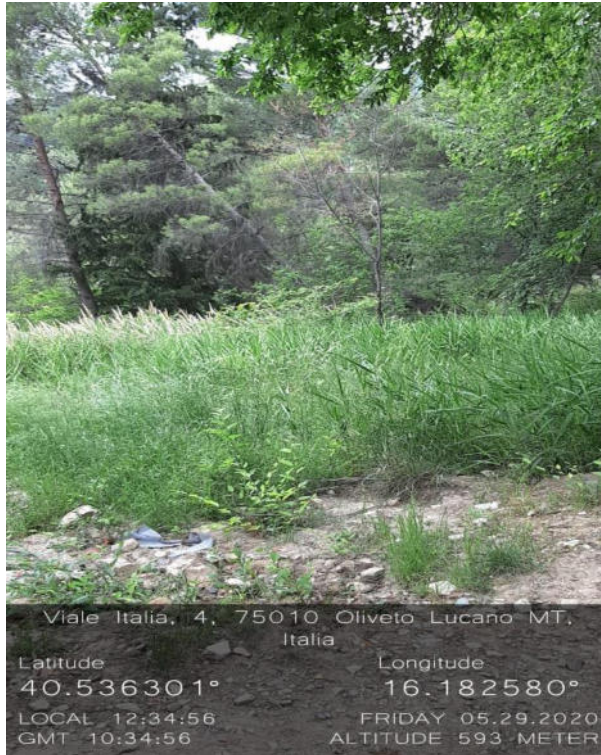
Int. 1.1.3 Loc.Destre( viale Italia) – pineta – Oliveto Lucano; DECESPUGLIAMENTO DEL TERRENO Coordinate geo. 40.536301N 16.182580E