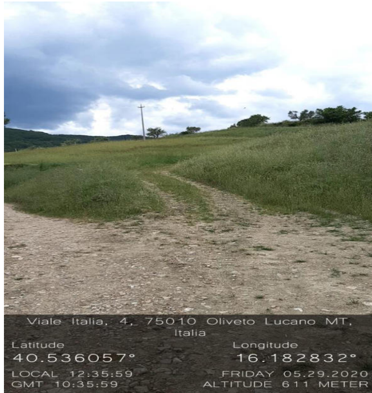
Int. 3.2.1 Loc.Destre (via Italia) – Oliveto Lucano; MANUTENZIONE DI PISTA FORESTALE Coordinate geo. 40.536057N 16.182832E