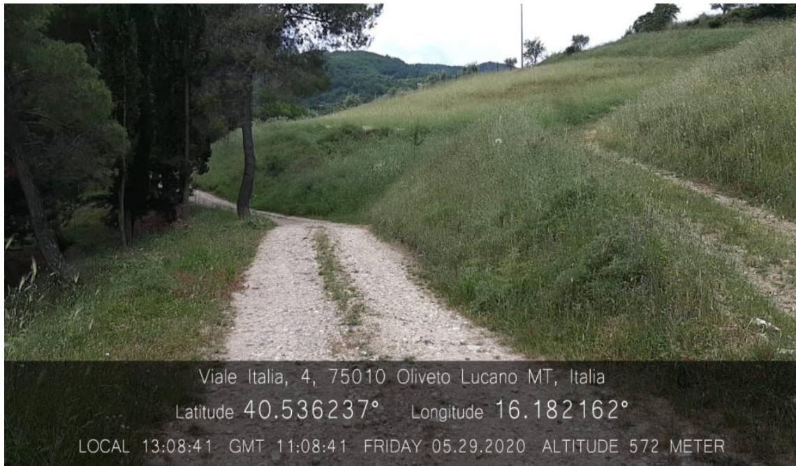
Int. 3.2.2 Loc. Mezzane(via Italia) – Oliveto Lucano ; MANUTENZIONE DI PISTA FORESTALE Coordinate geo. 40.536237N 16.182162E