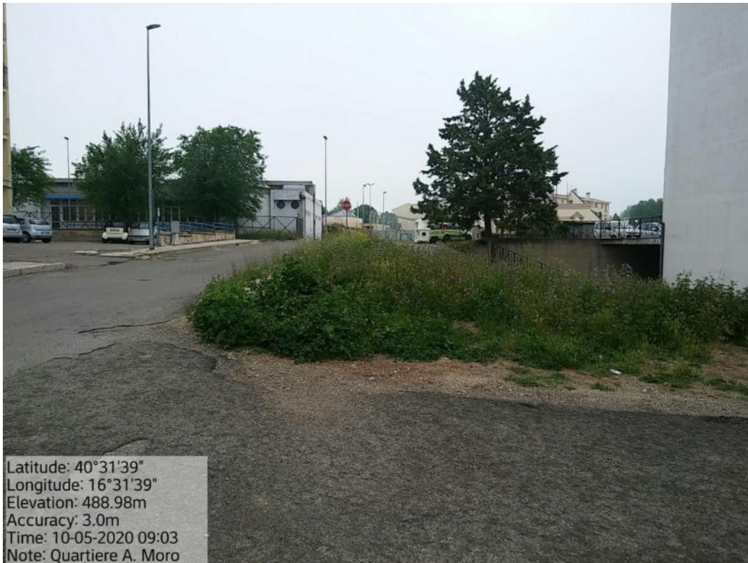
Int. 2.1.1 Loc. Pomarico – Quartiere Aldo Moro – Verde urbano e Periurbano