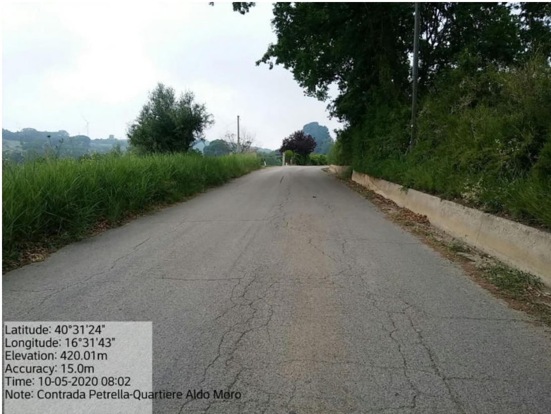
Int. 5.1.3 Loc. Strada Com.le Pomarico-C.da Petrella-Quartiere A. Moro - Decespugliamento Scarpate stradali