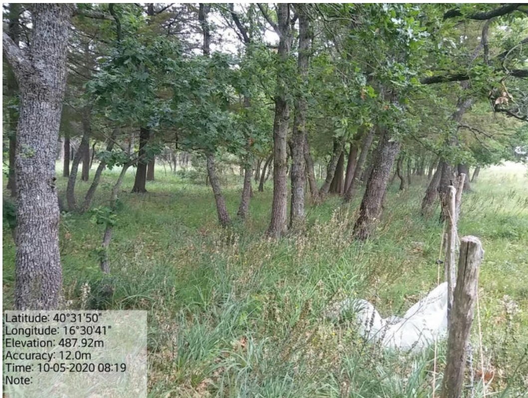
Int. 1.1.1 Loc. Bosco Manferrara – Manutenzione di viale tagliafuoco