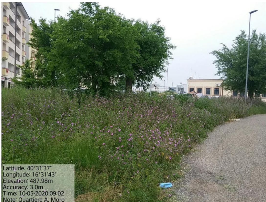
Int. 2.1.1 Loc. Pomarico – Quartiere Aldo Moro – Verde urbano e Periurbano