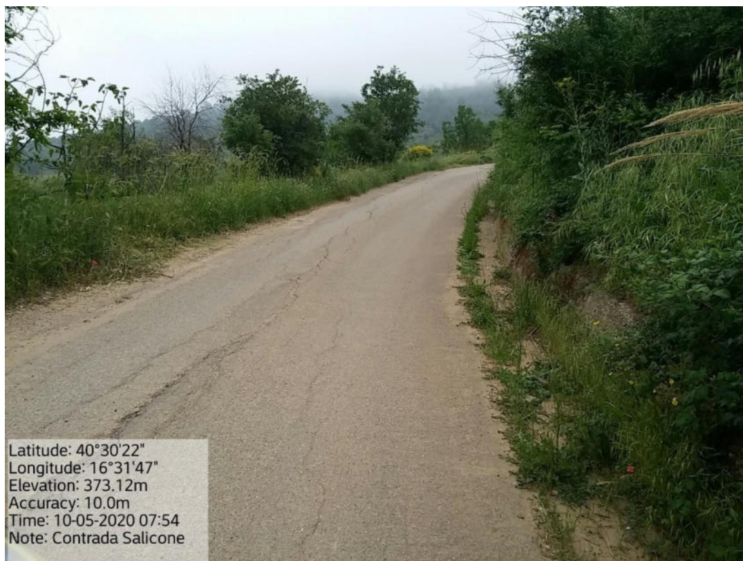
Int. 5.2.4 Loc. Strada Comunale da S.P. 24-Contrada Salicone – Pulizia cunette