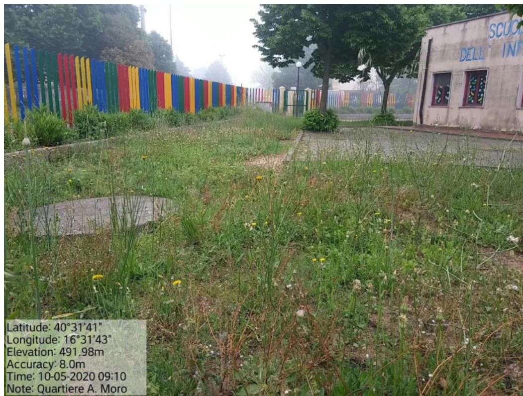
Int. 2.1.1 Loc. Pomarico – Quartiere Aldo Moro - Scuola Materna – Verde urbano e Periurbano