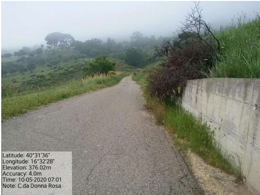
Int. 5.2.1 Loc. Strada Comunale Pomarico-Contrada Donna Rosa - Pulizia cunette