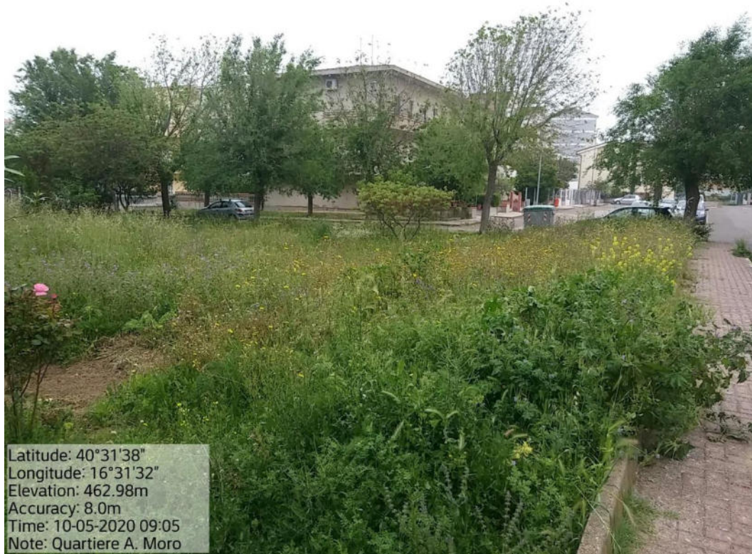
Int. 2.1.1 Loc. Pomarico – Quartiere Aldo Moro – Verde urbano e Periurbano