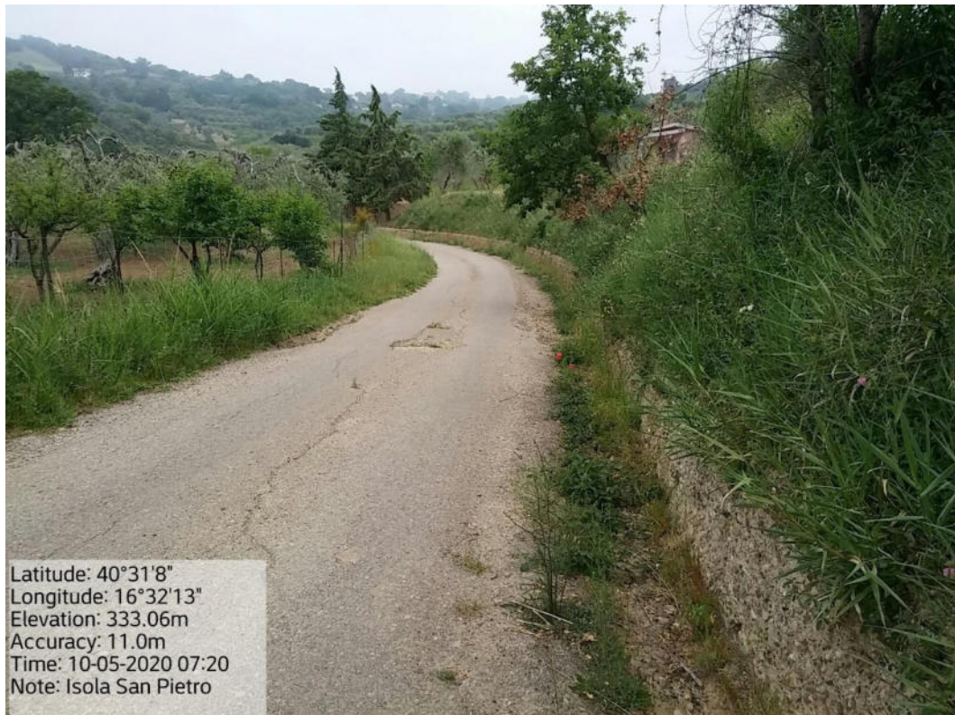
Int. 5.2.2 Loc. Strada Comunale Pomarico-Isola S. Pietro - Pulizia cunette