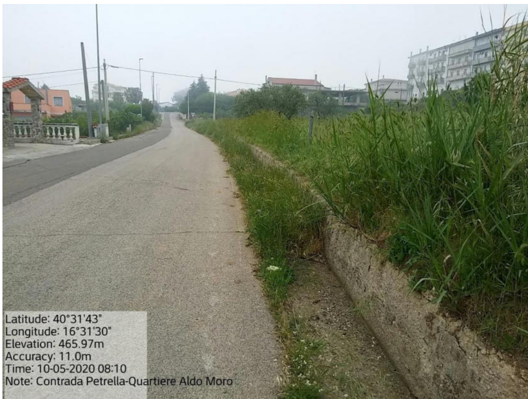
Int. 5.2.3 Loc. Strada Com.le Pomarico-C.da Petrella-Quartiere A. Moro – Pulizia cunette