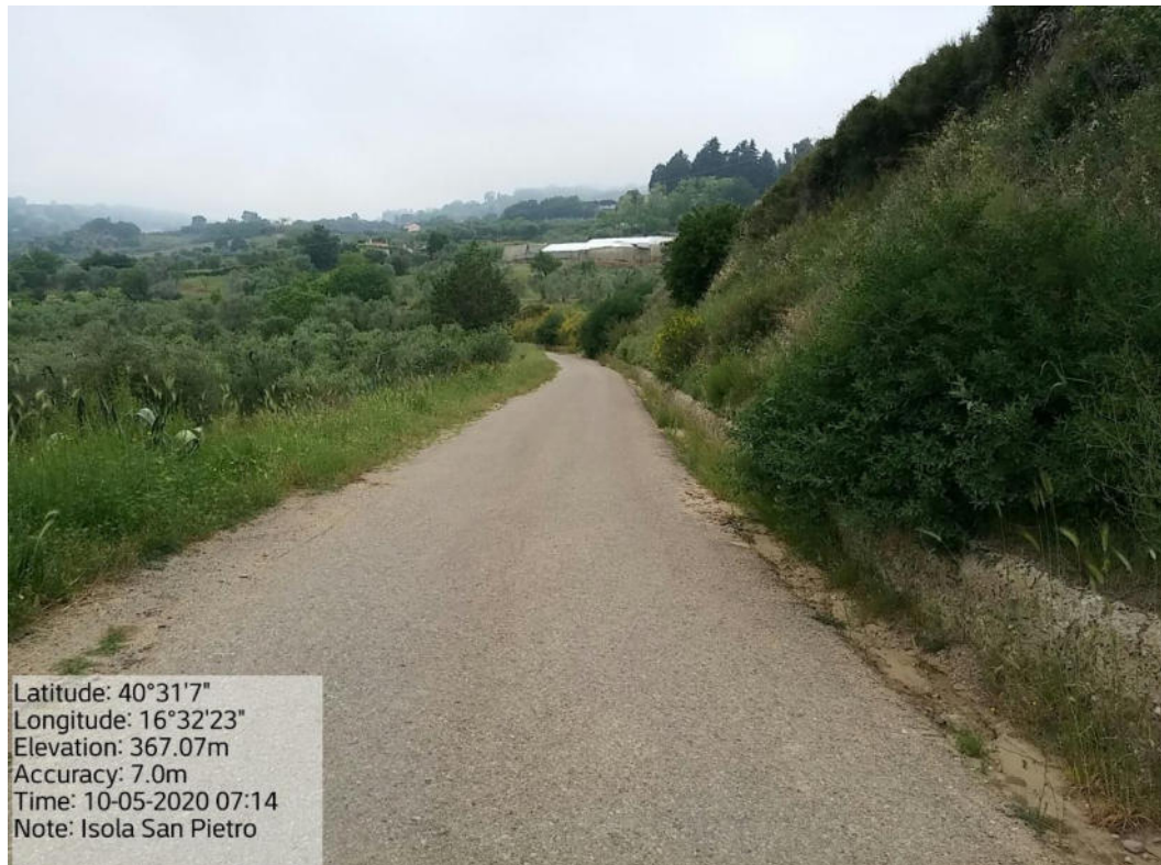
Int. 5.1.2 Loc. Strada Comunale Pomarico-Isola S. Pietro - Decespugliamento Scarpate stradali