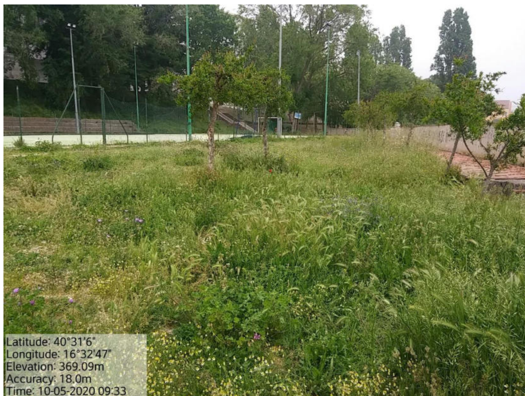
Int. 2.1.1 Loc. Pomarico – Campo di calcetto – Verde urbano e Periurbano