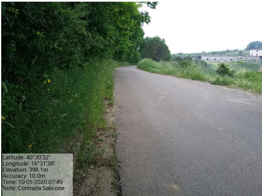
Int. 5.1.4 Loc. Strada Comunale da S.P. 24-Contrada Salicone - Decespugliamento Scarpate stradali