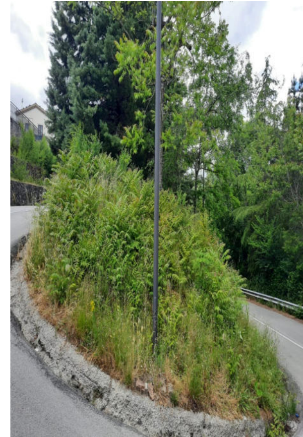
FOTO 6 - INT. 5.1.1__LOC. Strade Comunali