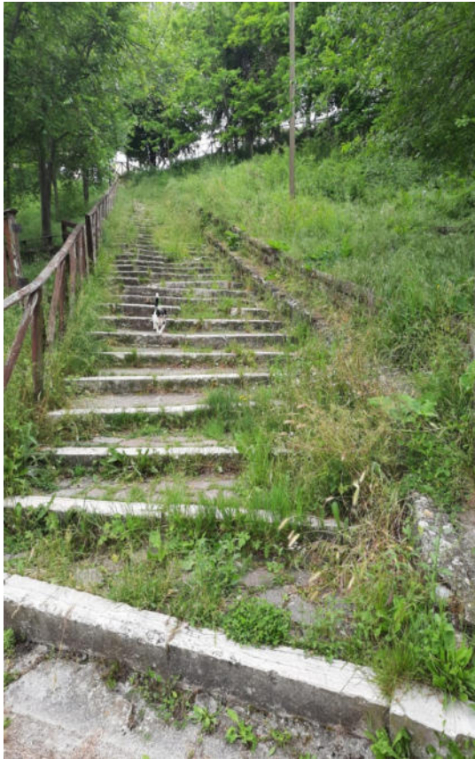
FOTO 4 - INT. 2.1.1_LOC. Verde Pubblico