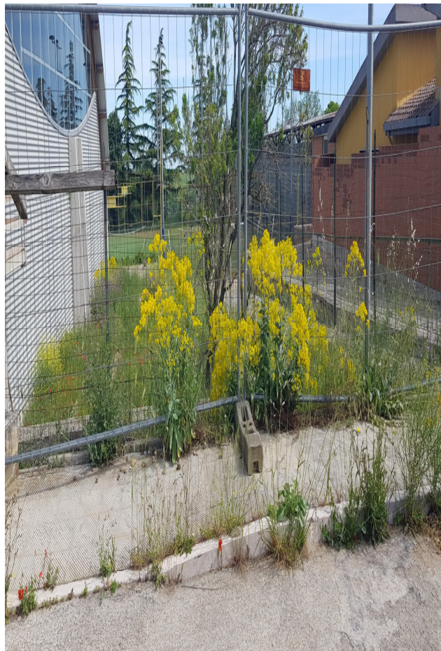
Verde pubblico NP02