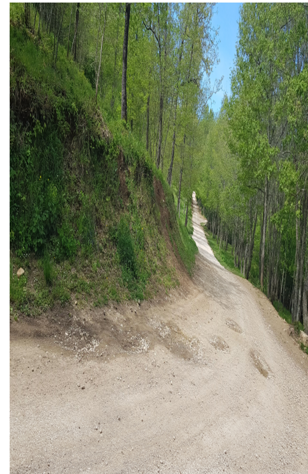
Manutenzione pista forestale – Loc. Nocellaro I.03.008.01