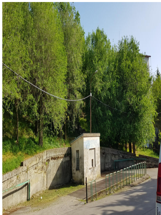
Verde pubblico NP02