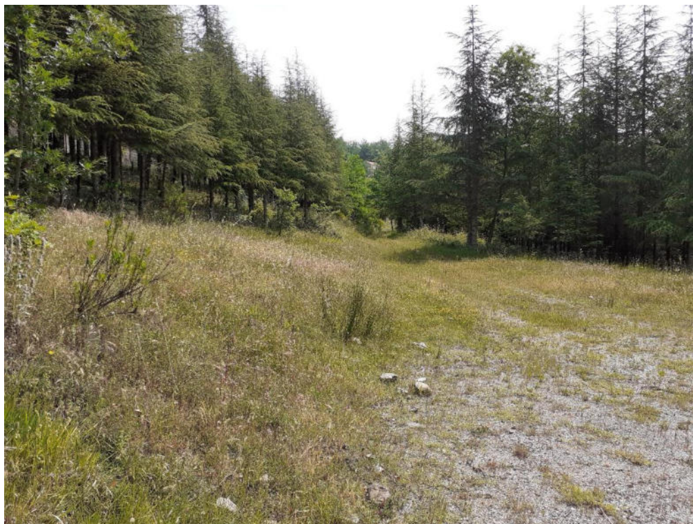
Int. 1.1.2 Loc. Malboschetto 2