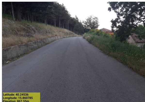
Manutenzione verde urbano - Foto1