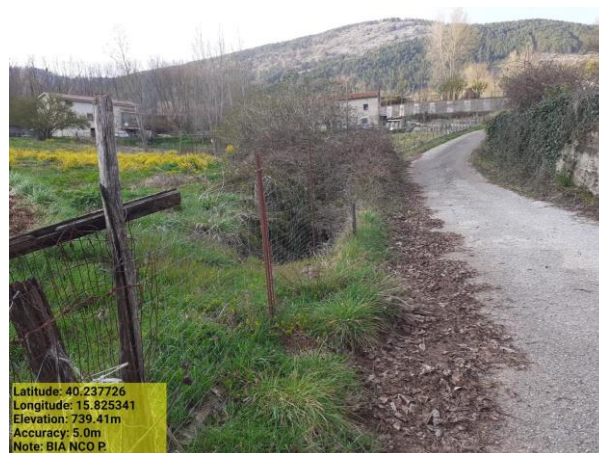
Missione 6.1.2.1 ripristino argini - Foto5 Missione 6.1.3.1 manutenzione reticolo idrografico - Foto6