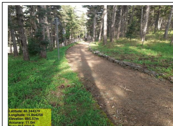
Missione 6.1.4 manutenzione reticolo idrografico - Foto11 Missione 4.2.4 manutenzione pista - Foto 12