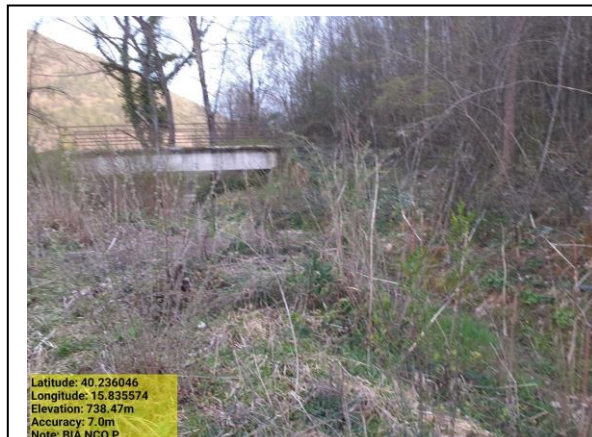
Missione 5.1.1 decespugliamento area boscata – Foto 3 Missione 6.1.1 manutenzione reticolo idrografico – Foto 4