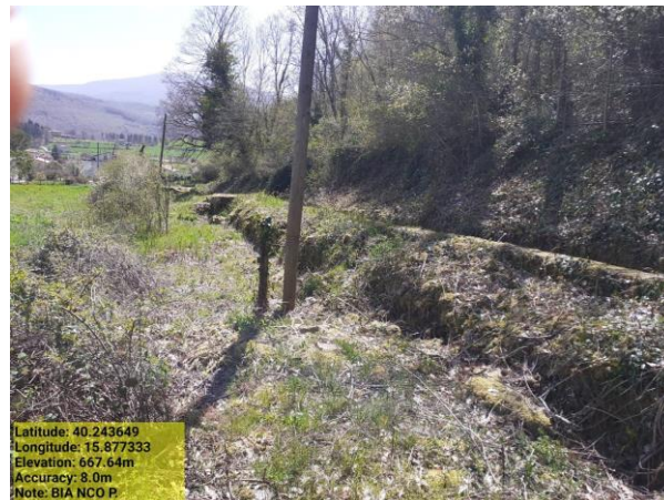
Missione 6.1.1 manutenzione reticolo idrografico - Foto 9