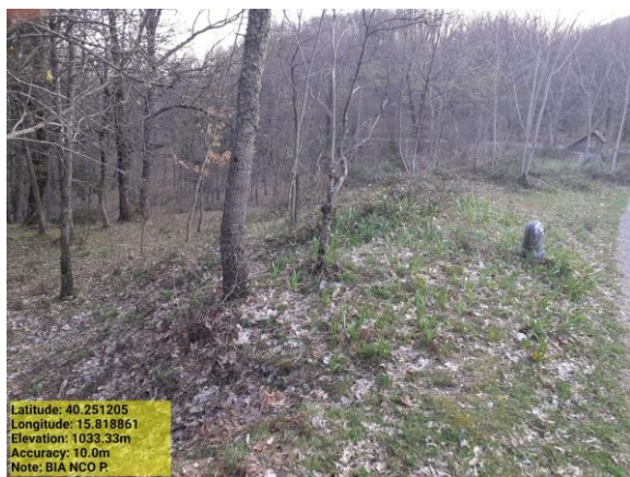
Missione 1.2.1 manutenzione fascia - Foto2