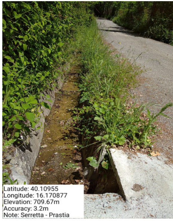
Int. 6.2.2 – Canalette – Prastia – Foto 1