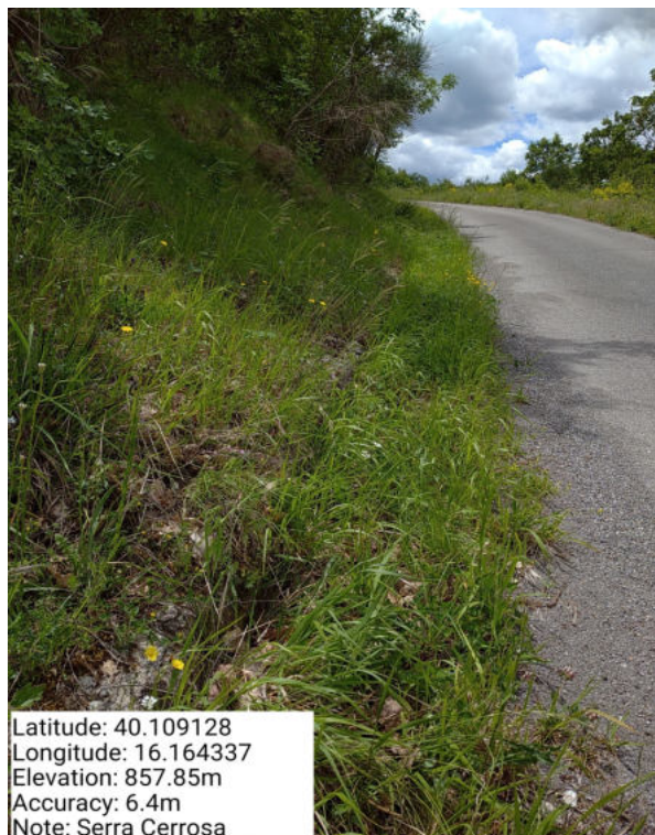
Int. 1.1.1 – Serra Cerrosa – Foto 1