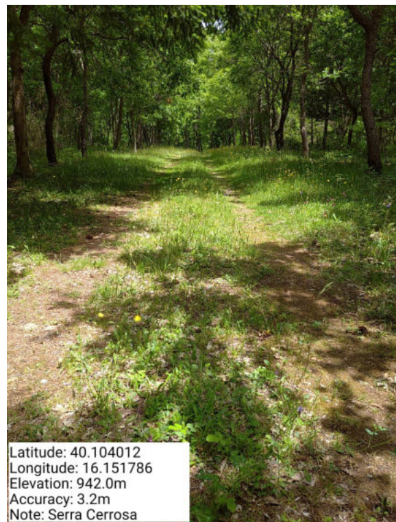
Int. 1.1.3 – Serra Cerrosa - Foto 1