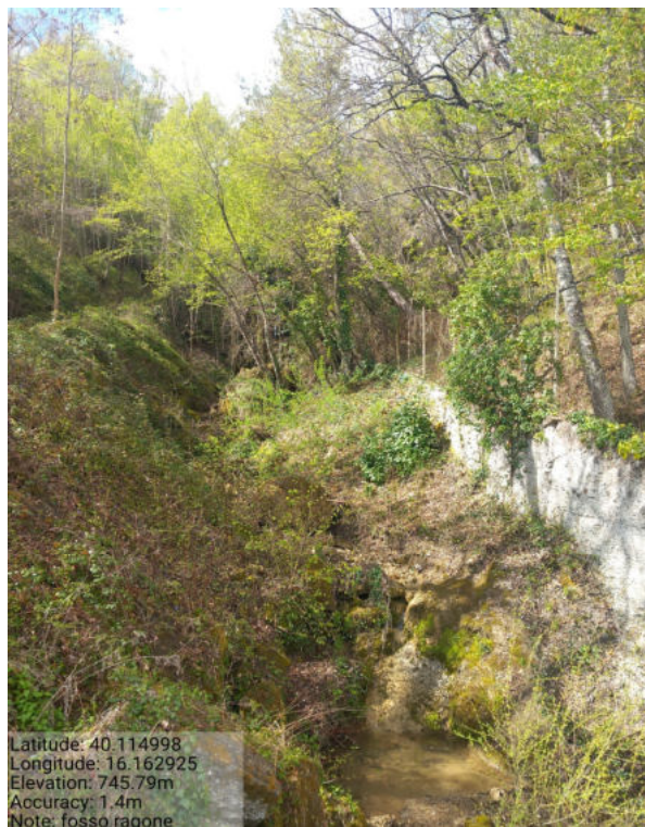
Int. 6.1.1 – Fosso Ragone – Foto 1