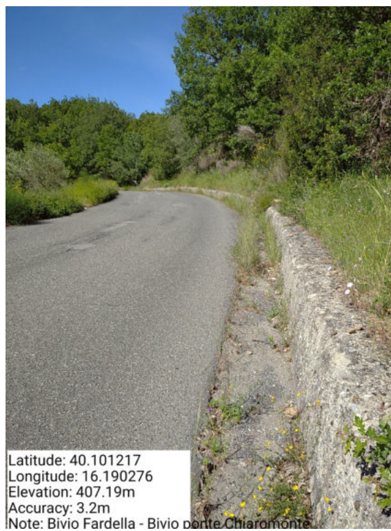
Int. 6.3.19–Bivio Fardella-Bivio Ponte chiaromonte-Foto 1