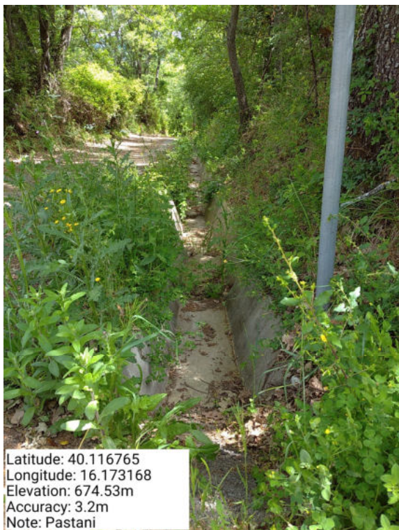
Int. 6.2.3 – Canalette Pastani - Foto 1