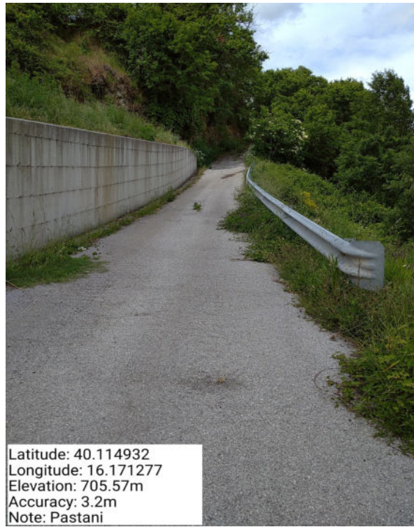
Int. 6.3.10 – Pastani – Foto 1