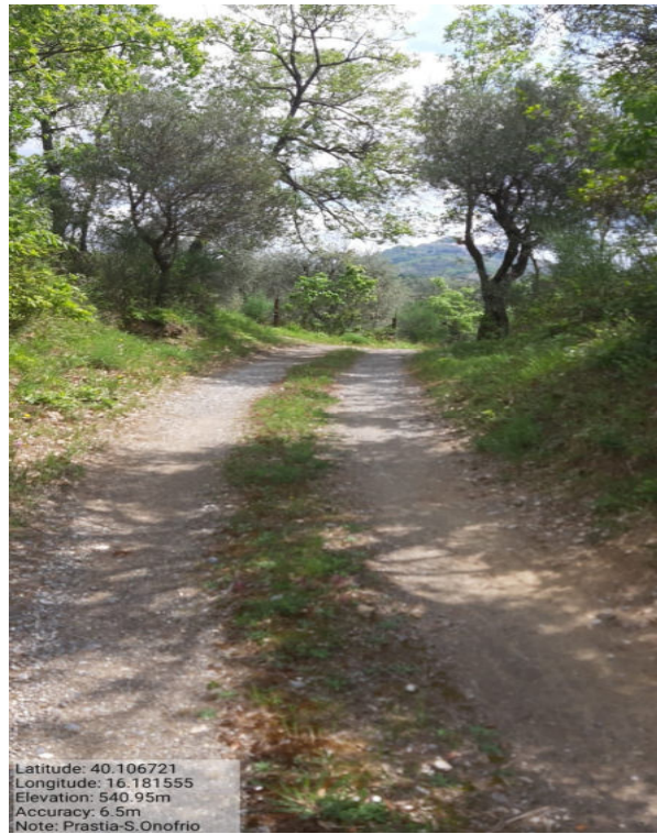
Int. 6.3.15 – Prastia S.Onofrio – Foto 1