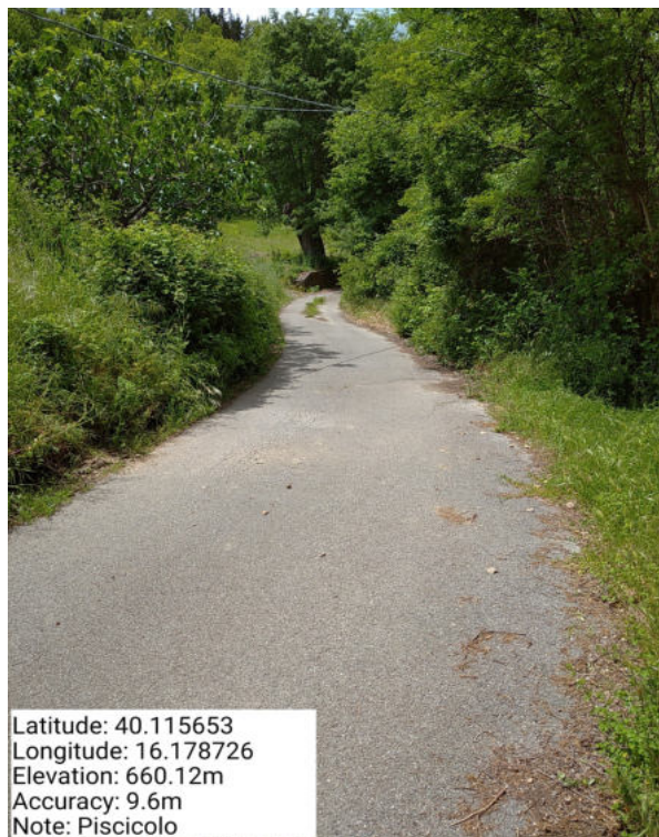
Int. 6.3.9 – Piscicolo – Foto 1