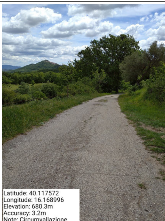
Int. 6.3.8 – Circonvallazione - Foto 1