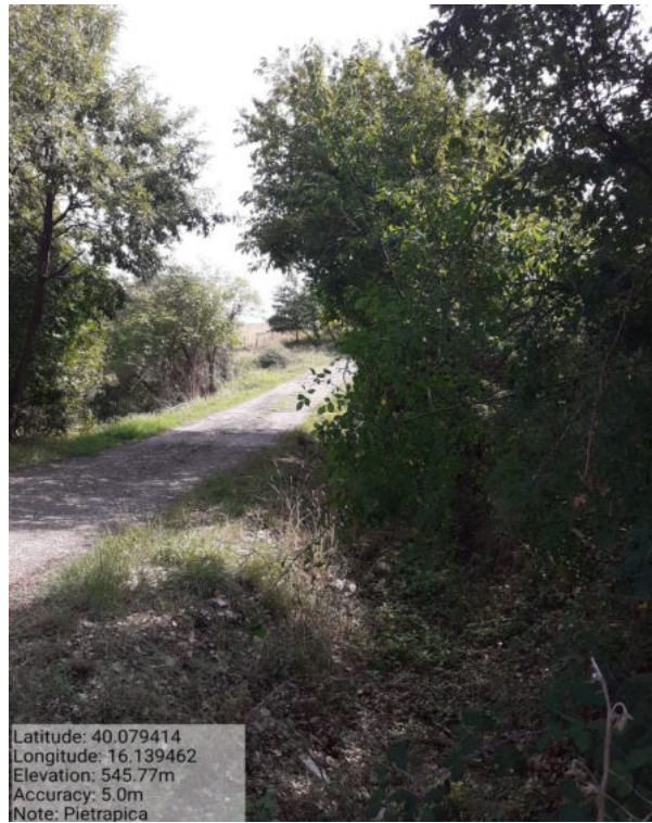
Int. 6.3.6 – Pietrapica – Foto 1