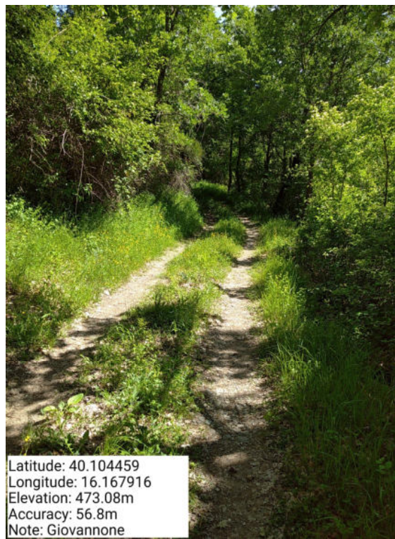
Int. 6.3.7 – Giovannone - Foto 1