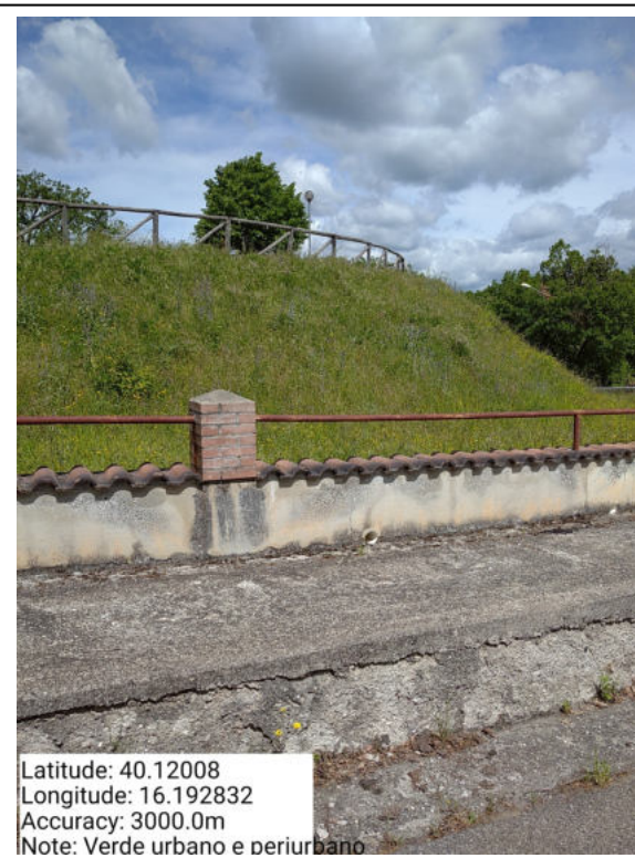
Int. 2.1.1 – Verde Urbano e Periurbano - Foto 2