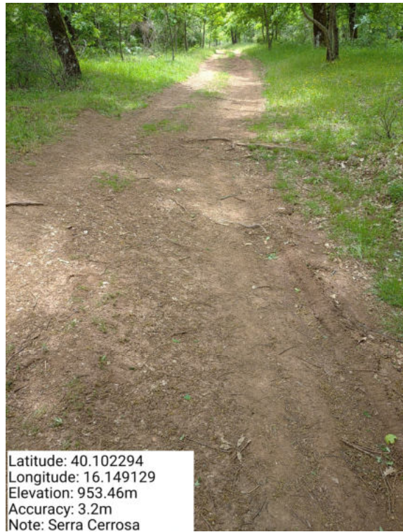
Int. 1.1.2 – Serra Cerrosa Belvedere – Foto 1