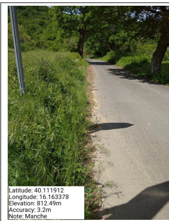
Int. 6.3.12 – Manche - Foto 1