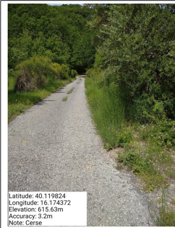
Int. 6.3.11 – Cerse - Foto 1