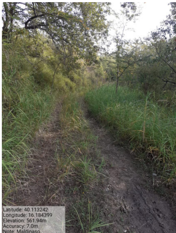
Int. 6.3.14 – Maldinaso – Foto 1