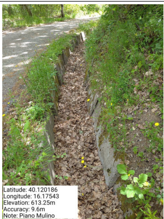
Int. 6.2.4 – Canalette Piano Mulino - Foto 1