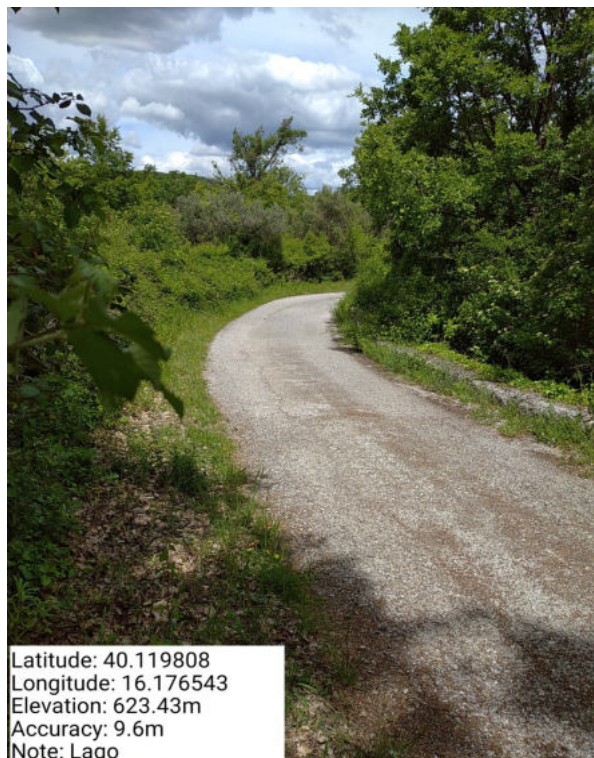
Int. 6.3.5 – Lago – Foto 1