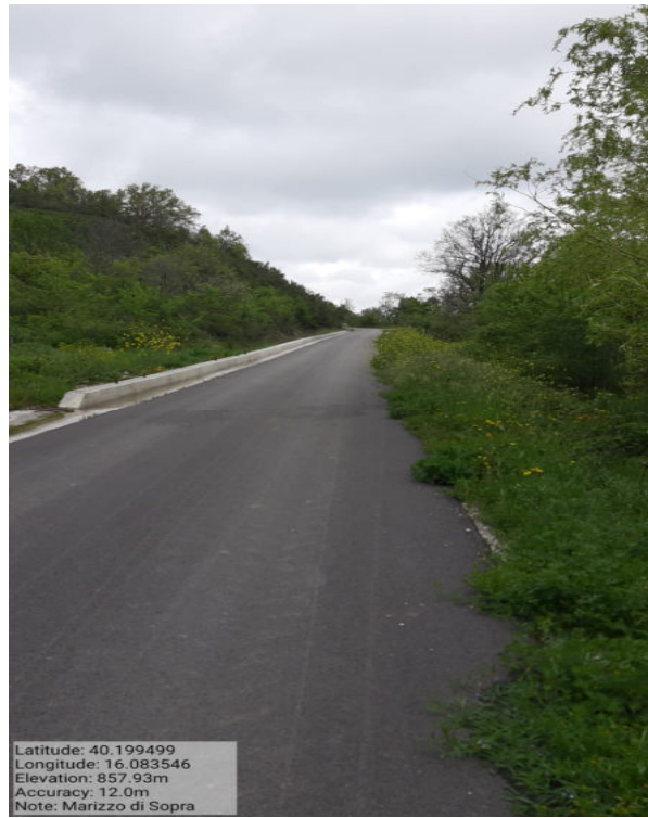
Int. 6.3.2 – Marizzo di Sopra - Foto 1