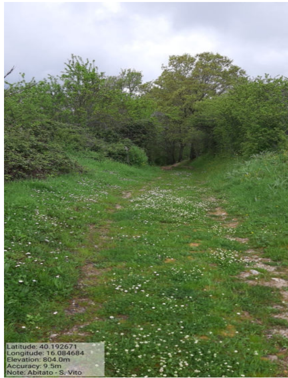
Int. 4.3.1 – Abitato San Vito – Foto 1