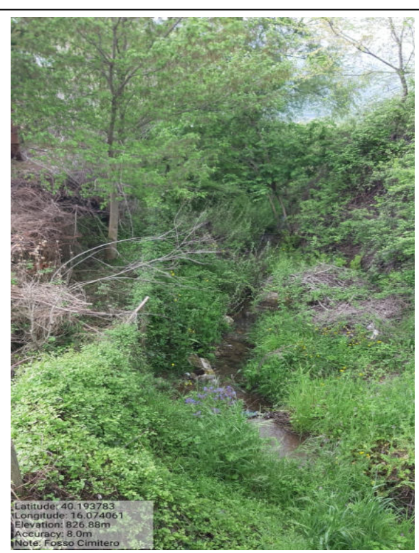
int. 6.1.2 – Fosso Cimitero – Foto 1