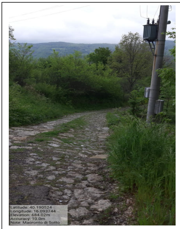
Int. 6.3.3 – Marizzo di Sotto – Foto 1