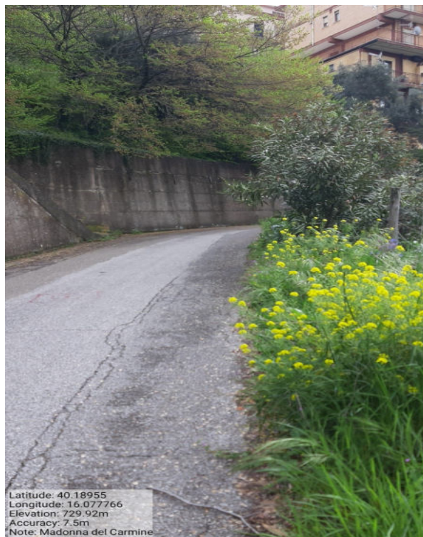
Int. 6.3.1 - Madonna del Carmine - Foto 1