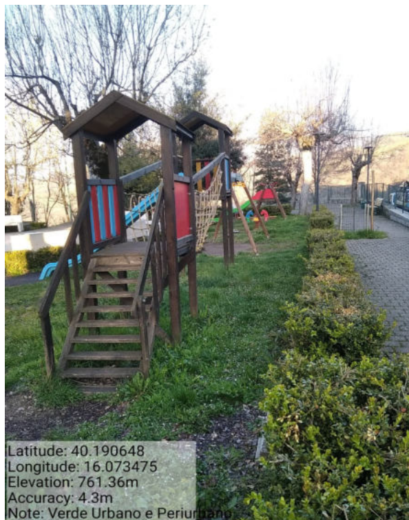
Int. 2.1.1- Verde Urbano e Periurbano - Foto 1