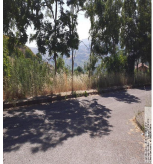
Int. 2.1.4- Foto 6