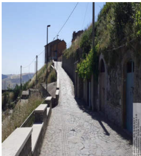
Int. 2.1.2 - Foto1