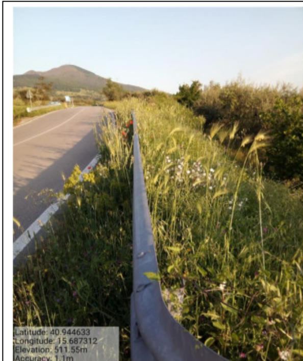
Int. 6.3.4.1/2 – Foto 7