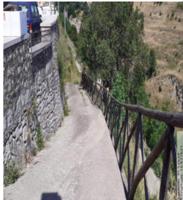
Int. 2.1.2 - Foto 2