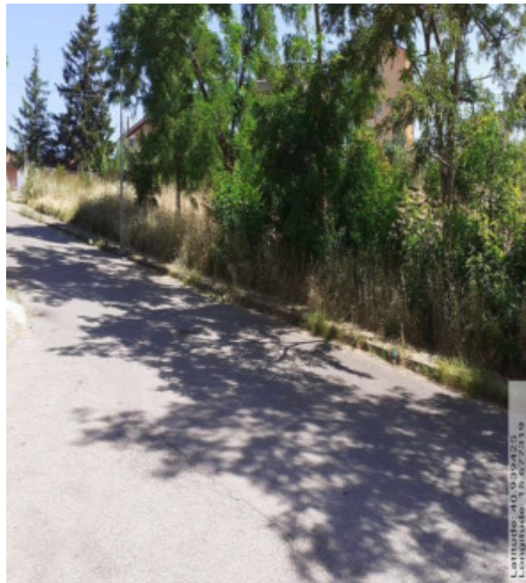
Int. 2.1.4 - Foto5