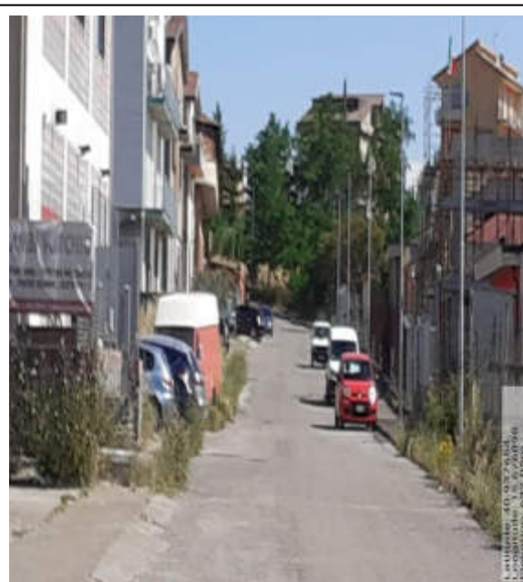
Int.2.1.4 - Foto 4