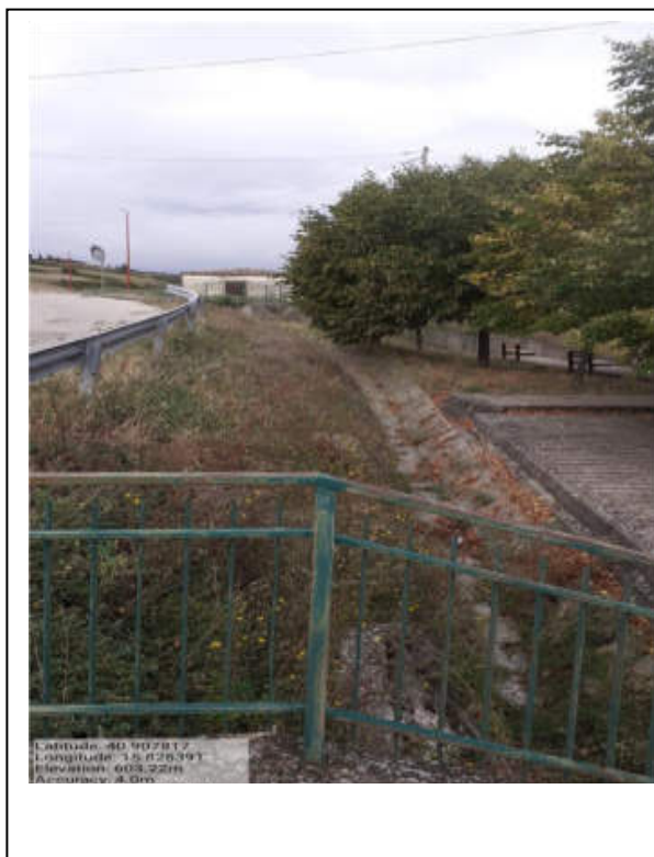
Int. 2.1.1 – Foto 3