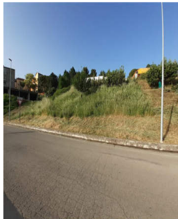
Int.2.1.1. - Foto 2