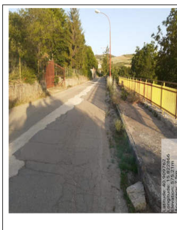
Int. 6.3.1.1 Foto 4