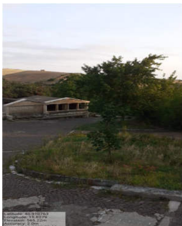
Int. 2.1.1- Foto1