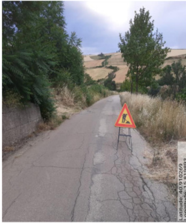
Int. 6.3.3.2 - Foto 5