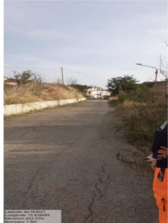
Int. 6.3.5.2 - Foto 6